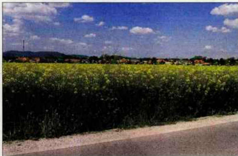
Čebelarji naj čebele umaknejo iz bližine polj oljne ogrščice.