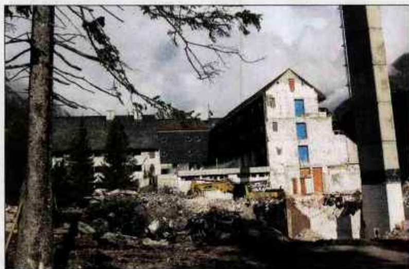
▶ 4. stran Stari hotel Špik so že porušili.

Proti takšnim načrtom se je v sredo opredelil tudi svet KS Rute, Gozd-Martuljek in Srednji vrh, ki meni, da je tako velika gradnja prevelik poseg.