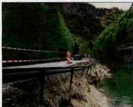
V Bohinju je prednostna naloga obnova ceste skozi Sotesko.