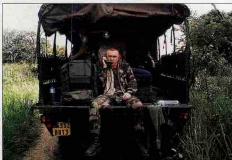
V Centralnoafriški republiki leta 2005

"Prepričan sem, da v Legiji to tudi preverijo. Mednarodnemu teroristu, zločincu, nekomu, ki bo mogoče sam imel celo občutek, da ga bo Legija sprejela prav zato, ker beži pred zakonom svoje države in ga s tem zaščitila, bodo njena vrata danes zagotovo ostala zaprta. Sam zagotovo nisem bežal pred policijo in prijatelji iz Maribora, s katerim sva šla skupaj v legijo, tudi ne. Zatorej, ne vem, zakaj bi imeli občutek nelagodja pred mano."