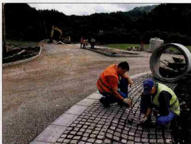
Križišče v Zmincu gradijo, obvoznica še čaka na gradbeno dovoljenje.

Kljub nasprotovanjem je naložbenikom uspelo pridobiti večino zemljišč na trasi obvoznice, zataknilo se je pri dveh, za katere je stekel postopek razlastitve. Decembra lani je upravna enota izdala gradbeno dovoljenje za prvo fazo Poljanske obvoznice (na odseku od Ljubljanske ceste do predora pod Stenom). Tri mesece kasneje je ministrstvo za okolje in prostor gradbeno dovoljenje razveljavilo in vrnilo upravni enoti v ponovno obravnavo. Kaj to