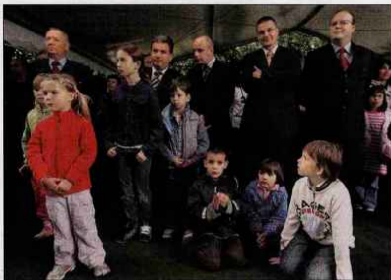
V sredo so hotel Savica tudi uradno odprli.