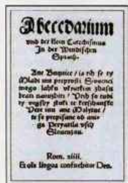
Naslovnica Trubarjevega Abecednika, 1550

Sledi vedenje v šoli. "Ko pride učenec v šolo, naj gre takoj na svoje mesto, ki mu ga je določil učitelj, in naj ga ne zapusti, če ga ne prisili k temu nujen razlog ali učiteljev ukaz. Če mora učenec zapustiti svoj prostor, naj se to zgodi z učiteljevim dovoljenjem; prosi pa naj ga za dovoljenje tako, da prej pove določen latinski izrek. Ko dobi dovoljenje za izhod, naj se čimprej vrne in naj ne ubija časa z neumnimi šalami