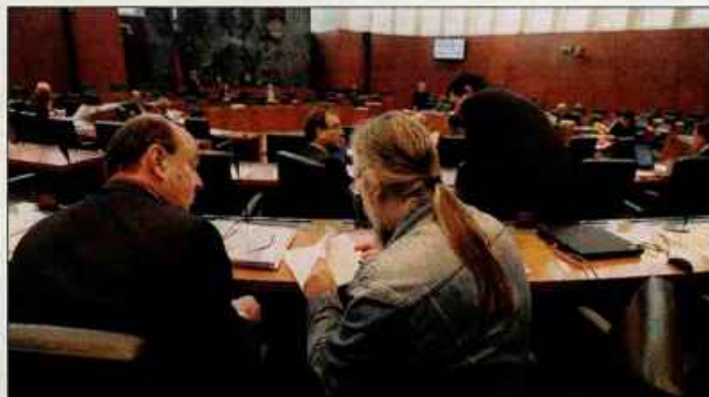
Opozicijski poslanci so kazenskemu zakoniku očitali preveliko represivnost.

Ljubljana - Ob ponovnem glasovanju sta bila oba sprejeta. Novi kazenski zakonik med drugim uzakonja možnost dosmrtnega zapora za najhujša kazniva dejanja, genocid, hudodelstva zoper človečnost in vojna hudodelstva. Dosmrtna kazen pa bo lahko doletela tudi storilce naklepnega umora. Novi kazenski zakonik je strožji tudi do kaznivih dejanj zoper spolno nedotakljivost mladoletnikov, predvideva pa tudi možnost vzpostavitve evidence pedofilov. Kazenski zakonik vsebuje tudi več novih oblik kaznivih dejanj, povezanih z varstvom pravic delavcev: mobbing ali šikaniranje na delovnem mestu, preprečevanje delodajalcev, da bi delavke v času zaposlitve zanosile, delo na črno. Državni svet je veto izglasoval zato, ker ocenjuje, da novi kazenski zakonik predstavlja nepotrebno in nedogovorjeno reformo kazenskega prava, sprejet je bil brez soglasja