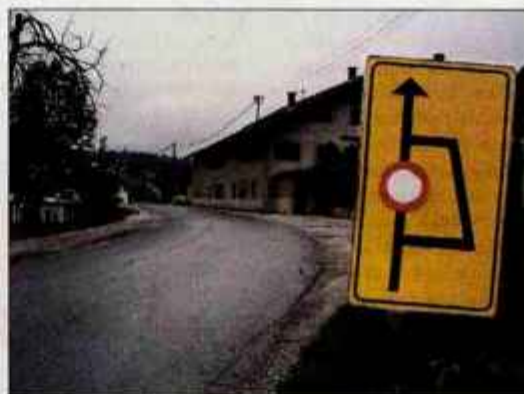
Na Bistrici je obvoz zaradi obnove mostu, od ponedeljka pa bo zaprta cesta od gramoznice nad vasjo proti Podbrezjam.

"Na klanecu od spomenika do naselja Bistrica je bilo cestišče zelo slabo. Tam bo Cestno podjetje Kranj saniralo globinske poškodbe, zamenjalo robnike, utrdilo cestišče in položilo nov asfalt. Dela bodo končana do 7. junija, ko bo spet stekel promet po tej državni cesti. Že nekaj časa poteka obnova mostu na Bistrici, ki naj bi jo končali predvidoma