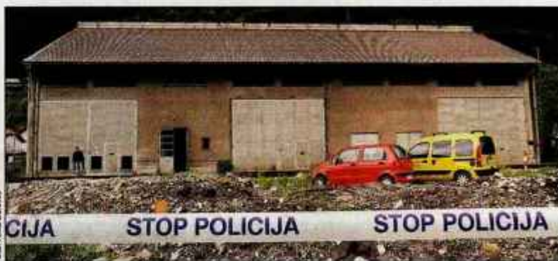
Tragična nesreča se je zgodila v transformatorski postaji na Cesti železarjev na Jesenicah.

Hrušičan in dve leti starejši Jeseničan, oba zaposlena v jeseniškem podjetju Enos energetika, sta tega dne prišla v transformatorsko postajo, da zamenjata dotrajan izolator, ki ga je dan prej odkril njun delovodja. Kot so ugotovili kriminalisti, delavca pred za-