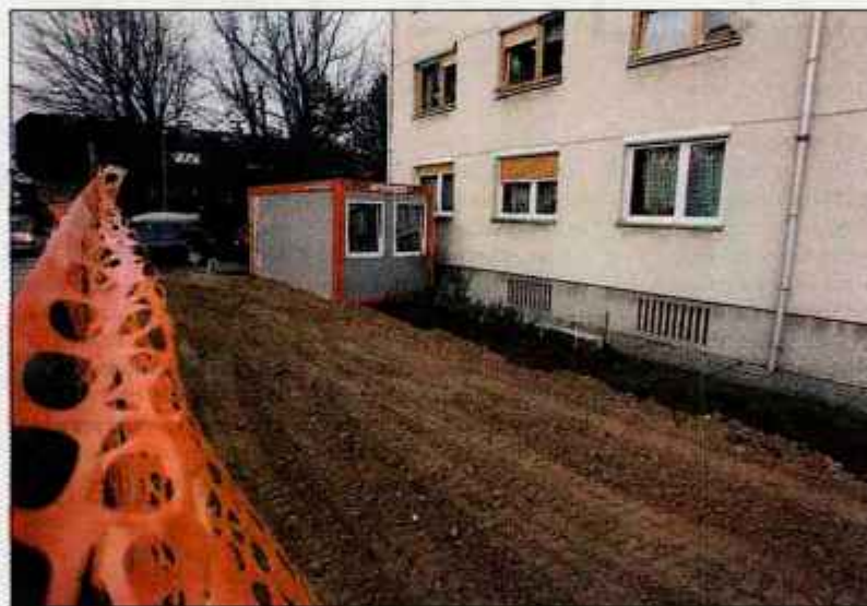
Gradnja v Mrakovi ulici se je že začela. Ko je naša fotografinja to fotografirala, so ji delavci z gradbišča to poskušali preprečiti.

ce, in stanovalcem svetloval pritožbo. Pri upravni enoti pa trdijo, da so gradbeno dovoljenje izdali v skladu z vsemi predpisi s področja graditve objektov. "V upravni postopek so bili kot stranke vključeni vsi lastniki zemljišč, na katera je segalo vplivno območje, ki ga je kot strokovno odgovoren določil projektant v projektu za pridobitev gradbenega dovoljenja," so med drugim zapisali v pismu, ki ga objavljamo na tej strani levo spodaj.