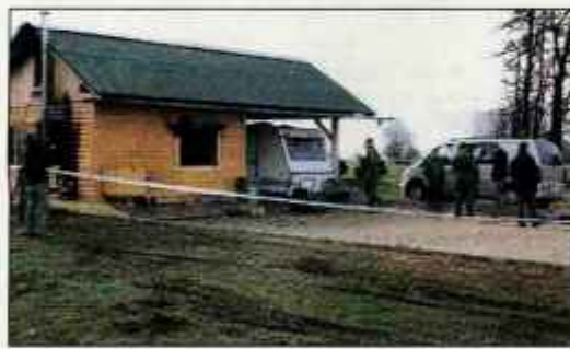
Kriminalisti so si pogorišče ogledali včeraj.

Kriminalisti sektorja kriminalistične policije iz Kranja so pri včerajšnjem ogledu pogorišča ugotovili, da je do požara prišlo v pritličju, v prostoru, kjer je stal štedilnik na drva. Zaradi kurjenja se je pregrela in vžgala lesena siena, ob kateri je stal štedilnik oziroma je bil prehod dimne tuljave skozi steno. Ogenj se je nato razširil po steni na druge dele objekta, zajel pa je tudi sobo v zgornjem nadstropju, v kateri je Jakopič tedaj po vsej verjetnosti spal. Po prvih ugotovitvah je umrl zaradi zadušitve z ogljikovim monoksidom, utrpel pa je tudi opekline. V požaru je nastalo za deset tisoč evrov škode.