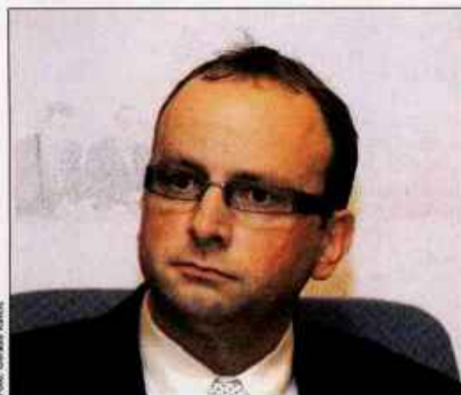
Cilj novele zakona o cestnem prometu je zmanjšati število najhujših prometnih nesreč, pravi minister Radovan Žerjav

Poglejmo nekaj podrobnosti: vozniki, ki bodo prekorčili najvišjo dovoljeno hitrost v naselju za več 30 kilometrov na uro, bodo tako po novem kaznovani z globo v višini najmanj tisoč evrov, desetimi kazenskimi točkami in prepovedjo vožnje motornih vozil. Podobna kazen čaka voznike, ki bi imeli v litru izdihanega zraka več kot 0,52 miligram alkohola. Kaznovani bodo z 800 evri globe, desetimi kazenskimi točkami in odvzemu dovoljenja. V primeru, da ne bodo pripeti z varnostnim pasom, bo kazen po novem znašala 120 evrov, prav toliko tudi uporaba mobilnega telefona med vožnjo. Po novem bodo kaznovani tudi pešci, ki ne bodo upoštevali rdeče luči na semaforju. Novela uvaja tudi možnost pridržanja voznika zaradi najhujših prometnih prekrškov, ki so storjeni pod vplivom nedovoljenih substanc, predvsem alkohola. Za najhujše prekrške je kot sankcija za kršitelja