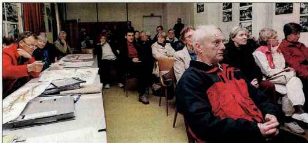
Na javni predstavitvi predlaganega prostorskega načrta.

"Le domnevam lahko, kdo je avtor očitnega ponaredka, žal pa mi je, da moramo v občini, kjer si želimo urediti normalne razmere za delo in smo tudi vse bliže dokončnim razgovorom o delitveni bilanci z Občino Bled, ukvarjati s takšnimi podtikanjem in zavajanjem. Ko bo preiskava končana, pa bom sklical tiškovno konferenco in javnost obvestil o rezultatih," je še dodal župan Torkar, ki je svetnike o dokumentu obvestil na zadnji seji gorjanskega občinskega sveta.