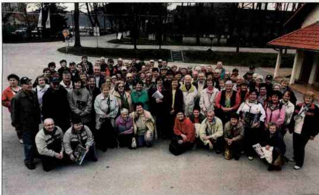
Izletniki pred muzejem slovenskega premogovništva v Velenju

milijona evrov in dvignila kakovost storitev. "Težko smo pričakovali objavo razpisa za dolgoročni najem Vile Bled in Pristave, saj smo želeli dolgoročno urediti odnose z lastnikom nepremičnin, in to na način, ki bi nam omogočal nadaljnji razvoj vrhunske turistične ponudbe in njeno širitev na sosednji objekt Pristava, ki propada," je zapisano v izjavi Save, ki se je na razpis skrbno pripravila. Presenečena je bila nad nekaterimi določili najemne pogodbe, ki bi povzročili za Savo veliko tveganje in cele možnost izgube dela investiranih sredstev. Na opozorila o neprimernosti določenih delov najemne pogodbe vlada ni odgovorila. "Izjemno smo bili tudi presenečeni, da nam Občina Bled kljub našemu zaprosilu ni izdala pisma podpore, čeprav nas podpirajo nekateri ključni nosilci razvoja na Bledu. Brez podpore občine bi bili Sava Hoteli Bled kljub morebitni najboljši oddani ponudbi in izkazani kakovosti v neenakopravnem položaju z morebitnimi konkurenti," je še zapisano v izjavi.