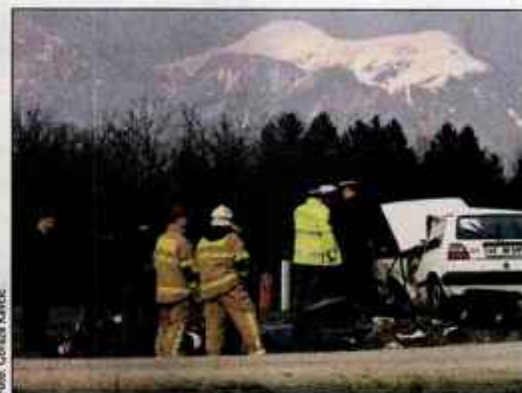
Silovito trčenje je bilo v torek usodno za tri Kranjčane.

fu z motornim kolesom pripejal 21-letni Kranjčan, ki mu kljub zaviranju v dolžini več kot petdeset metrov ni uspelo ustaviti 600-kubične Honda RR in je s prednjim delom silovito trčil v levi bok osebnega avtomobila. Po trčenju je osebni avtomobil obrnilo za 90 stopinj in je obstal na robu vozišča, voznik motornega kolesa in 23-letni sopotnik Braimi pa sta obležala na bližnjem travni-