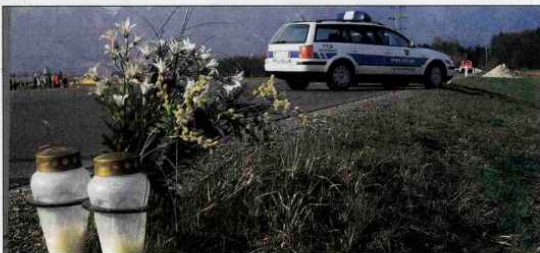
Dan po tem, ko se je v Kranju zgodila huda prometna nesreča s tremi smrtnimi žrtvami (na sliki), so poslanci državnega zbora sprejeli novelo zakona s poostrenimi kaznimi za večje prometne prekrške.