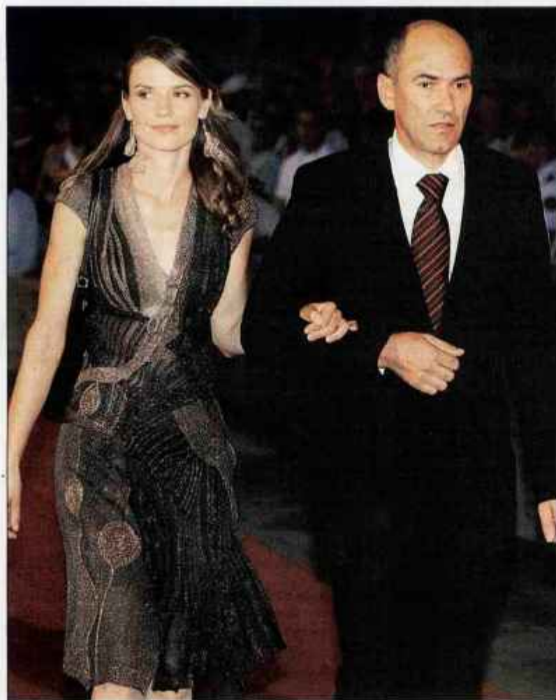
Zaročenca Urška Bačovnik in Janez Janša