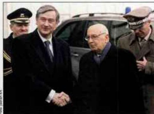
Predsednika Italije in Slovenije Giorgio Napolitano in Danilo Türk v Ljubljani