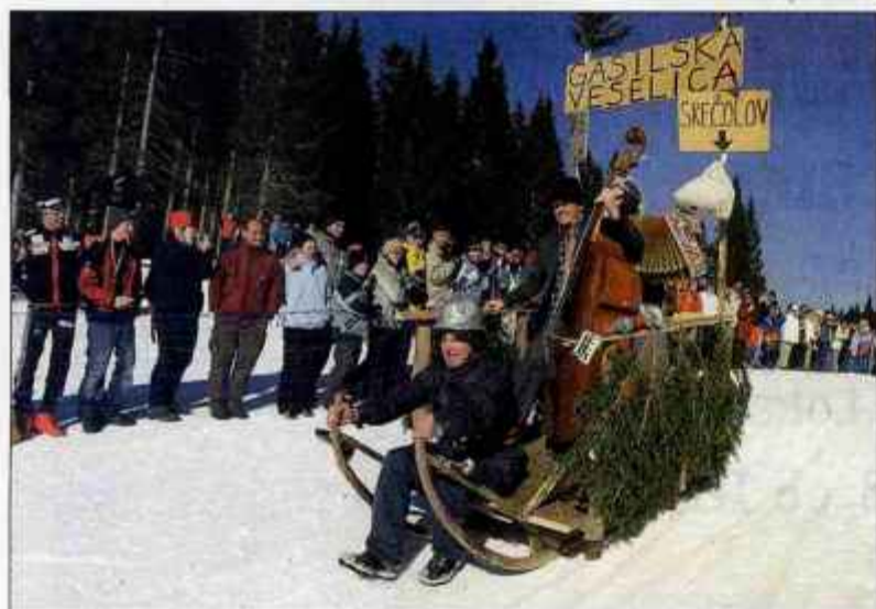
Eurosank bo na Pokljuki 24. februarja. Do takrat imate še dovolj časa za izdelavo atraktivnega vozila.

nine ni, prva nagrada pa znaša tisoč evrov, medtem ko bodo za mesta od 2. do 5. podeljene praktične nagrade. Poziv velja vsem, ki imate v sebi nekaj kreativne žilice in željo po družabnem tekmovanju. Prijave zbirajo vse do 24. februarja osebno pri organizatorju tekmovanja ali pisno na naslov: Športno društvo Pokljuka, Poslovna cona A 37, 4208 Šenčur. Informacije lahko dobite na telefonski številki 04/2791-920 ali 04/2791-900.