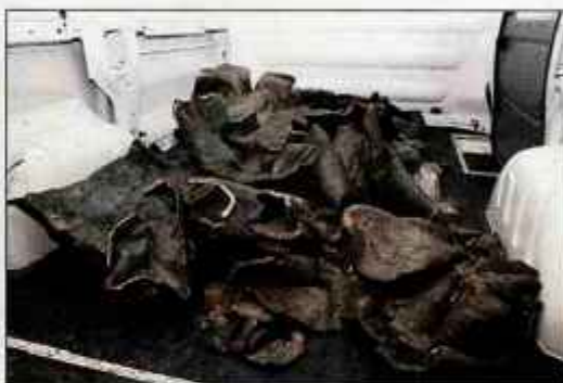
Ni še znano, ali bodo razrezane kipe zmogli sestaviti.