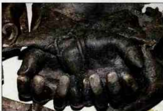
Kateremu kipu pripadata roki?

Jeseničane in bosanskega državljanca z bivališčem v Ljubljani bodo policisti ogradili storitve kaznivega dejanja poškodovanja ali uničenja stvari, ki so posebnega kulturnega in zgodovinskega pomena ali naravne znamenitosti, in jim grozi do osem let zapor. Preiskavo še nadaljujejo, zato lahko pričakujemo, da bodo ovdob podali tudi zoper 34-letnega Ljubljančana.