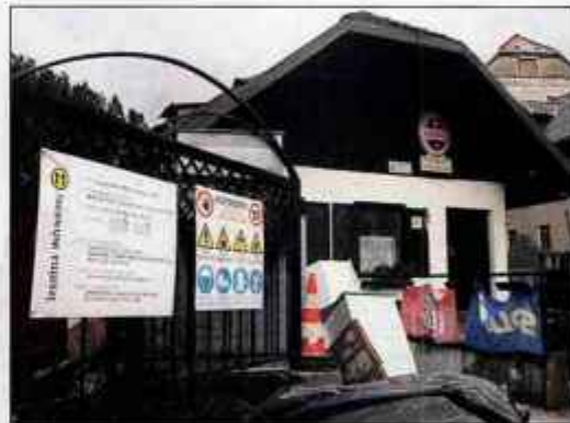
Obnova nekdanjega kina v Tržiču je razkrila, da strop ne more nositi stanovanj.

je nujno izprazniti stanovanja v nadstropju. Tam bo treba ponušiti stene, odstraniti tlake in izdelati nov strop na železnih profilih. Šele nato bo možno zapiranje stropa v dvorani, ki bi morala biti obnovljena po prvotnem načrtu že ta mesec. Če bodo februarja začeli obnovo nosilne plošče, predvidevamo končanje del v dvorani do maja letos. Za koliko se bo podražila šeststo tisoč evrov vredna obnova dvorane, bo znano konec januarja. Pričakujemo med 100 in 150 tisoč evrov stroškov, kar presega vrednost opreme. Prizadevamo si, da bi čim prej preselili dve štiričlanski družini in enega stanovalca iz treh stanovanj. Nadomestna stanovanja so v mestu, malo večja od sedanjih. Ob današnjem ogledu smo jim obljubili pomoč pri selitvi, zato pričakujemo dogovor z vsemi," je v sredo povedala Mateja Malovrh iz urada za gospodarstvo