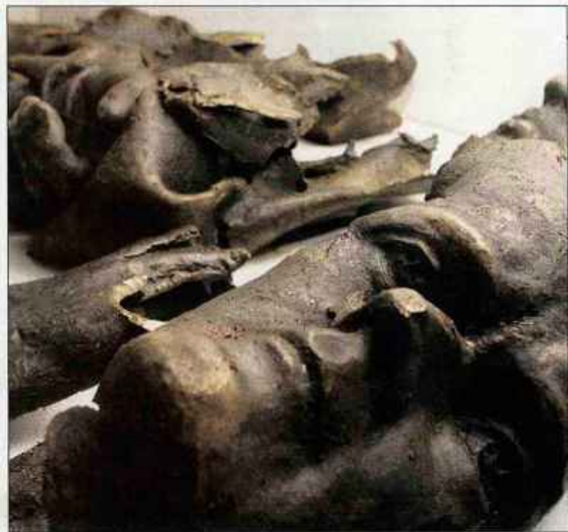
▶ 8. stran Razrezane bronaste kipe je policija včeraj našla na obrobju Ljubljane.