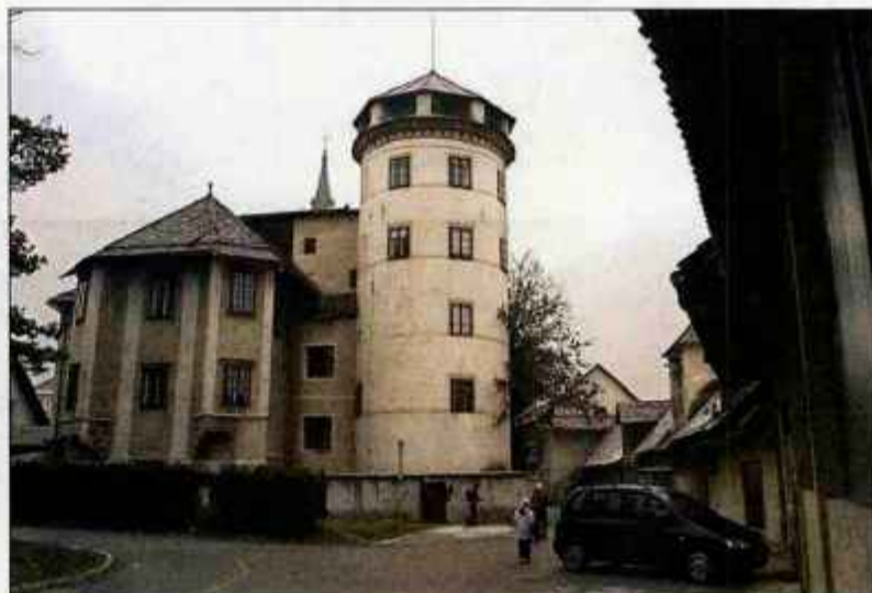
Kot kaže, s stolpa starološkega gradu še ni videti prav daleč.