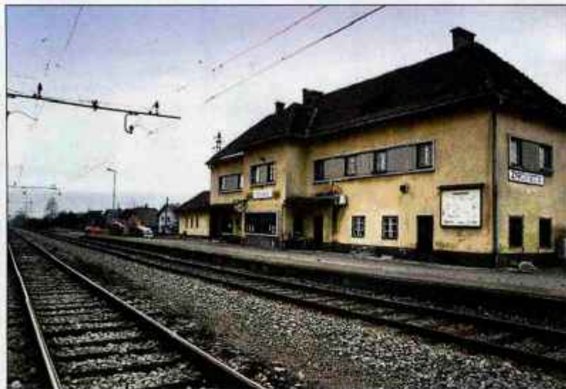
V Slovenskih železnicah ugotavljajo, da je železniška postaja v Žirovnici za njihove sedanje potrebe prevelika, zato iščejo potencialne najemnike, ki bi bili pripravljeni tudi investirati v objekt.

Občina od poletja namerava ob postaji urediti nekaj parkirnih mest. Doslej so namreč potniki puščali vozila na drugih bližnjih parkiriščih. "Slovenske železnice so ugo-