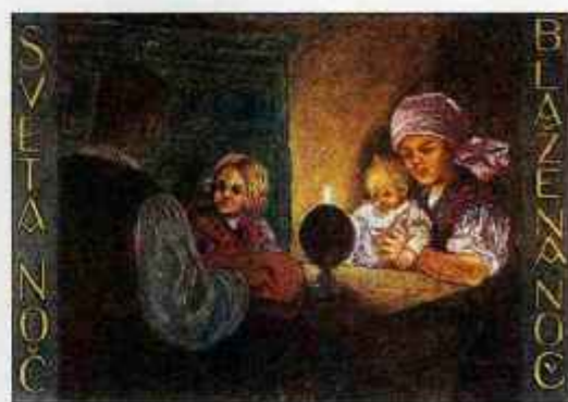
Sveta noč na razglednici Franja Kopača, pred 2. sv. vojno

Štefanovemu sledi 27. decembra Šentjanževo. "Ta dan je navaden delavnik, a vendar je nekak praznik, in sicer samo za posle. Oni posli namreč, ki menjajo svoje službe, se na Šentjanževo selijo k novim gospodarjem. (Na kmetih se pogodi posel z gospodarjem za celo leto in posel, ki med letom