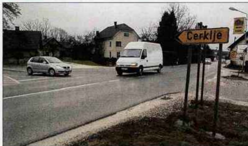
Krožišče na Spodnjem Brniku, na katerega domačini nestrno čakajo že nekaj let, bodo vendarle začeli graditi. Krožišče bo štirikrako, saj bo nanj priključena tudi cesta proti Vodici.