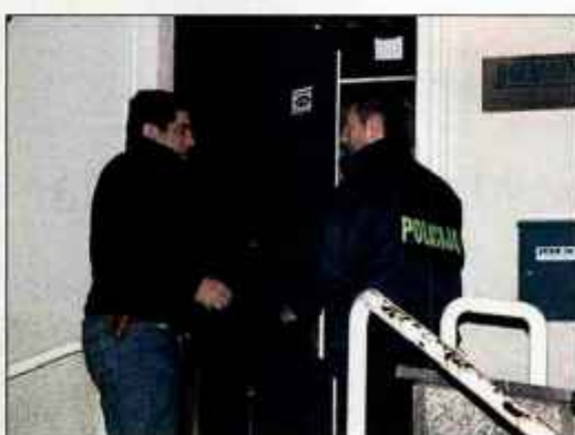
Komaj so gorenjski kriminalisti razrešili rop v Naklem in krajo kipov, že iščejo novega nepridiprava, ki je udaril na Jesenicah.

Storilca sta uslužbenki opisali kot mlajšega moškega starega okoli 30 let, temnejše polti, visokega približno 180 centimetrov. Oblečen je bil v modre hlače iz jeansa, sivo (morda bež) jopo oziroma zgornji del trenirke s kapuco, ki se zapenja na zadržgo. Na jopi je bil na prednjem delu daljši vstip napis. Čez jopo je imel oblečeno jakno temnejše barve. Čez obraz je imel črno ruto