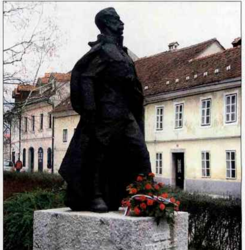
Kip Rudolfa Maistra v središču Kamnika še ni bil tarča nepridipravov.

Tudi v občini Domžale za svoje številne spomenike sicer zgledno skrbijo in jih redno obnavljajo, a za primer vandalizma ti niso zavarovani. "V Občini Domžale imamo izdelan Elaborat