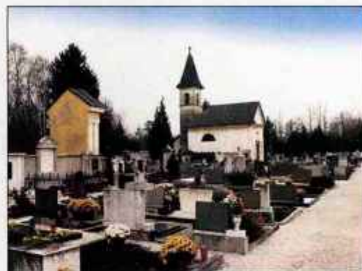
V radovljiški občini so velike razlike pri najemninah za grobove in cenah pokopaliških storitev.

vendar jim to prav zaradi omenjenih razlik doslej še ni uspelo. Medtem ko so za lani še potrdili cene, kot so jih predlagali upravljavci pokopališč, naj bi za letos dolo-