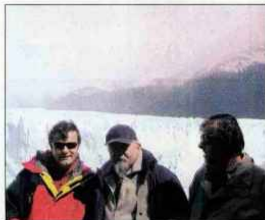
Na ledeniku Perito Moreno v Patagoniji