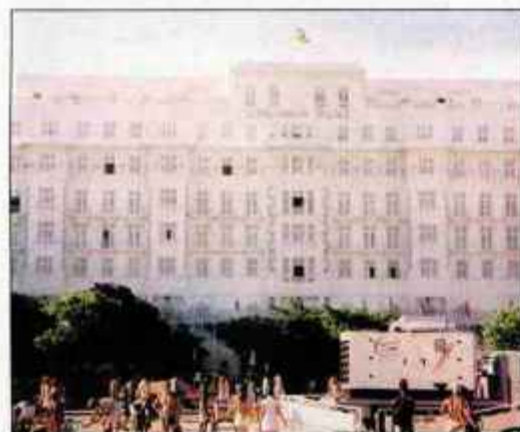
Razkošen hotel na Copacabani