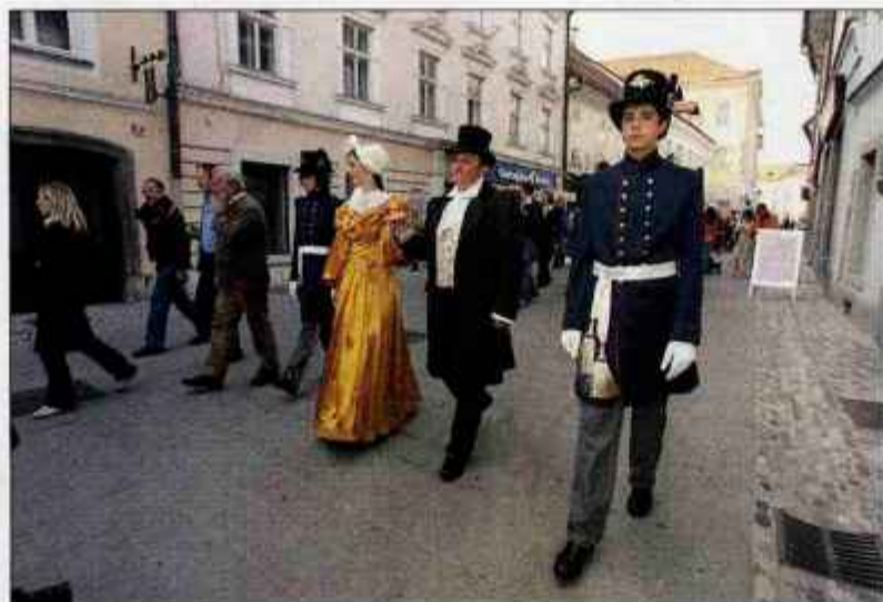
Spomin na Prešernove dni. Ta projekt se je v Kranju dobro prijel.