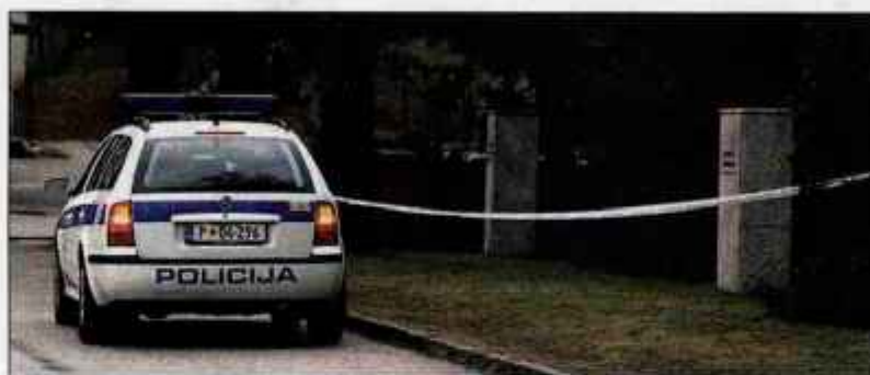
V Aleji slavnih rojakov v Zabreznici so tatovi v noči s sobote na nedeljo s podstavkov ukradli doprsna kipa Frana Saleškega Finžgarja in Janeza Jalna.