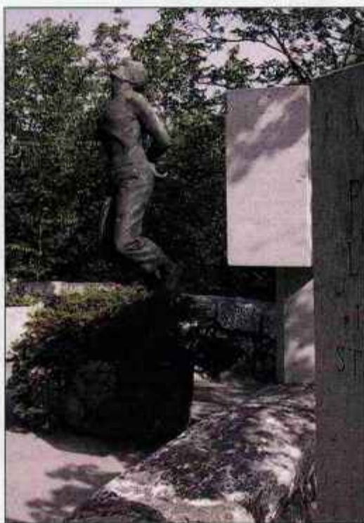
Tatovi so ukradli tudi kip talca v Mostah pri Žirovnici.