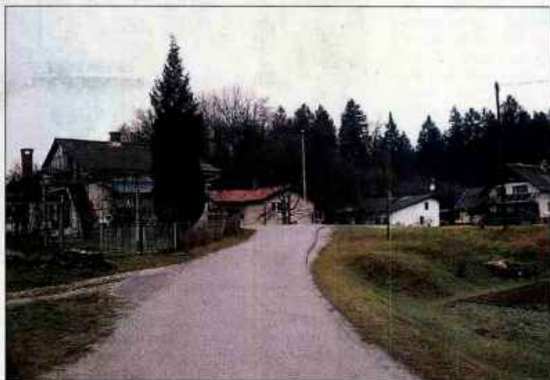
Predvidena lokacija čistilne naprave je v neposredni bližini naselja Gorenja vas-Reteče. Tamkajšnji prebivalci tej lokaciji nasprotujejo.