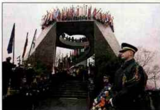
Spomenik v Dražgošah