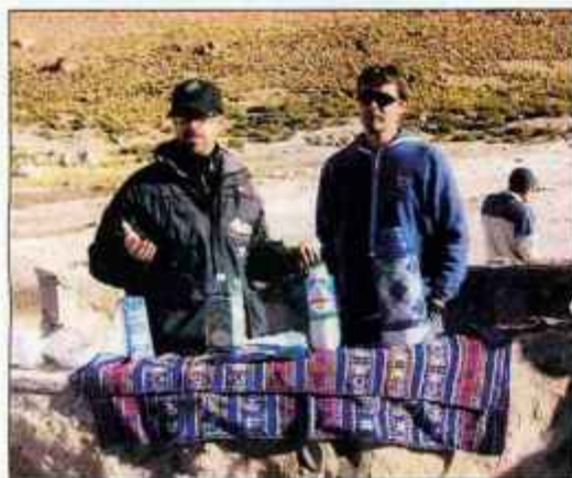
Zajtrk pri gejzirjih v Atacami