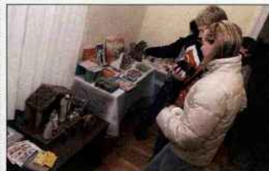
Razstavo jaslic bodo na Šenturški Gori pripravili tudi ob naslednjem božiču.