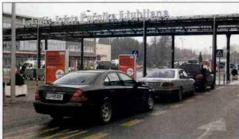
Za uporabo postajališča na letališču morajo taksisti po novem plačati tudi 240 evrov občinske takse.

Oba odloka sta začela veljati že konec decembra, kljub temu pa občina po besedah župana Franca Čebulja ni prejela še nobene vloge za izdajo dovoljenja. In to kljub temu, da na Letališču Jožeta Pučnika Ljubljana na Zgornjem Brniku po naših podatkih dela 33 taksistov, za neupoštevanje odloka pa je zagrožena globa 1.400 evrov za pravno osebo in 400 evrov za odgovorno osebo. "Odlok o avtotaksi prevozih smo morali sprejeti na zahtevo prometnega inšpek-