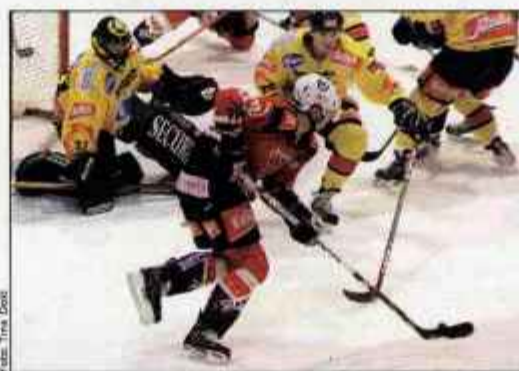
Kljub napadom je mreža gostov ostala nedotaknjena

Železarje v tem tednu čakata dve tekmi na domačem ledu, v petek proti ekipi