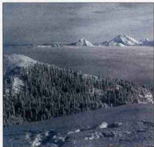
Dolgotrajne in stresne službe utrujajo, zato si vzemimo čas za polnjenje "akumulatorjev". Skok v naravo bo pravo pomirjevalo.

Ob redni službi si torej le vzemimo čas za športno aktivnost. Ne nazadnje nam to pomeni tudi druženje s somišljeniki ter navezovanje novih stikov in poznanstev.