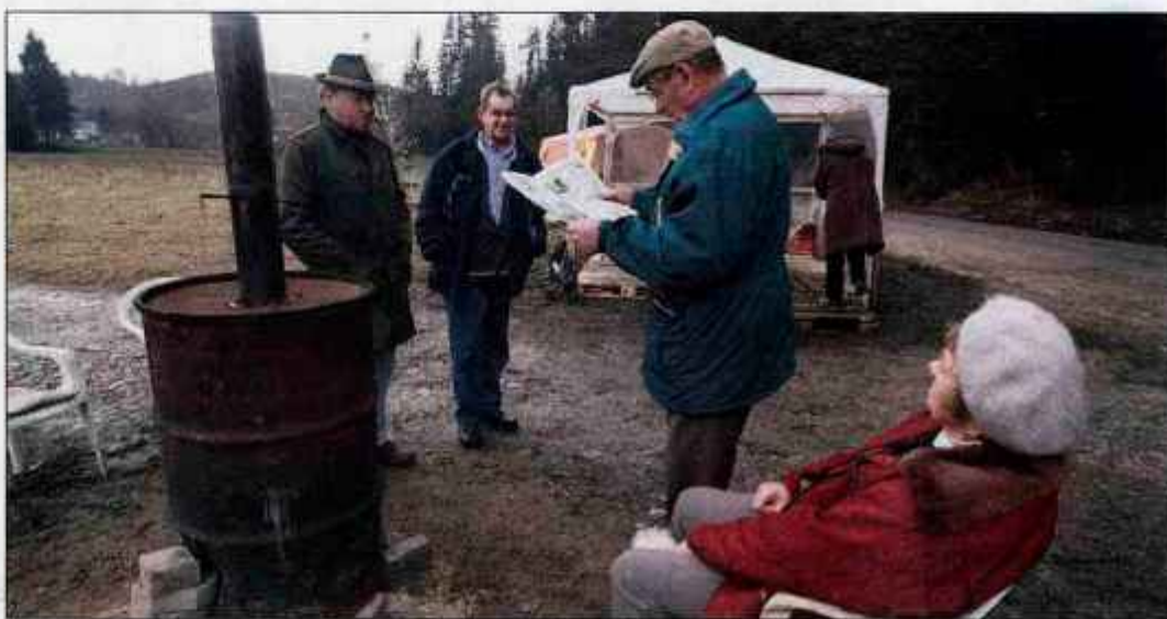
▶ 3. stran Že več kot sedemdeset dni prizadeti krajanji Mlake in Tenetiš vztrajajo na vaški straži.

odvoza komunalnih odpadkov. Ta sta bila glavna razloga za moj obisk Tenetiš, kjer sem civilni iniciativi predlagal, naj dopustijo odlaganje odpadkov do konca leta 2009, zatem pa bi smetišče sanirali. Občine, ustanoviteljice Komunale pa bi dale besedo, da regijskega centra za ravnanje z odpadki na tej lokaciji ne bo. Bolj modro se mi zdi, da se o problemu pogovorimo, kot da se nam "zgodi" Neapelj," je povedal Čebulj, ki bo predlog dogovora v pisni obliki predstavil vpletenim stranim.