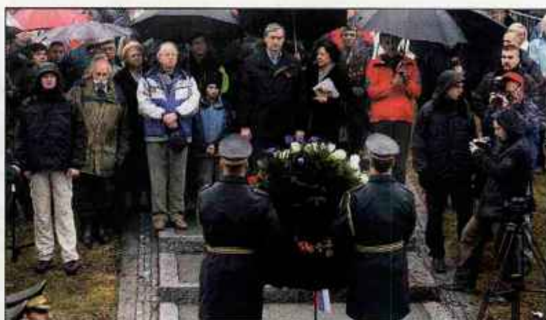
Dr. Danilo Türk je prvi med dosedanjimi predsedniki Republike Slovenije na tradicionalni slovesnosti položil venec h grobnici padlih partizanov in pobitih domačinov.

"Do zgodovinskih resnic se prepogosto obnašamo nestrpno in preveč politično. Nismo pripravljeni sprejeti spoznanja, da je pot do resnice zahtevna, resnica pa pogosto bolj zapletena, kot nam