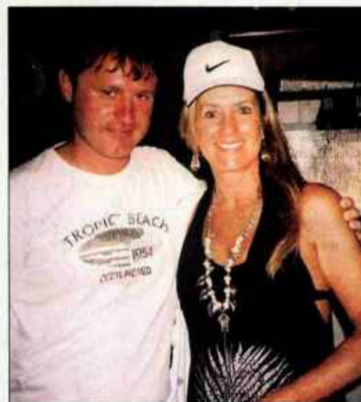
S pravim "dekleto iz Ipaneme", o kateri poje pesem.

Dubai je po Tomažem mnenju preveč umetno mesto, v katerem se vprašaš, kam vodi človeška norost - imeti najvišjo stolpnico, palačo, največje letališče ... Čile je ena najdaljših držav na svetu. Patagonija je raj za treking in kraj, kjer človek spočije dušo. Skrajna južna točka Latinske Amerike je Ognjena zemlja. Od Buenos Airesa do Mojstrane je dobrih 12 tisoč kilometrov.