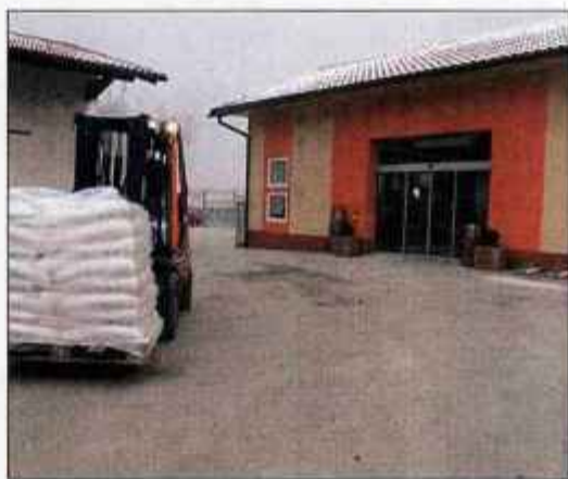
Obnovljeni poslovni prostori v Moravčah