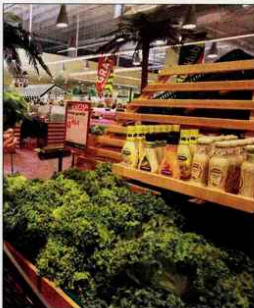
Vlada poskuša izboljšati gnotni položaj ljudi z nizkimi dohodki, ki najbolj občutijo posledice podražitev, še zlasti hrane.

bi davčno razbremenili ljudi z najnižjimi dohodki, vlada predlaga spremembo zakona, po kateri bi zavezancem z manj kot 6.800 evrov letnega bruto dohodka splošno olajšavo zvišali za 2.000 evrov, na 4.959,6 evra, zavezancem, ki imajo od 6.801 do 9.000 evrov bruto dohodka, pa za 1.000 evrov, na 3.959,6 evra. Na ministrstvu za finance so izračunali, da bo zavezanec z letno bruto plačo 6.800 evrov imel zaradi višje splošne olajšave za 6,5 odstotka višjo neto plačo, kar na letni ravni pomeni 320 evrov oz. 8,2 odstotkov minimalne mesečne plače, zavezanec z letno plačo 9.000 evrov pa za 2,5 odstotka višjo neto plačo oz. za 160 evrov višji letni dohodek. S predlaganim zvišanjem olajšave se bo izboljšal dohodkovni položaj več kot 200 tisoč zavezancem, prihodki državnega proračuna pa bodo zaradi tega nižji za 38 milijonov evrov. Višjo olajša-