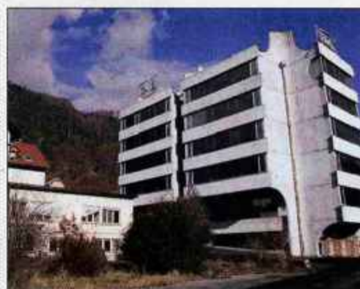
Najprej bodo iskali investitorja za poslovni stolpič v nekdanji Pekovi upravi.

"Center bo imel štiri vsebinske sklope. V nekdanji upravni stavbi Peka bo podjetniški inkubator, ki bo povezan z gospodarskim središčem Gorenjske. Del stavbe bodo obnovili zasebni investitorji za poslovne dejavnosti, v stolpiču pa bo tudi večnamenska dvorana z 250 sedeži. Spodnji prostori bodo namenjeni knjižnici Tržič, ki bo zasedala tudi del stare upravne stavbe. V njej bo zgoraj Ljudska univerza Tržič. V stari železniški postaji bodo zasebni gostinci, v dveh skladiščih in nekdanjem obratu PGP pa obrtno-skladiščna cona. Do konca februarja načrtujemo izvedbo javnega poziva za podelitev stavbnih pravic. Nato bodo ponudniki pripravili idejne projekte, ki jih bomo predstavili občinskemu svetu v prvi polovici leta. Letos naj bi začeli postopke za pridobitev gradbenih dovoljenj,