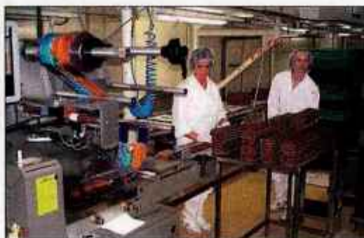
Zaključek pakirne linije rižve čokolade. Prav v pakirne linije so v Gorenjki veliko vložili.

jo Žita kot zadnja izmed petih odvisnih družb pripojena Žitu, d. d., in je torej posledaj poslovna enota - profitni center, ime Gorenjka pa seveda ostaja priznana blagovna znamka. Da je res tako, potrjuje lani pridobljen laskavi naslov 'naj blagovne znamke' - Super brand Slovenije. Skupino Žito tako sedaj poleg matičnega podjetja s šestimi profitnimi centri sestavljajo še invalidsko podjetje Intes storitve, Žito Šumi Ljubljana, LD Žito Hrvaška, Žito Srbija in Žito PI Makedonija.