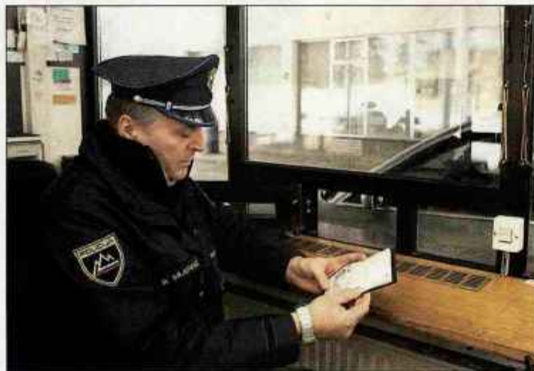
Včeraj so slovenski policisti zadnjič pregledovali potne listine na notranjih mejah z Avstrijo, Italijo in Madžarsko.

Novosti, ki jih prinaša vstop Slovenije v šengensko območje, je notranje ministrstvo predstavilo v brošuri "Slovenija, schengenska novinka". Danes, 21. decembra, pa lahko med 9. in 11. uro na brezplačni telefonski številki 080 22 35 dobite še dodatna pojasnila.