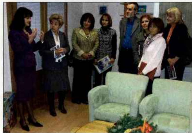
Na slovesnosti ob odprtju Sobe belega medveda

senik in ob tem poudarila, da z ureditvijo sobe uresničujejo otrokove pravice iz evropske konvencije in strokovno doktrino socialnega dela, ki v vseh dejavnostih in postopkih izpostavlja koristi za otroke. Na slovesnosti, ki so se je udeležili predstavniki različnih ustanov in služb, med njimi tudi vrhovna državna tožilka Savica Pureber , so ugotavljali, da se zdaj začneja še trše delo, to je učenje o tem, kako voditi pogovore, da bodo otroci občutili čim manj stisk.