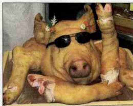
Kakšno svinjsko tihožitje!

Komanova zakuha samemu ne posveča velike pozornosti, bolj jo zanimajo posledice, izražene v kolinah. "Večino mesa, zlasti grjati in plečeta klavec primerno razseka, nasoli in vloži v velik, za to pripravljen skaf. Meso ostane v skafu nekaj tednov, da se dobro izsolijo, potem pa ga izobesijo v dimnik. Nekaj mesa pa porabi za