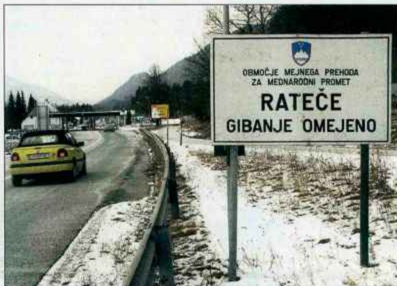
Danes ponoči so z vseh gorenjskih mejnih prehodov odstranili mejne table.

Ob tem omenimo še, da se bo danes zjutraj na mejnem prehodu Karavanke minister za zunanje zadeve Dimitrij Rupel srečal z jeseniškim županom Tomažem Tomom Mencingerjem, potem pa nadaljeval pot v Področje na srečanje z zunanjo ministrico Republike Avstrije Ursulo Plassnik.