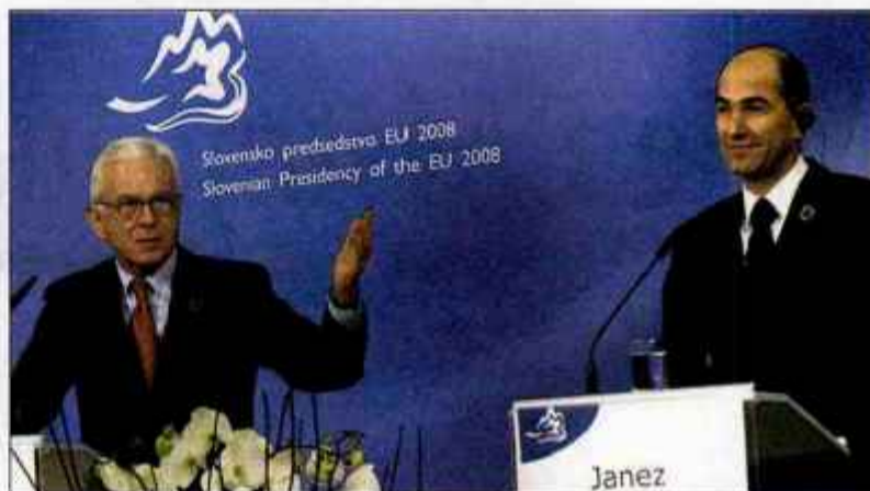
Predsednik evropskega parlamenta Hans-Gert Pöttering in predsednik slovenske vlade Janez Janša o skupnih ciljih slovenskega predsedovanja

Brdo pri Kranju - Srečanje konference predsednikov evropskega parlamenta s slovensko vlado je bilo prvi dogodek v prostorih pred kratkim odprtega novega kongresnega centra na Brdu, kjer bo prizorišče večine dogodkov v času predsedovanja naše države. Evropski parlamentarci so se želeli prepričati o tem, kako je Slovenija pripravljena na predsedovanje in katere so njene prednostne naloge. Predsednik evropskega parlamenta Hans-Gert Pöttering je ob obisku dejal, da ne dvomi, da bi slovensko predsedovanje uspelo. Gre za prvo državo iz nekdanjega komunističnega bloka, ki bo prevzela to nalogo, kar se visokemu gostu nikakor ne zdi samoumevno. Sicer pa od predsedovanja Slovenije pričakuje napredek pri ratifikaciji reformne pogodbe med članicami Evropske unije, pri čemer računa na premiera Janeza Janšo, čigar beseda ima veliko težo. Sicer pa dodaja, da se evrop-