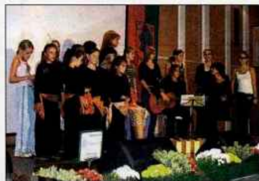
Mladi glasbeniki in pevci iz Loč ob Baškem jezeru, ki obiskujejo Slovensko glasbeno šolo, dobijo za svoje učenje od dežele manj pomoči kot učenci deželne šole, čeprav jih učenci slovenske šole po nagradah na tekmovanjih prekašajo.

Pred dnevi pa je koroški deželni glavar Jörg Haider ostro protestiral na avstrijskem zunanem ministristvu, ker je slovenska vlada nameravala uporabiti na svojih uradnih dokumentih simbol knežjega kamna. Slovenska vlada je nato od svoje namere odstopila. Ker zvezna in deželna vlada ne uresničujeta odločb ustavnega sodišča, je Narodni svet koroških Slovencev napisal zveznemu kanclerju Alfredu Gusenbauerju odprto pismo, v katerem ga opozarjajo na zavlačevanje pri uresničevanju zakonov in odločb sodišča za zaščito slovenske manjšine na Koroškem. Ustavno sodišče je že pred šestimi leti, 13. decembra leta 2001, razveljavilo dele Zakona o narodnostnih skupnostih in nekatere kasnejše uredbe. Sedanja vlada je namreč v programu zapisala, da bo problem dvojezičnih napisov