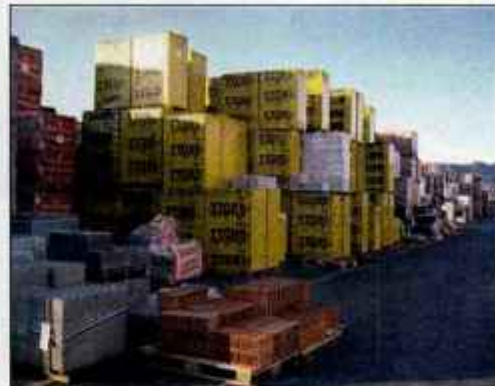
Novo skladišče gradbenega materiala