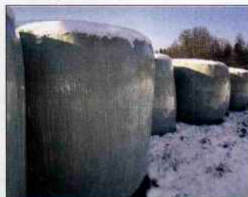
Krma v jaslji, kam pa folija?

Šentrupertu to folijo predelujejo v granulat, ki ga uporabljajo pri izdelavi folije za potrebe gradbeništva. Že zdaj jo prevzemajo na večjih kmetijah v okolici Šentrupertu