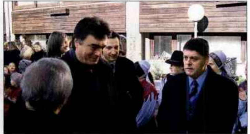
Minister Milan Zver (levo) je pohvalil hitro obnovo šole.

Prostore je obnovilo Gradbeno podjetje Bohinj. Delavci so delali vse dni v tednu, tudi sobote, nedelje in praznike. Dela pa so zaradi pouka potekala le v popoldanskem in večernem