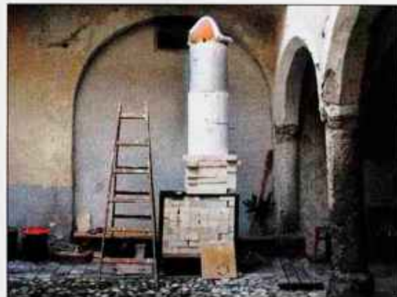
Tri metre visoka peč je po opravljenem delu ostala v spomenu na fotografiji.