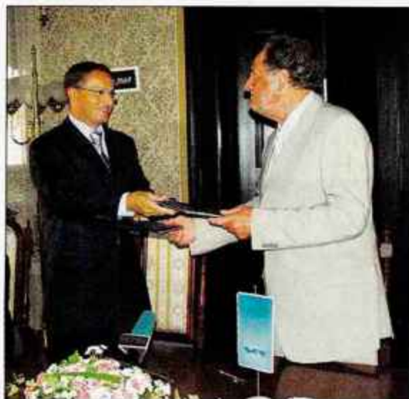
V Hribarjevi hiši v Cerkljah so slovesno podpisali 2 milijardi vredno pogodbo o gradnji hotela na Ptujju.

Delničarji družbe SGP Tehnik iz Škofje Loke bodo na četrtkovi skupščini med drugim sklepali o uporabi bilančnega dobička za leto 2005, o podelitvi razrešnice upravi in nadzornemu svetu, imenovanju novega člana nadzornega sveta in pooblastilu za nakup lastnih delnic. Uprava in nadzorni svet predlagata, da bi celotni bilančni dobiček v višini 416 milijonov tolarjev ostal nerazporejen in da bi članom nadzornega sveta podelili razrešnico za poslovno leto 2005, upravi pa ne. Ker je član nadzornega sveta Anton Papež odstopil, naj bi za obdobje od 24. avgusta do 15. julija prihodnje leto izvolili novega, za kar predlagajo Draga Goloba. Skupščina naj bi tudi pooblastila upravo, da bo poldrugo leto lahko kupovala delnice po ceni, ki ne bo nižja od tisoč tolarjev in ne višja od knjigovodske vrednosti. C. Z.