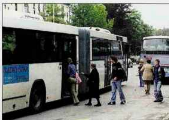
Ukinitve skupnih vozovnic Integrala Tržič in Alpetourja bo prizadela predvsem dijake in študente.

bus. Kakorkoli že, zadeva se bo očitno uredila, saj se nam slej ko prej obeta uvedba skupne vozovnice za celotno državo," je pristavila.