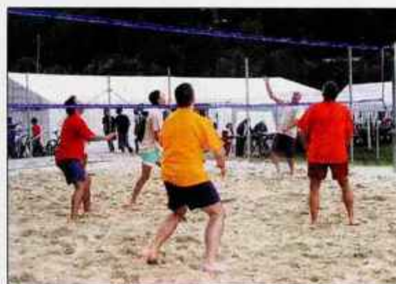
Za zanimiv obračun na novem igrišču za odbojko na mivki so poskrbeli domači člani Športnega društva Selca, ki so premagali svetnike občine Železniki.