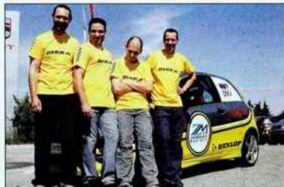
Za predelavo je tehnični tim Andreja Jereba porabil 200 delovnih ur.