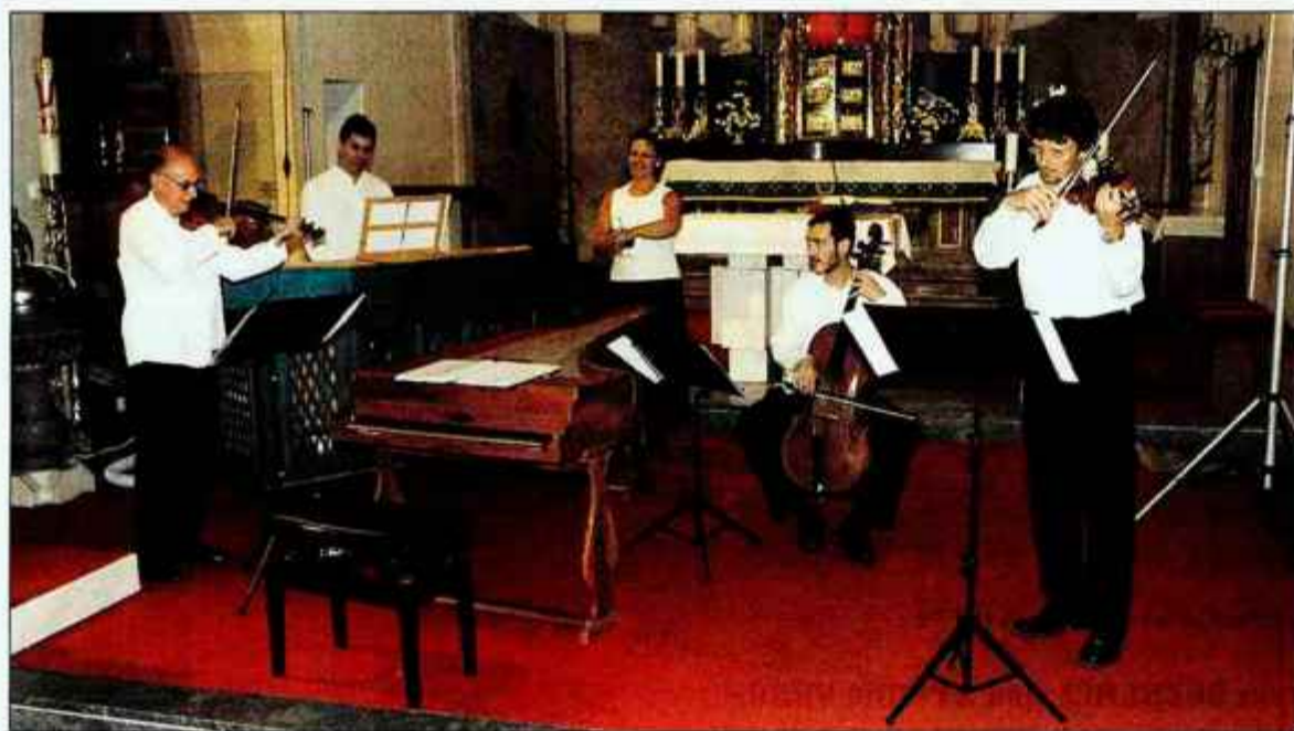
Španski ansambel La Real Camara je predstavil špansko violinsko baročno glasbo.