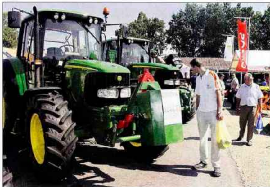
Tudi na letošnjem sejmu se obeta dobra ponudba traktorjev in drugih kmetijskih strojev.

Vstopnina bo vse dni 1.000 tolarjev za odrasle in za mladino 400 tolarjev, razen v nedeljo, 27. avgusta, ko bo le 800 oz. 300 tolarjev, enaka bo vse dni tudi za skupine.