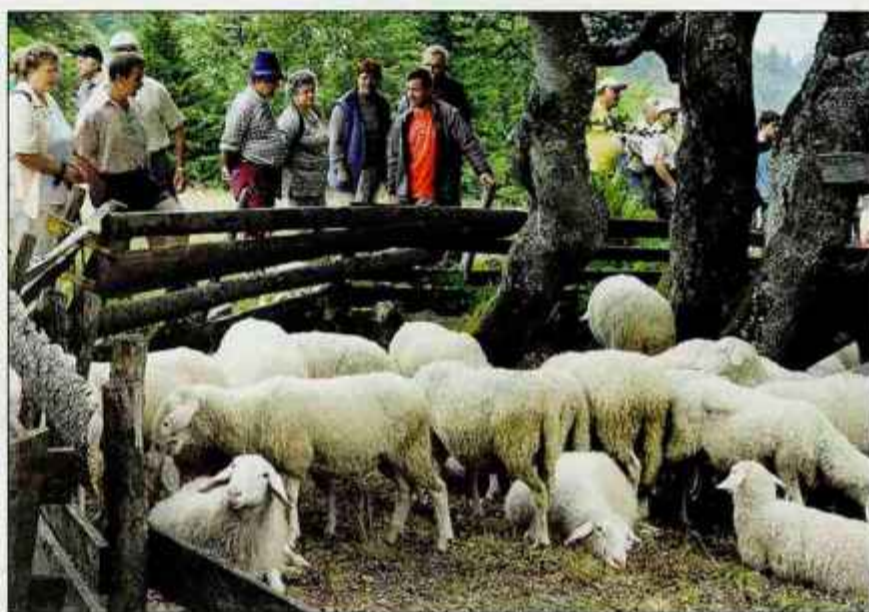
Gorenjski ovčereji so si med drugim v soboto z zanimanjem ogledali številno čredo, ki se poleti pase na obronkih Soriške planine.