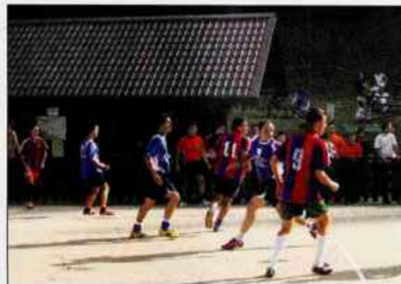
Športnega praznika v Selcih se je udeležilo kar 34 malonogometnih ekip iz vseh koncev Slovenije, ki so navdušile številne obiskovalce.

Na ekshibicijski malonogometni tekmi med trenerji futsala in dnevnikom Ekipa so tesno, z rezultatom 3:2 slavili trenerji, na ekshibicijski tekmi ob slovesnem odprtju novega igrišča za odbojko na mivki pa so člani domačega Športnega društva Selca z rezultatom 2:1 premagali svetnike občine Železniki .