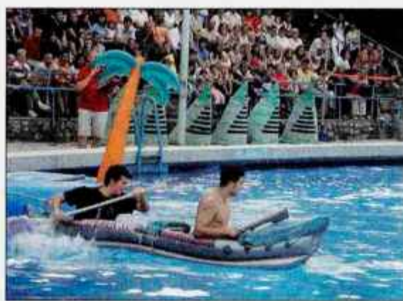
Kljub vsem zapletom so v soboto v Tržiču vendarle izpeljali igre brez meja.