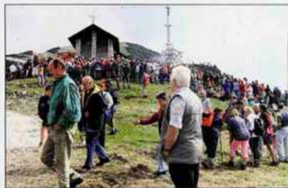
Svete maše se je udeležilo okrog tri tisoč ljudi.