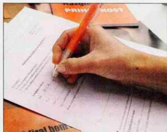
Na upravnih enotah se je včeraj začelo zbiranje podpisov za kandidaturu samostojnih kandidatov. Občine morajo najkasneje ta teden določiti plakatna mesta za predstavljanje kandidatov.