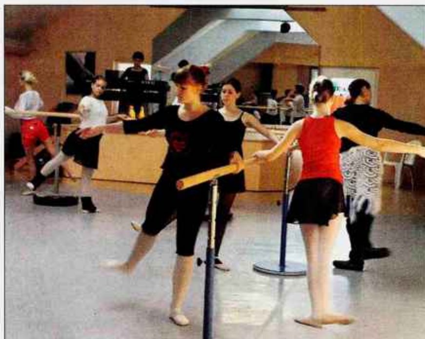
V soboto bo v sklopu baletnega seminarja v Naklem potekal dan odprtih vrat.

Mlade balerine, ki so jih glede na raven baletnega znanja razdelili v dve skupini, bodo na seminarju osvojile osnove baleta. Poučujejo klasični balet, vaje na konicah prstov, solo variacije ter klasični pas de deux oziroma ples v dvoje, kar je pravzaprav redkost v Sloveniji in "specialiteta" Baletne šole Stevens. Udeležence vsako leto poučujejo različni pedagogi. "Letos gostimo priznanega baletnega pedagoga in koreografa iz Belgije Jocelyja Alizarta, ki je znan tako v tu-