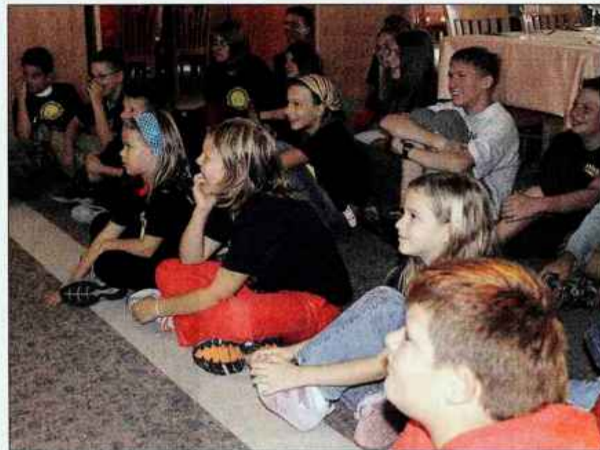
Otroci so bili navdušeni nad Sončkovim živžavom.

Kranjska Gora z okolico jim nudi obilo možnosti za aktivno preživljanje prostih trenutkov, sicer pa so zanje pripravili naravoslovno, planinsko in adrenalinsko obarvane taborne, medtem ko otroci v zadnji skupini snemajo film in ustvarjajo risanko. Minuli petek jim je letovanje s prireditvijo Sončkov