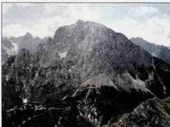
Pogled na Prisojnik z Mojstrovke.

Pot se strmo vzpenja in na njej je tudi skala, ki je nekoč prigrmelja z višine, pred katero vas ne obvaruje nobena čelada. Vstopamo v nevaren svet in za svojo varnost lahko nekaj storimo le sami! Ob rdečkasto-rumenkasti steni se usmerimo levo proti "zloglasnemu" kamninu, ki je včasih, ko pot še ni bila tako dobro opremljena z varovali, predstavljal strah in trepet. Kamnin je visok približno 15 metrov, rahlo previsen in povsem navpičen in zračen. Številne skobe in dve vzporedni jeklenici močno olajšajo plezanje. Sledi tisti najožji del, ki je previsen in se je potrebno kar rahlo nagniti navzven, še posebej, če imate s seboj velik nahrbtnik. Mesto je morda bolj podobno plazenju kot plezanju, kajti marsikdo si nahrbtnik celo sname z ramen in ga potiska pred seboj. Od tod naprej težave popustijo. Pot nas vodi po lepo speljanih policah, kjer kar naenkrat začutimo mrzel piš in pred seboj zagledamo Prednje okno. Sestopimo v dno grape, kjer so še poletni lahko strma in nevarna snežišča. Ogromno okno se odpira nad nami, mi pa se počutimo kot mravlja v tem velikem skalnatem kolosu. Narava je res mogočna. Vzpon proti oknu po droblijem svetu je zaradi padajočega kamenja nevaren in tudi naporen. Iz okna splezamo po gladki skali, ki je dobro varovana. Na drugi strani pa je drugačen svet trentarske