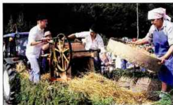
Mladi Tuhinjski s staro ročno mlatilnico