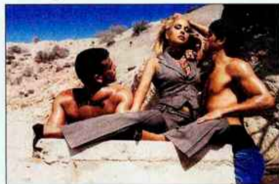
Popravljamo objavljen podatek, da ne vemo, kdaj bo Anastacijina kolekcija v sodelovanju s s.Oliverjem naprodaj v Sloveniji, saj se je to zgodilo prejšni teden.