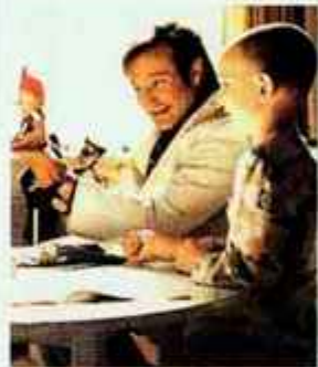
ZDRAVNIK S SRCEM Da je smeh res nalezljiv, dokazuje resnična zgodba zdravnika Patcha Adamsa. Patch, ki ga igra oskarjevec Robin Williams, verjame, da je smeh najboljša zdravilo za vsako bolezen. Zato se na vse mogoče načine trudi, da bi iz svojih pacientov izvil smeh. Če je treba, zaigra tudi klovn! Seveda stroka nad njegovimi nenavadnimi metodami zdravljenja ni prav nič navdušena, zato je ogrožena njegova kariera. Patch dobro ve, kako se bolniki počutijo, saj je bil v mladosti tudi sam pacient, ko je zaradi depresije pristal v umobolnici. Razočaran nad tamkajšnjimi zdravniki je šel s pomočjo humorja našel svoj smisel življenja.