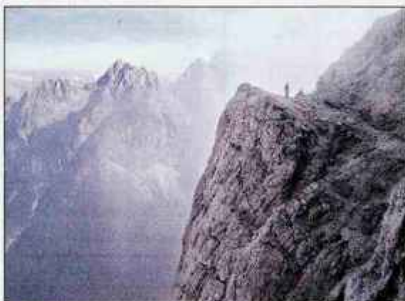
Jubilejna pot ves čas nudi čudovit razgled; med drugim na Špik ter Škrlatico, ki je skrita v megli.

strani: zelenje in običajno tudi veter. A do vrha Prisojnika je še daleč. Po grebenu, ki je na nekaterih mestih zelo zračen, varno splezamo do vrha, kjer se nam odpre razgled proti "piramidi" Julijcev, proti Špiku in dami Julijcev, Škrlatici.