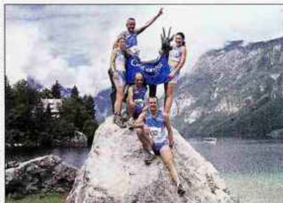
Glasova ekipa po končanem teku okoli Bohinjskega jezera na zlatorogovem prestolu.

Rekreativna ekipa Gorenjskega glasa je pretekli teden uspešno nastopila na Teku okoli Bohinjskega jezera, v Kranjski Gori in v Dovžanovi soteski. Na vseh treh tekmovanjih smo skupno osvojili kar 17 kolajn v različnih kategorijah, najbolj številčno pa smo se udeležili Teko po Dovžanovi soteski, saj nas je bilo kar 24. Naslednja tekma nas čaka v nedeljo, ko bomo tekli na Dražgoško goro.