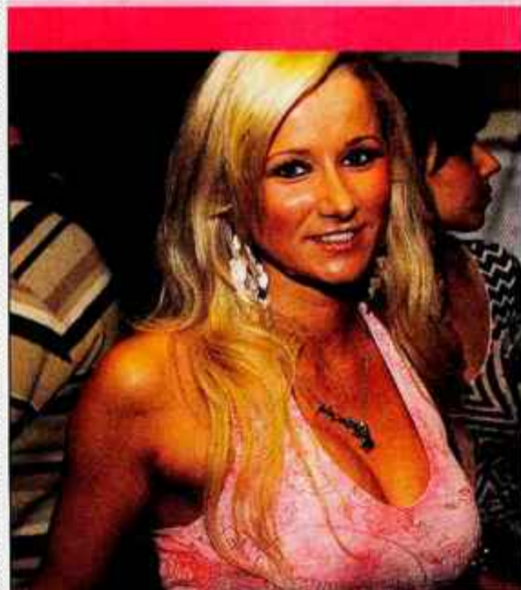
Tino Lah smo podrobneje spoznali lani, ko je postala Playboyjevo dekle leta. Prijetno svetlolasko srečujemo na različnih družabnih srečanjih. Tokrat si je ogledala Namino modno revijo.

Jennifer Lopez si že dolgo časa želi otroka, a ji nikakor ne uspe zanositi. Zdravnica ji je svetovala, naj vsaj trikrat dnevno je zelenjavo, kar poveča plodnost. Latino diva se je nemudoma lotila stroge špinačne diete, zato se te dni prehranjuje precej enolično. Zjutraj je špinačno omleto, za kosilo špinačno solato, zvečer pa praženo špinačo. V šali dodaja, da bo imela vsaj mišice kot Popaj, če ji vsa špinača ne bo pomagala do naraščaja.