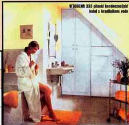
VITODENS 303 plinski kondenzacijski kotel s hranilnikom vode