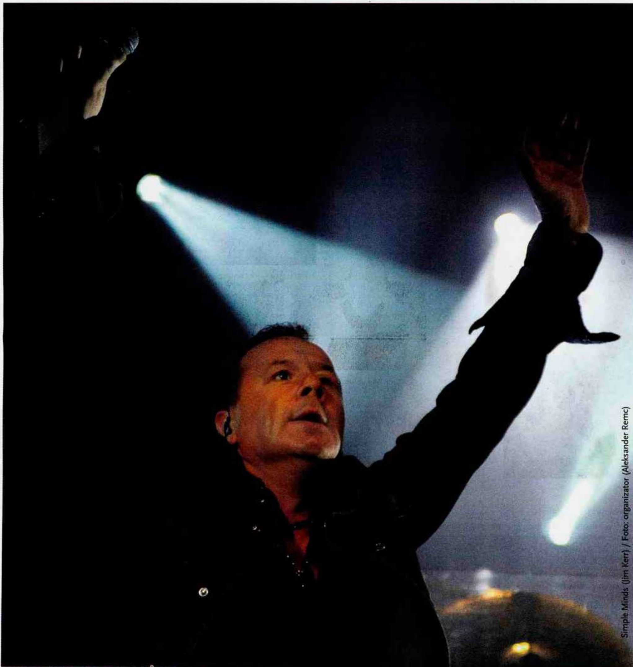
Simple Minds (Jim Kerr)