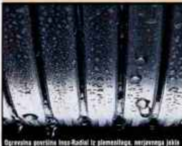
Ogrevalna površina Inox-Radial iz plemenitega nerjavca jekla

Rešitve križanke (nagradno geslo, sestavljeno iz črk z oštevilčenih polj in vpisano v kupon iz križanke, ter VAŠO DAVČNO ŠTEVILKO) pošijite na dopisnicah do srede, 12. aprila 2006, na Gorenjski glas, Zoisova 1, 4001 Kranj, p.p. 124. Dopisnice lahko oddate tudi v nabiralnik Gorenjskega glasa pred poslovno stavbo na Zoisovi 1.