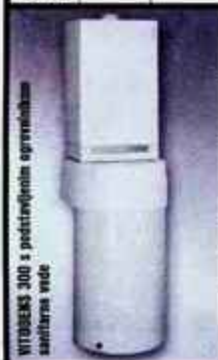
VITODENS 303 s predstavljenim ogrevanjem sanitarnih voda