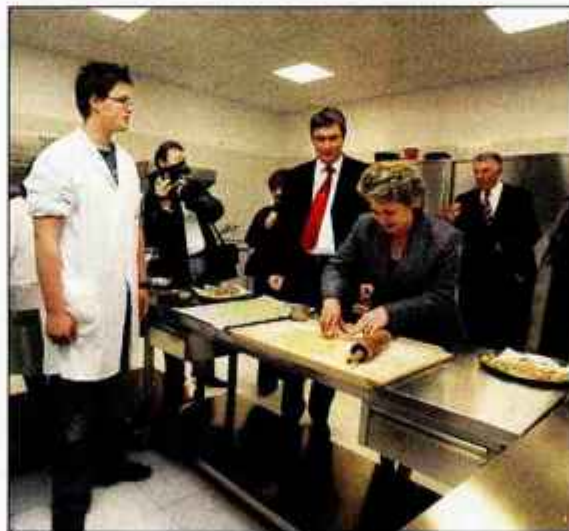
Ob ogledu šole sta najvišja gosta preizkusila spretnosti v novi kuhinji.