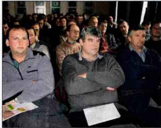
Del udeležencev občnega zbora.

Usklajeni Gerki (grafične enote rabe zemljišč kmetijskih gospodarstev) bodo prihodnje leto pogoj za uveljavljanje neposrednih plačil in drugih podpor v kmetijstvu. Kot ob tem poudarjajo na ministrstvu za kmetijstvo, gozdarstvo in prehrano, bo Gerke treba uskladiti najkasneje do 1. januarja, saj bo stanje na ta dan osnova za tiskanje obrazcev za subvencije z nekaterimi že vnesenimi podatki. Ker se Gerki nekaterih kmetij prekrivajo z Gerki drugih, bodo (so) takšne kmetije povabili na ponovno usklajevanje. Če bodo kmetije vztrajale pri prvotnih izjavah o površini in legi zemljišč, jim agencija za neuskrajene del prihodnje leto ne bo izplačala subvencije. C. Z.