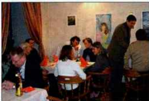
Borut Pahor med loškimi socialdemokrati.

Skofja Loka - Socialni demokrati iz Škofje Loke so v petek zvečer gostili predsednika stranke Boruta Pahorja.