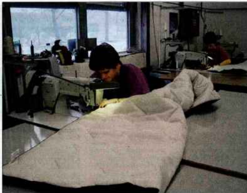
Delavke v Odeji hitijo z izdelavo spalnih vreč, ki jih bodo poslali v Pakistan.

"Pobudo za pomoč je dalo Ministrstvo za zunanje zadeve. Po dogovoru bomo spalne vreče izdelali in dobavili postopno. Prvih 3000 vreč bodo poslali v Pakistan 16. decembra, drugo in tretjo pošiljko pa do konca januarja. Spalne vreče so eden naših dopolnilnih izdelkov. Te so izdelane prilagojeno za hladne razmere; imajo več polnila in dodatno teflonsko obdelavo zunanje tkanine. Z dogovorjeno ceno bomo pokrili le proizvodne stroške. Naročilo bomo izpolnili z dodat-