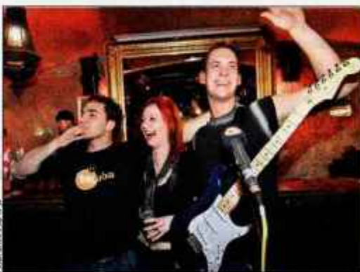
Koncertirali so zbrano in ubrano ter zadovoljili poslušalce.