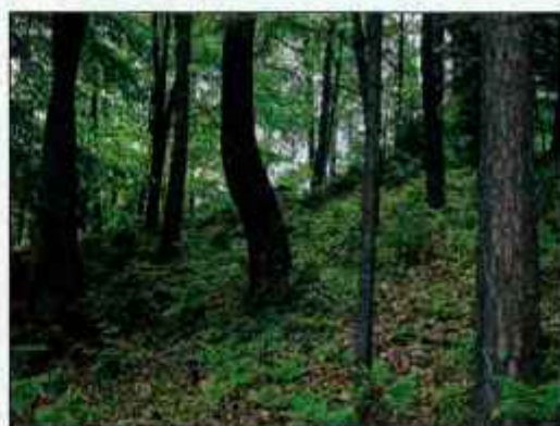
Nega gozda je naložba za prihodnost.

Osnova za sofinanciranje gozdnih del bo dnina, ki po razpisu znaša 18.500 tolarjev oz. 2.312 tolarjev na uro. Ker bo sofinanciranje v povprečju več kot 50-odstotno, bo lastnik za delo v svojem gozdu dobil povprečno 1.200 tolarjev na uro.