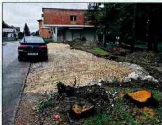
V šolskem parku v Stražišču so breze posekali in obljubili nov nasad.