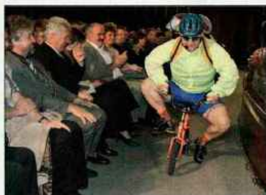
Edo že obvlada vožnjo na kolesu brez pomožnih kolesčkov. Petje pa mu tudi ne gre slabo od rok. / Foto: Tina Dolž