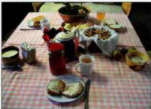
Stražiški učenci so običajno malico zamenjali za pečen kostanj, ržen in polnozrnat kruh, kislo mleko in druge naravne dobrote.