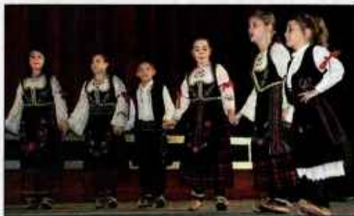
Prvi nastop mladih folkloristov iz Spitalla.