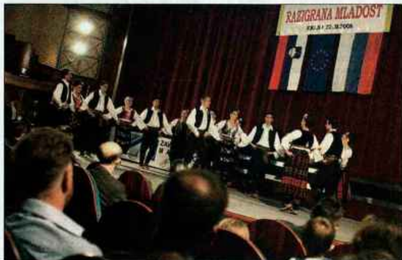
Folklorna skupina KD Brdo je v soboto dvakrat navdušila občinstvo.

Mlado kri so tokrat predstavljali najmlajši folkloristi iz sosednje Avstrije. Folklorna sekcija Srbskega kluba