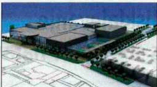
Idejna zasnova trgovsko zabavišnega kompleksa Planet Tuš v Domžalah.

Domžale - Vodje svetniških skupin Občine Domžale so se pretekli teden seznanili z načrti za gradnjo novega Planeta Tuš, s katerim naj bi vsebinsko in funkcionalno obogatili ter posodobili sedanjí objekt veleblagovnice Vele v Domžalah in prostor, kjer je danes neurejeno peščno parkirišče. Planet Tuš, za katerega so v Engrotušu rezervirali več kot 4 milijarde tolarjev, naj bi imel nad 16.000 kvadratnih metrov uporabnih površin. V okolju novega centra bo supermarket z več kot 3000 m 2 neto prodajnih površin, trgovsko ponudbo pa bodo dopolnjevali multikino s štirimi dvo-