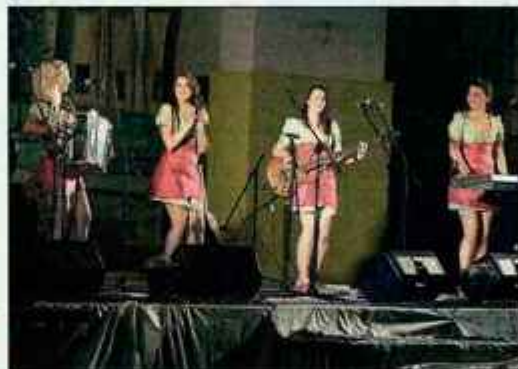
Mlade frajle so v Cerkljah dvignile razpoloženje.