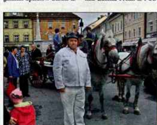
Gasilci iz Predoselj so pripeljali staro brigalno.

Kranj - Oktober ni le mesec varčevanja, ampak tudi mesec požarne varnosti. Na to so Kranjčane v soboto dopoldne spomnili prostovoljni gasilci. Na Glavnem trgu so pripravili gasilsko delavnico, v okviru katere so delili navodila s preventivno vsebino in predstavili uporabo ročnih gasilnih aparatov. Gasilci iz Predoselj so na ogled postavili 100 let staro ročno brigalno, gasilci pa so tudi preverjali, koliko Kranjčani sploh poznajo osnove požarne varnosti.