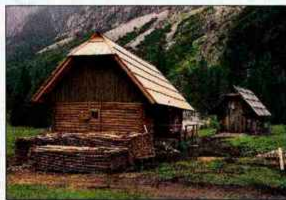
Na Malem Tamarju obnavljajo senik.