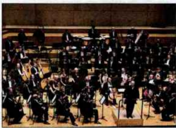
Valerij Gergijev z orkestrom Marijinskega gledališča.