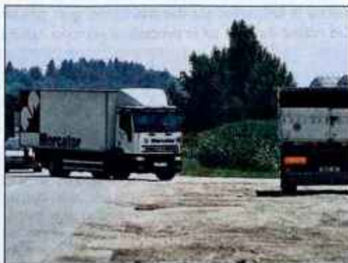
Ta teden morajo tovorna vozila v industrijsko cono Naklo voziti še po glavni cesti Kranj - Naklo.

"Pričakujemo, da bodo omenjeni odsek začela uporabljati vsa podjetja, ki delujejo v industrijski coni Naklo, kot tranzitno povezavo Kranj - Naklo - avtocestni priključek Naklo pa takrat, ko bo dograjena druga faza in omenjeni avtocestni priključek."