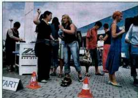
Z avtomobilčki so osvajale krono Modrega Kaska.