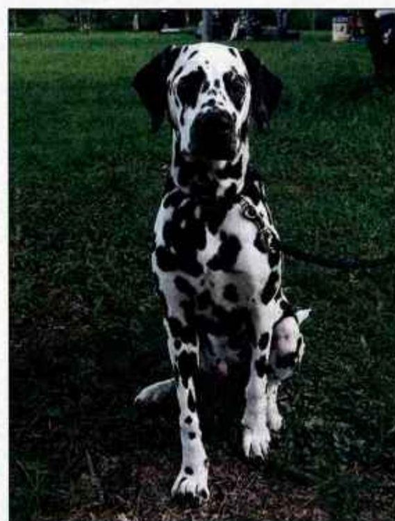
Ovratnica in povodec naj bosta primerna velikosti psa.

Povodec oziroma vrvica, s katero pripnemo kužka, ima lahko več nalog. Najbolj pomembno je, da je kužka na povodcu takrat, ko obstaja zanj kakšna nevarnost, na primer prometna cesta. V takšnih primerih je dobro, da imamo kratek usnjen povodec, ki omejuje gibanje le na kakšen meter. Če gremo na sprehod, kjer kužka ne želimo spustiti, ker se ženi ali ne uboga dovolj, uporabimo fleksi, to je povodec, ki omogoča, da se kontrolirano giblje tudi do več metrov okoli nas. Če je le mogoče, pa kužka na sprehodu spustimo. Ko je še zelo mlad, lahko uporabimo tudi navadno vrvico, dolgo deset metrov, ki jo pripnemo na ovratnico, kužka pa jo enostavno vleče za seboj. Na ta način se prosto giblje, mi pa lahko, če želimo, vrvico hitro primemo in ga potegnemo k sebi. To je lahko tudi ena izmed metod učenja vaje "pridi sem". Povodce lahko kupite v pasjih trgovinah, prav tako pasje ovratnice. Pri tem bodite pozorni, da kupite dovolj veliko ovratnico, da kužka ne bo tiščala, pazite pa, da ne bo preohlapna, da se vam ne izmuzne. Nikakor za mladička ne kupujte kovinskih ovratnic, ovratnic, ki bodejo, špikajo ali kar koli podobnega, niti ovratnice na zateg, saj lahko kužku poškodujete vrat.