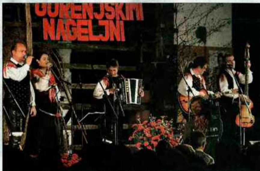
Ansambel Nagelj je nastopil tudi na koncertu Med gorenjskimi nageljni v Šenčurju.