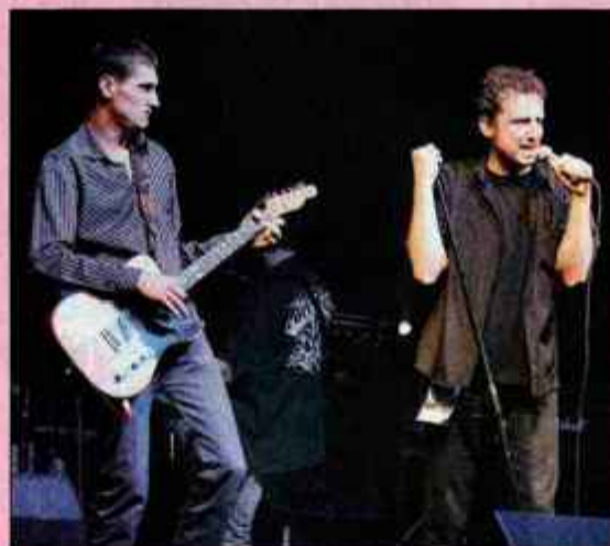
Res Nullius bodo nastopili na festivalu GRA(N)D ROCK SEVNICA.

Metal Camp 06 zagotovo bo in to gotovo na slovenskih tleh. Že prihodnji teden lahko na strani Eventima kupite vstopnice za koncert skupine Corn , ki bo s posebnimi gosti 6. 9. 2005 nastopila v Križankah, kamor pa 22. 9. 2005 prihaja tudi Steve Val z Ericom Sardinesom , za vrhunec pa še Dream Theater oktobra v Halo Tivoli. Terezo Kesovijo lahko v prihodnjih dneh zasledite na številnih koncih Slovenije, Portorož pa bo 6. avgusta gostil koncertno atrakcijo Soulfingers . V Križankah 18. septembra obljublajo tudi koncert finske zasedbe Nightwish . Queens of The Stone Age in Srečna mladina ravno tako v Križankah 5. septembra, tri dni za njimi The Dubliners , Dino Merlin 17. septembra. ABBA MANIA se začne po slovenskih odrih od Portoroža do Ljubljane in Maribora od 18. do 21. avgusta. V Sevnici se obeta dvodnevni festival GRA(N)D ROCK SEVNICA , ki bo potekal 19. in 20. avgusta, ko boste lahko med drugim slišali tudi Res Nullius ter Ego Malfunction tokrat že z novo članico. Če imaš rad hitre plesne ritme, se udeleži prvega Open Air Electronic Festivala na Krvavcu 14.