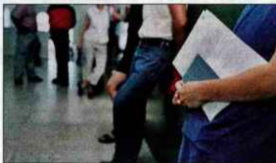
Včeraj je 90 delavcev Planike dobilo delavske knjižice.