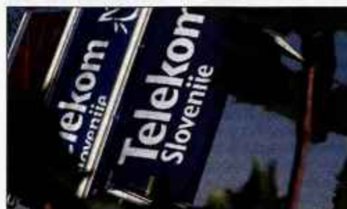
Telekoma Slovenije v obliki, kot ga poznamo sedaj, že čez nekaj let ne bo več.

V strategiji bo tudi določena odločitev ali bodo šle delnice malih delničarjev pred prodajo ali po njej na borzo (sedaj so vredne od 40 do 50 tisoč tolarjev), saj imajo na ministrstvu zadržke za hitro vključitev na trg. Menijo, da bi delnica lahko pretirano poskočila in bi država težje našla strateškega partnerja. "Interes države je najti strateškega partnerja za maksimalno ceno ter s pogoji o hitrem razvoju Telekoma Slovenije in zagotavljanju pogojev za razvoj konkurence v prihodnosti," je razložil Janša, ki se letos ne bi odločil za prodajo, saj na ministrstvu nimajo pripravljenih niti dokumentov niti strate-