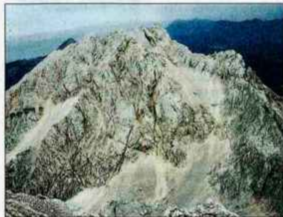
Mogočna Kočna z vrha Grintovca. Leva je Kokrska, desna pa Jezerska.

mestoma zavarovana pot. Na vrhu Taške je rahla uravnava terena; pred nami pa pot naprej do Cojzove kočice na Kokrskem sedhu, mi pa skrenemo levo. Prečimo gozd in visoke trave. Steza je speljana zelo slikovito; in ves čas je pred nami gospa, ki nas pričakuje. Vmes se pot tudi precej spusti in seveda ponovno vzpne. Kmalu dosežemo Spodnje Dolce, barviti travnati svet med Grintovcem in Kočno. Tukaj se tudi priključi pot s Kokrskega sedla. Skrenemo levo, proti bivaku, in tukaj nas čaka tisto, česar sama pri vzponih ne maram: melišče. Potrebna je previdna hoja, sicer boste naredili tri korake naprej in dva nazaj. Ko sem se sama vzpenjala po tej poti, sem le pogledovala proti skalam, in komaj čakala, da jih dosežem. Melišče mi je