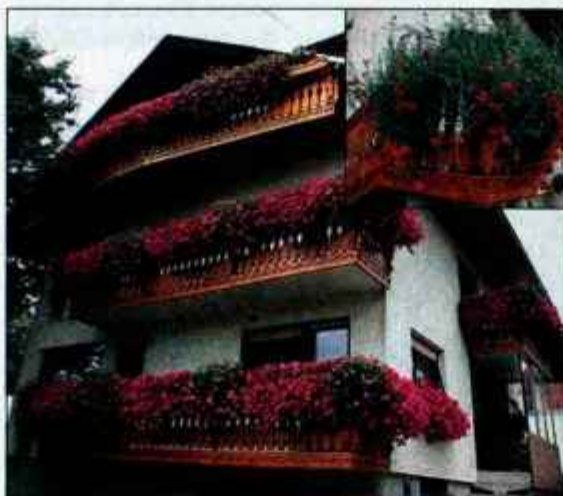
Hiša odeta v roza cvetove.

Na vrtu in okrog hiše je še veliko vrst rož, ki so vredne občudovanja: dva 10-letna asparagusa, ki sta kot zelena slapova postavljena ob vходу, in markantne stebelne posodovke: lantane, modri krompirjevec in fuksije. Ne-