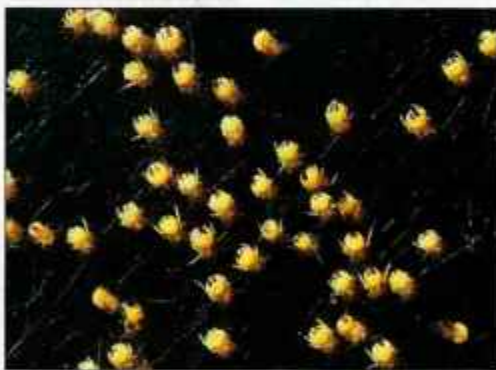
Novorojeni pajki na steklu avta - 4. nagrada za švedske turistične koledarje.