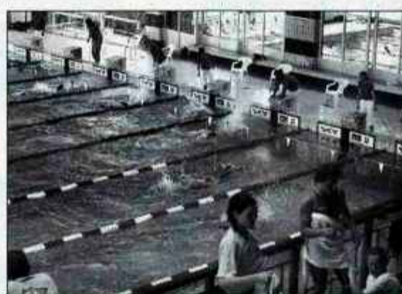
Tekme samo še v zimskem bazenu?