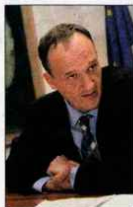
Janez Podobnik

Ko ste ravno omenili onesnaževalce, me zanima, ali so vam znane pritožbe Jeseničanov zaradi onesnaževanja okolja, ki ga s svojo dejavnostjo povzročajo Acroni?