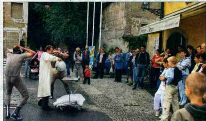
Festival uličnih gledališč Ana Desetnica je bil v Kamniku tretjič.

Tako kot v prestolnici in tudi na mariborskem Lentu so se predstavili z igro 'Dobro jutro, gospod Franz', v goste pa so povabili tudi Gledališče Ane Monro, ki je središče mesta za slabo uro poživilo s komedijo Urgenca.