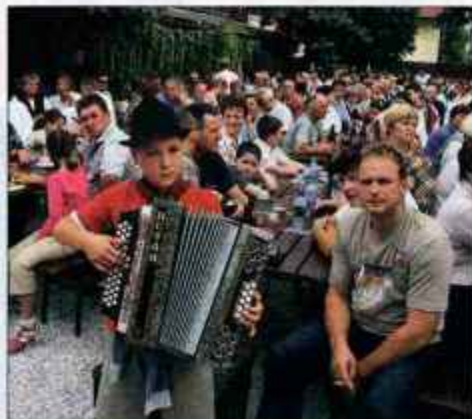
Številne obiskovalce so navdušili predvsem najmlajši godci.