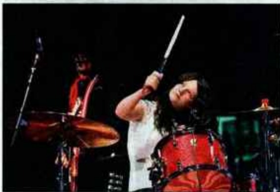
Meg in Jack. The White Stripes

da planirata potovanje, ki lahko 'traja od treh mesecev do treh let'. Poslovilno zabavo sta pripravila najbližjim in najboljšim prijateljem malce nad Pristavo nad Koroško Belo, kjer Strelčeva mama kar ni zadržala solz. Za 'leteči' cilj sta si fanta zadala Kamčatko, kam ju bo pa pot peljala dalje, nekaj malega že razmišljata, ne delata pa kakih velikih načrtov. Verjetno v Kanado, v Vancouver, kjer si bosta iskala kakšno delo, da bosta lahko nadaljevala s potovanjem. Zakaj ravno Kamčatka? Ker želita "spoznati način življenja ljudi, videti kraje, ki se jih turizem še ni dotaknil", je še dodal Grizli.