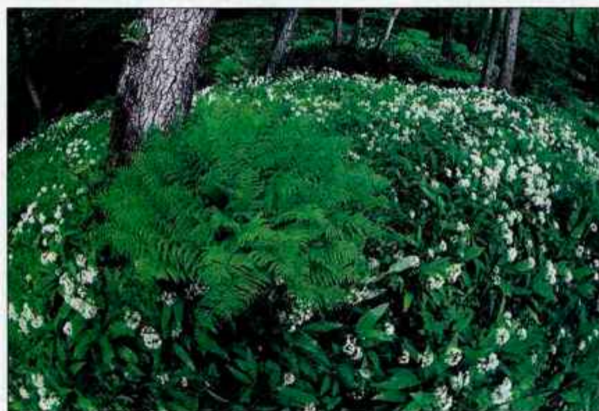
Praprotni in cvetoči divji česen - 1. evropska nagrada v kategoriji rastlin in gob.