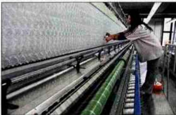
Proizvodnja v Vezeninah je preteklost, konec junija so jo dokončno ustavili.

Bled - V blejskih Vezeninah so konec junija dokončno ustavili proizvodnjo. Na nekoč uspešno podjetje spominja le napis, vse drugo je preteklost. Vrata so zaklenjena, vratarja ni več in delavcev tudi ne. Podjetje je zaradi slabega poslovanja v likvidaciji, na zavod za zaposlovanje pa je odšlo še 30 delavcev, ki so od prvotnih 120 delavcev nadaljevali proizvodnjo. "Dodelavni posli za Velano in ajdovsko Tekstino so prinašali veliko izgubo in vzdrževanje starih strojev je bilo zelo drago, kajti podjetje v zadnjih petnajstih letih ni vlagalo v razvoj. Moja glavna naloga je bila, kako čim prej in s čim manjšimi stroški zaključiti proizvodnjo in poskrbeti za delavce. Slednjim smo izpla-