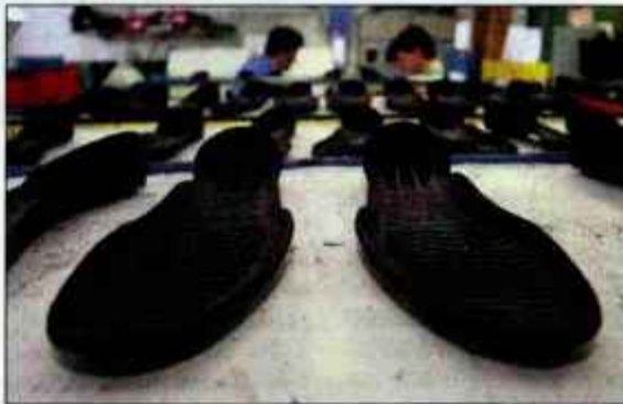
Proizvodnja v okviru stečaja bo v Kranju tekla le še do 31. julija.