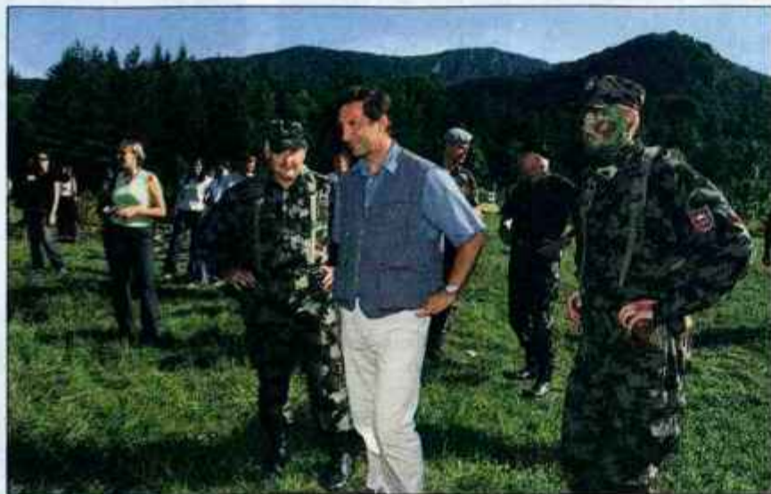
Minister Karel Erjavec in načelnik Ladislav Lipič med študenti na vojaškem taboru.

Tabor organizirata Šola za častnike Poveljstva za doktrino, razvoj izobraževanje in usposabljanje ter katedra za obramboslovje na Fakulteti za družbene vede. Tabor traja štirinajst dni, zaključil se bo v soboto, udeležilo pa se ga je 154 študentov - med njimi 75 fantov in 79 deklet, od prvga