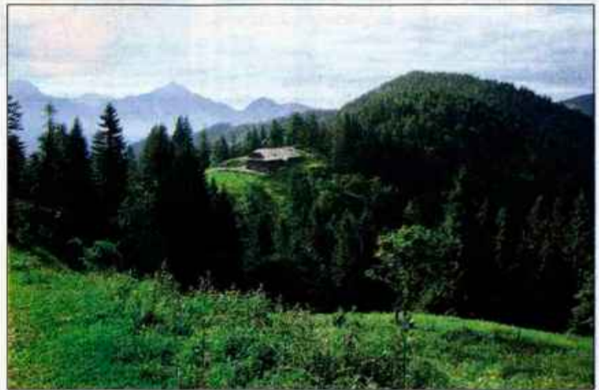
Koča na Prevali.

Avtomobil parkiramo na urejenem parkirišču levo od mejnega prehoda Ljubelj. Takoj s parkirišča se vzpnemo po ruševju na markirano pot, ki nas usmeri proti Prevalu. Na smerokazu piše, da je hoje za eno uro, a ko gre človek prvič po tej poti, zagotovo hodi dlje, kajti preveč je lepih kotičkov in razgledov, kjer se spleča upočasniti korak. Saj vendar hodimo zato, da uživamo! Gozdna pot nas kmalu pripelje do izpostavljenega dela, kjer je na desni skala, levo po prepadu. Na mestih, kjer je treba, so tudi varovala. Kakršnakooli vrtočlatica zna tukaj predstavljati problem. Pot, po kateri hodite, se imenuje Bornova pot. Baron Born je bil Berlin-