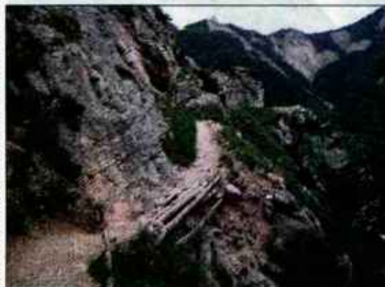
Delček Bornove poti na Prevalo.

in že dolgo ni več skriti kotiček za tiste, ki radi pedeliramo. Običajen vzpon na planino poteka iz Drage, kjer od istoimenskega gostišča nadaljujemo naprej po makadamu. Po strmih klanjih pridemo do razpotja, kjer zavijemo levo in kmalu še enkrat desno. Zahtevni klanji se nadaljujejo do planine Planinca. Oster desni ovinek nas usmeri v dva kilometra dolg klanec, kjer je povprečne naklona 20 odstotkov. Priznam, sem sestopila, ker preprosto ni šlo, vendar s trmo in vztrajnostjo človek včasih presenetni tudi samega sebe. Do Prevale je simpatičen spust, tam pa sledi zasluženo kislo mleko z ajdovimi žganci. Odločitev, od kod boste nadaljevali spust v dolino, prepuščam vam. Lahko greste tudi po Bornovi poti, a vedite v kaj se spuščate. "Singelca" s prepadom na eni strani ni mačji kašelj. Prevala je vsekakor tura za utrjene in izkušene gorske kolesarje.