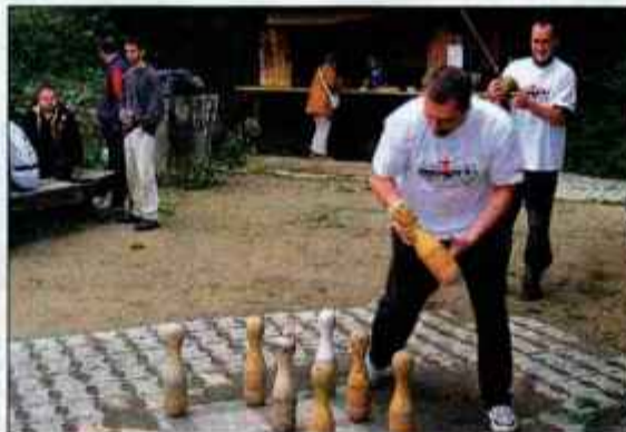
Poslovilni žur pred Kamčatko se je razvil v prijetno druženje.