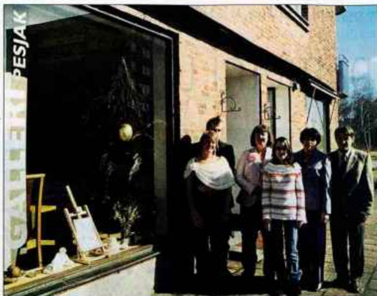
Družina in sorodniki pred Galerijo Pesjak v kraju Hässleholm.