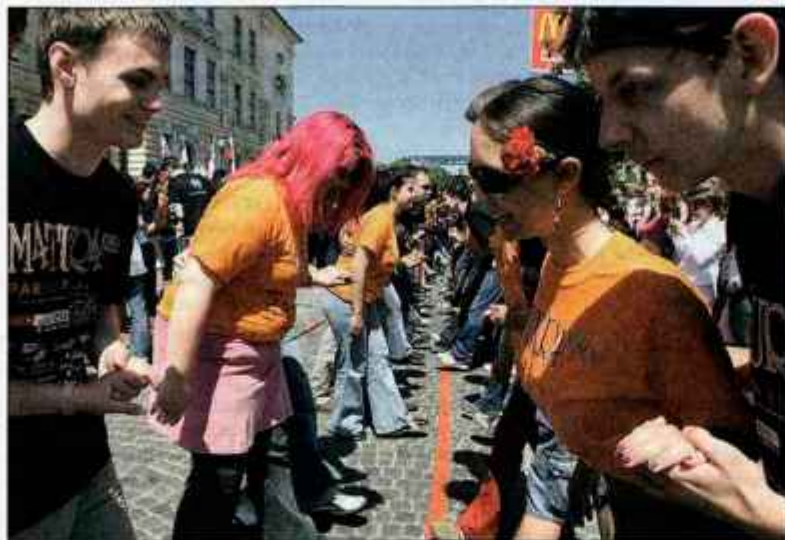
V Kranju se je na Koroški cesti zavrtelo 1192 plesalcev rekordne četvorke.