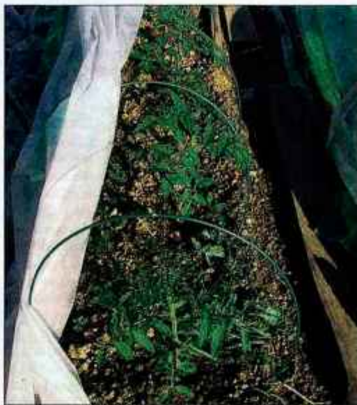
Paradižnik smo na vrtu posadili na stalno mesto. Oporo mu bomo postavili, ko bo visok približno 40 centimetrov.

Toliko se je že ogrelo, da smo minule dni na stalno mesto posadili paradižnik. Med sadikami paradižnika smo pri visokih sortah pustili 40 centimetrov razdalje, med vrstami pa 70 centimetrov. Pri nižjih in bolj grmičastih sortah pa je med sadikami 20 centimetrov razdalje, med vrstami pa 60 centimetrov. Za vsako rastlino posebej z motiko skopljemo približno deset centimetrov globoko jamo tolikšnega premera, da vanjo brez težav posadimo vse paradižnikove korenine. Nato zemljo zasujemo in rastline zalijemo, da se zemlja prime korenine