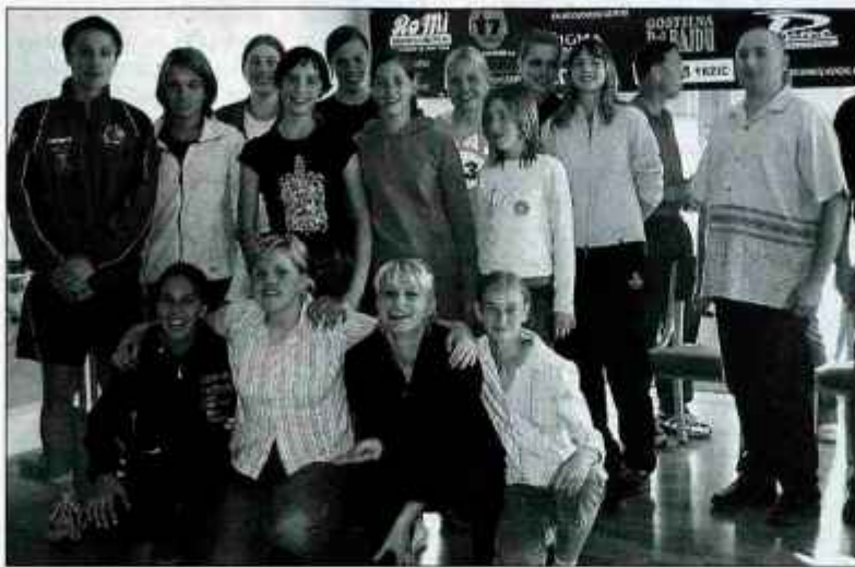
V novih prostorih kluba v večnamenskem centru v Naklem so rokometiške RK Vita Centra zaključile letošnjo uspešno sezono.

Tudi zbrane rokometiške, njihovi trenerji, straži in predstavniki sponzorjev so se razveselili pomembne pridobitve kluba, dekleta pa so zbranim gostom predstavila svoje delo in načrte. "V minuli sezoni smo članice našega kluba tekmovalce z enajstimi ekipami, od tega jih je šest nastopalo v mini rokometu. Najboljši rezultat sezone so dosegle kadetinke, ki so v državni ligi osvojile šesto mesto, v kategoriji mladink pa smo v predtekmovalju osvojile 4. mesto. Tako so