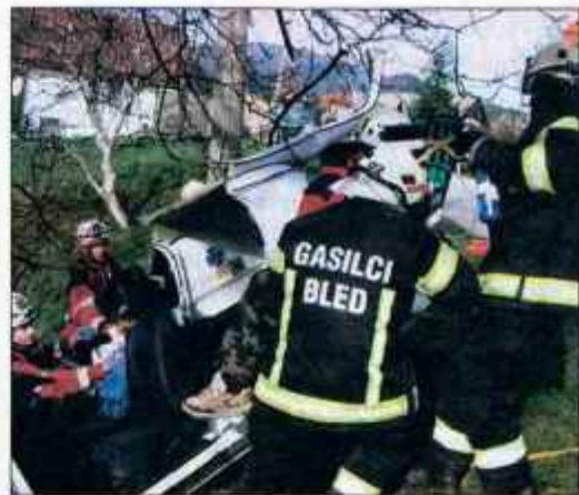
Blejski gasilci sodelujejo tudi pri reševanju ob prometnih nesrečah, za kar se usposablajo na vajah.

"Veliko skrbi namenjamu opremljanju. Imamo šest vozil in tri prikolice, žal pa je vozni park postaran. Prvi avto imamo že 38 let, zato se dogovarjamo z občino o zamenjavi. Rabili bi tudi večji čoln in opremo za reševanje na vodi. Sami smo vložili okrog tisoč ur v obnovo gasilskega vozila s cisterno. Veliko prostovoljnih ur bomo opravili tudi za prireditve. Naše društvo skrbi med srečanjem gasilcev na Bledu za izvedbo družabnih iger in požarno varovanje prireditev, na državni vaji sodeluje kot prvo društvo z 22 člani in petimi vozili, sam pa se bom kot član mednarodne gasilske organizacije ude-