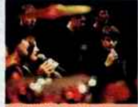
SLOVENSKA JAZZ SCENA: PERPETUUM JAZZILE IN THE REAL SIX. PACK

Vokalna skupina Perpetuum jazzile je pod imenom Gaudeamus nastala pred dobrimi dvajsetimi leti, ko so se navdušenci za jazz glasbo odločili, da bodo to zvrst začeli gojiti samostojno. Edini slovenski jazzovski zbor ima za seboj pestro umetniško pot. Spored je posvečen izključno a capella priredbam priljubljenih popularnih in jazzovskih skladb.