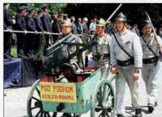
Prizor s predlanske parade na Bledu: gasilci so lahko zanimiva atrakcija za domače in tuje obiskovalce.