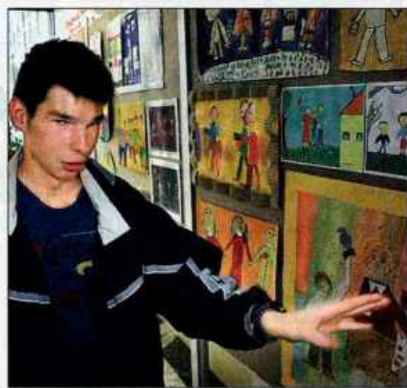
V preddverju zavarovalnice Triglav je na ogled razstava likovnih del, ki so jih otroci ustvarjali na temo Moja družina.