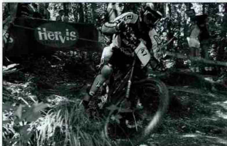
Zaradi poškodbe v adrenalinskem športu le 50-odstotno nadomestilo.

Ljubljana - Minister za zdravje Andrej Bručan se je temeljito lotil prenove zdravstvenega zakona, s katerim je posegel na področje zdravstvenih pravic Slovencev. Z njim naj bi zagotovil načelo solidarnosti in hkrati obvladoval zdravstvene finance. Zdaj je že jasno, da bodo pravice za večino ljudi manjše, več zdravstvenih pravic naj bi novi zakon prinesel le okoli sto tisoč socialno najšibkejšim, ki bodo oproščeni doplačil. Slednje velja za zaposlene z minimalno plačo, brezposelne osebe, ki so upravičene do denarne pomoči in prejemnike varstvenega dodatka in trajne denarne pomoči. Med pomembnimi novostmi, ki zadevajo večino državljanov, so nižje boleznine, omejen čas bolniškega dopusta in plačilo prispevka namesto od plač, od dohodninske osnove, kar pomeni, da bodo zdravstveni prispevek plačevali od vseh prejemkov, ne le od plač, samozaposleni, obrtniki in kmetje pa bodo po novem plačevali zdravstveni prispevek od dohodninske osnove namesto od osnove za pokojninsko zavarovanje. Po Bručanovih besedah pri tem ne gre za zmanjšanje pravic, ampak za njihovo praznopolnjenje v korist socialno najšibkejšim državljanom.