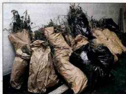
V hišni preiskavi zasežena konoplja, za katero se je kasneje izkazalo, da je industrijska.

Sodišče obdolženčevim besedam ni verjelo. "Vaš zagovor je neprepričljiv in neverodostojen. Sodni se-