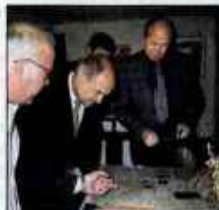
Avstrijski veleposlanik dr. Valentin Inzko v jalnovi hiši.

v Ljubnem. Na srečanju v Radovljici je poudaril, da so za dobro sodelovanje med sosedama pomembni predvsem stiki med prebivalci. Z zanimanjem je prisluhnil podatkom o zgodovini in kulturni dediščini mesta in občine, ogledal si je Linhartov trg in Šivčovo hišo in obiskal še turistično informativni center.