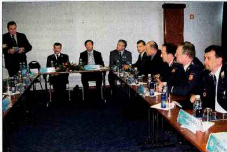
Organizacijski odbor mednarodnega srečanja gasilcev med prvo sejo.

"Če pomislimo, da imamo več kot 120 tisoč gasilcev in gasilcev, že to prič, kako je izjemno dobro razvito naše gasilstvo. Dolga tradicija je še dokaz več za to. Tudi glede opremljenosti in usposobljenosti lahko rečem, da smo na vrhu evropskega in svetovnega gasilstva. Pred nedavnim sem v imenu ministrstva za obrambo predal tri specialna vozila za gašenje v predorih, ki bodo povečala