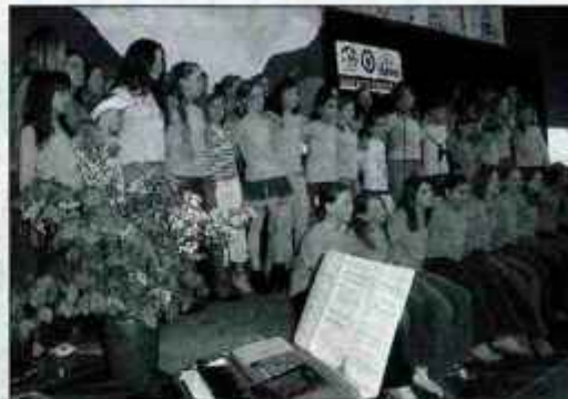
Pevski zbor osnovne šole v Mojstrani je zapel tudi Unescovo himno.

Mojstrana - Mojstranska osnovna šola je bila leta 1997 med prvimi petimi slovenskimi šolami, ki se je vključila v svetovni projekt, katerega cilj je zagotavljati kakovostnejše izobraževanje za vse. "Dosllej je bilo vodenje Unesca iz centra na osnovni šoli v Piranu, sedaj pa po Sloveniji ustanovljamo več Unescovih središč. Mojstransko središče bo povezovalo 11 gorenjskih šol, devet osnovnih in dve srednji. Povezovanje v regiji je pomembno za izmenjavo izkušenj in projektov. Vsaka šola ima svoj nacionalni projekt,