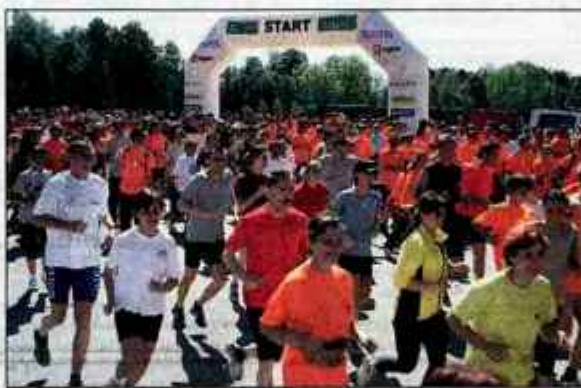
Na županovem teku na Brdu je bilo skoraj tisoč tekačev.