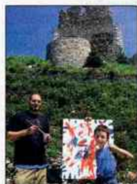
Grad je bil motiv za ustvarjanje na Extempore.