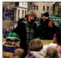
Zabava na Tednu mladih.

"Na staro mamo iz Cerkelj, kjer sem preživela veliko lepih trenutkov. Imeli sva se zelo lepo. Še danes se zelo dobro spominjam, da je med pripovedovanjem pravljic pogosto zadremala. Naučila me je skuhati žgance."