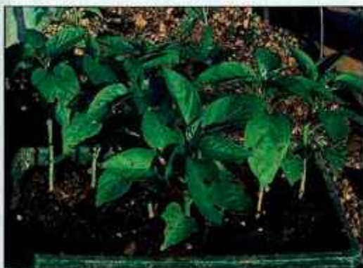
Papriko smo iz zabojčkov presadili na vrt. Pokrita bo do sredine junija.

Rumeno korenje ima dve dobri lastnosti: jedem zelo izboljša okus, je pa tudi zelo obstojno, saj ga lahko uporabljamo do pozne pomladi prihodnjega leta. Zdaj je skrajni čas, da ga posejete, saj kali zelo dolgo časa - tja do meseca dni. Pri kaljenju potrebuje tudi veliko vlage, zato ga posejemo zdaj, da bi ušli morebitni suši. Na vrtu ga posejemo na stalno mesto in to "na redko". Ko bo zrastle in ga bomo morali okopati, ga bo verjetno treba še razredčiti. Če želimo imeti debelo korenje, je priporočljivo, da je v vrsti med posameznimi rastlinami deset centimetrov prostora, med vrstami pa 40 centimetrov.