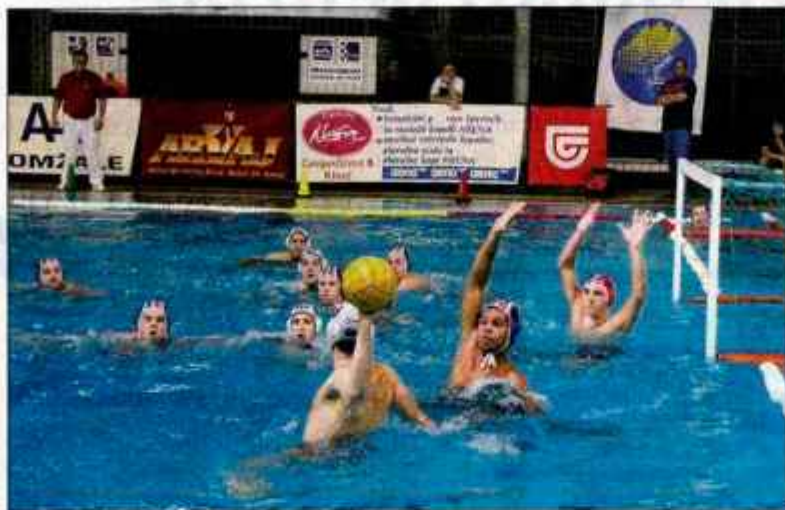
Naša reprezentanca je v Kranju pričakovano slavila le proti Francozom.

Naši vaterpolisti so v prvi tekmi z 11:7 (4:2, 0:0, 3:2, 4:3) premagali ekipo Francije, v torek so bili nato s 5:10 (0:4, 0:2, 3:2, 2:2) slabši od ekipe Italije, na zadnji sredini tekmi pa so morali priznati premoč še ekipi Jadrana. Drugi rezultati: Italija - Jadrana 5:4 (1:0, 1:1, 1:1, 2:2), Jadrana - Francija 11:6 (4:1, 1:2, 5:1, 1:2) in Italija - Francija 15:5 (3:2, 3:0, 5:1, 3:2).