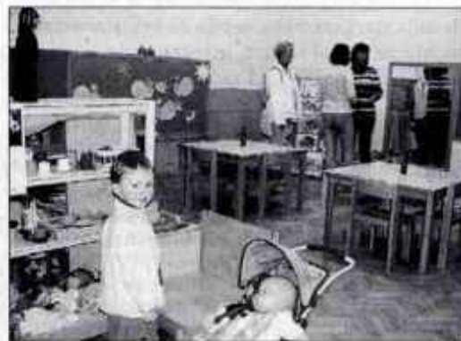
V vrtcu Deteljica, kjer so obnovili igralnici, so sprejeli tudi otroke iz vrtca Grad.

Občinske svetnike je zanimalo, kaj bo moč prihraniti z reorganizacijo zavoda. Iz-