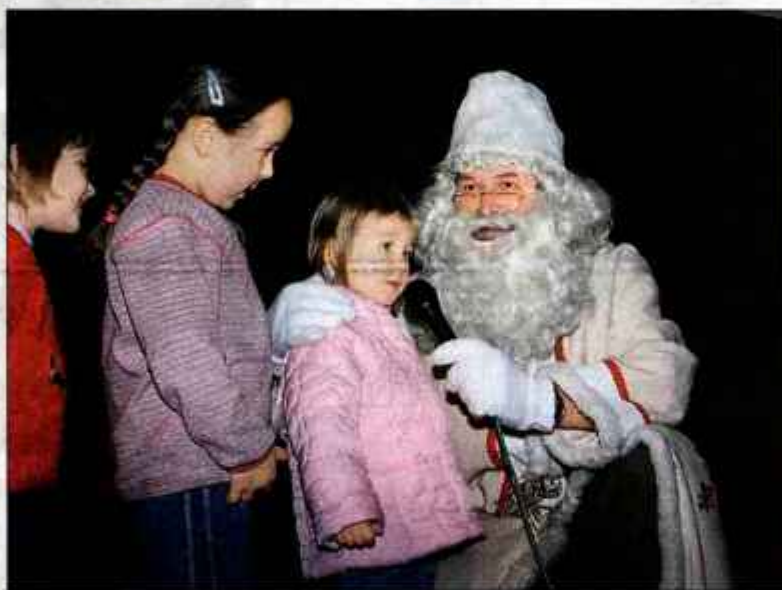
Dedku Mrazu so številni otroci zapeli pesmice, za nagrado pa dobili bonbone.

Čestitke vrtecev in osnovnih šol so prebrali njihovi varovanci oziroma učenci. Malčki in malčice iz vrtecev želijo, da bi se imeli v naslednjem