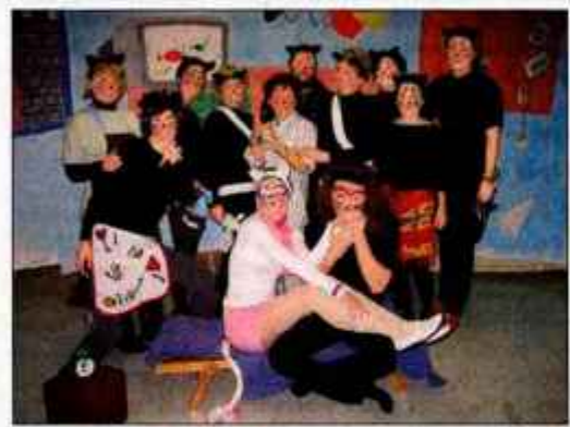
Učitelji in drugi zaposleni so se prelevili v igralce.

Praznovanje božiča in novega leta je letos v osnovni šoli Jela Janežiča potekalo nekoliko drugače kot ponavadi. Učitelji in drugi zaposleni so ustanovili dramski ansambel ter pripravili predstavo Maček Muri. Navdušujočo predstavo so si lahko ogledali tik pred božičem, 24. decembra, že dan prej pa so nastopili učenci. Učenci so bili presenečeni, s smehom in raznimi komentarji so prepoznavali učitelje, se ustrašili razbojnika Čombeta, pozdravili hišnika, ki je v igri odigral - hišnika mačje šole, ter "svoje" spodbujali s ploskanjem in klicanjem. Predbožični dan je v šoli minil na posebni valovni dolžini. Po predstavi je učence obiskal Božiček in številne tudi obdaroval. Darila so prispevali v Galeriji Krvina, Občina Železniki, Aerodrom Ljubljana, RTV Slovenija skupaj z Medexom in Mercatorjem in podjetje Ocean Kamnik. Učenci so se razveselili daril, šola pa je obogatila zbirko smuča za šolo v naravi in lego kock za oddelke podaljšane bivanja. Svojevrstno darilo so dobili tudi zaposleni šole, ki so nastopali v predstavi Maček Muri. Smeh in številne pohvale učencev so ogrela njihova srca. B. B.