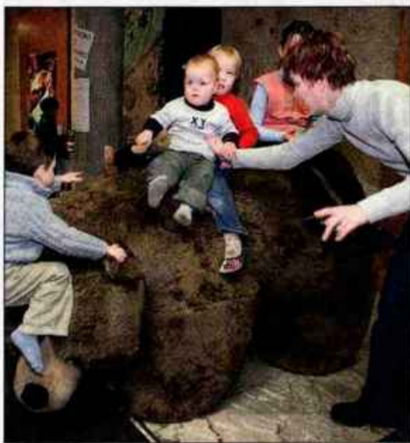
Hija, medvedek!