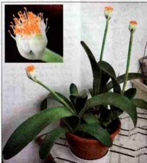
Socvetje kot slikarski čopič.

Sobni čopič - to ime nekako najbolj pristoji zaradi svetovlja, ki spominja na slikarski čopič - je iz rodu narcisovk, sorodstveno blizu klivijam, zna-