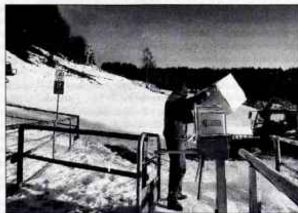
Smučišče po dveh letih čaka prve smučarje.

Planina pod Golico - "Računamo, da bomo za silvestrovo in novo leto, to je od petka do nedelje, odprli vsaj zgornji del smučišča na Španovem vrhu," je v sredo povedal direktor Zavoda za šport Zoran Kramar. Na srednji postaji Črni vrh je 25 centimetrov snega, na samem Španovem vrhu pa 40. Zadnje dni so pripravljali proge, postavljali ograje in znake ter dodobra steptali sneg z novim teptalnim strojem. Sončno vreme je naročeno, obnovljena žičnica bo obratovala med 9. in 16. uro. Za dnevno vozovnico boste plačali 2.900 tolarjev, poldnevno 2.000 tolarjev. Otroci imajo popuste. M. K.