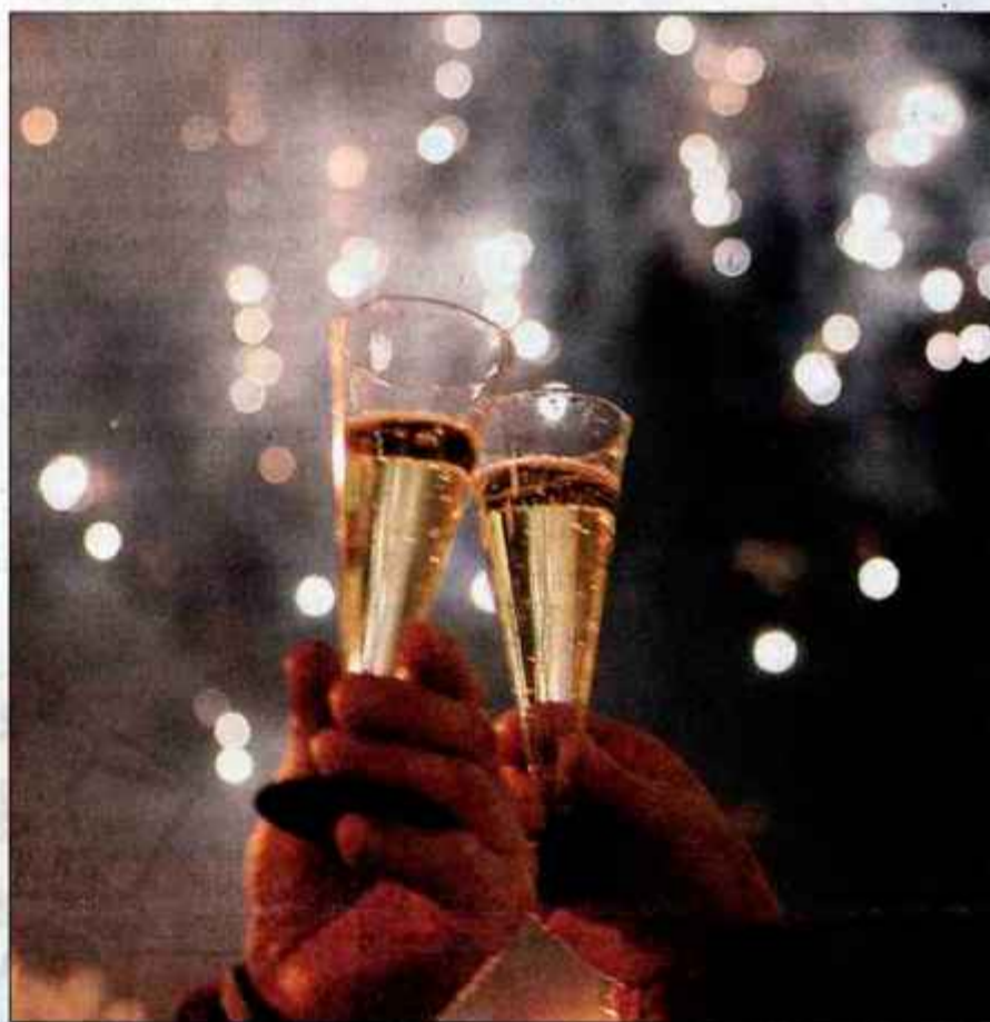
Srečno 2005!