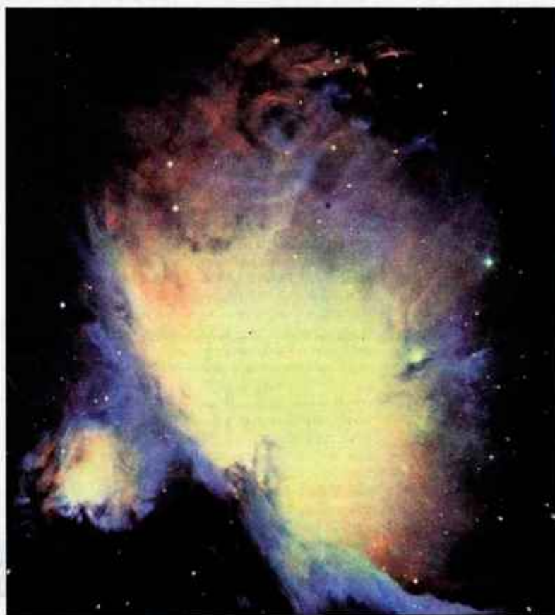
Znamenita Orionova meglica, v kateri nastajajo zvezde, fotografirana z zelo zmogljivim teleskopom. Meglica leži pod Orionovim pasom in je od nas oddaljena okoli 1500 svetlobnih let. V jasnih temnih nočeh (brez Lune na nebu) je vidna celo s prostim očesom. Zelo dobro jo lahko opazujemo že z navadnim lovskim daljnogledom.

Novo leto 2005 dočakajte tako, kot se spodobi. Ko pa boste proti jutru odšli domov