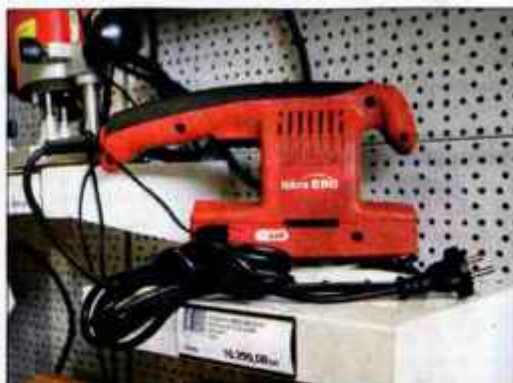
Hidria Perles je uspela z zaščito svojega električnega profesionalnega orodja pod znamko Iskra ERO.

Letos, po prekinitvi pogodbe med Hidrio Perles in Iskro Prins, ki je do tedaj skrbel za distribucijo elektro orodij Iskre ERO po Sloveniji in na območju nekdanje Jugoslavije, se je na teh trgih pod blagovno znamko Iskra pojavilo ročno orodje dvomljive kakovosti. Uvoženo orodje, ki ga je začela tržiti Iskra Prins, je bilo po barvi, velikosti in prodajni embala-