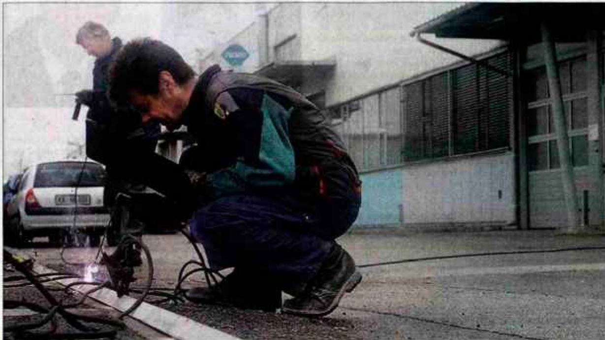
Poslovno industrijska cona Veriga: poslovno uspešna, a s težavami pri urejanju skupnih zadev.

Na območju nekdanje Verige v Lescah je nastala poslovno industrijska cona, v kateri pa ob vseh dosežkih (štirideset podjetij in podjetnikov ter petsto zaposlenih) ostaja glavni problem, kako urejati in upravljati s skupno infrastrukturo. Nekaj šibkih členov otežuje, da bi bila "veriga" sklenjena in trdna.