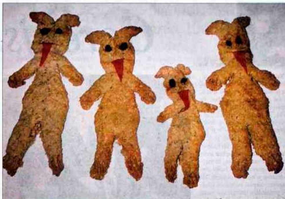
Miklavž naj ne mine brez doma pečenih parkljev. Lahko so iz čisto navadnega piškotnega testa, veliko lepše pa se oblikujejo iz medenega testa.

Za 4 osebe potrebujemo: 50 dag krompirja, 20 dag ostre moka, 4 dag masla ali margarine, 1 jajce, sol, olje za cvrtje.