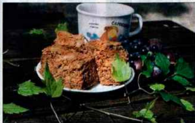
Čokoladno pecivo je hitro pripravljeno in zelo dobra sladica. Če hočemo, da bo videti bolj praznično, jo lahko premažemo z limoninim ledom ali obogatimo s čokoladnim prelivom.

Dodamo moko, jo opravimo in nato malce zalijemo. Jed dušimo tako dolgo, da se čebula popolnoma razpusti. Medtem prilijemo še preostanek vina, da golaž dobi lepo temno barvo.