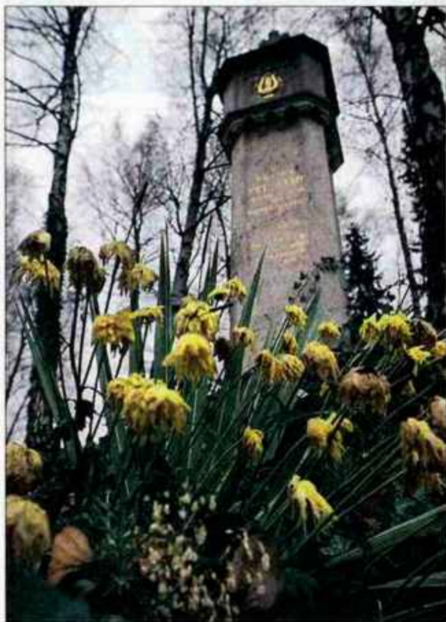
Cvetje na Prešernovem grobu je že davno vzela slana.

novo obletnico in občinski praznik. Izložbe vabijo k Miklavževim in prednovoletnim nakupom, o Prešernu ne duha ne sluha. Le še nekaj več lokalov v mestu je zaprtih kot zadnjokrat, ko smo se sprehodili po njem. Žalostno, jedro Kranja še naprej umira, čeprav dobiva iz leta v leto lepšo ulično podobo.