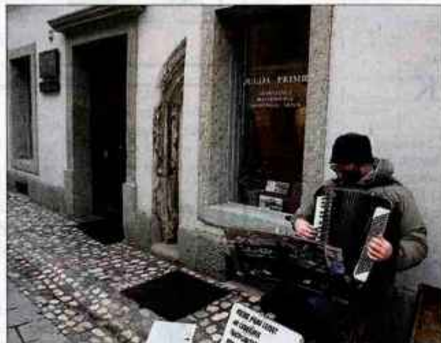
Na Prešerna in Prešernove dneve opozarjajo le izložbe kulturnih ustanov v mestu.