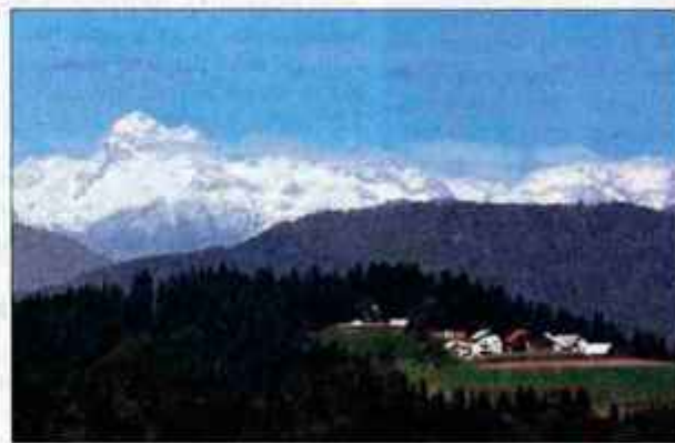
Javorc na Žirovskem vrhu, v ozadju Triglav

Tudi do prvega srečanja med Dano in Tinom pride na eni od prestižnih žirovskih lokacij, pri