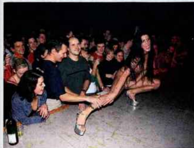
Vrhunec brucovanja je bil - erotični show s tekmovalsko zadržanostjo in netekmovalsko sproščenostjo.

njenih kondomov, napolnjenih z vodo, prav prijetno. Sledila je posebna modna revija, kjer se je moški del prelevil v modnega oblikovalca s škarjami in moderatorja, dekle pa v njihovo muzo z 'najbolj seksi oblačilcem'. Tako so se v finale prebili trije pari. Potem se je začelo. Drznost organizatorjev finalne igre je vse, ki so bili v dvorani, privabila tesno pod oder in izkazalo se je, da je tudi preživela. Moške finaliste so posedli na stole, in pred njihovim nosom se je odvrtil čisto pravi striptiz. Črnolasa lepota z izklesano postavo, jih je brez sramu popeljala v svet zamaknenosti, sramežljivosti. Odziv moških v