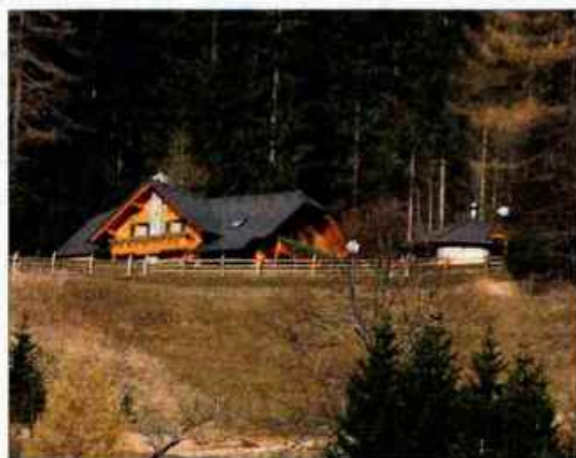
Počitniška hiša na Jezerskem.