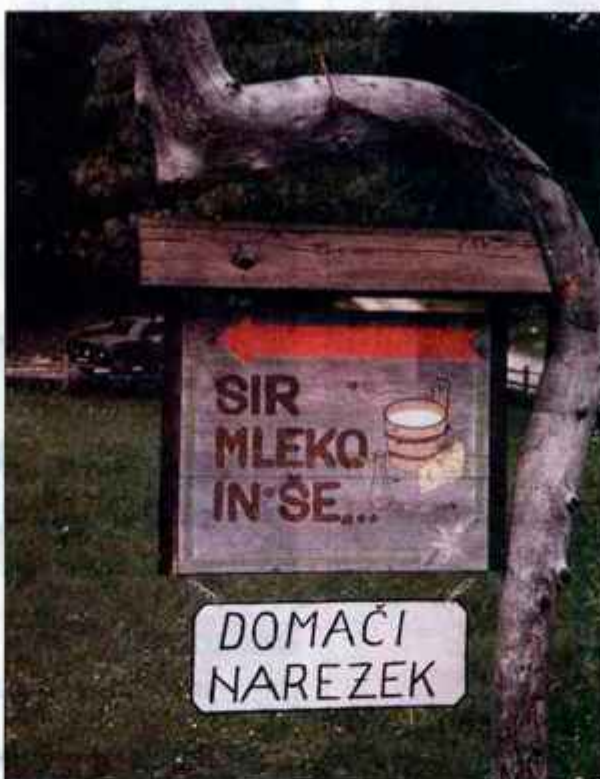
Mohant je doma na bohinskih planinah, kjer pa ponujajo še marsikaj drugega.

Z geografsko označbo so doslej zaščitili štajersko prekmursko bučno olje, šebreljski in zgornjesavinjski želodec ter kraški pršut, z označbo tradicionalnega ugleda prekmursko gibanico, idrijske žlikrofe, belokranjsko pogačo, belokranjsko in prsto povitico, z označbo višje kakovosti teletino blagovne znamke Zlato zrno in med z vsebnostjo vlage največ 18 odstotkov in vsebnostjo največ 15 miligramov HMF (hidroksimetilfururala) v kilogramu medu, z označbo naravne mineralne vode pa devet