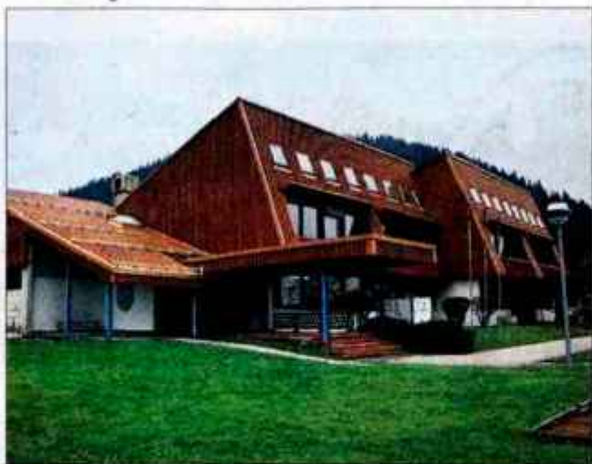
Osnovna šola Selca.