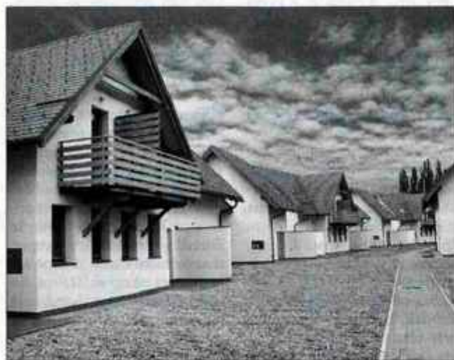
Novo apartmajsko naselje Lipov gaj.

Kranj - V Termah Lendava, ki sodijo pod okrilje Panonskih term in dejavnosti turizem v Poslovni skupini Sava, so pred nedavnim odprli apartmajsko naselje Lipov gaj, še letos pa bodo dokončali gradnjo novega bazena.