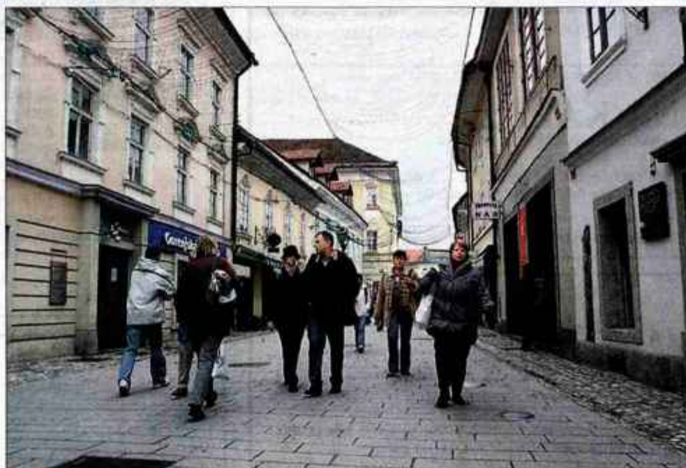
Na Prešernovi ulici v Kranju.

Izjema so le kulturne ustanove. Izložba Prešernove hiše vabi na Prešernove dneve in ogled razstave o Primčevi Juliji, prav tako galerija na Glavnem trgu