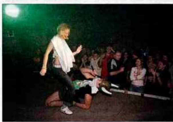
Brucovanja postajajo iz leta v leto boljša. Organizatorji tekmujejo, kdo bo pripravil večja in zanimivejša. Na sliki: kranjsko brucovanje.