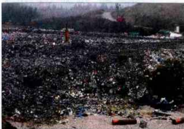
Za poletne večere na terasah pred hišami so Mlačani zaradi smrada z deponije prikrajšani.

Da bi bilo odpadkov za depoziranje čim manj oziroma da bi zadostili zakonodaji, ukrojeni po evropskih ekoloških standardih, bo treba na deponiji v Tenetišah v naslednjih treh letih zgraditi center za ravnanje z odpadki, ki med drugim vsebuje objekt in tehnologijo za predelavo ostanka odpadkov. Če bi center gradili le za šest "kranjskih" občin, po kriterijih ministrstva za okolje, prostor in energijo to ne bi bil regijski center, ki bi ga država sofinancirala, pač pa izključno finančno breme šestih občin, ki bi morale zbrati okrog pet milijard tolarjev. V ministru so zato predlagali center za ravnanje z odpadki za približno 100.000 prebivalcev, ki bi bil regijski, predvidoma eden od dveh na Gorenjski. To pa pomeni, da bi se odpadkom iz šestih občin morali pridružiti še odpadki iz nekaterih drugih gorenjskih občin, denimo, škofjeloških, v katerih dobrih 40.000 prebivalcev pridela blizu trinajst milijonov ton odpadkov na leto. Po predelavi bi, tako pravi projekt,