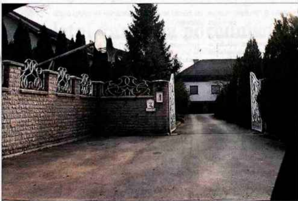
Stanovanjska hiša v Češnjevku.