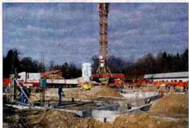
V Strahinju se že vidijo obrisi bodoče šolske stavbe in dvorane. V slednji se bodo ob športu družili tudi prebivalci občine Naklo.

ni stavbi za izobraževanje in šport. Zgrajena sta že hleva za govedo in konje. Prvega so naselili z živino, v drugem pa so