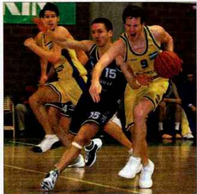
V prvi tekmi so slavili Ločani, za sredo pa oboji napovedujejo zmago.

Kranj - V 4. krogu pokala Spar sta se srečala nekdanja prvotigaška tekme Triglav in Loka Kava TCG. Z 80:76 (58:63, 44:44, 25:24) so bili boljši Škofjeločani.