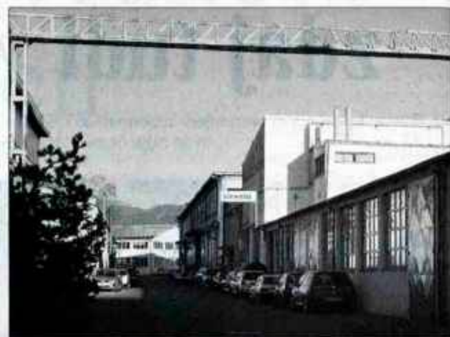
V poslovni coni Veriga imajo težave z urejanjem in upravljanjem skupne infrastrukture, kot so plinovod, vodovod, cesta, parkirišča...

In kako se poslovno industrijska cona oskrbuje z vodo? Ko je Elkoterm odpovedal upravljanje