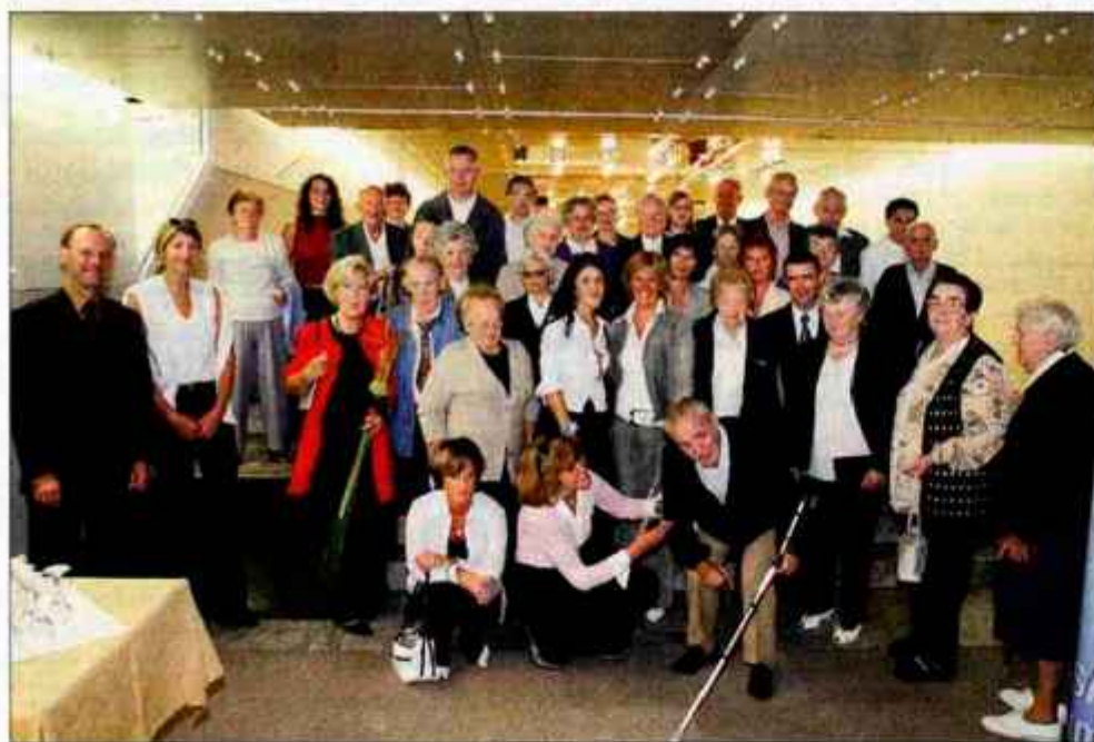
Podelitve nagrade v Ljubljani so se udeležili tudi varovanci doma.