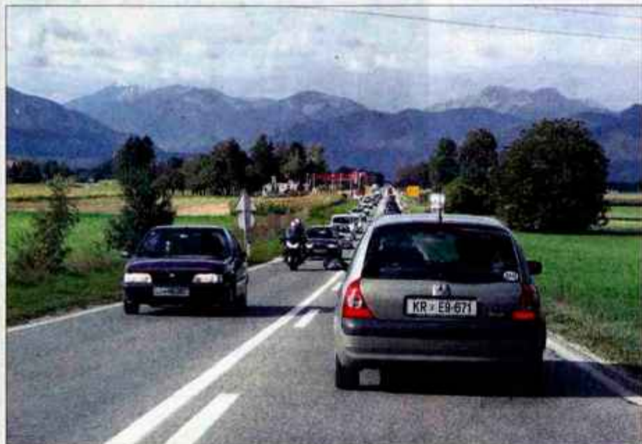
Odsek avtoceste Vrba-Peračica bo zgrajen do konca leta 2008.

Avtocesta mimo Radovljice bo delno poglobljena, bencinski servis bo zmanjšan, cestninska postaja pa bo pri Brezjah. Gradnja bo stala dobrih 16 milijard tolarjev.