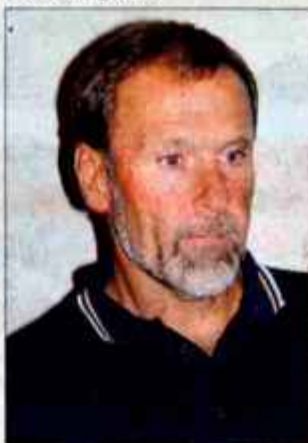
Viki Grošelj, najuspešnejši slovenski alpinist.

ki se je končala z nenavadno tekmo. Prijatelji so me dražili, da v njej nimam možnosti za uspeh. Če priborim vrh zase, se bo štel tudi za Slovenijo. Če bodo na vrhu drugi, sam ostanem brez točke. Tekmo s Slovenijo sem res izgubil s 14 proti 10, vendar menim, da to sploh ni slabo," je komentiral Viki Grošelj svoje dosežke v Himalaji, kamor se zahaja. Začetek oktobra namreč odhaja v Nepal na proslavo ob 50-letnici prvega vzpona na Čo Oju. Tam bo seveda tudi plezal.