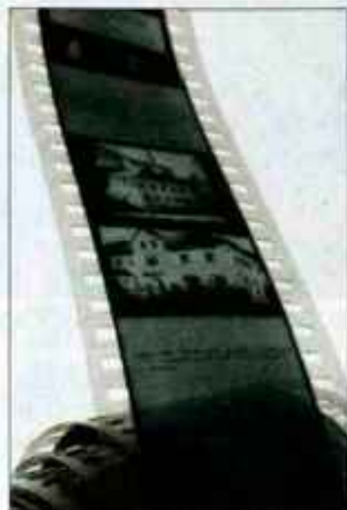
Restavrirani film

"Prepričan sem, da bi pripravljavci diafilma vsekakor za pripravo o svoji zanimivi zgodbi najraje izbrali obliko dokumentarnega kino filma, kar pa glede na čas nastanka filma pri nas ni bilo možno. Lahko trdim, da omenjeni film