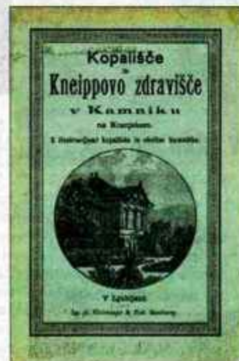
Naslovnica knjižice Kopalnišče in Kneippovo zdravilišče v Kamniku na Kranjskem.

- masaža, zdravilna telovadba in inhalacija;