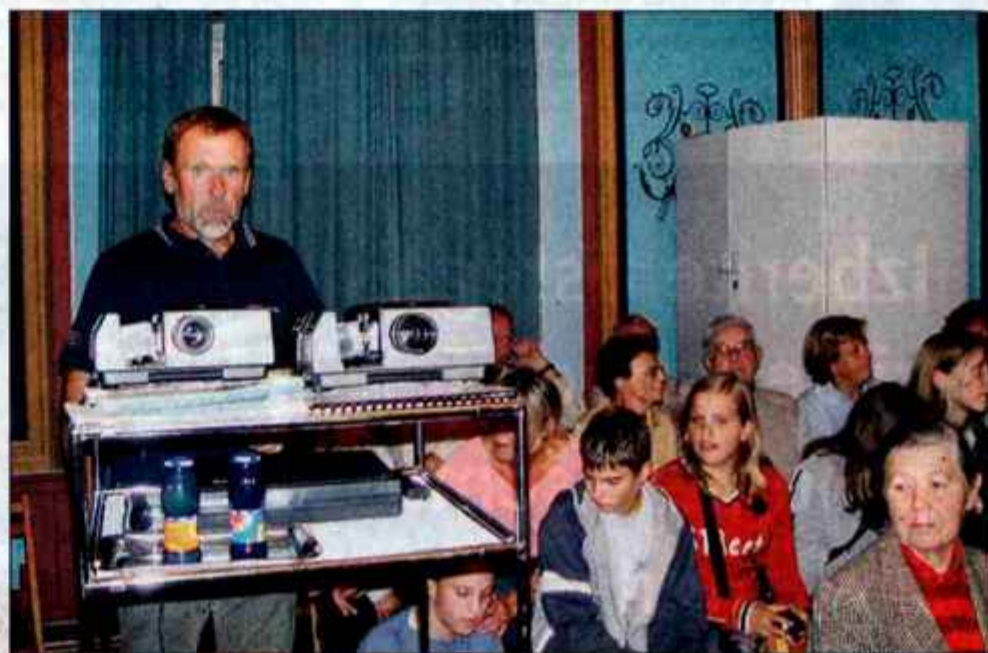
Predavanje je privabilo v dvorano muzeja številne ljubitelje gora.

"Če bi me vprašali, katera je moja najljubša gora med doseženimi desetimi vrhovi nad 8000 metrov, bi se težko odločil. Makalu je gotovo v vrhu, saj je leta 1975 presegel vsa pričakovanja že izbor v ekipo. Bil je moj prvi osemtisočak, na katero sta stopila tudi dva zelenca med izkušenimi alpinisti. Takrat sem ugotovil, da je treba poslušati starejše," je priznal predavatelj. Ob posnetkih na diapozitivih je pojasnil, da v visokih gorah ni šale. To je spoznal na naslednjih odpravah, kjer je ostal brez vrha. Leta 1979 so ga le 500 metrov pod vrhom Everesta ustavile težave z jeklenko kisika in ozeblina, za povrh pa si je škodoval hrbtnico. Lotse ga je zavrnil leta 1981, prvi vzpon na Manaslu čez dve leti pa je prekinila tragedija, v kateri je umrl tudi Neje Zaploutnik. Prijatelja so našli in pokopali leta 1984, ko je Grošelj le stopil na Manaslu . Od takrat pozna uspehe, a tudi tveganja. Leta 1986 je na odpravi v Pakistan stopil na dva vrhova gorovja Karakorum - Broad Peak in Gašerbrum 2 . Na slednjem je umrlo pet ljudi v neurju, Slovenci pa so srečno