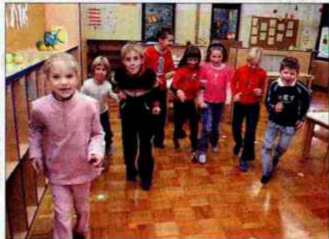
Učenci na Olševku so veseli novih prostorov.