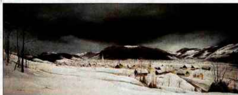
Na sliki Pavla Sedeja se lepo vidi, kako se v žirovsko ravan stekata dve dolini, Račevska in Sovra.

Od narave nam izročeno prizorišče žirovske zgodovine je torej z rdečimi in belimi naplavinami nasuta in še do nedavnih regulacij močno zamočvirjena kotlina, v katero se stekata dve izraziti dolini, Sovrina z juga in Račevska z jugovzhoda; na severu in vzhodu jo zapirajo razmeroma položna pobočja Žirovskega vrha, od juga in zahoda se vanjo spuščajo strmine, nad katerimi se raztezajo