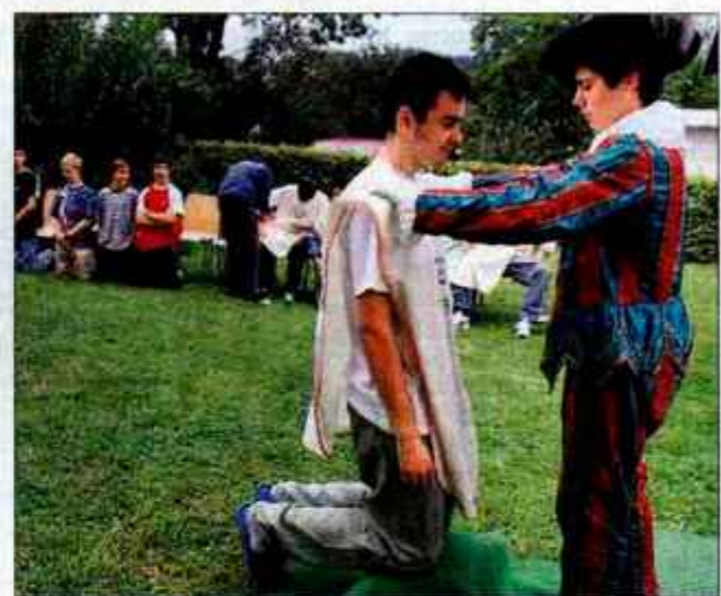
Graščak je vsakemu novincu, ki je uspešno preстал vse preizkušnje, izročil plašč šole, s katerim jih ostali dijaki simbolno sprejmejo medse.

Bled - Pred dijaškim domom na Bledu so minuli teden pripravili tradicionalni krst novincev ob sprejemu v dijaški dom. V primerjavi s preteklimi leti je bil letošnji krst nekaj posebnega, saj se je odvijal v znamenju tisočletnice Bleda. Desetim dijakom novincem so zato pripravili sprejem v grajskem slogu.