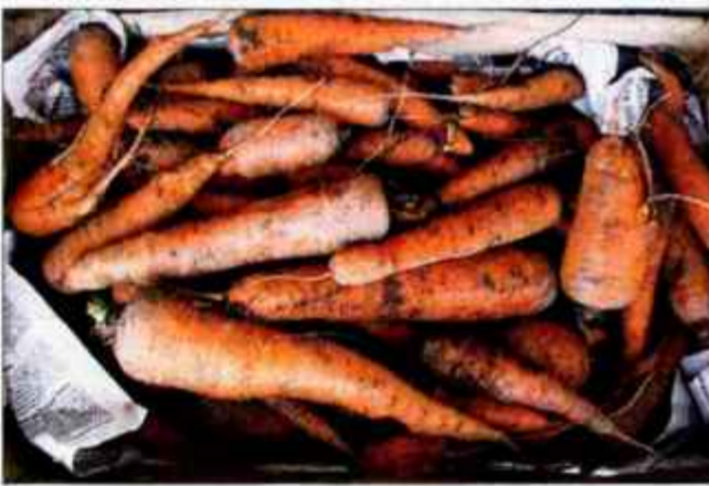
Zgodnje korenje smo že pripravili.

Približno mesec dni korenovke lahko ohranimo tudi tako, da jih pripravimo v plastično posodo. Na ta način zasipnico odpiramo le enkrat na mesec. Korenovke v plastično posodo shranimo tako, da no dno položimo časopisni papir. Nanj naložimo plast zelenjave, nanjo pa spet plast papirja. Nanj spet položimo korenovke, na koncu pa mora biti v posodi papir. Tega dobro zatlačimo, tako da ni zraka med plast-