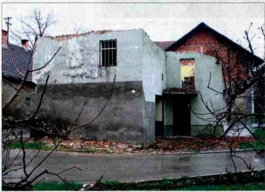
Samo za odkup zemljišč in objektov ter njihovo rušenje ob cesti Spodnji Brnik - Zgornji Brnik so odšteli okoli 130 milijonov tolarjev. Na sliki starejši objekt, ki so ga podrli v Zgornjem Brniku.

Z nekajmesečno zamudo bodo v naslednjih dneh začeli z rekonstrukcijo državne ceste na Spodnjem Brniku.