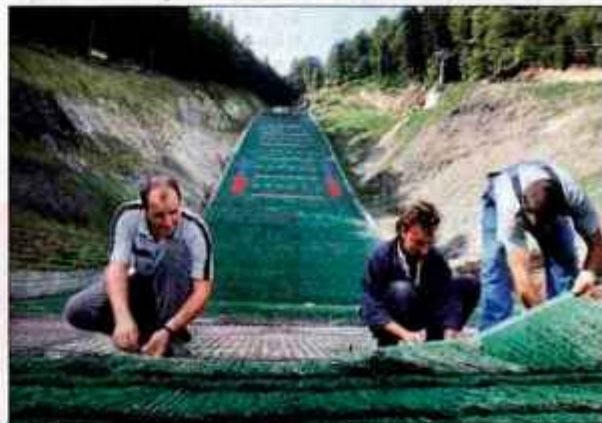
Kranjska skakalnica, na kateri ta teden hitijo opravljati zadnja dela, je ena najsodobnejših in največja srednja skakalnica pokrita s plastiko v Evropi.