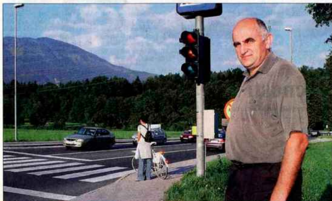
Franc Peternel vztraja, da bo celotno podvinsko križišče urejeno s semaforji.

Prebivalci krajevne skupnosti Mošnje zahtevajo ureditev križišča z glavno cesto v Podvinu, ki je še vedno nevarno.