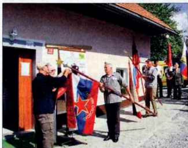
Na slovesnosti na Puču so na prapore gorenjskih partizanskih odredov pripeli slavnostne trakove.

nosti in pokrajinskega vodstva OF in KP ter 35-letnice ustanovitve treh odredov Teritorialne obrambe na Gorenjskem. Puč je bil upravičeno izbran za kraj proslave, saj sta bila med drugim septembra leta 1944 tu