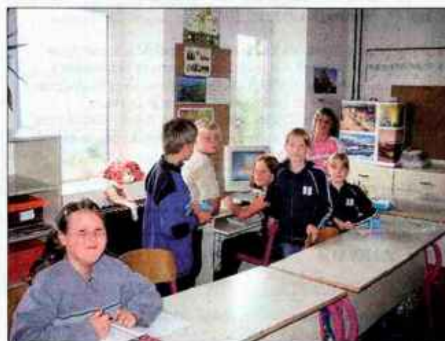
Učenci 3. in 4. razreda med odmorom radi zaigrajo kakšno računalniško igrico.

Zgornje Palovče, Trebelno in Velika Lašna, v ničemer niso prikrajšani od vrstnikov v večjih osnovnih šolah. Poleg pouka imajo tudi dodatne dejavnosti, za katere skrbita učiteljici sami. Obiskujejo lahko pravljčni, likovni in recitatorski krožek, učenci tretjega in četrtega razreda imajo tudi angleščino, ena od posebnosti šole pa je ta, da vsi otroci, sicer neobvezno, v okviru šole obiskujejo tudi verouk, pri čemer so verjetno edina šola