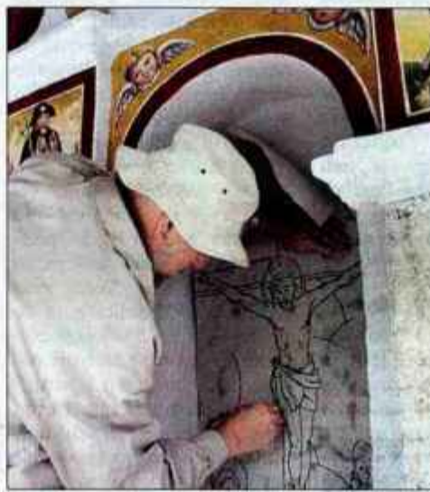
Motiv je potrebno najprej v enakih merah prenesti na omet, nato pa sledi poslikava.