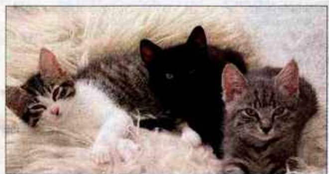
Nov dom tokrat iščejo deset tednov stari siv, črn in tigrast muček. Mucki so vajeni čistoče, njihovo najditeljico pa je mogoče poklicati na telefonsko številko 040 692 963.