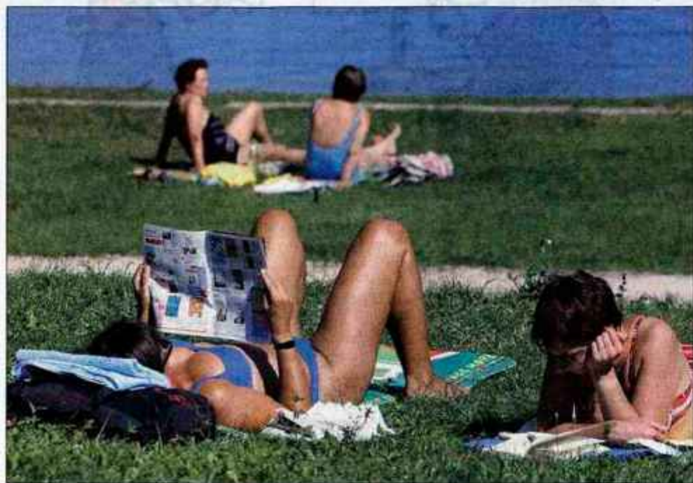
Poletje se posavlja, kopalni dnevi, kot kaže posnetek, bodo bolj redki, turistični delavci pa že ocernjujejo sezono.

Gorenjske lokalne turistične organizacije pripisujejo porast števila gostov in nočitev v primerjavi s prejšnjimi leti bogatejši turistični ponudbi.