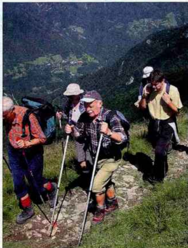
Izkušen planinec se bo v gore odpravil dobro opremljen in pripravljen na vsa presenečenja.

Kot je še pojasnil, je vidna razlika med italijanskimi in avstrijskimi planinci ter slovenskimi. Prvi so zelo dobro opremljeni, če ne celo že kičasti, slovenski pa so prej pomanjkljivo kot pa dobro opremljeni. "V tujini so zahteve zavarovalnic že naredile svoje. Če planinec ni ustrezno opremljen, mu zavarovalnica ne izplača nobene od-