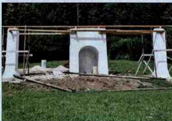
Tinetov kozolec s kapelico v Dražgošah bo prava paša za oči.

Turistična pot Dražgoških spominov bo zajemala tudi ogled spomenika, Bičkove skale, vzletišča jadrskih padalcev, staro pokopališče, objekt za sušenje lanu, cerkev in seveda Tinetov kozolec. Na zidanemu delu bodo v kratkem pritrtili tudi leseno kritino "šinkeljne", sledi pa še najimnitnejši del - poslikava kapelice. Po dogovoru s