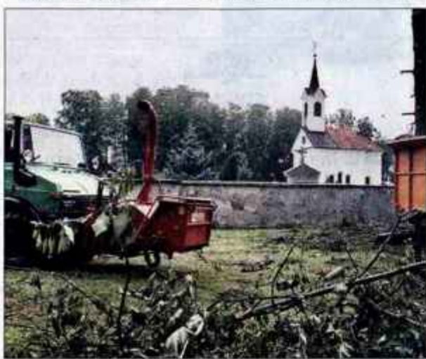
Po odstranitvi dreves in prekopu nemških vojakov naj bi to mesto zasedli avtomobili.

Škofja Loka - Ministrstvo za delo, družino in socialne zadeve je že leta 2000 izdalo dovoljenje za prekop posmrtnih ostankov nemških vojnih ujetnikov za mestnim pokopališčem v Škofji Loki. Zaradi večjih dreves je bil prekop prekinjen, občina pa se je pred dne-