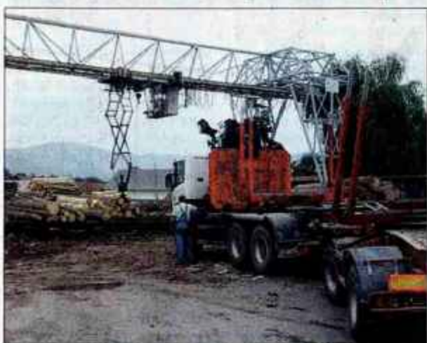
V obratu Egolesove žage razžagajo le še slabo tretjino lesa iz lastne gozdarske dejavnosti.