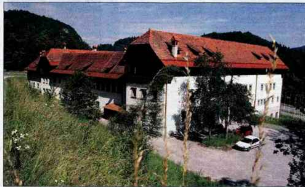
Blejska Pristava