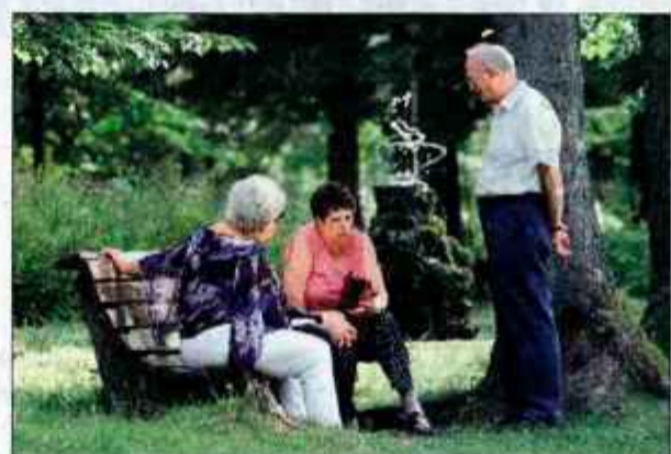
Z novim domom za starejše občane bi Bohinjci na stara leta lahko ostali v domačem okolju.

Tako so na izredni seji odločili bohinj-ski občinski svetniki in s tem prižgali zeleno luč gradnji doma za starejše. Omenjeno zemljišče, veliko je okrog 5000 kvadratnih metrov, je občinska last in zemljišče je bil tudi edini pogoj države, da v Bohinj zgradi tak dom. Občina Bohinj bi ga raje zgradila v Srednji vasi, v bližini tamkajšnjega župnišča, vendar ni našla na razumevanje župnika ter gospodarjev in ključarjev cerkvenega premoženja. "Predlagali smo, da bi nam župnišče svoje zemljišče, ki je tudi predvideno za gradnjo doma starejših, prodalo,