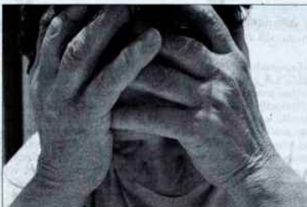
Glavobol je spremljajoč znak številnih bolezni in greni življenje kar 96 odstotkom ljudi.

Glavni problem je, da le okrog 40 odstotkov ljudi, ki trpijo za migreno, pride do zdravnika.