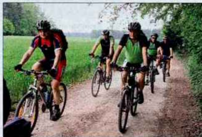
Sobotni kolesarji so imeli srečo z vremenom.

lici Škofje Loke vodi mimo številnih kulturnih in naravnih znamenitosti in je namenjena srednje kondicijsko pripravljnim kolesarjem z gorskimi kolesi. Za krajšo in manj zahtevno (družinsko) možnost, ki se izogne dvema vzponoma, so pri-