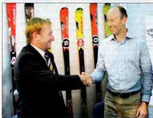
Znova na istem bregu: Bojan Križaj in Ingemar Stenmark.

Begunje - Begunjski Elan se želi vrniti na pota stare, a že dolgo izgubljene slave. Pri uresničenju velikopoteznih načrtov mu od prejšnjega tedna naprej pomaga Šved Ingemar Stenmark, največji alpski smučar vseh časov, ki je v sedemdesetih in osemdesetih letih prejšnjega stoletja na Elanovih smučeh nanizal nedosegljivih 86 zmag v svetovnem pokalu, osvojil tri velike kristalne globuse, po osem malih v slalomu in veleslalomu, dve zlati olimpijski odličji in tri naslove svetovnega prvaka.