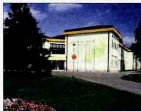
Sedanja šola v Cerkljah.