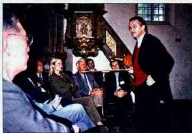
Navdušeni poslušalci Poslovne šole za Management so dobili nov elan.

vsem ljudi iz poslovnega sveta, da doživijo dvig svojega duha, bo Komisija za evropsko identiteto na ta način dekomponirala evropsko človeško družbo in jo na novo skomponirala. "Iz evropske družbe bomo vzeli naražen elemente kulturnega življenja, zakonodaje, gospodarstva in jih potem na novo skomponirali, tako da bo nastala potencialna evropska družba kot umetnina. Evropska družba bi morala biti umetnina, ne pa samo ena pragmatična sestavljena iz števil in računov. Tej umetnini se reče socialna arhitektura, ki mora stati sigurno. Zato sedaj začenjam z novim projektom, ko bom imel v vsaki prestolnici članice Evropske skupnosti poseben show na radiu, kamor bom povabil najbolj prodorne umetnike in gospodarstvenike, da bomo razpravljali o tej kristalizaciji evropske identitete. Nato se bodo stvari stopnjevale še z dodatnimi projekti, ki bodo pripomogli k združevanju umetnosti in gospodarstva, saj je za bodočo Evropsko družbo najbolje,