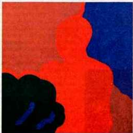
Figura v naravi, 1970, akril, platno, 70 x 70 cm, lastnik je Gorenjski muzej Kranj.

Galerija Prešernovih nagajencev Glavni trg 18, Kranj