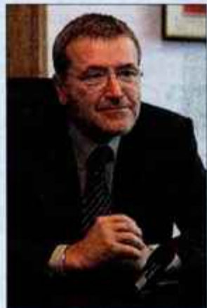
Dr. Dušan Keber

Najpogostejša vprašanja in pripombe sogovornikov je minister Keber strnil v štiri sklope. V prvem so že omenjene čakalne dobe. "Ljudi moti, zakaj - potem ko že pridejo k zdravniku - preiskave trajajo tako dolgo, zdravljenje pa se vleče pol leta ali celo leto. Medtem je kakovost življenja bolnika izjemno slaba. Ljudje trpijo, država pa