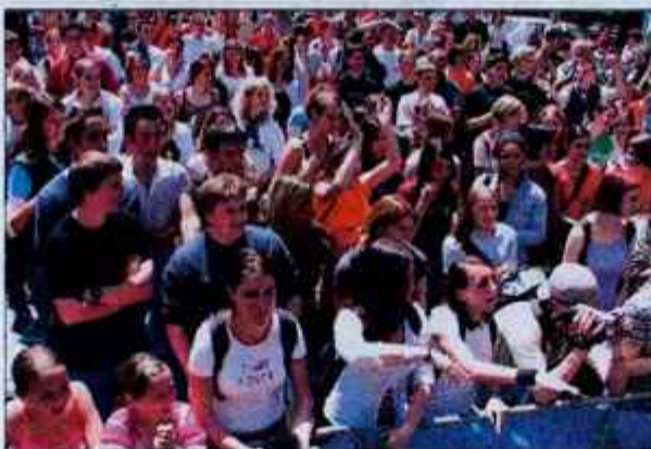
Zadnja velika srednješolska zabava bo potekala na Slovenskem trgu.

Plesna šola Urška bo v ples maturantov vpletla naslednje Srednje šole iz Kranja: Srednjo biotehniško šolo, Ekonomsko šolo, Gimnazijo, Srednjo tekstilno, obutveno in gumarsko šolo, Srednjo trgovsko šolo ter Srednjo elektro in strojno šolo. Vsem tem maturantom pa se bodo pridružili tudi dijaki zaključnih letnikov Gimnazije Jesenice, Srednje gostinske šole Radovljica ter Ekonomsko turistične šole Radovljica.