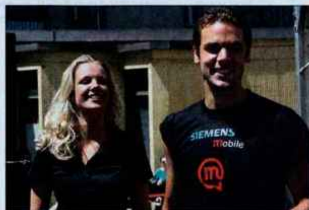
Izbrali bomo finalista za izbor kralj in kraljica maturantov.