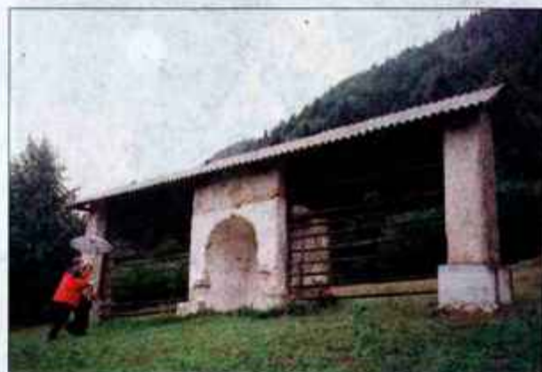
Nekdaj je mimo kozolca vodila procesija Sv. Rešnjega telesa. Ko so naredili novo pot, so njih je postavili drugo kapelico, ki pa so jo Nemci med drugo svetovno vojno porušili in je ni več, kip pa je shranjen v cerkvi sv. Lucije.