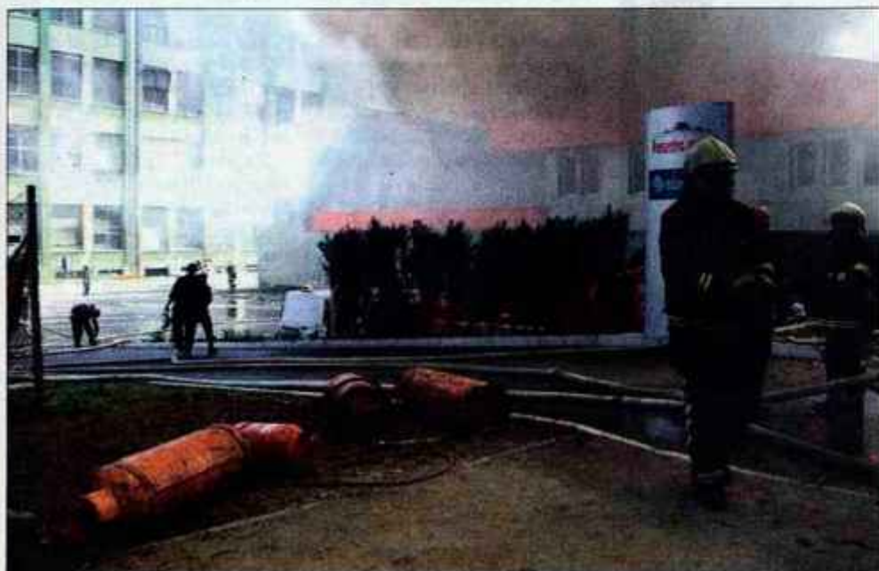
Jeklenke, napolnjene z butan propanom, so gasilci pravočasno umaknili s strehe.

rem so bili poleg pekarne tudi poslovni prostori podjetij GM foto in Sumont ter nekaj praznih skladiščnih prostorov.