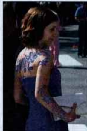
V petek bodo maturanti zasijali v vsem svojem sijaju.

Po končanem uradnem delu se bodo mladi ob njihovem naj-