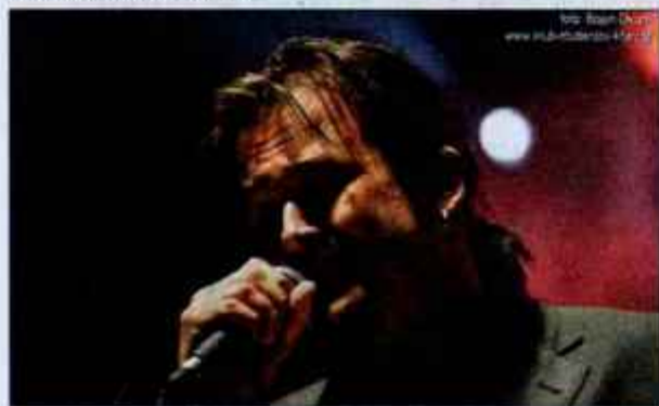
Da bo Gibonni koncert hit, se je vedelo že vnaprej.

V soboto, 15. maja, se je v Kranju s koncertom popularnega hrvaškega pevca Gibonnija zaključil letošnji Teden mladih, ki nam je postregel z nadvse kakovostnim programom. Koncert Gibonnija je privabil številne oboževalce in s tem poskrbel za dober zaključek letošnjega Tedna mladih.