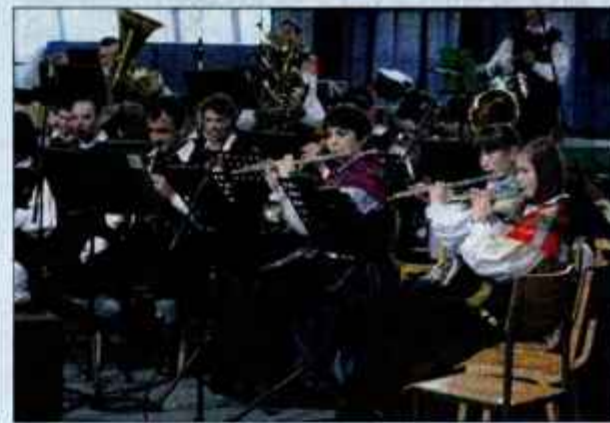
Domači Pihalni orkester Alples se je z zlato plaketo uvrstil v višjo zahtevnostno stopnjo.

Železniki - Minuli konec tedna je Športna dvorana Železniki gostila godbenike na 24. slovenskem tekmovanju v četrti in drugi težavnostni stopnji. Nastopilo je 18 orkestrrov ali skupaj več kot 900 godbenikov.