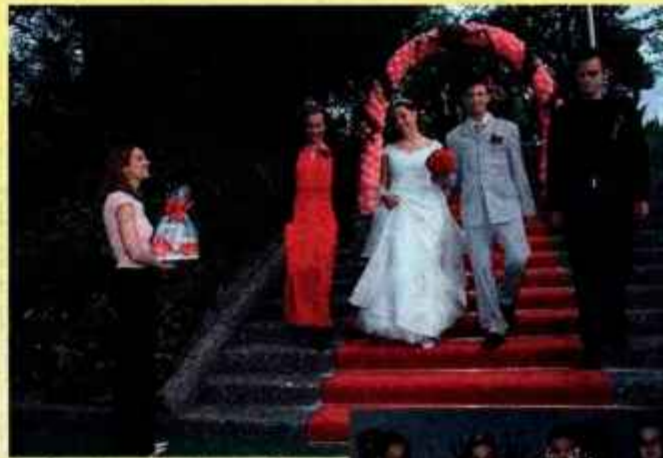
Slavnostni sprejem v Hotelu Creina.