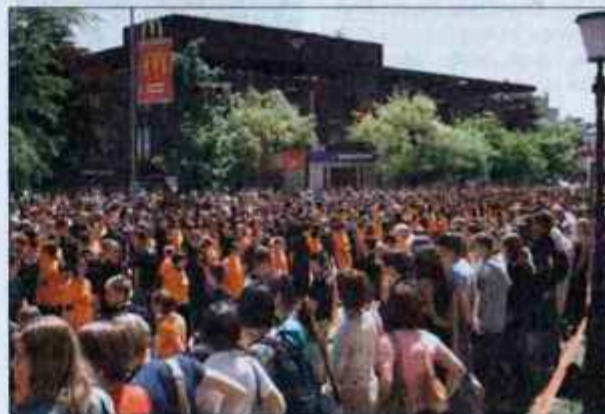
Zaradi množice praznujočih maturantov bodo zaprte ceste v mestnem jedru.

bo ostal praznih rok. Njuna nagrada bo enodnevni izlet. Komisija, ki bo ocenjevala pare maturantov, bo sestavljena iz enega predstavnika iz vsake srednje šole in enega predstavnika organizatorjev.