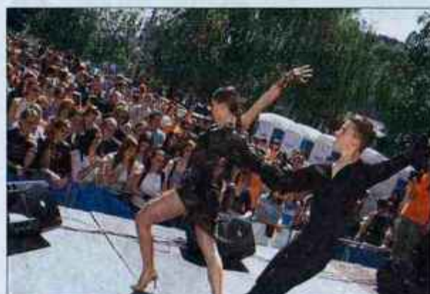
Na zabavi se bodo predstavile tudi plesne skupine.

zmagovalni par pripravili vroče poletno potovanje za dve osebi, zlatnike LON v skupni vrednosti 44.000 tolarjev, kot trajen spomin na zaključek brezskrbne dijaške poti, drugo uvrščeno bo Planika podarila kvalitetna nahrbtnika za potovanja po hribih, dolinah ali gorah, ter enodnevni izlet. Tudi tretje uvrščeni par ne