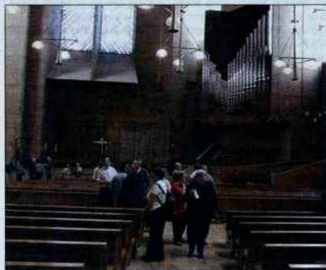
Ameriške katoliške cerkve so sodobno grajene in opremljene. Na sliki je notranost bazilike v Los Angelesu.

kvijo in državo". To pa ne pomeni, da je država sovražnik religij. Daleč od tega.