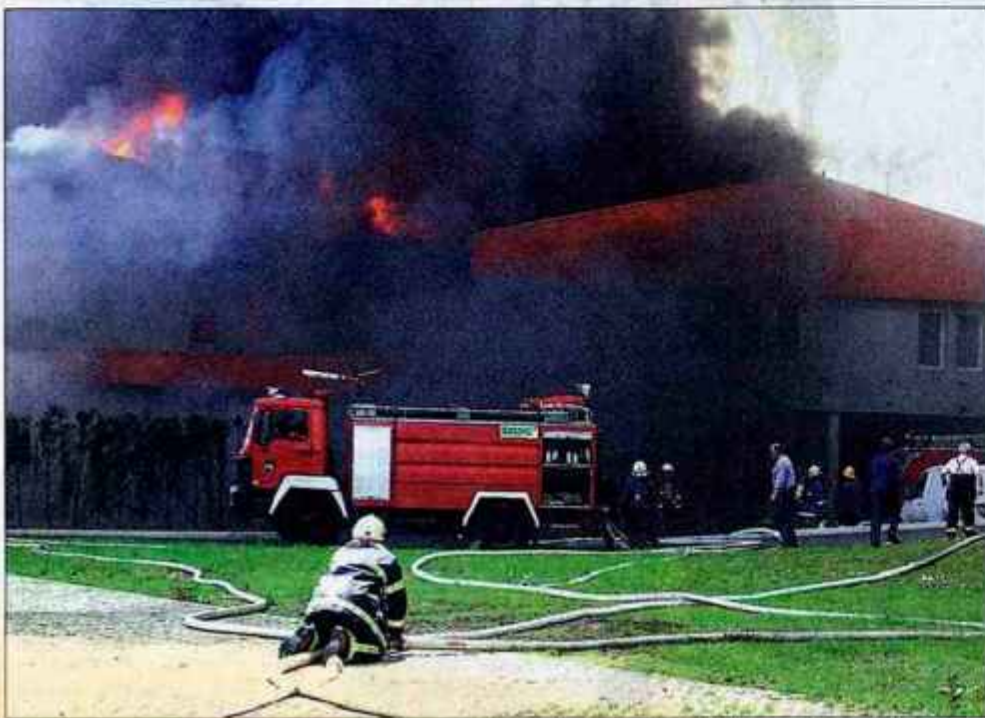
V požaru so popolnoma zgoreli vsi poslovni prostori kranjskih zasebnih podjetij.

Sobotni požar na poslovnih prostorih v Savski Loki je povzročil za pet milijonov evrov škode. Gasilci so imeli težave s hidrantrnim omrežjem.