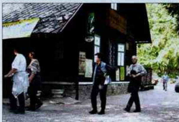
Na slovesnosti ob petdesetletnici koč se je zbrala množica ljudi.

Planinsko društvo Janez Trdina je pred petimi desetletji odprlo koč na Gobavici.