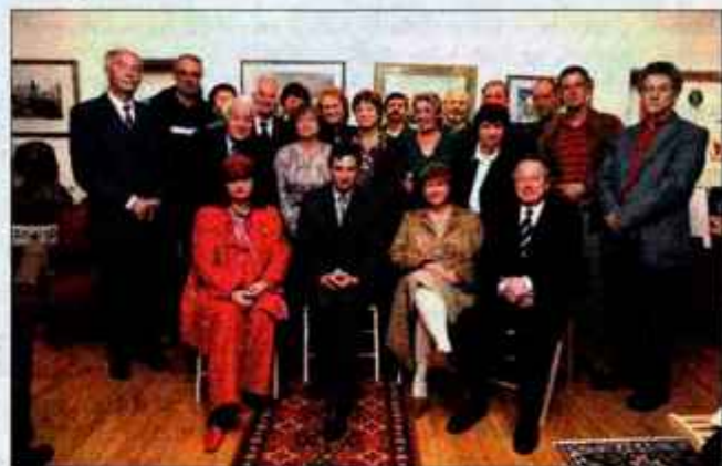
Ustvarjalci tokratne razstave se predstavljajo z biseri Slovenije.

Gorenja vas - Skupina slovenskih akvarelistov je v počastitev vstopa v Evropsko unijo v Galeriji Krvina predstavila vzorčne izdelke za promocijo Slovenije v EU z naslovom Slovenija s svojimi biseri v Evropski uniji.