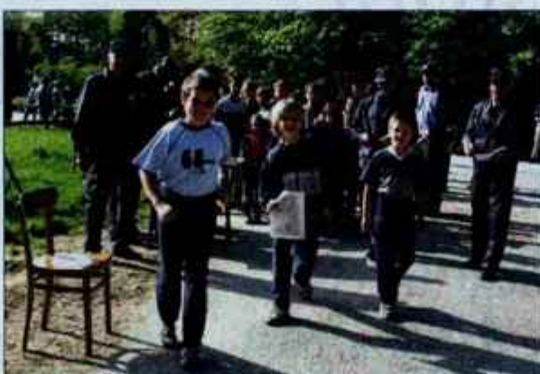
Prva ekipa orientacijskega tekmovanja je uspešno startala.