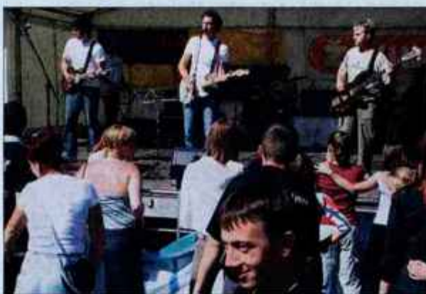
Paradi bo sledila tudi zabava s šolskimi bendi.

Tudi letos bo 21. maja, na ulicah v vseh večjih mestih po Sloveniji, zaplesalo na tisoče maturantov in maturantk, ki s svojo znamenito četvorko zaključujejo svojo srednješolsko pot. V Kranju se bo temu dogodku pridružilo veliko srednjih šol s svojimi maturanti, zato bodo v petek naredili sprevid maturantov skozi mesto.