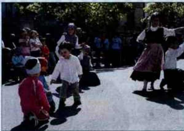
Otroci so skupaj s starši preživeli prijetno sončno dopoldne na Loškem placu.

Škofja Loka - V soboto je Lokalna akcijska skupina za preprečevanje zasvojenosti ob mednarodnem dnevu družine pripravila vrsto delavnic za starše in njihove najmlajše.