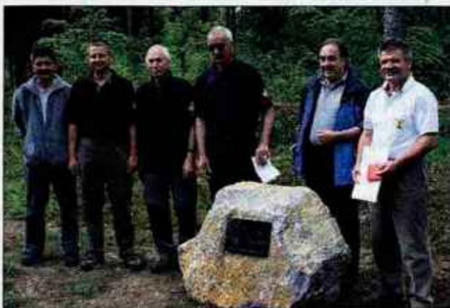
V nedeljo popoldne so odkrili spominsko ploščo s temeljnim kamnom za novi planinski dom PD Komenda.