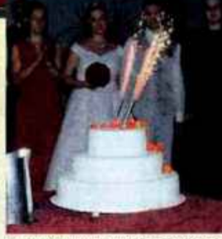
Prečudovita poročna torta Kraljevega mignona.

Ob živi glasbi Express banda in čudovitem voditelju Kondiju Pižornu je slavlje potekalo do zgodnjih jutranjih ur.