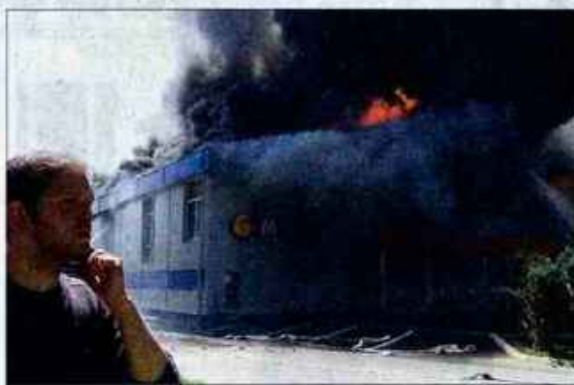
S sobotnim požarom se je borilo 28 poklicnih in okoli 70 prostovoljnih gasilcev iz vseh kranjskih prostovoljnih društev.

lo. "Zaradi velikega hkratnega odvzema vode je padel tlak. Dokler nismo s pomočjo prostovoljnih gasilcev uredili črpanje vode iz Save, je bilo nemogoče gasiti," je razložil Klemenčič. Na srečo so uspeli še pravočasno zavarovati v poslojpu uskladiščeno kurilno olje in fotografske kemikalije, s strehe pa odstranili nevarne plinske jeklenke. "Ne vem, zakaj niso imeli postavljene požarne varnosti, saj bi jo pri ta-