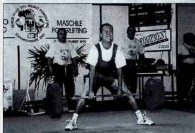
Romanov najboljši rezultat je 8. mesto na svetovnem prvenstvu v triatlonu moči v Italiji.