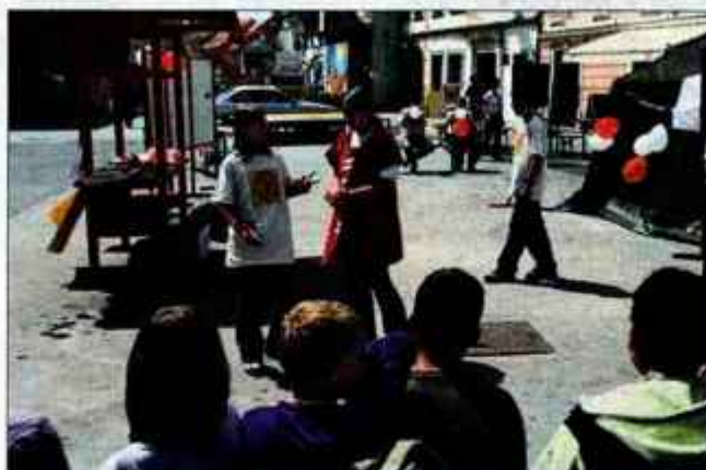
S stojnico v središču Kranja so učenci želeli opozoriti na svoj projekt, v katerem bi združili kranjske osnovnošolce.

bile mogoče primerne zanje, pa so razpršene in se jih iz tega razloga prav tako ne udeležujejo. Vse to jih je spodbudilo, da so začeli razmišljati o svoji prireditvi, kjer bi se srečali učenci vseh kranjskih osnovnih šol, kasneje pa bi k sodelovanju pritegnili še druge gorenjske in mogoče celo slovenske osnovne šole. Za kraj dogajanja so si izbrali igrišče ob šoli na Planini, srečanje osnovnošolcev pa bi organizirali večkrat na leto, in sicer ob sobotah. "Osnovnošolci bi se lahko družili brez prepovedi staršev zaradi