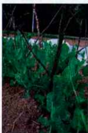
Grahu smo postavili oporo.