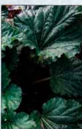
Iz stebel rabarbare pripravimo okusne sladice.

Kljub temu da je letos zaradi nizkih temperatur za vrtničarje bolj pozno leto, je rabarbara toliko zrasla, da jo že jemo. Uporabljali jo bomo tja do konca junija. Če rastlin ne zmremo sproti uporabiti, stebila razrežemo na kocke, malo potresemo s sladkorjem in zamrzemo. Lahko pa naredite tudi vino ali pa kompot. Rabarbara je rahlo odvajalno sredstvo in je ne smemo uživati v velikih količinah. Uporabljamo stebila, liste pa upora-