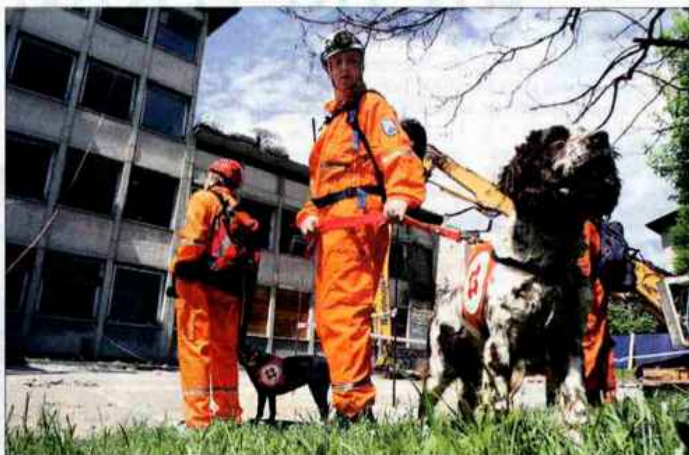
Pes - odličen v iskanju pogrešanih.

več reševalnih ekip. Prva ekipa se je z avto lestvijo povzpela do tretjega nadstropja in ujetim "zaposlenim" pomagala na varna tla. Druga je reševala ujete v drugem nadstropju in jih spustila na varno z vrvno žičnico, tret-