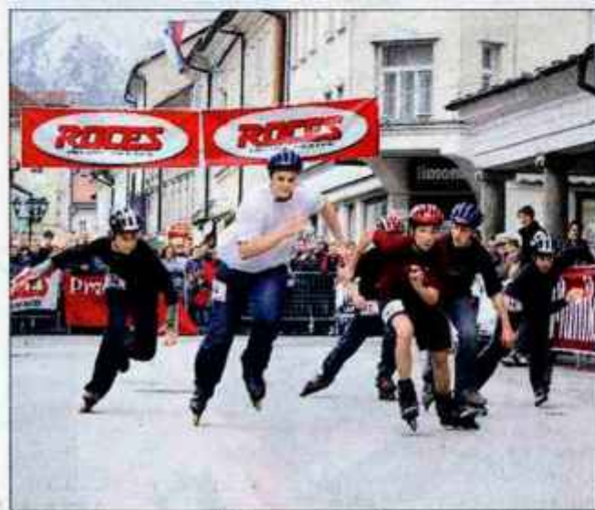
Rolanje je za mnoge najljubša rekreacija, tekma pa zgolj zabava.

Sedaj pa 22. maja sledi 3. Tek Suša 2004, ki ga organizirajo v Zalem Logu, 29. maja pa 4. tek na Križno Goro, ki pa ga organizira Športna zveza Škofja Loka. Alenka Brun