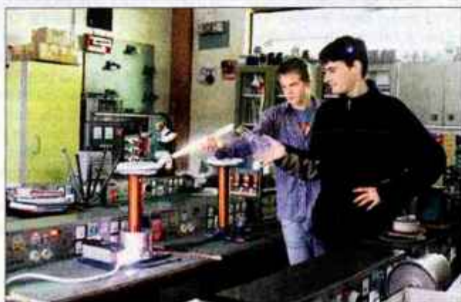
Prenos energije po zraku s pomočjo Teslovega transformatorja.

tudi razpoloženje ljudi v njem. "Izdelala sva ga predvsem za za-