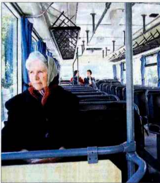
Slovenski avtobusi so vedno bolj prazni.

"Alpetour je lani s poslovanjem v temeljni dejavnosti ustvaril za 19 milijonov tolarjev dobička, če pa upoštevamo lansko dezinvestiranje - prodajo vozil rent a cara, ugotovimo, da smo s prevozi imeli za 11 milijonov izgube. Ob celotnem prihodu 2,4 milijarde tolarjev pa smo imeli prihodke še iz drugih dejavnosti in financiranja, zato je bil končni rezultat 80 milijonov dobička. Čeprav je to morda uspešen poslovni rezultat, pa je dejstvo, da se moramo v bitki za obstanek ukvarjati z drugimi dejavnostmi, kot je naša temelj-