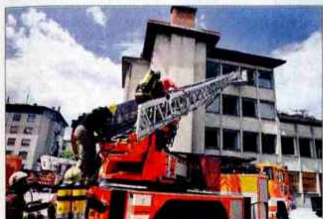
Po gasilski avto lestvi varno na tla.