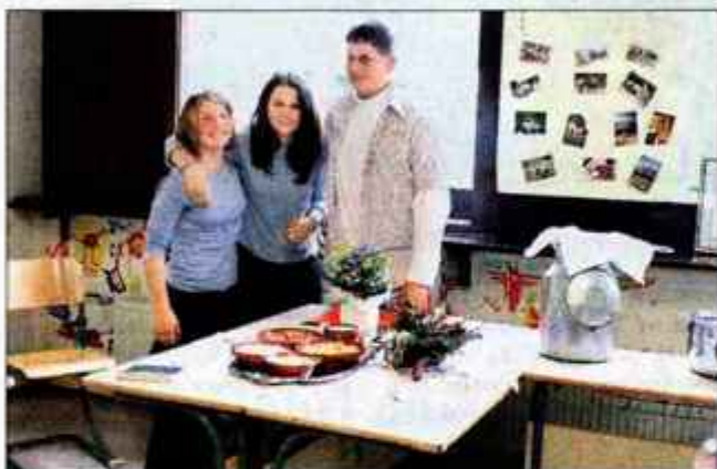
Osnovnošolci iz Naklega so spoznavali življenje na kmetiji in planšariji.

Kranj - Na Srednji elektro in strojni šoli Kranj se je v soboto odvijalo 13. regijsko srečanje mladih raziskovalcev gorenjskih srednjih šol in 4. regijsko srečanje mladih raziskovalcev gorenjskih osnovnih šol. S svojimi raziskovalnimi nalogami je sodelovalo 154 dijakov, ki so skupaj pripravili 86 nalog z dvajsetih področij, 87 učencev pa je predstavilo 38 nalog z desetih področij.