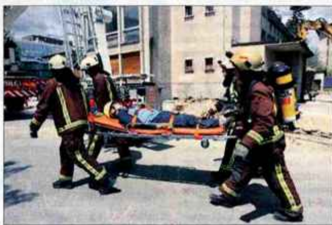
Tudi edinega ranjenca so iz delno porušenega in gorečega doma pravočasno rešili.