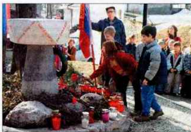
Z letošnje svečanosti pri spomeniku padlim v Šorlijevem mlinu.

Odziv krajanov na otvoritev je bil velik, celo boljši od pričakovanj. Prav nerazumljivo pa je, da se slovesnosti ni udeležil nihče iz mestne občine Kranj, čeprav je KS poslala kar nekaj povabil. Kot da so že pozabili, da je občina Nejca Zaplotnika le nekaj mesecev nazaj posmrtno