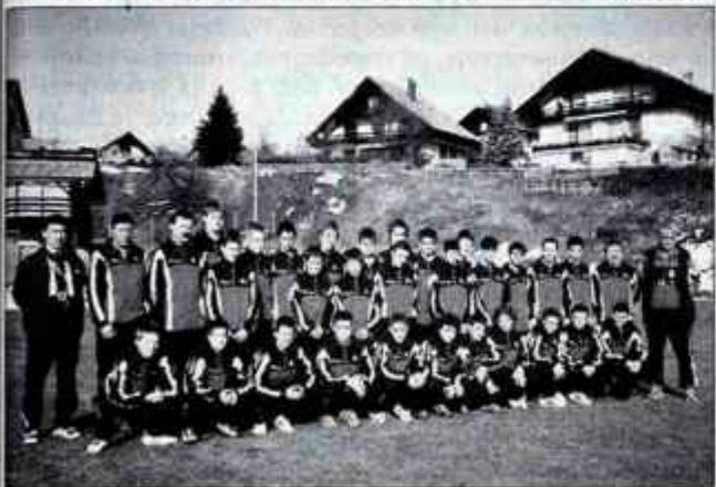
V Britofu je za nogomet vsako leto več zanimanja, mladih pa trenutno trenira že okoli 140.