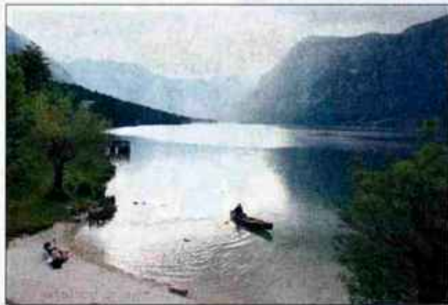
Novi zakon o TNP naj bi zavaroval naravne danosti krajev v bohinjki občini.

"Argumenti niso utemeljeni. Najprej moram pojasniti, da lokacija za omenjeni hotel ni na Fužinarskem polju, ampak zunaj njega, in odveč je tudi strah, da lastniki zasebnih sob ne bi imeli več dela, kajti gostje, ki sedaj bivajo v sobah, ne bodo šli v novi hotel, saj bo predrag. Če bi lastniki želeli začeti graditi, bi to lahko storili, saj je gradbeno dovoljenje še vedno veljavno. Čakajo le zaradi nasprotovanja okolja. Hotel Lev je v novem hotelu predvidel 500 postelj, občinski svet je to zmanjšal na 300, sedaj pa se dogovarjamo z lastniki, da v novem hotelu, ki bi bil razdeljen v tri stavbe v alpskem slogu, vsi prostori za rekreacijo in sprostitve bi bili pod zemljo, ne bi bilo več kot 250 postelj. S petičnimi gosti bi tudi občina več zaslužila in s