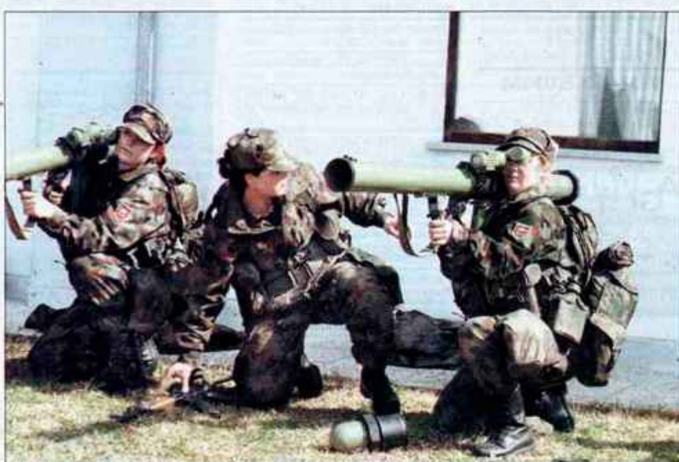
V centru ni razlik med moškim in ženskim usposabljanjem.