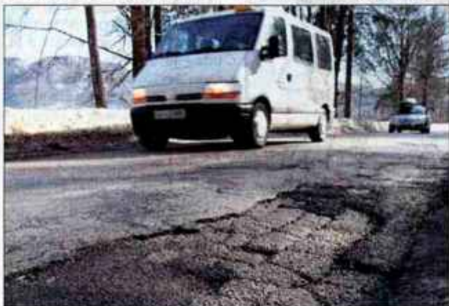
Bohinjske ceste so potrebne temeljite obnove in so slaba izkaznica za turistični kraj.

ljalec zakona je naletel na velik odpor in je s svojim prvotnim predlogom razdelil ne le bohinjko, ampak slovensko javnost. Sama sem se pri predlaganih spremembah meja strinjala le z izločitvijo Ukanca iz centralnega območja TNP. Sporne so bile predvsem meje in Fužinarsko polje, po vseh popravkih pa je sedaj meja tam, kjer je bila. Vsa izguba energije in vsi prepri so bili nepotrebni. Končno smo le podprli predlagane spremembe in dorekli, da se Fužinarsko polje zavaruje pred posegi in vesele sem, da na ministrstvu za okolje, prostor in energijo v okviru zakona o vodah pripravljajo pravilnik o priobalnem pasu, ki bo določil, kaj je ob jezeru dovoljeno in kaj ne. Na Fužinarskem polju in v priobalnem pasu posegi torej ne bodo dovoljeni, zato je strah pred pozidavo odveč."