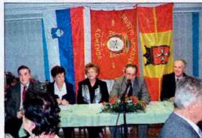
Delo društva so ocenili na občnem zboru.