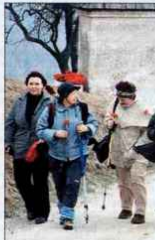
Vsaka mati, dekle, žena ob obisku Limbarske gore prejme nagelj.