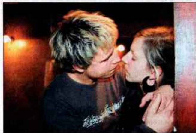
Ljubezen je v zraku.

Študentska založba Litera je danes dopoldne v Mariboru predstavila dve knjižni novosti