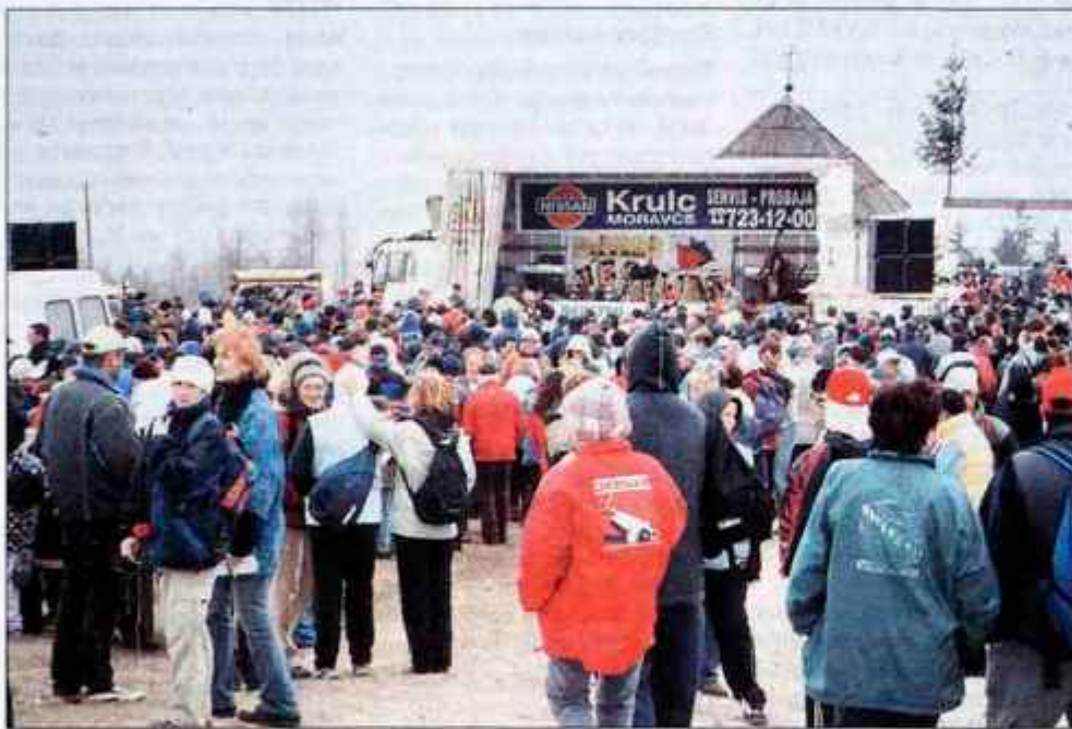
Številni obiskovalci Limbarske gore ostanejo na gori ves dan. Slabo vreme in veter ljudem nista povzročala večjih preglavic.

Pohod po nagelj na Limbarsko goro spremlja celodnevna prire-