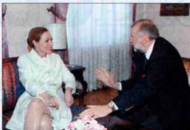
Benita Ferrero Waldner in dr. Dimitrij Rupel.

želi, ugodnejši volilni izid v primerjavi s preteklimi volitvami pa so dosegli tudi zeleni. Porazena koroških volitev je vladna ljudska stranka. Enotna lista kot stranka Slovencev na Koroškem tokrat ni samostojno sodelovala na volitvah, ampak je priporoči-