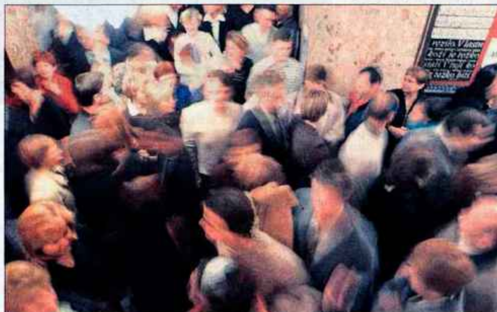
Polno, v dvorani in pred njo.