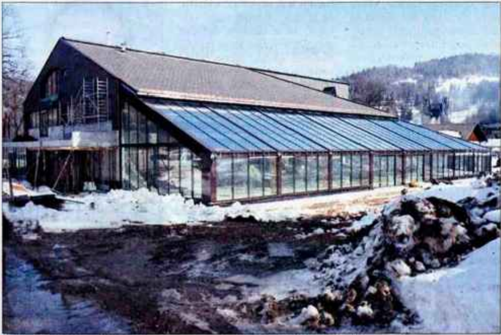
Občina Bohinj prodaja svoj delež v vodnem parku, ki naj bi ga kmalu odprli.

Domačini in Gorenjsko ekološko združenje nasprotujejo gradnji hotela in zahtevajo celo referendum proti gradnji. Ali se vam zdijo argumenti proti gradnji neutemeljeni?