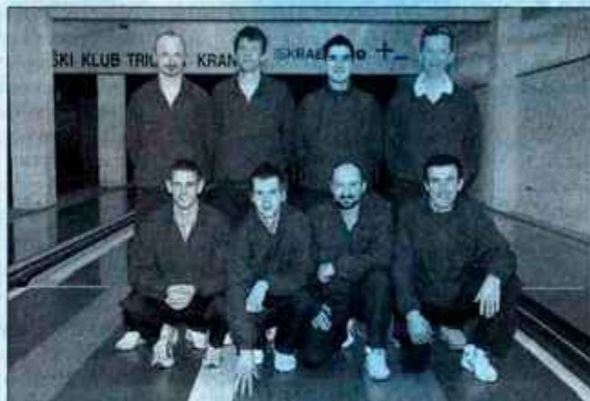
Naslov prvakov so tudi letos osvojili kegljači Iskraemeca.

Minuli konec tedna pa sta ekipi Iskraemeca in Triglava igrali v evropski ligi. Kegljjači Iskraemeca so na kegljišču v Kranju gostili moštvo romunskega Galatija in igrali izenačeno 4:4 (3437:3443), kegljačice Triglava pa so se v Celju pomerile s slovenskimi prvakinjami in izgubile s kar 8:0 (3171:2952). Povratne tekme bodo na sporedu 24. aprila.