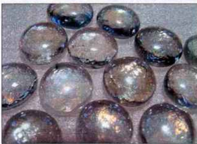
Revolucionarni generatorji za tahione, ki potujejo hitreje od svetlobe in vnašajo v materialni svet luč in zavest enosti.

Ugotovila sta, da se tahionski generator zaradi svojih lastnosti in delovanja lahko uporablja na različne načine. Kot dopolnilo pri zdravljenju fizičnih po-