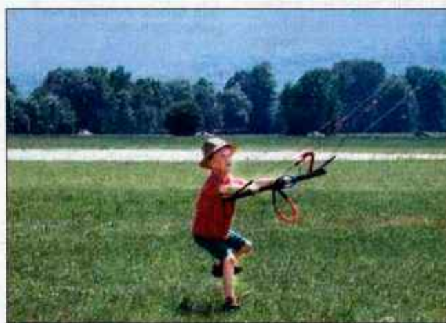
Kajtanje je šport za vse generacije.

uživali in najmlajše člane učili umetnosti kajtanja.