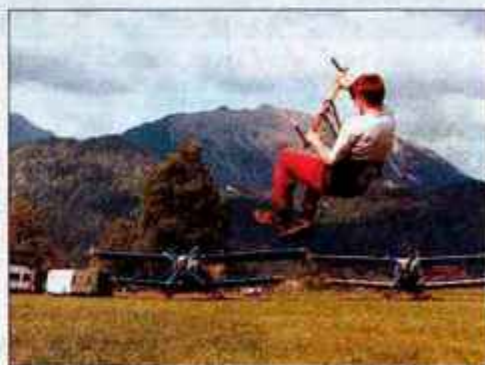
Malo po tleh, malo po zraku...