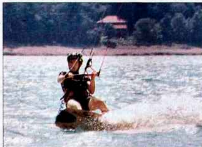
Yeri v akciji.

Na letališču v Lescah sem še sredi bele zime poiskal člane društva, ki so na letališču neustrahovano drseli po snežni podlagi,