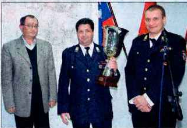
Gasilci iz Mavčič so dobili na zboru pokal, obljubili pa so jim še avto.