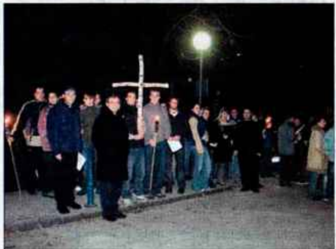
S križem in baklami so mladi krenili proti Planini pod Golico.