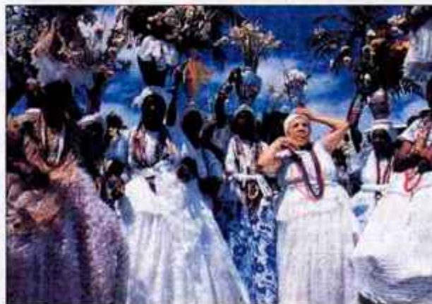
Praznovanje pomladi v zvezni brazilski državi Salvador.