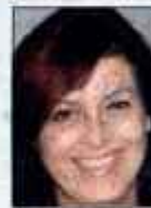
Piše Eva Senčar