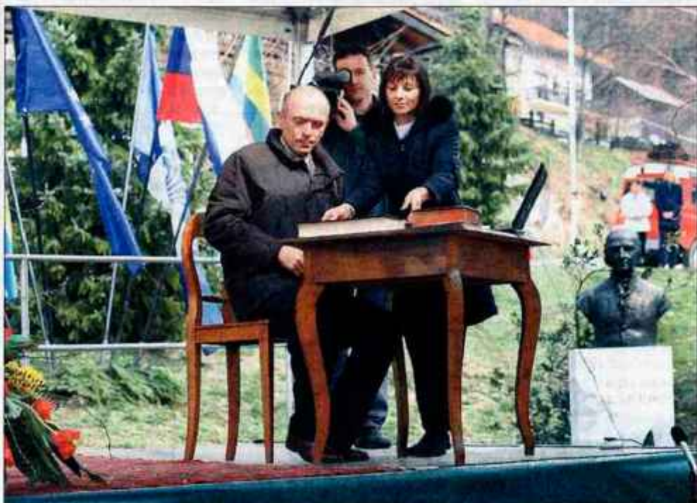
Predsednik republike dr. Janez Drnovšek se vpisuje v spominsko knjigo.

Zagorica - Na domačiji Jurija Vege v Zagorici so v soboto pripravili osrednjo državno slovesnost ob 250-letnici rojstva tega slavnega matematika, artilerijskega častnika in balistika. Njegovo rojstvo sta si za svoj občinski praznik izbrali dve sosednji občini, Moravče in Dol pri Ljubljani.