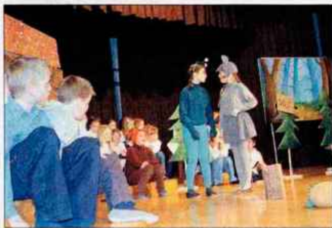
Glasbena pravljica o Sapraniški v zahvalo donatorjem.