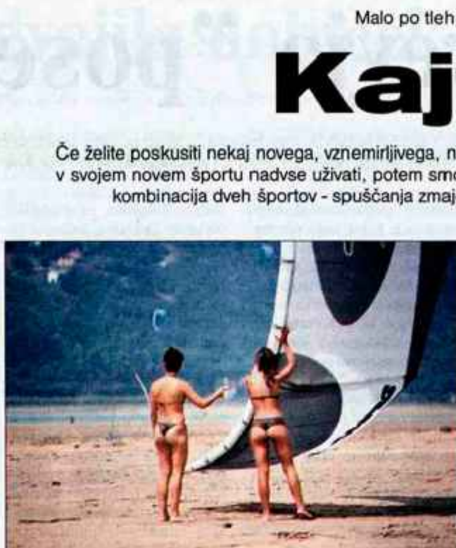
Začetnik kajt laže spravi v zrak z malo pomoči.