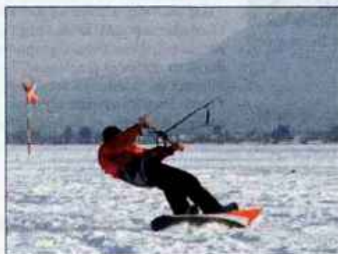
Kajtanje po snegu je lahko zelo hitro, pa še vlečnice ni treba plačevati.

Slovenci pa smo lahko ponosni tudi na svojo kajtersko zgodovino, ki nas uvršča med izumitelje tega športa, saj je bila sredi sedemdesetih na letališču v Lescah na video trak zabeležena ena prvih kajterskih voženj