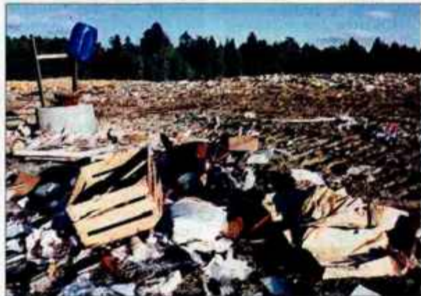
Krajanom Mlake Grič po odprtju polja B1 še bolj smrdi.