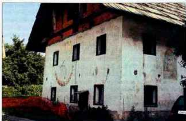
Občina bo namenila denar za izgradnjo muzeja v Ratečah, kjer bodo tudi večnamenski prostori za društveno dejavnost kraja.

munala, ceste, kanalizacija moral vključevati tudi v razreševanje posledic poplav. Planice, problematike žičnic in Pokala Vitranc. V vseh primerih se je odzval zelo odločno in v korist ljudi in razvoja, še posebej v primeru obnove planiške skakalnice. Za prizadevanje v korist Planice mu je priznanje izrekel tudi predsednik vlade Anton Rop in ga tako podprl v njegovih prizadevanjih za čimprejšnjo rešitev problematike.