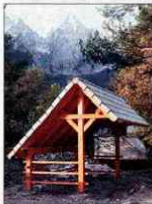
Komunala Kranjska Gora bo za ločeno zbiranje odpadkov po vsej dolini postavila 20 lepih ekoloških otokov.

"V Planici potekajo dvojne aktivnosti: organizacija svetovnega prvenstva v smučarskih poletih, ki se začne 19. februarja, in sanacija 120-metrške Bloudko-