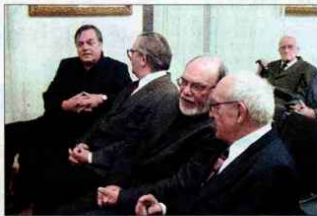
Gostje na proslavi Slovenske matice.

Na podlagi 28. člena Zakona o urejanju prostora (Uradni list RS, št. 110/02, popr. 8/03) Občina Škofja Loka sklicuje