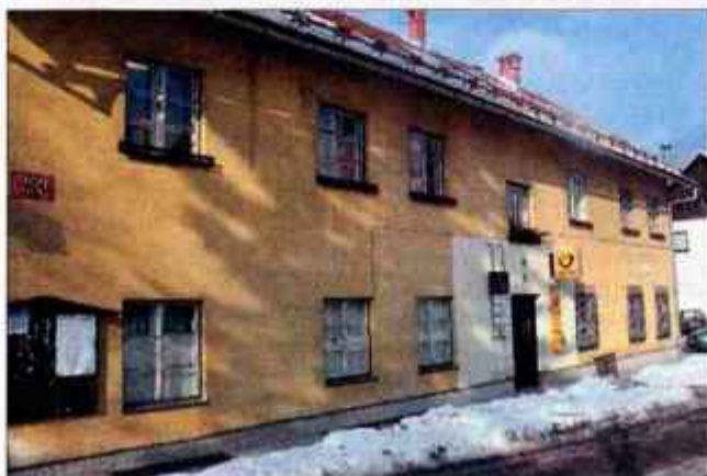
Krajanji v Mojstrani se bodo kmalu lahko razveselili nove občinske stavbe, v kateri bo knjižnica, zdravstvena in zobozdravstvena ambulanta.

"Za muzej v Ratečeh je namenjenih 35 milijonov tolarjev, od tega smo pridobili 15 milijonov državnih sredstev iz sklada za razvoj podeželja. Pomembne so naložbe v izgradnjo cest v višini