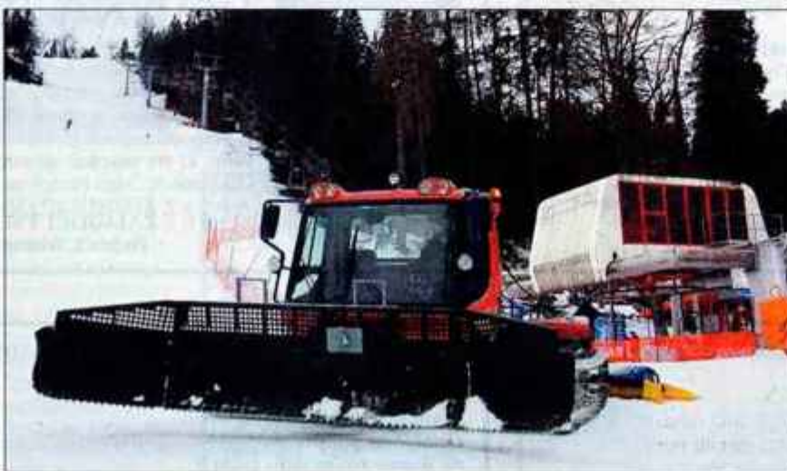
Novi teptalec snega omogoča boljše urejenost smučarskih prog.

Smučišču Straža pa ne manjka le vodni zbiralnik, ampak tudi strategija njegovega razvoja. Slednjega res ovirajo nerešena last-