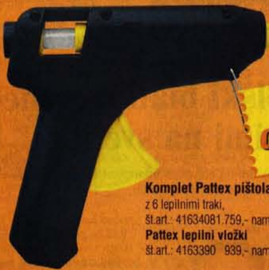
Komplet Pattex pištola za vroče lepljenje z 6 lepilnimi traki, št.art.: 41634081.759,- namesto 2.190,- Pattex lepilni vložki št.art.: 4163390 939,- namesto 1.390,-