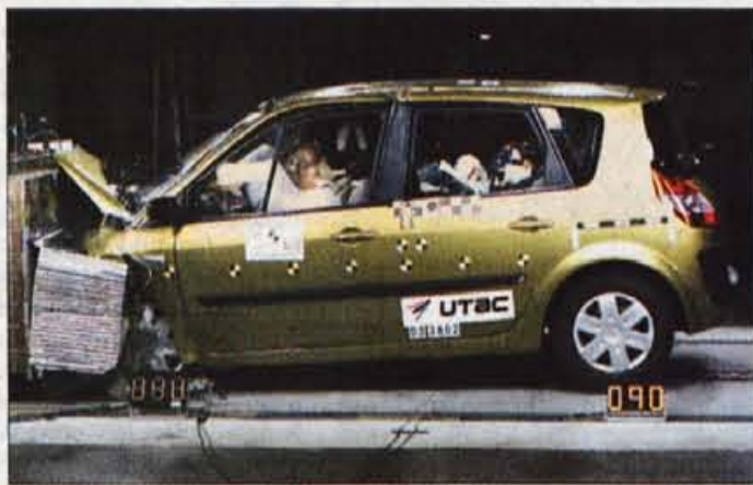
Renault scenic je že peti Renaultov model z najvišjo varnostno oceno na preizkusnem trčenju.

Rezultati najnovejših preizkusnih trčenj, ki jih izvaja in objavlja evropski konzorcij Euro NCAP, so dokaj ugodni glede varnosti potnikov, marsikaj pa bo potrebno še izboljšati in izpopolniti. To velja zlasti za varnost otrok in zmanjšanje hudih poškodb pešcev pri trčenjih, čemur so avtomobilski proizvajalci doslej posvečali premalo pozornosti. Med tokrat preizkušeni desetimi avtomobili je bilo največ kompaktnih enoprostorcev, dva med njimi pa sta si zaslužila tudi najvišjo varnostno oceno, ki jo označuje pet zvezdic. V družino najvarnejših se