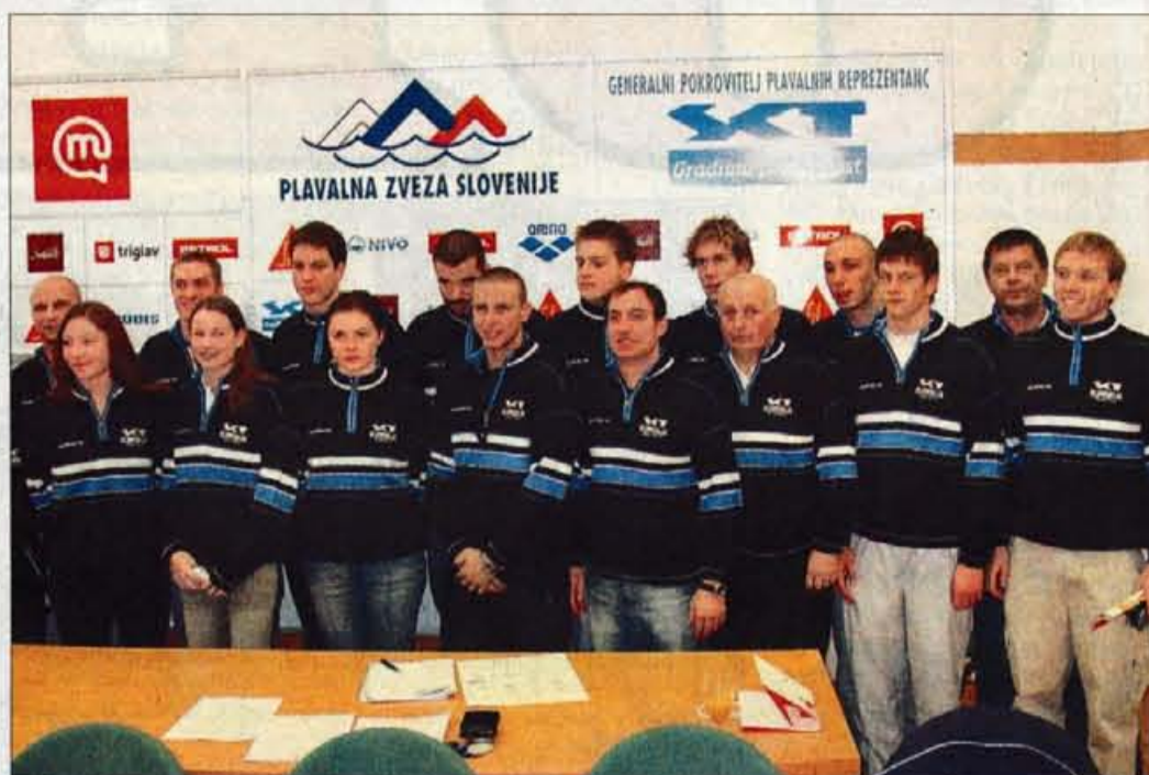
Člani naše plavalne reprezentance v Dublin odhajajo dobro razpoloženi.

"Tekmovalci so realizirali vse načrtovane programe, formo