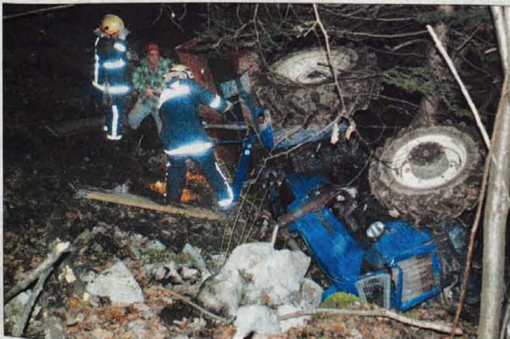
Reševalci ob prevrnjenem traktorju

V soboto se je na gozdni poti nad Dovjem smrtno ponesrečil 54-letni domačin Kristijan Langus.