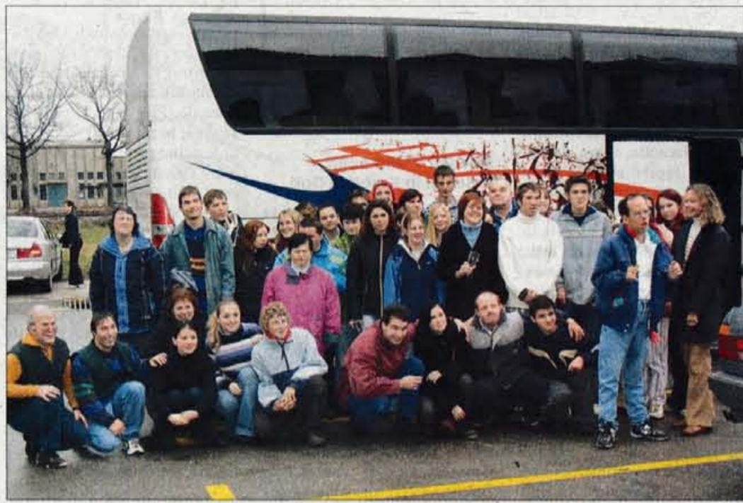
Dijaki Ekonomske gimnazije in srednje šole Radovljica so dobrodelno akcijo, namenjeno varovancem Doma Matevža Langusa, končali s skupnim izletom in ogledom Tehničnega muzeja Bistra.