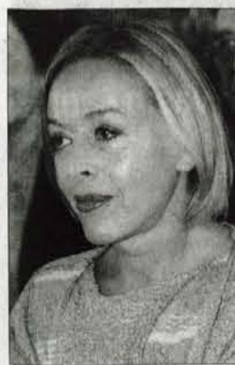
Milena Zupančič, ambasadorica dobre volje sedaj tudi za območje Balkana.

Prebivalci Slovenije so prek nacionalnega odbora v zadnjih petih letih prispevali več kot milijon dolarjev za uresničevanje UNICEF-ovih programov pomoči otrokom po svetu. To ni ostalo spregledano niti v mednarodnem okolju. Da gre res za hvalevreden prispevek, so poudarjali vsi ambasadorji UNICEF-a, ki so doslej obiskali Slovenijo, med njimi Roger Moore (spomnilo se, da je obiskal tudi otroke v osnovni šoli v Cerkljah), Vanessa Redgrave , Angelique Kidjo , izvršna direktorica Carol Bellamy in tesen sodelavec