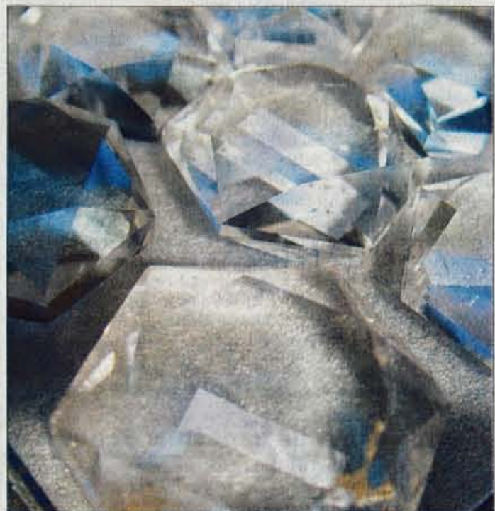
Kvarčna zvezdica skriva v sebi izjemen zdravilni in vitalni energijski potencial.