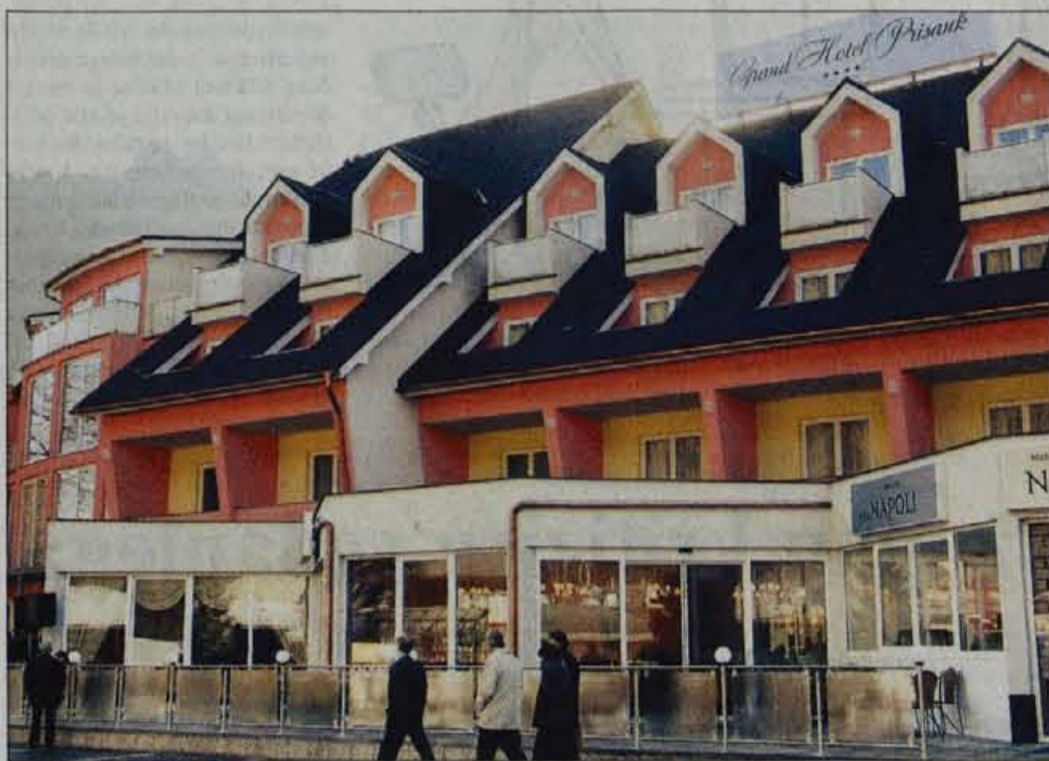
Grand Hotel Prisank je odprl vrata in tudi z njegovim zunanjim izgledom se je začelo novo poglavje v zgodovini Kranjske Gore: postala bo mondeni center.

Kranjska Gora je dobila takega investitorja, ki bi si ga želel vsak: HIT Novo Gorico, ki želi kraj spremeniti v mondeni center.