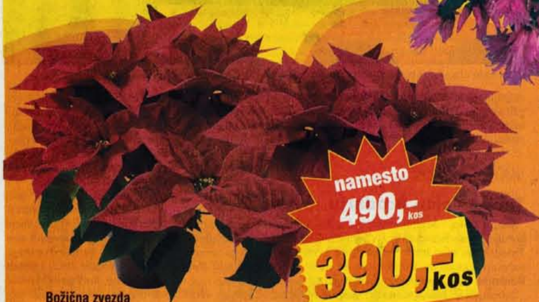
Božična zvezda v lončku premera 10 cm, št.art.: 5088000