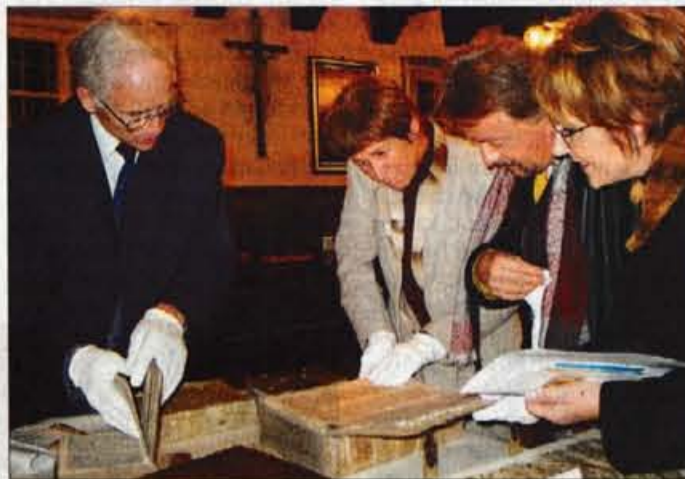
Kapucinska knjižnica hrani 19 dragocenih inkunabul, ki so bile natisnane pred letom 1500.