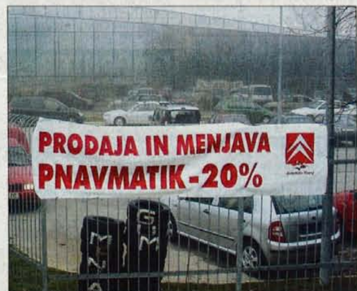
Kaj bi na ta napis porekel dr. France Prešeren?