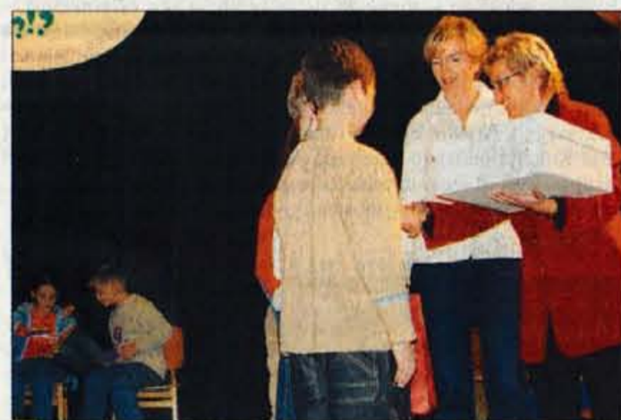
Zmagovalcem kviza sta izročili torto predstavnici DPM Šenčur.

kot dvajset članov, med katerimi smo povečini delavke iz vrtcev in šol. Gre za druženje na prostovoljni osnovi, s katerim skušamo koristiti mladini. Letos aprila smo pripravili srečanje Cicibani cicibanom, kjer so otroci predstavili dejavnosti vrtcev iz sosednjih občin. Maja smo popeljali otroke iz socialno ogroženih družin skupaj s starši na izlet preko Avstrije v Logarsko dolino. Med jesenskimi počitnicami smo prvič orga-