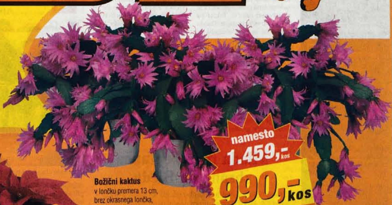
Božični kaktus v lončku premera 13 cm, brez okrasnega lončka, št.art.: 5694476