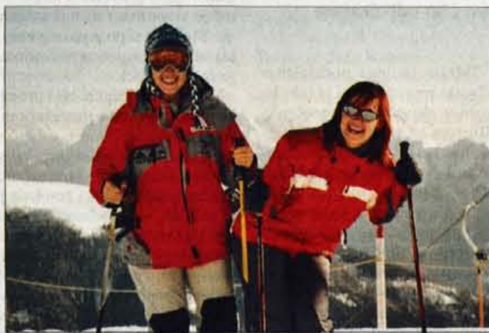
A da bova midve peljali formacijo? A da izgledava tako?