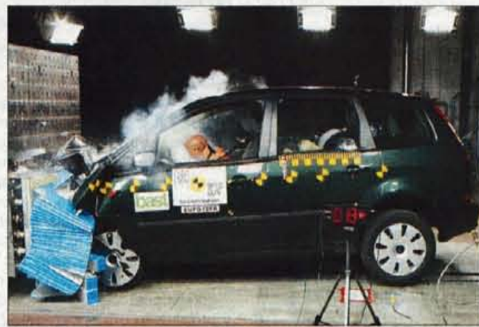
Ford focus C-max, ki bo spomladi zapeljal tudi na slovenske ceste, ima doslej edini štiri zvezdice za varnost otrok.

najvišji evropski varnostni standard, za zdaj še dokaj skromna; po enega predstavnika imajo Saab z modelom 9-5, Mercedes-Benz z razredom E in Toyota z avansisom, ki se ponaša tudi z največjim številom osvojenih točk.