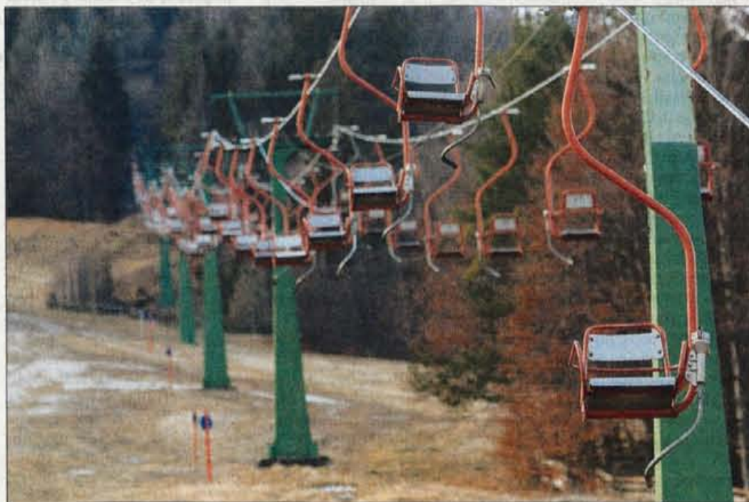
Naprave na naših smučiščih so marsikje zastarele, toda žičničarji zagotavljajo, da so varne.

Smučarje seveda zanimajo tudi cene smučarskih vozovnic, zato jih letošnje podražitve zagotovo ne bodo razveselile. Tako so se cene v povprečju povečale za 7 odstotkov, nekje nič,