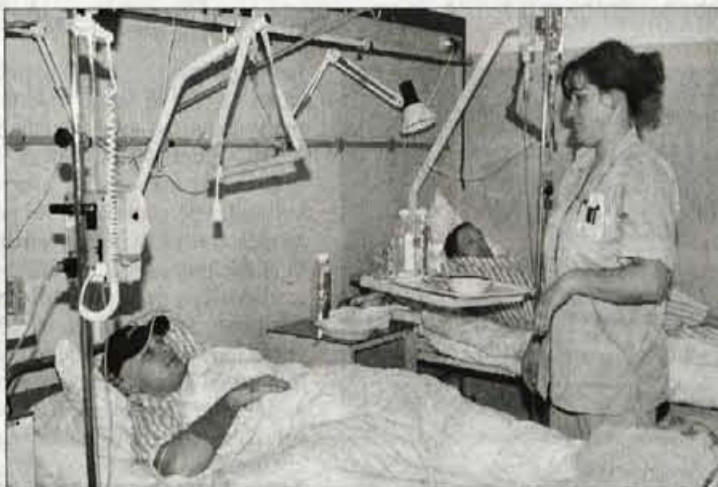
Etika zavezuje zdravstveno osebje k odgovornemu odnosu do bolnika in ohranjanju njegovega dostojanstva.

Depresija je ena pogostih boleznih današnjega časa. Pomeni bolezensko duševno stanje z zmanjšanim zanimanjem za zunanji svet. Človek je apatičen, brez volje, brez cilja. Včasih se sprašujem, kaj bi bilo, če bi depresivnemu človeku dal samo še en dan življenja? Bi ga izkoristil ali vrgel stran? Mogoče bi morali imeti manj, da bi se zavedali vsega, kar imamo? Dnevnik hvaležnosti je koristna stvar. Vanj napišem, kaj vse imam in za kaj vse sem hvaležna. In če bom to enkrat izgubila, bom vedela, da sem bila komaj zadosti hvaležna. Lepše je živeti, če znaš biti hvaležen. Zatorej hvala vsem, ki berete te vrstice, in hvala temu dnevu, ki nam je podarjen. Da ga živimo.