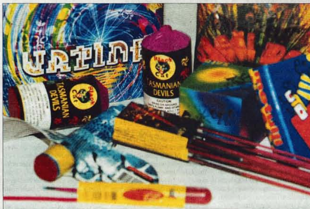
Pooblaščenca podjetja lahko prodajajo pirotehniko iz prvega in drugega razreda le od 1. do 31. januarja, mladoletnikom samo pod nadzorom staršev ali skrbnikov.

špektorji so opravili dvanajst nadzorov, nepravilno uporabljena pirotehniko je ranila dva odrasla človeka in poškodovala šest stvari.