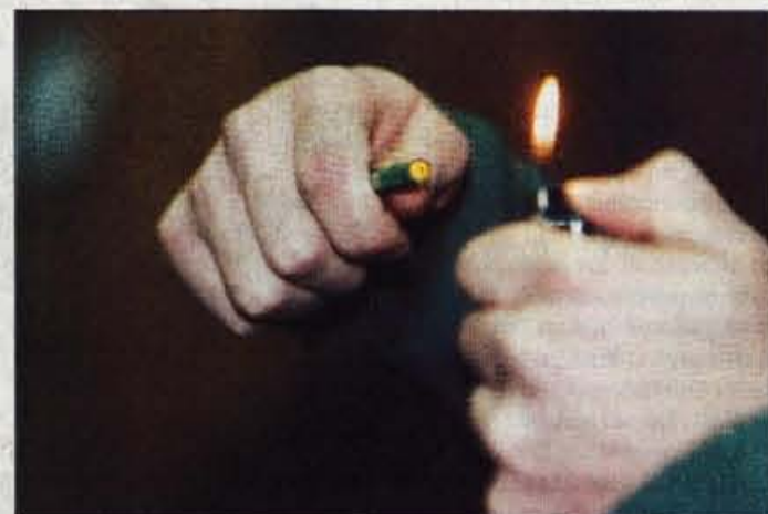
V lanskem pokanju je bilo v Sloveniji ranjenih osemnajst ljudi, na Gorenjskem dva, in to odrasla!

nepravem času in na nepravem kraju, težko ujeti. Lani, denimo, so slovenski policisti napisali 138 predlogov sodnikom za prekrške, zasegli več kot milijon pirotehničnih izdelkov, ranjenih je bilo osemnajst ljudi, obravnavani pa so tudi 39 poškodovanih premoženja. Na območju kranjske policijske uprave so številke sorazmerno nižje: gorenjski policisti so napisali devet predlogov sodnikom za prekrške, eno kazensko ovadbo in izrekli sedem denarnih kazni, skupaj z in-