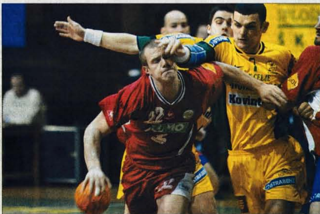
V dvorani na Podnu so v sredo Celjani zanesljivo ugnali borbene Škofjeločane.