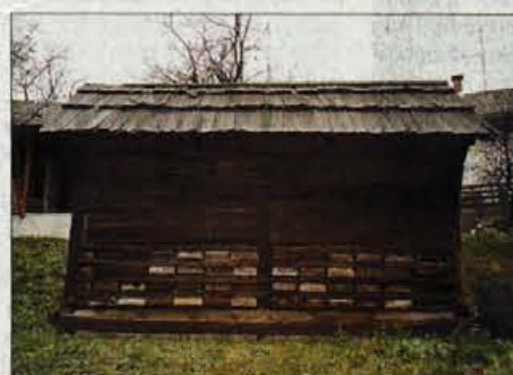
Janšev čebelnjak na Breznici