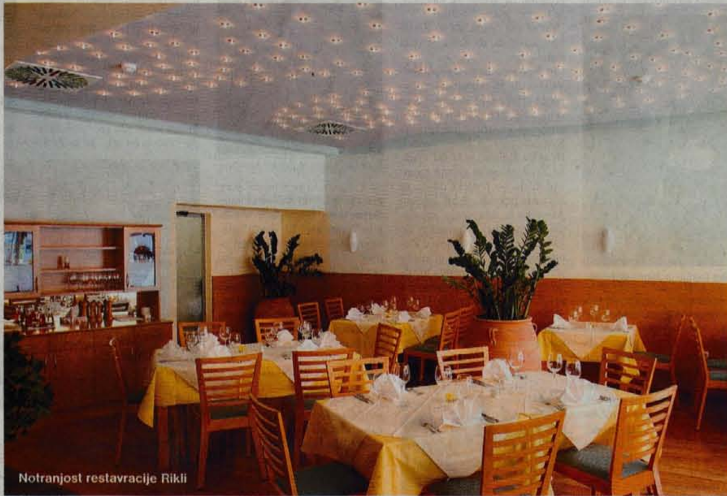
Notranjost restavracije Rikli

Sosednja Pizzeria Rikli je zatočišče ljubiteljev pizz, testenin in osvežilnih solat. Ob njihovih pizzah bodo uživali vsi, saj jih pečejo na šamotni opeki v električni peči, zato imajo povsem enak okus, kot bi jih pekli v krušni peči.