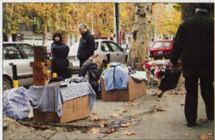
Ulični prodajalci so beograjska stalnica.

Zaradi dolgih ur skupne vožnje se je med nami kmalu razvil pogovor. Brez politike ni šlo. Bosanska Hrvačica, ki je pred desetimi leti ubežala vojnim grozotam in od tedaj živi in dela na Hrvaškem, se pač ni mogla