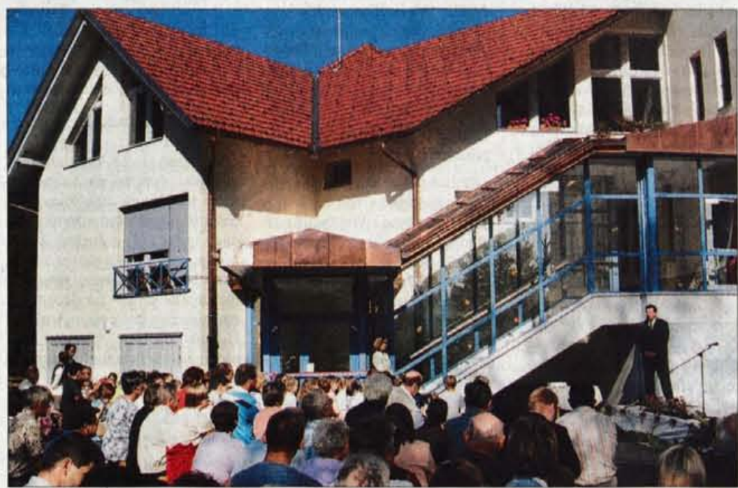
Novi prizidek k Podružnični šoli Sovodenj je namenjen najmlajšim. Sedaj v njem deluje kombiniran oddelek, v katerem se malčki odlično počutijo.

Nova delovna mesta bodo odprli podjetniki, ki nameravajo graditi v dveh novih obrtnih conah. Zakaj jim že sedaj ne ponudite zemljišča v Dobju in Todražu?