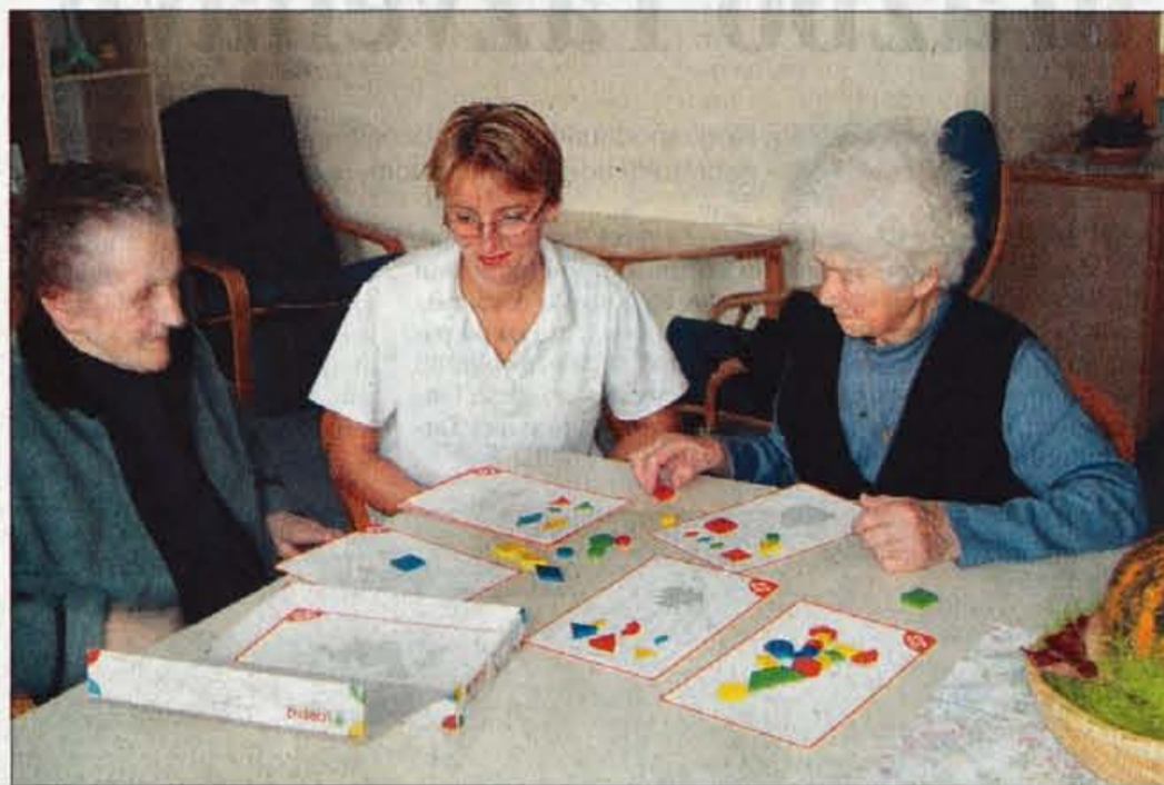
Obiskovalci dnevnega centra se kratkočasijo v družbi z animatorko.

Kranj - Tako kot večina slovenskih domov upokojencev tudi v kranjskem ni prostora za vse, ki bi želeli bivati v njem. Čakalna doba presega dve leti, na čakalni listi je okoli tristo ljudi. Namesto domskega varstva pa lahko ponudijo druge dejavnosti, denimo pomoč na domu ali pa dnevno varstvo. Že lani je Dom upokojencev Kranj uredil prostore za dnevni center, od letošnjega 1. oktobra pa je začel sprejemati starejše ljudi v dnevno varstvo. Možnost imajo za sprejem 20 ljudi, trenutno pa prihajajo štirje. Izkušnje pol-drugega meseca kažejo, da na starejše ljudi dobro vpliva dejstvo, da so čez dan lahko v družbi