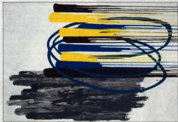
Tugo Sušnik: Brez naslova, 260 x 180, akril/ platno, 1999

Draga Tršarja. Med prijatelji muzeja pa srečamo podjetja in družbe, kot so Pan Elektronik, Aerodrom Ljubljana, d.d., Savske elektrarne Ljubljana, Iskratel, d.d., Gorenjska banka, d.d., Sava d.d., Eltima, d.o.o., Elek-