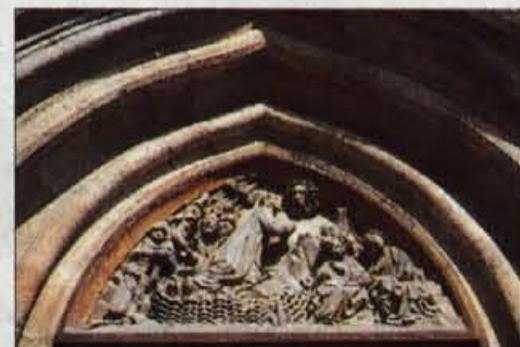
Gotski portal kranjske župnijske cerkve.

Tudi pri orisu župnije je zelo kratek. "Cerkev v Bukovščici je posvečena sv. Klemenu. Zgodovinarji trdijo, da sta sv. brata Ciril in Metod leta 868., ko sta šla prvič v Rim, potovala skozi naše kraje in nosila s sabo koščice sv. papeža in mučenca Klemena. Dalje pravijo, da sta na vseh krajih, kjer sta prenočevala, naredila šotor in v njem izpostavila ostanke in javno čiščenje. Zaradi tega so verniki zidali v takih krajih cerkve, posvečene sv. Klemenu. Da Bukovščica, ki sameva v skriti dolini, ni med temi cerkvami, je samoumevno." Spet imamo občutek, da se naš duhovnik "v skriti dolini" ni počutil prav svetovljansko. "Kadar ni bilo posebnega posla, sem rad obis-