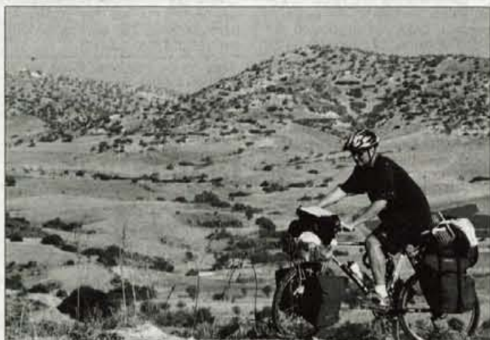
S popotovanja po Cipru, v ozadju grčevje Severnega Cipra.

Ljubljana - Popotništvo ga je zasvojilo že zdavnaj. Doslej se je nabralo toliko kilometrov, da bi lahko prišel okoli sveta. Sredi poletja se je vrnil s svojega enoletnega potovanja. Prekolesaril je Sredozemlje. Svoje vtise in doživetja je strnil v knjigi z naslovom Kilometri Sredozemlja, ki bo izšla v naslednjih dneh, prva predstavitev pa bo v sredo, 26. novembra, na ljubljanskem knjižnem sejmu.