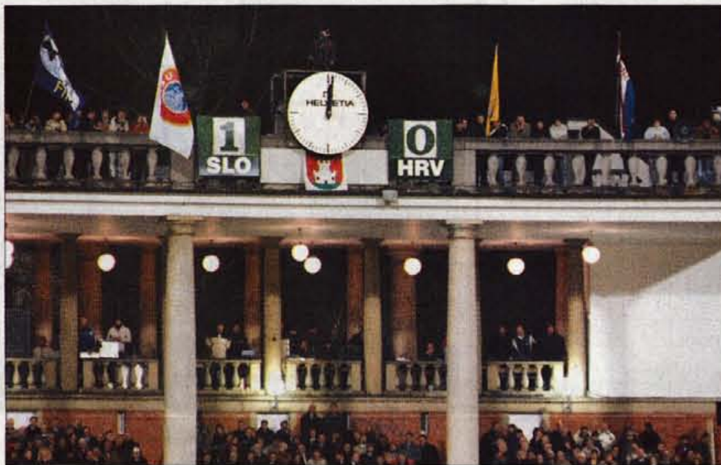
Rezultat po doseženem голу Hrvatov je bil na starinskem semaforju več minut v našo prid. Ko bi vsaj bil tudi resničen. Ura je stala celo tekmo, stadion pa tudi sicer že dolgo ni ustrezen.

Toliko policije in varnostnikov v Ljubljani ni bilo vse od Clintonovega obiska. Več kot 600 policistov, prometnikov, pripadnikov specialnih enot, konjenikov, vodnikov službenih psov ... s podporo kakih 250 rediteljev