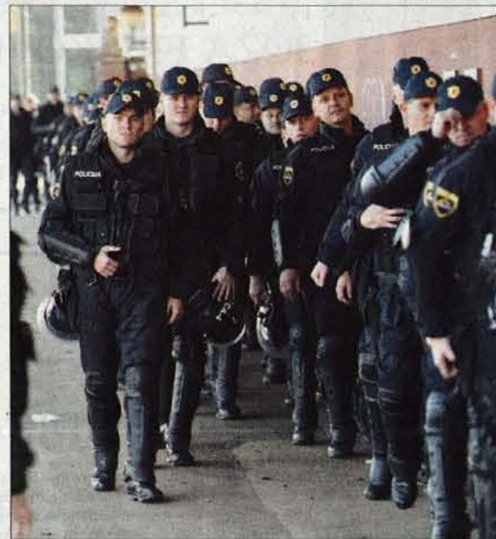
Tako rekoč vsak Hrvat je imel svojega spremljevalca.