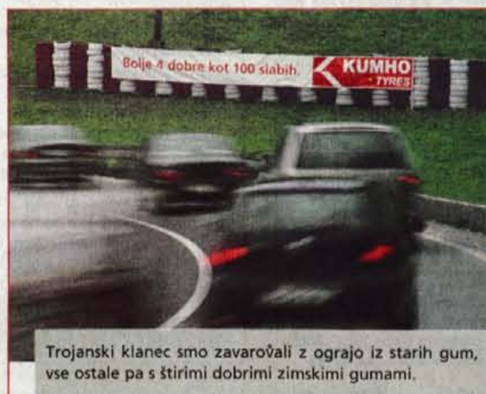
Trojanski klanec smo zavarovali z ograjo iz starih gum, vse ostale pa s štirimi dobrimi zimskimi gumami.