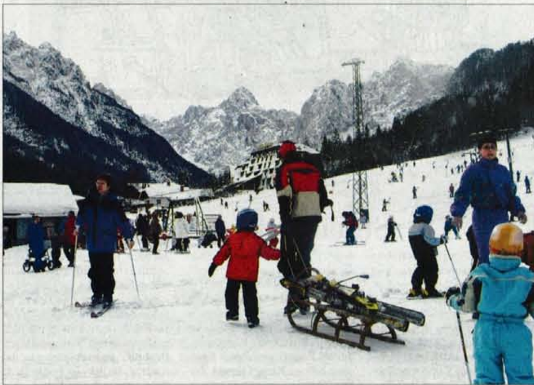
Na smučišču v Kranjski Gori.

V Avstriji, kjer imajo 3 tisoč žičnic, niso lastnikov zemljišč niti enkrat razlastili.