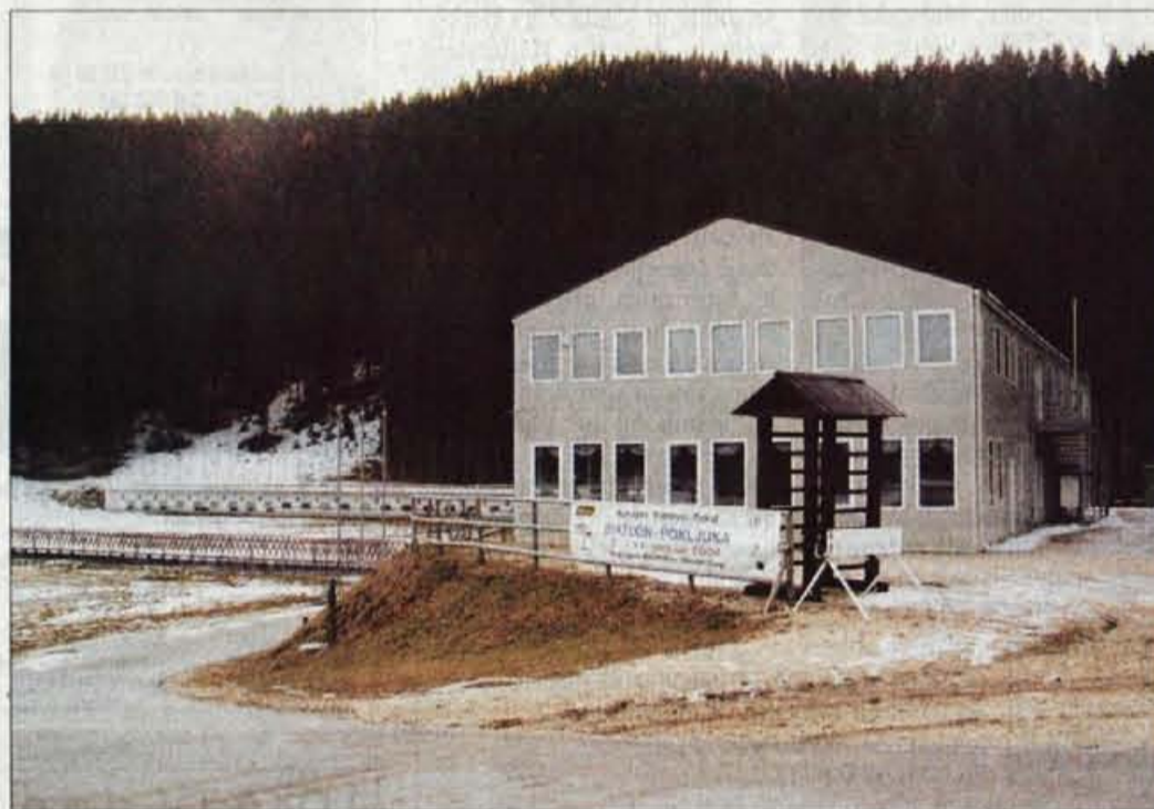
Smučarska zveza Slovenije bo biatloni center preuredila v sodoben športno rekreacijski center.