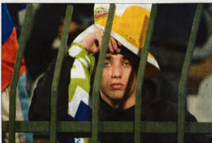
Nekateri navijači so stadion za Bežigradom zapuščali v solzah.

pogнал je "protinapad" hrvaškimi razgretežem. Po zadnjem sodnikovem zvižgu se je Bežigrad zavil v žalost. Boštjan Bogataj