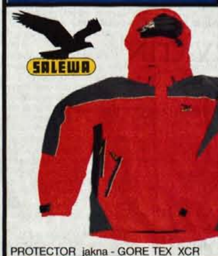
PROTECTOR jakna - GORE TEX XCR