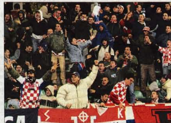
Veselje hrvaških navijačev ob doseženem голу je bilo nepopisno.

Prašnikar z bunkersko ideologijo igre, ali pa kar preveč ugodne vremenske razmere ... Mnenja o tem so si med seboj precej različna, zagotovo pa smo si slovenski ljubitelji nogometa edini v tem, kdo je ta trenutek