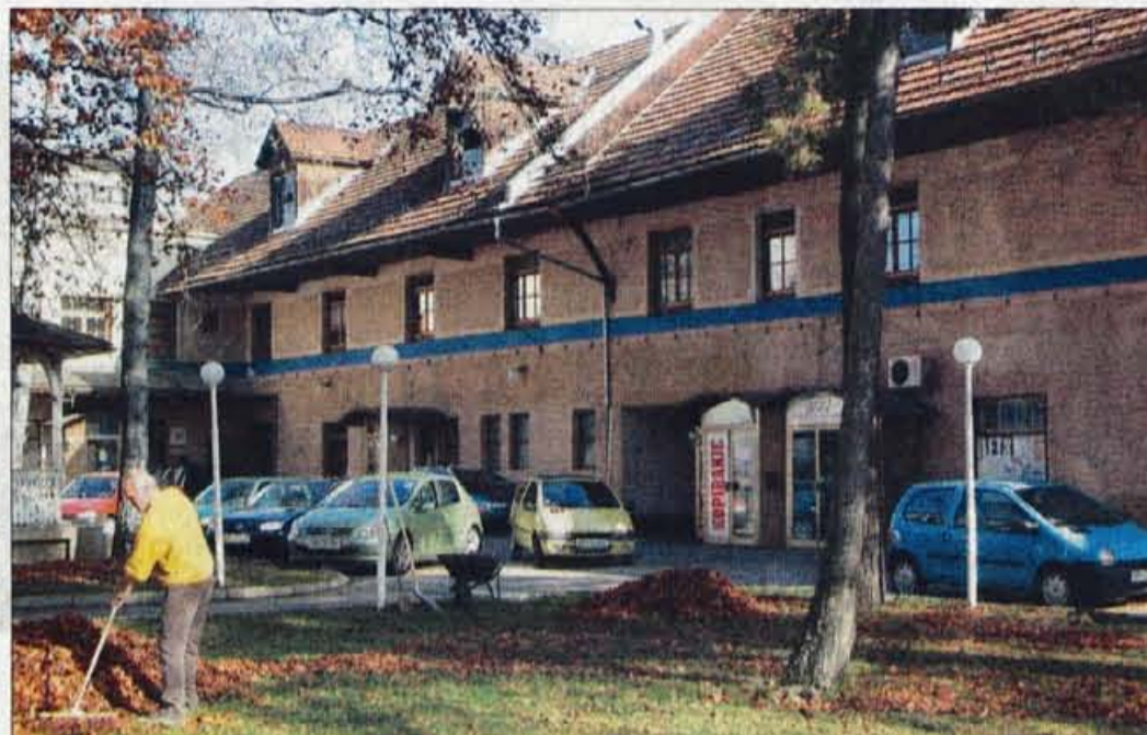
Za danes je napovedana izpraznitev A bara in dražba Arnolu zarubljenih stvari.

Kranj - 25-letni R.L. iz Radovljice je v ponedeljek ob šestih zvečer stekel s pločnika na Kidričevi diagonalno čez cesto, in to ravno proti osebnemu avtu, ki ga je vozil 35-letni Kranjčan T.O. Voznik je močno zaviral, kljub temu je pešca povozil. Huje ranjenega so prepeljali v jeseniško bolnišnico. H.J.