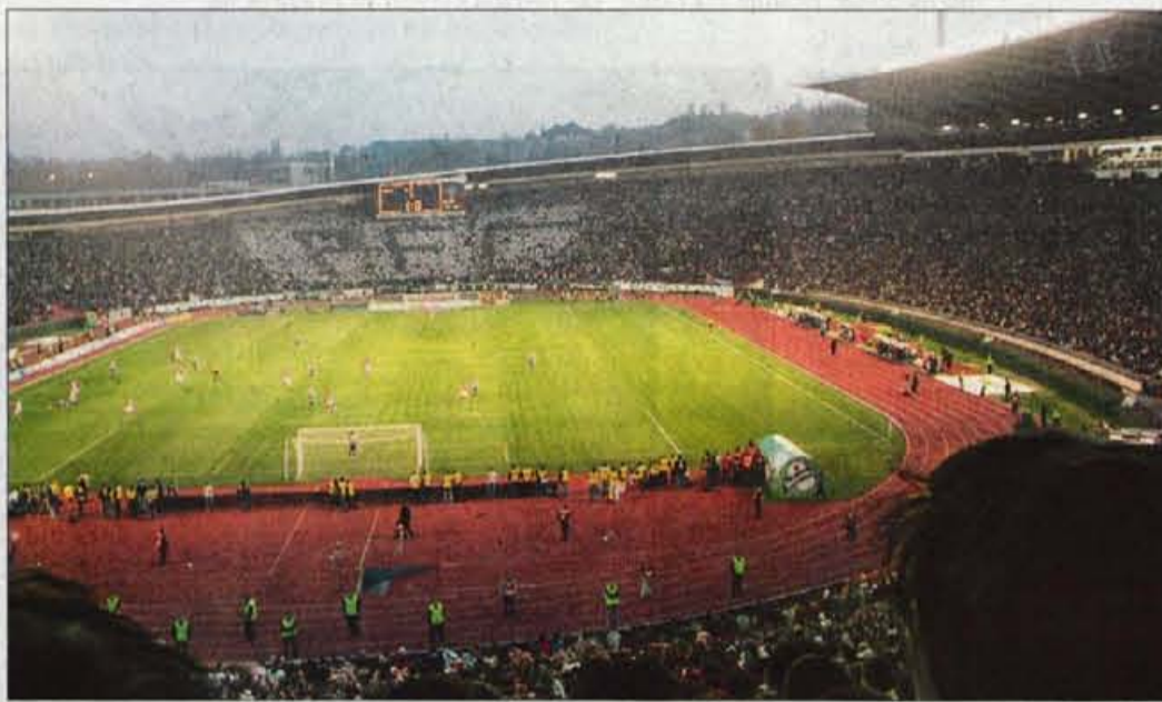
Marakana, napolnjena do zadnjega kotička.

upreti skušnjavi, da ne bi nekaj pikrih povedala na račun Slovencev in Srbov. In medtem ko je Srbom deloma že oprostila, da so ji porušili domačo hišo v Bosni, zaradi česar je bila prisiljena najti nov dom v svoji drugi državi, do nas, Slovencev ni bila tako prizanesljiva.