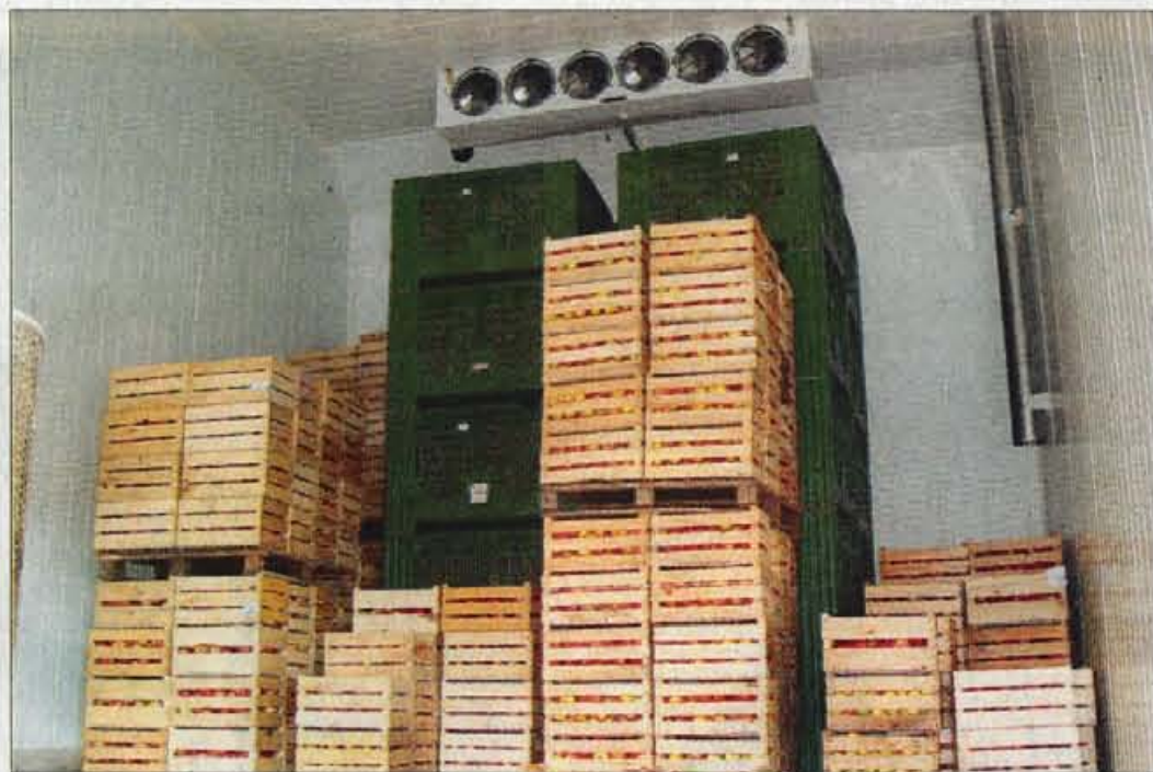
Pri Jeralovih so pred kratkim zgradili novo hladilnico za sadje, ki bo tudi v prihodnosti glavni pridelek kmetije.

prodajo kar doma na kmetiji, v kratkem nameravajo kot dopolnilno dejavnost registrirati tudi žganjekuho. Za svoja žganja, med njimi viljamovko, sadjevec, tepkovec, borovničevce in zdravilni zeliščni liker, ki ga izdelujejo po več kot sto let starem re-