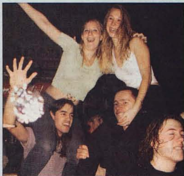
Brucovanje bo zopet noro.