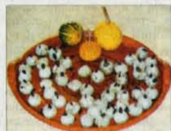
Siri iz kozjega in ovčjega mleka imajo specifičen okus, sicer pa jih je mogoče obdelovati na vse mogoče načine.

odrejenih ukrepih, potrdilo o prodaji z navedbo namena uporabe in prodajne vrednosti, če je pristojni inšpektor odredil drugačen način uporabe, ki zagotavlja uničenje karantenskih škodljivih organizmov, in zapisnik pristojnega inšpektorja o izvršitvi odrejenih ukrepov. Popolne vloge je potrebno poslati neposredno na Upravo RS za varstvo rastlin in semenarstvo, Dunajska 58, 1000 Ljubljana. Dodatne informacije je mogoče dobiti na telefonski številki Uprave 01/30-94-379. O upravičenosti do odškodnine in o njeni višini bo odločala Uprava v upravnem postopku, višino odškodnine pa bo ugotovila posebna komisija. M.G.