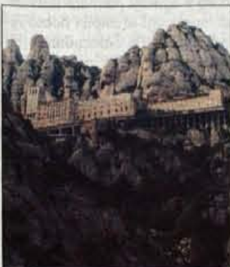
Impresivni samostan Montserrat, dvignjen nad zemeljsko posvetnost, je zgrajen na strmih pečinah.