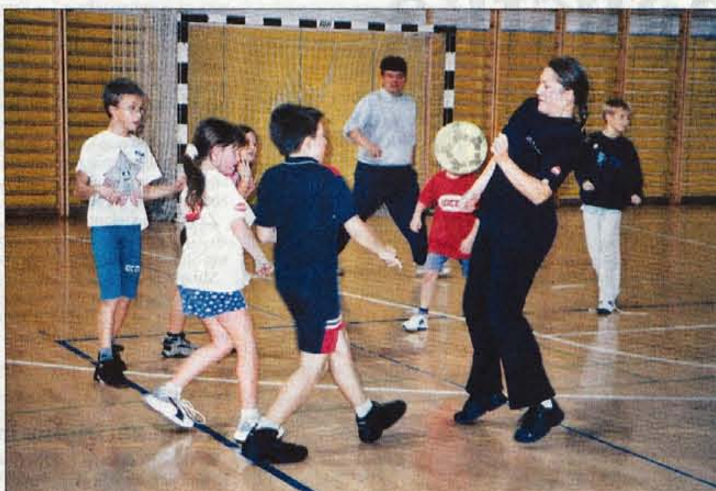
Eni igrajo "floorball", drugi nogomet. Mlajšim se pridružijo tudi starejši.

Konec septembra jih je vreme pregnalo v telovadnico. Mraz predstavlja manjši problem kot dež, saj po spolzkem terenu ne moreš rolati in tako se kot večina zunanjih športov čez zimo tudi rolanje preseli "na toplo". V zimskem času vadbo ljubiteljev rolanja v telovadnici osnovne šole v Naklem dopolnjuje še plavanje, fitnes na Brdu, pa tudi rolajo lahko (v Protenux v Šenčurju). "Vsak dan je nekaj. Kakor hitro pa se otopli, gremo na rolarje in ven. Prej smo rolali pred ekonomsko šolo v Kranju, veliko tudi v Cerkljah, ker so malce manj prometne ceste, v Naklem imajo pa ravno tako za šolo asfaltni krog.