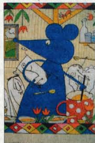
Miška kašča kuhala...

Celoten razstavljeni opus je predstavljen v originalih, nekatere od njih pa dopolnjujejo besedila. "Razstava zato predstavlja na nek način obrnjen pristop k publikacijam, saj je tekst bolj v vlogi dopolnila risbam in ne obratno, kot je navadno v knjigah," je pojasnila Venceljeva in dodala: "Res pa je, da Cvetkove ilustracije pogosto zavzemajo pripovedni prvenec." V novem galerijskem prostoru so na