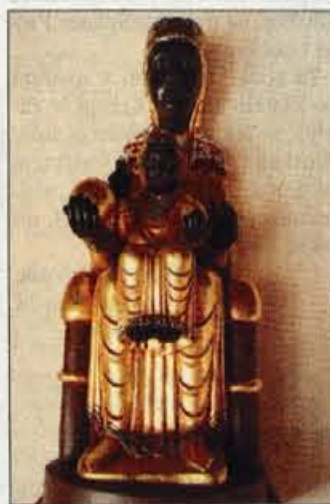
Kipec Črne Marije je danes v kapelici nad glavnim oltarjem samostanske bazilike.

Po Marijinem prikazovanju se je na mestu prikazovanja, danes v kapeli Sveta jama, znašel tudi lesen romanski kipec Črne Marije z Jezusom (La Moreneta), za katerega pa ni znano, kako in kdaj je nastal. Strokovnjaki ga danes uvrščajo v 12. stoletje. O njegovem nastanku oz. Črni Mariji obstajajo različne legende. Da je postala črna od saj, ker so ljudje toliko prižigali sveče, da je povezana z črnimi egip-