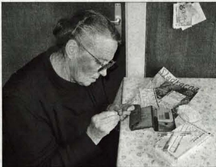
Za nadzorovano sladkorno bolezen in urejen sladkor v krvi je pomembno tudi njegovo redno merjenje.

Diabetes tipa 1 pa je avtoimunska bolezen, zbolijo v glavnem otroci in mladostniki, ima jo 5 do 10 odstotkov vseh diabetikov. Neuravnavanje sladkorja v krvi in neobvladovanje diabetesa lahko povzroči hiperglikemijo, izrazito povišanje ravni sladkorja v krvi, in hipoglikemijo, kjer gre za izrazito znižanje krvnega sladkorja. Taki osebi je treba dati sladki sok ali sladkor in če je v nezavesti, mu s sladkorjem