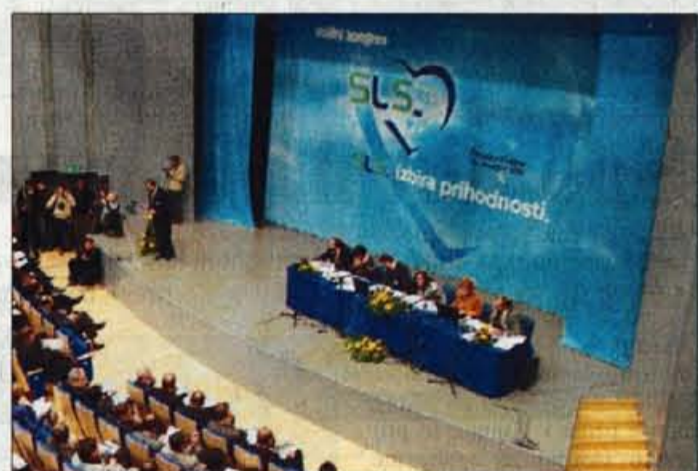
"SLS, izbira prihodnosti" bo moto stranke na volitvah prihodnje leto.

ke, je grajal premajhno pripadnost stranki in povezanost med vodstvom stranke, njenimi poslanci, svetniki in župani, ki morajo biti strankina "udarna