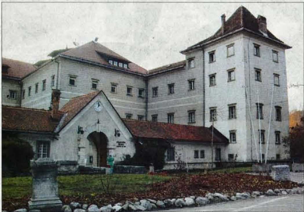
Osrednja slovesnost ob 50-letnici Psihiatrične bolnišnice Begunje bo v petek, dosedanja prenovi pa naj bi sledila tudi prenova intenzivnega oddelka.