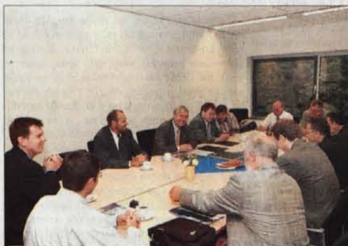
Vodstvo FOV na pogovorih o sodelovanju na Nizozemskem.

Kot rezultat enega izmed takih sodelovanj ravno te dni na fakulteti gostijo prvo študentko iz tujine, ki je prišla na fakulteto