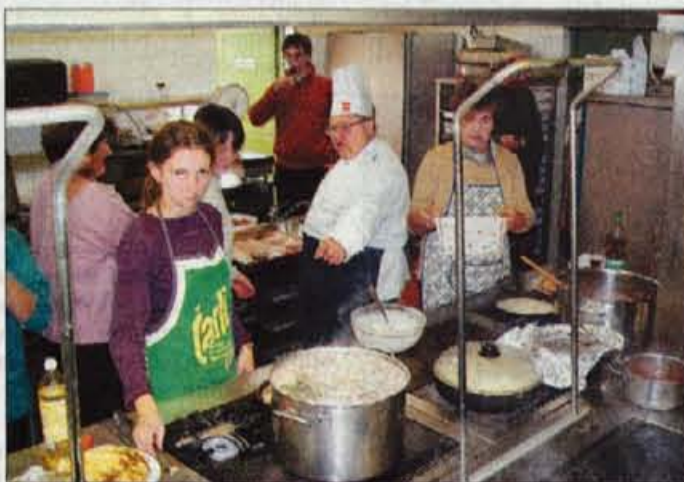
Člani društva rejcev drobnice so pripravili že drugo kuharsko delavnico, na kateri so pripravljali jedi iz mesa kozličkov in jagenjčkov.