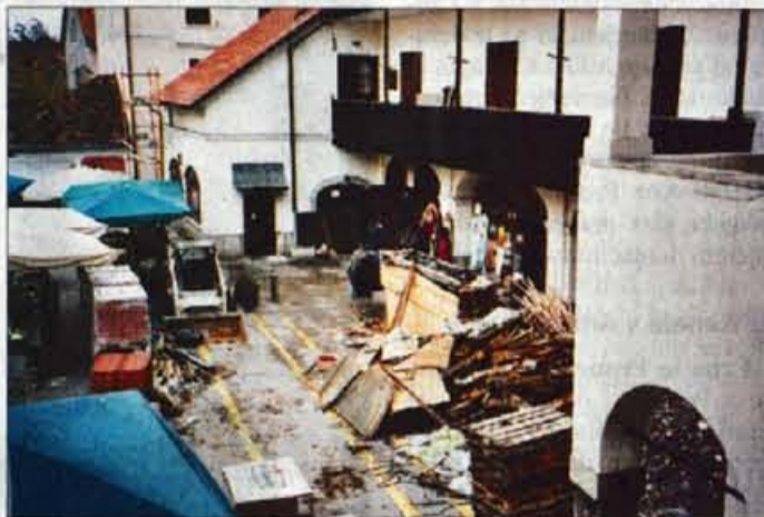
Ruševine na mestno tržnico ne sodijo.