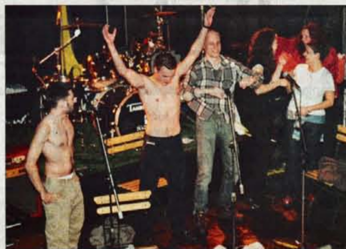
Najlepše je zmagati.