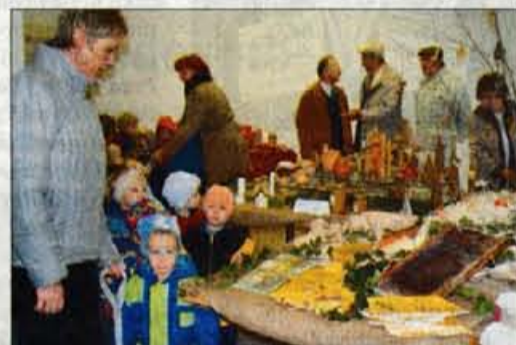
Najmlajši so si ogledali čebelarstvo razstavo in tudi poskusili med.