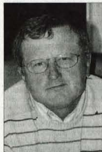
V sredo je Nadzorni svet obravnaval devetmesečno poslovanje družbe Elan. Kaj ste pri tem ugotovili?