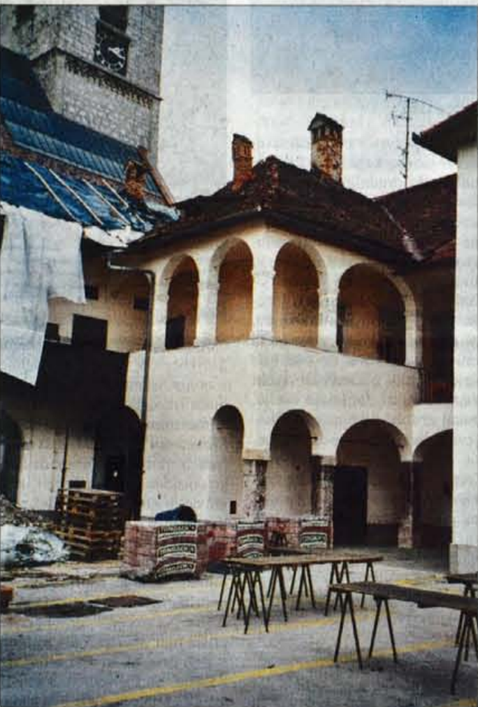
Spet dežuje, zdaj je odkrita streha vsaj dodatno zaščitena.

Očitno hud naj bi F.S. policista zmerjal, žalil in pri tem krilil z rokami. Policist je stopil iz belo-modrega avta in ponovil, da F.S. ne sme več prijeti za krmilo, ta pa naj bi policista odrinil. Umiril se ni niti ob opozorilu, da utegne biti proti njemu uporabljena fizična sila in pridržanje. F.S. naj bi se še kar repenčil, zato sta ga policista prijela, da bi ga vklenila, pri tem pa je enega od policistov ugriznil v palec leve roke. F.S. je moral prenočiti na radovljiški policijski postaji. Zaradi napada na policista ga čaka kazenska ovadba, zaradi kršenja cestno-prometnih predpisov pa predlog sodniku za prekrške. H.J.