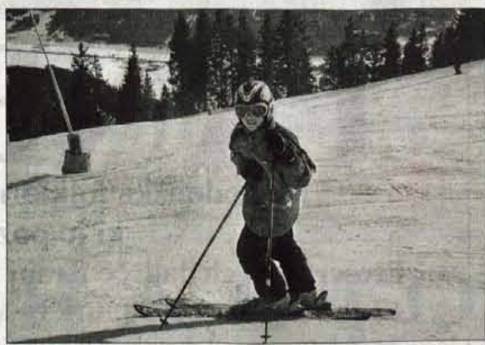
V letošnji sezoni začne veljati nov zakon o varnosti na smučišču. Med pomembnimi novostmi je, da bodo morali otroci do 12 let pri smučanju obvezno nositi zaščitne čelade.

"Kljub temu da smo lani ostali brez tradicionalnega prostora na Gorenjskem sejmu, smo se odločili, da s prirejanjem sejma ne prenehamo. Ta odločitev se je takoj pokazala kot pravilna, tako da sejem letos znova pripravljamo v bivšem vrtnarskem centru Trenča, na njem pa bo možno kupiti tako rabljeno kot novo opremo. Poleg tega bodo žičničarji na sejmu ponudili smučarske vozovnice po predsezonskih cenah, na sejmu se bodo predstavila športna društva, poskrbljeno pa bo tudi za