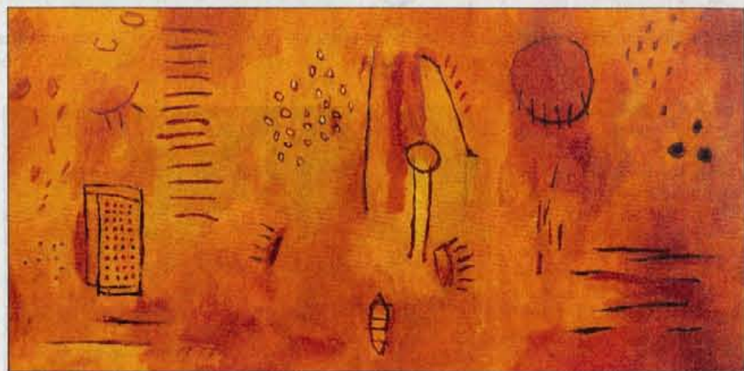
Praznovanje, akril na platnu, 90x180 cm, 2003

"Najbrž že v času študija. Sicer pa se človek vedno znova išče. Sama imam neko pot, ki se je držim. Na začetku sem veliko delala kolaže, mešano tehniko, ki je zame značilna še danes.