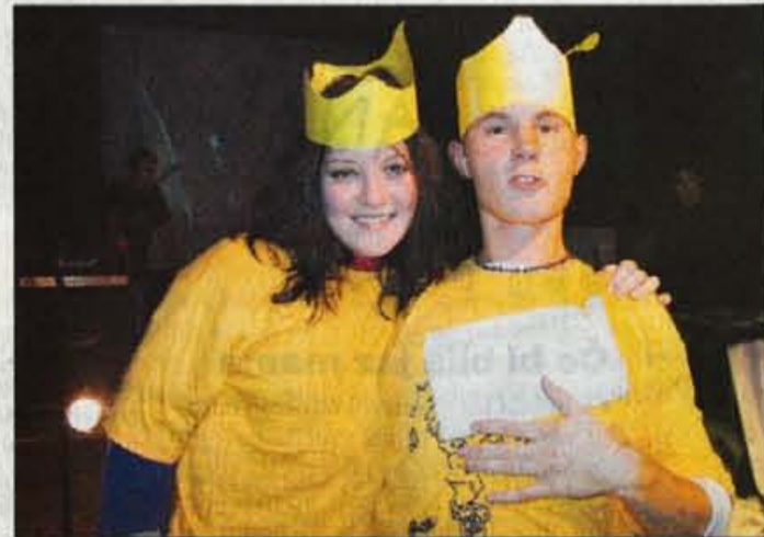
Lanska kraljica in kralj sta se razveselila nagrade.

Po študentskem ustnem izročilu obstaja več razlag o tem, kdaj