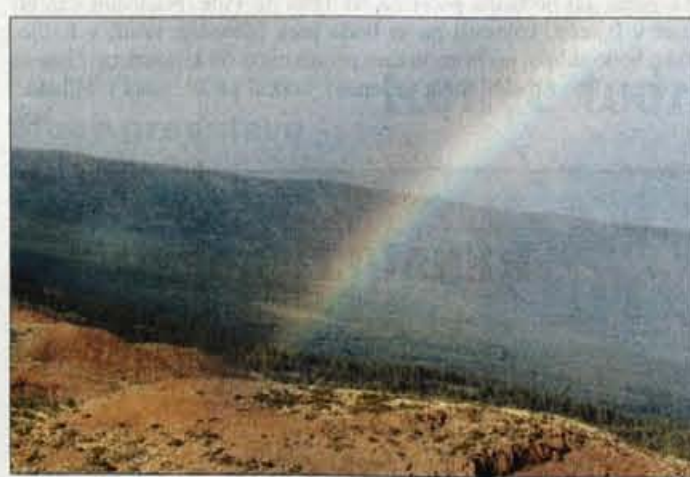
Mavrica še danes predstavlja simbol povezanosti z Bogom.

ne Azije je prišla iz podzemskega sveta in je, podobno kot v Afriki in Grčiji, povezana s kozmičnimi tokovi , ki se razvijajo med zemljo in nebom. V budiističnih deželah je mavrica povezana tudi s sedmerobarvnim stopniščem , po katerem se je Buda znova spustil z neba, takšno idejo pa je za "lokalne" bogove najti tudi od Irana do Afrike in od Severne Amerike do Kitajske. Podobno vlogo ima mavrica tudi za Tibetance, vendar v obratni smeri, saj za njih mavrica predstavlja dušo vladarjev, ki se dviga v nebo . Burjatski šamani imajo med svojimi pripomočki mavrične