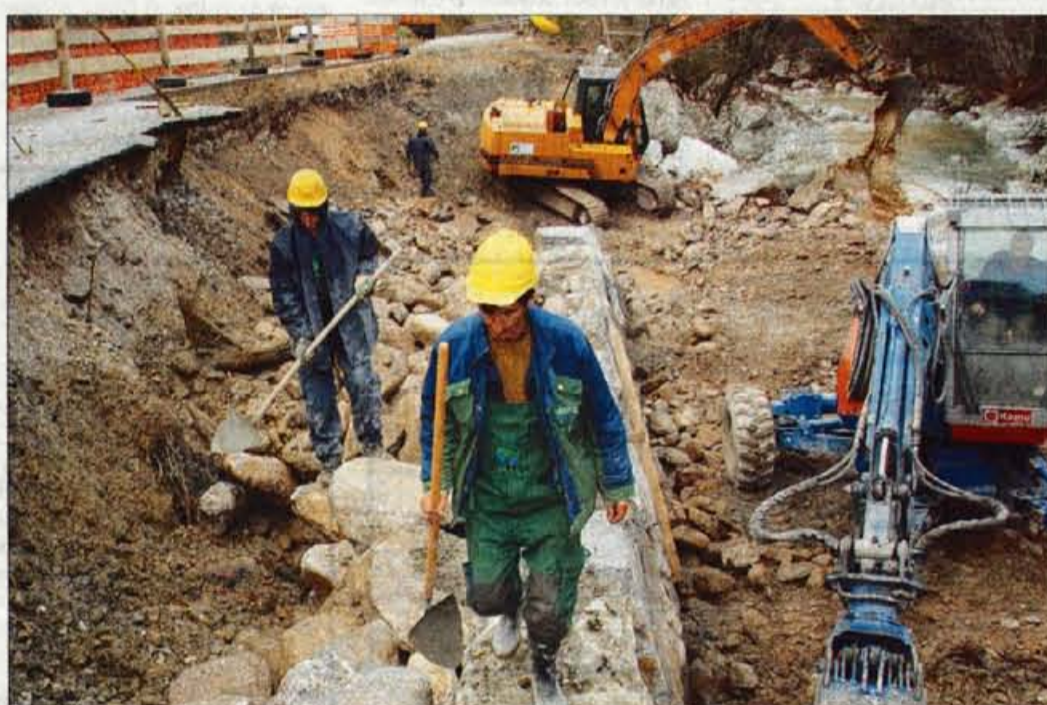
Gradnja opornega zidu pri Čadovljah je pospešeno potekala ves minuli teden.

Bager Vodnogospodarskega podjetja Kranj smo opazili v strugi reke tudi pod vrsto brežino pri tržiški osnovni šoli in športni dvorani. Kot so potrdili v območni pisarni agencije RS za okolje v Kranju, gre za najnujnejše varnostne posege. Obenem si prizadevajo zagotoviti denar za celotno sanacijo, ki gotovo ne bo poceni. Natančna ocena zaenkrat ni znana, saj Vodnogospodarski inštitut še pripravlja projekt sanacije. Kot