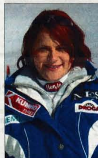
Alenka Dovžan se je poslovila od tekmovalni.

Minuli teden se je od tekmovalne kariere poslovila alpska smučarka Alenka Dovžan.