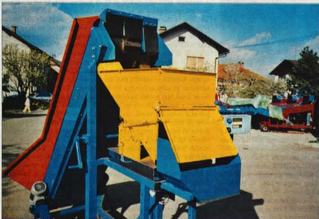
Nova avtomatska tehtnica je opremljena z elektroniko, ki omogoča lažje in bolj raznoliko tehtanje krompirja.

Nekateri proizvajalci in prodajalci kmetijske mehanizacije ocenjujejo, da je izpad dohodka zaradi letošnje suše od 20 do 30 odstotkov.