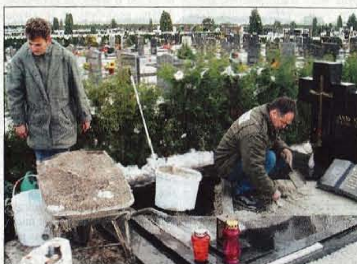
Nekateri so se lotili temeljite ureditve.

stanejo od 800 do 900 tolarjev in več, mačehe in rese pa so seveda cenejše. Kakšnega posebnega trenda pri urejanju grobov letos ni, predvsem zaradi vremena in tudi, ker pri nas tega v takšnem smislu ni, oziroma še ni. Zato lahko cvetličarji izrazijo svojo domiselnost in estetiko v vsem svojem obsegu.