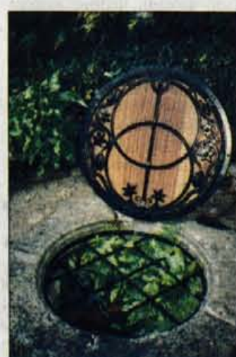
Sveti kelihov vodnjak v Glastonburyju. Tu notri naj bi po legendi vrgli Kristusov kelih z zadnje večerje.

Knjiga Sonce in kača, ki kot kroniko opisuje ta odkritja, je postala nekakšna kulturna klasika v zadnjih petnajstih letih, številni ljudje po vsem svetu, ki so se podali na romanja vzdolž te linije, pa so pogosto dobili nov pogled na pomen in namen svetih krajev ter njihov vpliv na naša življenja. Gre tudi za ponovno odkritje bistvene in temeljne resnice, da je Zemlja živo bitje, katere del smo.