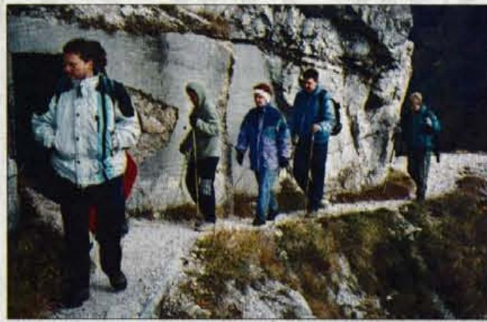
Družinski pohodi so namenjeni druženju, spoznavanju narave in marsikdo je ravno zaradi njih vzljubil hribe.

Prevala stoji na 1311 metrih nadmorske višine. Da je vsa