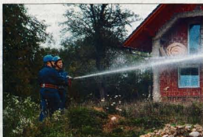
V Dornicah so imele vajo članice iz GZ Vodice.

Vodice - Na območju Gasilske zveze Vodice sta bili doslej v mesecu požarne varnosti že vaja članic iz gasilskih društev v Dornicah in gasilski avtoraly na območju celotne zveze. V