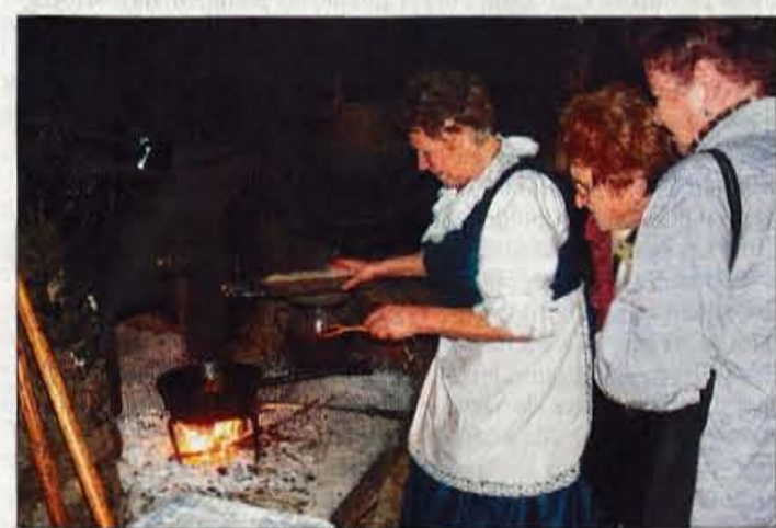
Tudi ob petem jubileju so postregli z jedmi iz črne kuhinje.

gajanja iz bogate preteklosti - zgodovine in dediščine pa so minuli konec tedna v Budnarjevi hiši zabeležili tudi peto obletnico prijaznih srečanj in toplih dogajanj v njej. Tokrat so streljaj od hiše v gozdu predstavili kopo in kuhanje oglja, v hiši so številne prijatelje in obiskovalce, med katerimi jem bil tudi mag. Du-