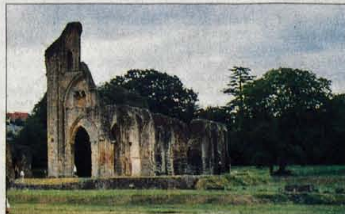
Ostanki opatije v Glastonburyju, ki je še danes eden najsvetejših krajev v Veliki Britaniji