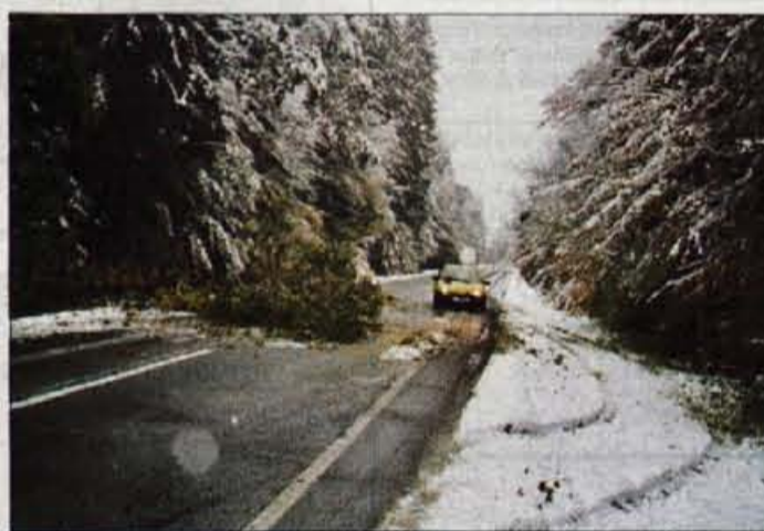
Na Jeprci: sneg je lomil tudi drevje.

snežiti, z zimskimi pnevmatikami opremljena približno petina vozil. "Večina vozil je bila še brez zimske opreme. Vozniki so zato vozili ne samo previdno, ampak že kar pretirano boječe. Ker so zraven zelo previdno vozili tudi tovornjakarji, so na cestah, predvsem na podvinskem