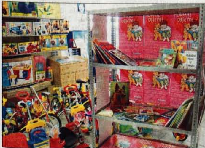
Otroci lahko knjige, ki jih želijo podariti revnim sovrstnikom, prinesejo v trgovino Baby centra.

posebnih koticah po trgovinah Baby centra do 24. decembra. Vsi darovalci bodo prejeli zahvalno plaketo v obliki knjižne kazalke z njihovim imenom in priimkom. "Te jih bodo vse življenje spominjale na to, da so že v svojih najrosnejših letih pokazali razumevanje za