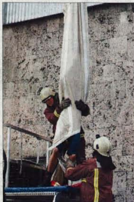
Kranjski gasilci imajo le eno spustnico.