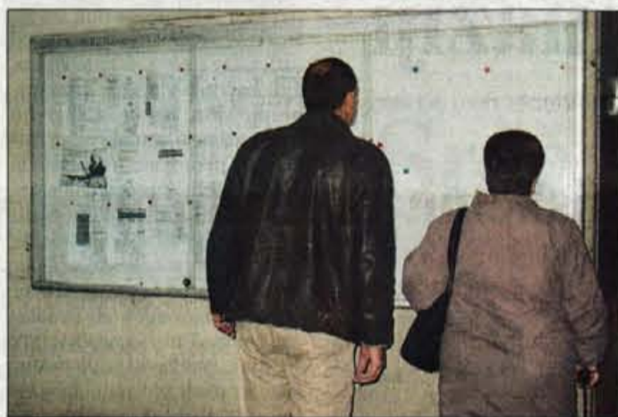
Zunanja vitrina je pod milim nebom, a je namenjena vsem, ki pridejo mimo.

Marsikdo, ki je nezaposlen, ne ve, da je več spiskov o delodajalcih - tudi v toplem in svetlem prostoru na Zavodu za zaposlovanje.