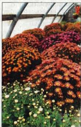
V cvetličarni Flora na Bantalah pri Kranju.

se gibljejo od 3.000 in 3.500 tolarjev naprej, za sveže pa od 3.000 in 4.000 tolarjev dalje. Tudi cvetja za nasaditev je še dovolj, vendar to zaradi vremena ne pride več toliko v poštev. Prav zaradi vremena in vremenske napovedi se ljudje najpogosteje odločajo za suhe, polsuhe in polumetne ikebane, ki v mrzlem in slabem vremenu ostanejo tja do februarja, so nam povedali številni gorenjski cvetličarji. Radi izberejo tudi sveže rezano cvetje ter krizanteme, mačehe in reso različnih barv in vrst, saj menijo, da je sveže cvetje kljub vremenu še vedno najlepše. Krizanteme v lončkih