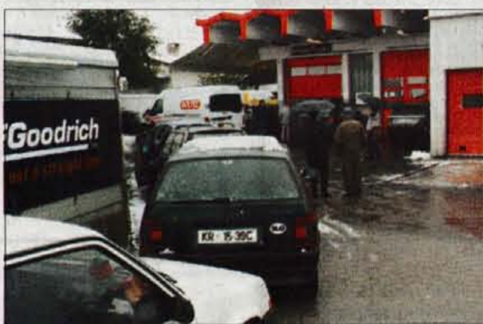
Vulkanizerji so imeli v zadnjih dneh obilico dela...

V petek dopoldne so o tem zgovorno pričale dolge kolone pred vulkanizerskimi servisi; na zamenjavo gum je bilo treba čakati tudi po dve uri. Pri enem večjih