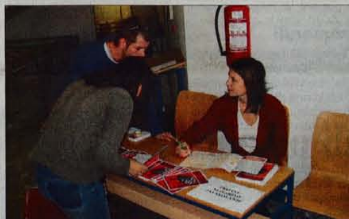
Študenti se lahko prijavijo na pogovor s predstavniki podjetij.

Vsi, ki tega še niste storili, lahko do konca tega meseca še vpišete študentski abonma v Prešernovem gledališču v Kranju. Zadnji dan za vpis je petek, 31. oktobra. Vpis bo potekal med 10. in 12. uro in med 13. in 15. uro v avli gledališča.