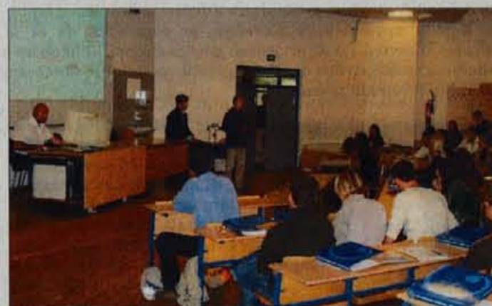
Udeležba na predavanjih in delavnicah bo brezplačna.

organizacije odločila izpeljati projekt, s katerim bodo sebi in svojim kolegom povečali možnosti za zaposlitev. S projektom Teden zaposljivosti, ki bo potekal med 5. in 13. novembrom 2003 na Fakulteti za organizacijske vede v Kranju, želijo študentom približati tematiko zaposlovanja, jim podati znanje, ki je potrebno za čim manj čakanja na zavodu za zaposlovanje, ter nenazadnje tudi zblížiti študente in njihove bodoče zaposlovalce. V okviru projekta Teden zaposljivosti bodo potekale delavnice in predavanja na določene teme ter predstavitev podjetij z območja Gorenjske, pripravili pa bodo tudi posebno številko priloge Časopisa študentov gorenjske Organon, Organonov Zadek. Organizatorji so pripravili dve delavnici. Prva nosi naslov "Kako napisati življenjepis" in se je lahko udeležite v sredo, 5. novembra, v prostorih Fakultete za organizacijske vede. Druga delavnica nosi naslov "Kako se pripraviti na ustni razgovor" in se bo odvijala dan kasneje. V okviru projekta pripravljajo tudi tri predavanja. V torek, 11. novembra, v popoldanskem času bo predavanje na temo "Delavske