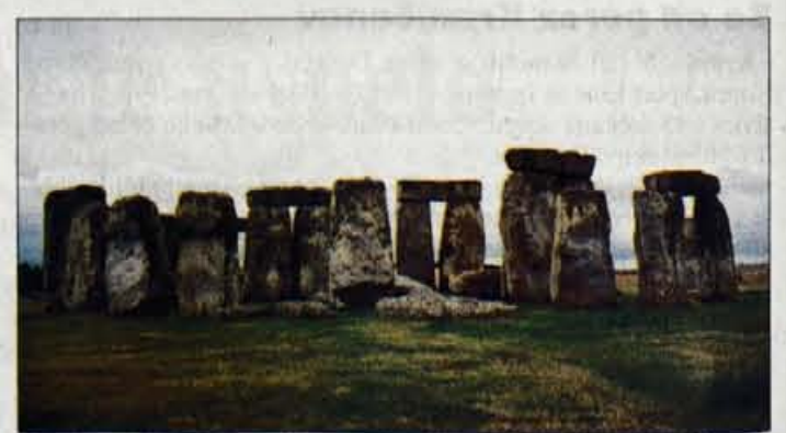
Stonehenge, eden izmed najbolj svetovno znanih svetih krajev, ki je tudi povezan z glavno britansko zmajevjo črto.