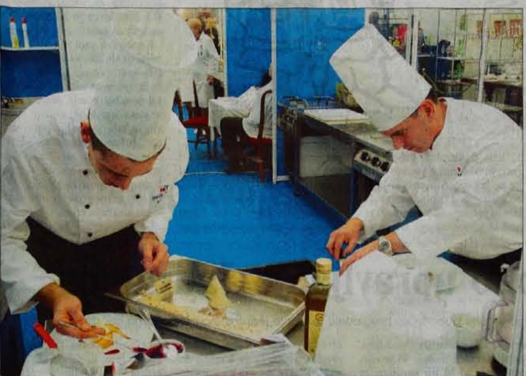
Tekmovanje kuharjev v pripravi različnih jedi je bilo zanimivo tudi za obiskovalce.

50. Gostinsko turistični zbor Slovenije je bil največji po številu tekmovalcev, obiskovalcev in po velikosti prireditvenega prostora.