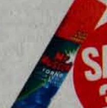
Čistilo za pečice Mr. Muscolo, 300 ml, spray Emona Obala Koper