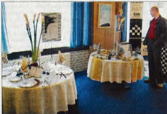
Srebrna medalja domiselnemu pogrinjku blejske Višje šole za gostinstvo in turizem.