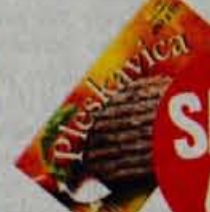
Zamrznjeno pleskavica Esbo, 4 x 100 g ABC Pomurka International, Murska Sobota