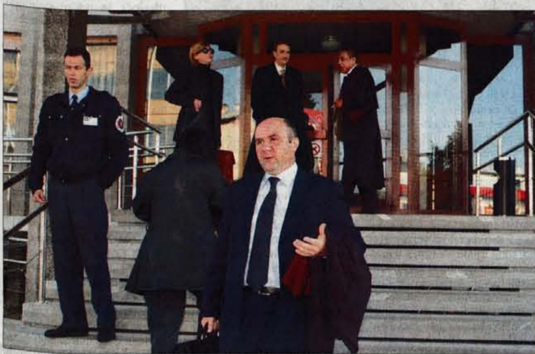
Tudi v sredo obtožencev na sodišču ni bilo, prišli so le njihovi zagovorniki.