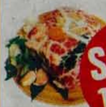
Mrežna pečenka Presno, ceno za kg MDK, Kočevje