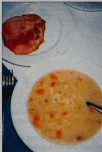
Ješprenj z zelenjavo, suhim vratom in smetanovim hrenom.

Ješprenček in fižol, ki smo ju namakali čez noč, denemo kuhat v večjo posodo. Po pol ure počasnega vrenja dodamo kos suhega vratu, po eni uri pa pri-