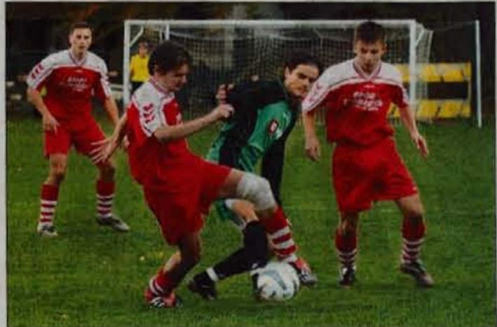
Jeseniški nogometaši so v sredo zanesljivo premagali Velenjčane.

okoli tisoč navijačev na koncu slavili s 3:1 (3:0). Tako so Jeseničani dosegli zgodovinsko zmago kluba, saj so si zagotovili nastop v polfinalu. Poleg njih si je mesto med najboljšo četverico z zmago 1:0 nad ekipo Bele krajine priborila tudi že Ljubljana. Tekmi med Nafto in Dravogradom ter CMC Publiku-