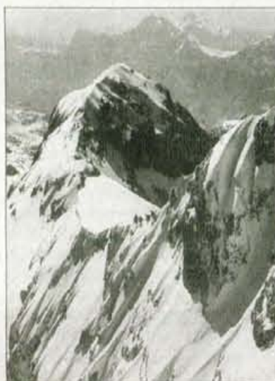
"Opasna točka" med obema Triglavoma

Mar ne velja gornja opazka še danes? Da bi kdo nosil "flaško" v rokavu, ne verjamem, v nahrbtniku pa jo skoraj vsak, dobi se tudi v koči za šankom. In korajže ne zmanjka. Med planinci jih je še vedno precej, ki brez te opojnosti v gorah ne morejo, objestnosti, ki iz tega sledi, zato ne zmanjka. Čeprav jo je, resnici na ljubo, zadnja leta malo manj kot pred nekaj desetletji. Kakorkoli že, Lavtičar je kmalu po svoji prvi triglavski skušnji dobil s škofije odlok, naj gre v Tržič. In je šel. "Sosed, ki je imel dobrega konja, je naložil zaboje na voz in jih odpeljal proti Tržiču, drugi dan pa sem odšel tudi jaz po zgledu apostolov s palico v roki v novo službo. Štiri