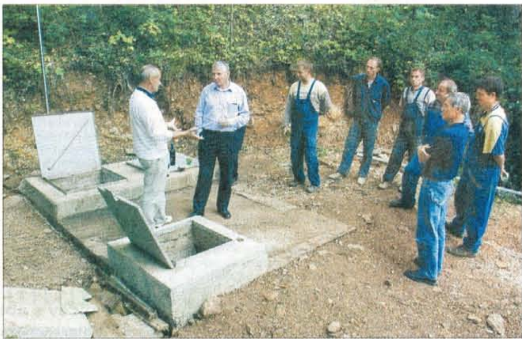
Pred tednom dni so simbolično nazdravili priključku vrtine na vodovod.

Olševska vrtina je globoka 140 metrov. Njena izgradnja je stala okoli pet milijonov tolarjev, dodatne tri milijone so dali za opremo, več kot devet milijonov