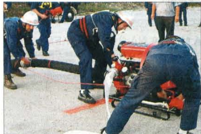
Med tekmovanjem smo v "akciji" pri pripravljavanju motorne brizgalne za gašenje ujeli starejše člane PGD Gorje.