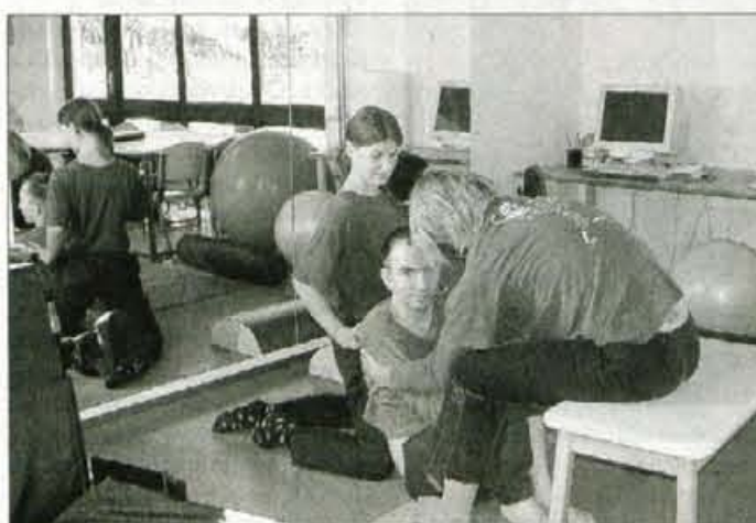
Z varovanci pri vsakodnevni telovadbi.