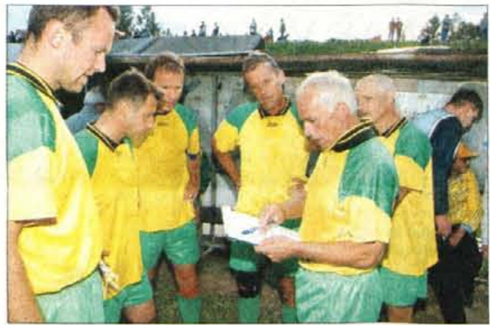
Napotki selektorja med odmorom - pa naj še kdo reče, da ni šlo zares.

kinj v ženskem nogometu, saj so se na teren poskusili "vtihotapiti" v skorajda identičnih zeleno-belih dresih. Ni uspelo - preoblekli so jih v rumene. Tudi Tof je nekaj hodil okrog sodnikov, navsezadnje pa je bilo tudi "načetih" vsaj še enkrat več kot