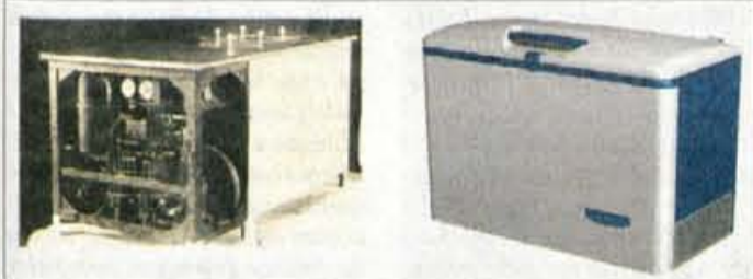
70 let razvoja: prva hladilna naprava (za izdelavo sladoleada) in nova zamrzovalna skrinja, ki jo v LTH uvajajo v proizvodnjo.

goslaviji. Imeli so svoj razvojni inštitut, ki pa se je ocepil, in konec razvoja je pomenil tudi začetek krize. Pretežna usmeritev na trg Jugoslavije in Vzhodne Nemčije je po razpadu teh držav pomenila hud udarec