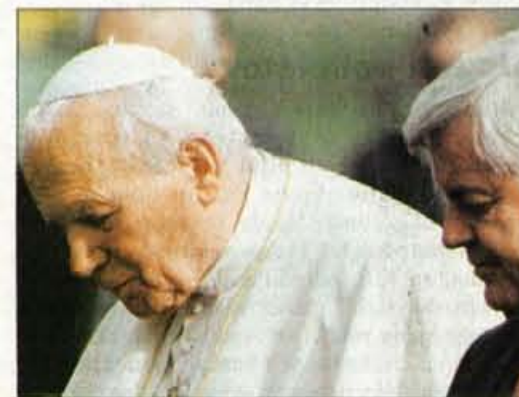
Papež Janez Pavel II., najmočnejši med duhovniki.