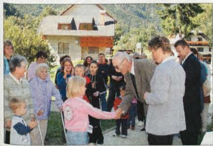
Učenci so izročili darila županu, izvajalcem del in ravnatelju Godnovu.

ARCUS INTERNATIONAL, s.p.a., Kapalka 29, Ljubljana