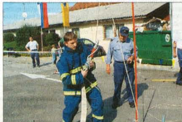
V mnogoboju v Vodicaх je tekmovalo 18 članov in štiri članice.

V Vodicaх občinsko, v Domžalah regijsko tekmovanje gasilcev.