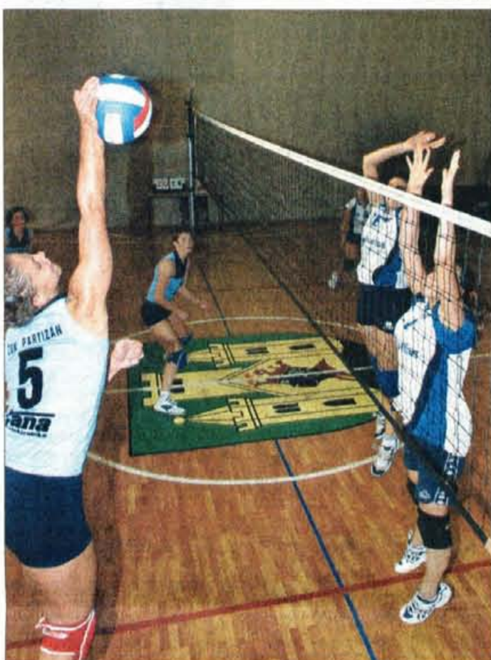
Domača dekleta so bila boljše od gostij iz Trsta.