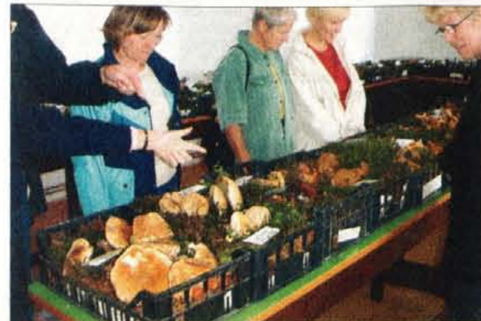
Redki obiskovalci so si z zanimanjem ogledali več kot 150 vrst razstavljenih gob.