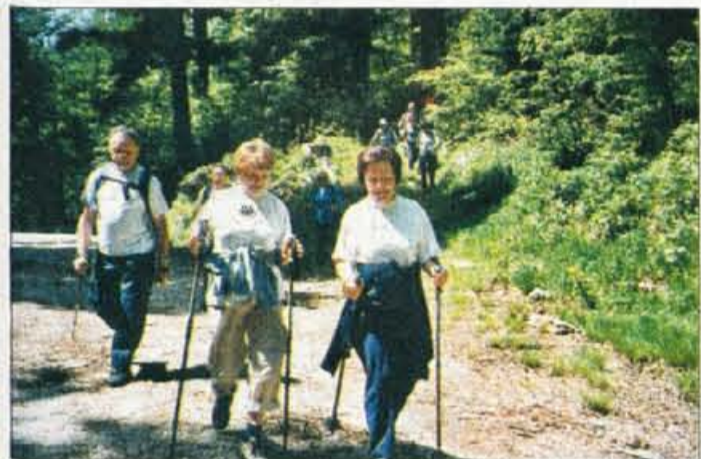
Eni hodijo, ker jim zdravnik tako svetuje, drugi v hoji preprosto uživajo.

ropskih mrež, ki delujejo na področju promocije zdravja, tako da promovira gibanje in športno rekreacijo med prebivalci evropskih držav. V okviru programa je nastal tudi nacionalni projekt "Slovenija v gibanju - z gibanjem do zdravja", ki se izvaja pod vodstvom CINDI Slovenija in Športne unije Slovenija. Namen projekta je zmanjšati delež telesno neadekvatnih Slovencev, glavne akcije v okviru projekta pa so meritve telesne zmogljivosti posameznikov s testom hoje na dva kilometra. Test je enostaven, natančen, varen in ponovljiv. Deluje tako, da na osnovi hitre hoje, ki jo posameznik zmore, ne da bi ogrožal svoje zdravje, določijo njegovo telesno zmogljivost in potem mu svetujejo ustrezno telesno dejavnost in športno vadbo, ki bo iz-