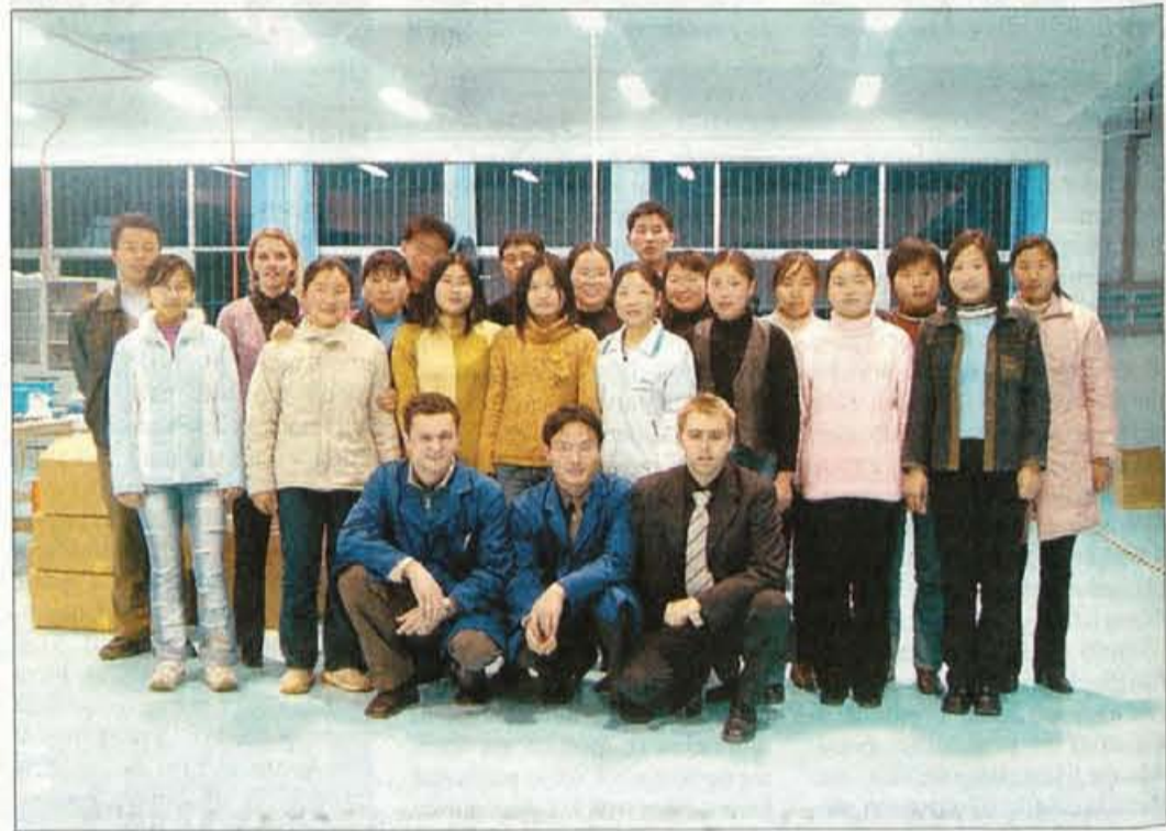
Lemutova z zaposlenimi v podjetju Sinoslo

"Njihova hrana je poceni, medtem ko je kakšen sir, ki ga oni ne poznajo, precej drag, pa še težko ga je dobiti. Na mlečne izdelke Kitajci niso navajeni, šele z odpiranjem mej je postalo mleko popularno. Ima pa življenje na Kitajskem drugo prednost. Tam vidiš hollywoodski film že dva meseca po njegovem izidu, na piratskem DVD-ju seveda. DVD je na Kitajskem že tako razširjen kot v Sloveniji videorekorder, je v vsakem domu."