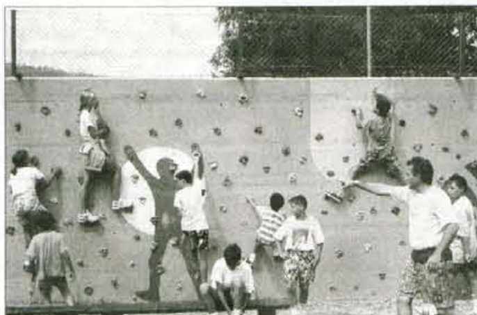
Zdravniki otrokom z astmo priporočajo gibanje. V zdravilišču Rakitna jim je za večanje telesne kondicije na voljo tudi umetna plezalna stena.

okužbe dihal, nekatere dražijo mrzel zrak, megla, izpušni plini, najslabše pa nanje vpliva cigaretni dim, kar ljudje in celo starši še premalo upoštevajo. Otroci z astmo naj bivajo v svetlih in suhih prostorih, priporočamo veliko gibanja na svežem zraku in izogibanje zaprtih prostorov v času prehladnih obolenj," je povedala