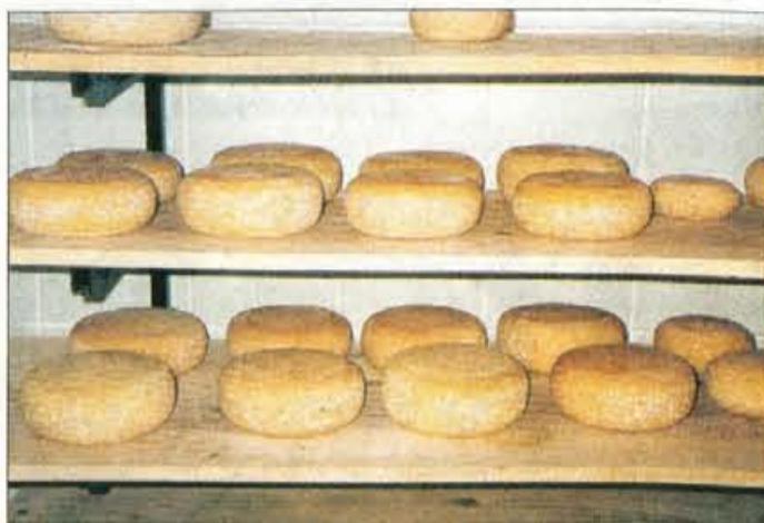
Pot se začne na planini Laz in končuje na Hlebanjevi kmetiji v Srednjem Vrhu, odkoder je tudi posnetek.

projektov na obmejnem območju Gorenjske in avstrijske Koroške, še zlasti projekta Organiziranje, predelava in trženje kmetijskih pridelkov na alpskem območju. Pot za zdaj poteka po treh občinah, v zavodu pa si želijo, da bi se nadaljevala po Karavankah in se končala na planinah pod Krvavecem ali morda še bolj proti vzhodu. V okviru projekta so pripravili različne delavnice, srečanja, ekskurzije in tečaje, med drugim prvič po štiri-