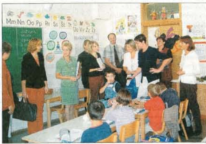
Gostje iz baltiškikh držav so v šoli na Orehku obiskali tudi Ožbeja, enega od vključenih otrok s posebnimi potrebami.

Kranj - Želeli so se namreč seznaniti s programi v korist otrok na področju družinske, socialne in izobraževalne politike, zato so obiskali vrsto institucij v Sloveniji, šolo na Orehku pa zlasti zaradi uspešnega vključevanja otrok s posebnimi potrebami v redni osnovnošolski program. Delegacijo je spremljala tudi predstavnica UNICEF-ovega urada iz Ženeve. V šoli na Orehku so goste seznanili s prakso vključevanja gibalno oviranih otrok, slepih in slabovidnih, dolgotrajno bolnih in otrok s primanjkljaji na področju učenja v redni šolski program. Takih otrok je v šoli trenutno sedem, za dva še pričakujejo odločbi. Zakon o vključevanju velja od leta 2000, k njegovi uveljavitvi pa je že pred desetletjem pripomogla tudi šola z