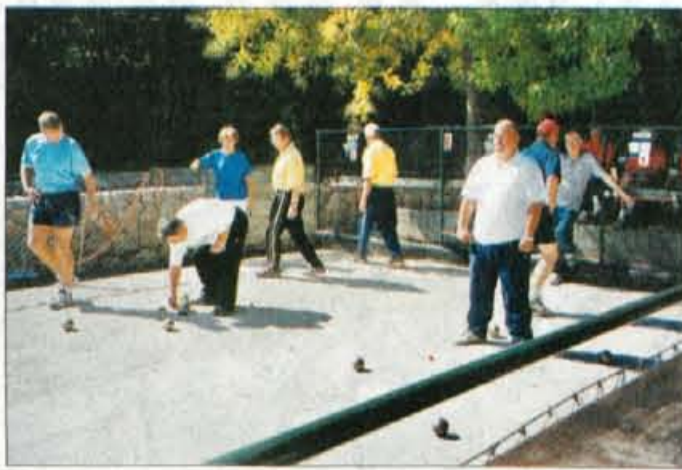
Balinarsko znanje in pravila so se strogo spoštovala.

Največ navijačev so imeli nogometaši, pa tudi košarkarjem