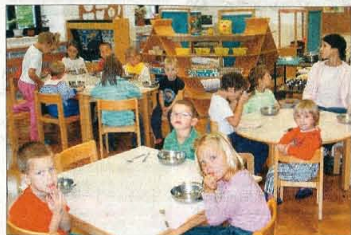
V vrtcu Palček na Jezerskem je letos 18 otrok.

Občina Jezersko si je prizadevala, da bi njihova osnovna šola dobila še peti razred. Radi bi namreč, da bi otroci vsaj do 10. leta starosti ostajali v domačem okolju tudi potem, ko bo devetletka že v celoti uveljavljena. V višje razrede osnovne šole se morajo