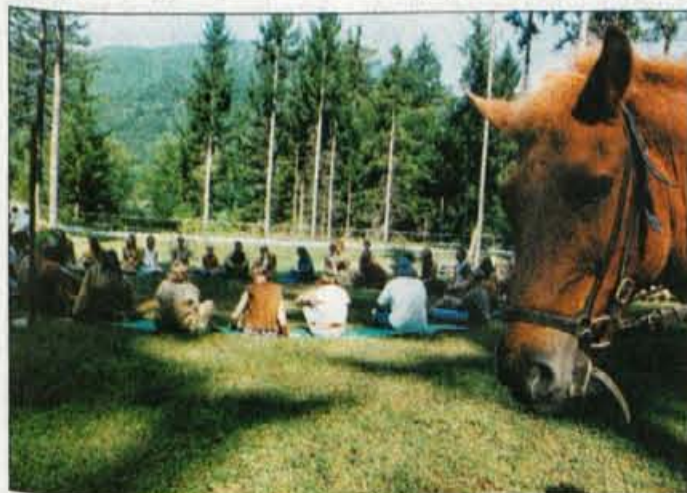
Simbolika kroga je stara kot človeštvo, krog pa je bil že včasih pomemben del človekovega življenja. Sedenje v krogu izraža popolnost, povezanost, enakovrednost in enost.

imata pika in krog skupne simbo- lične lastnosti: homogenost, odsotnost razločevanja ali delitve . Ob piki in krogu pa se pojavijo tudi koncentrični krogi, ki se oddaljujejo od centralne enotnosti, predstavljajo pa stopnje bitja in ustvarjeno hierarhijo . Vsi skupaj predstavljajo splošno pojavnost edinega in nerazodetega Bitja. V Zenskem budiz-