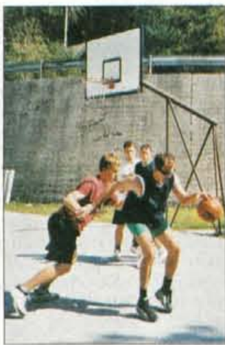
Radovljičani so se pod koši borili kot levi.