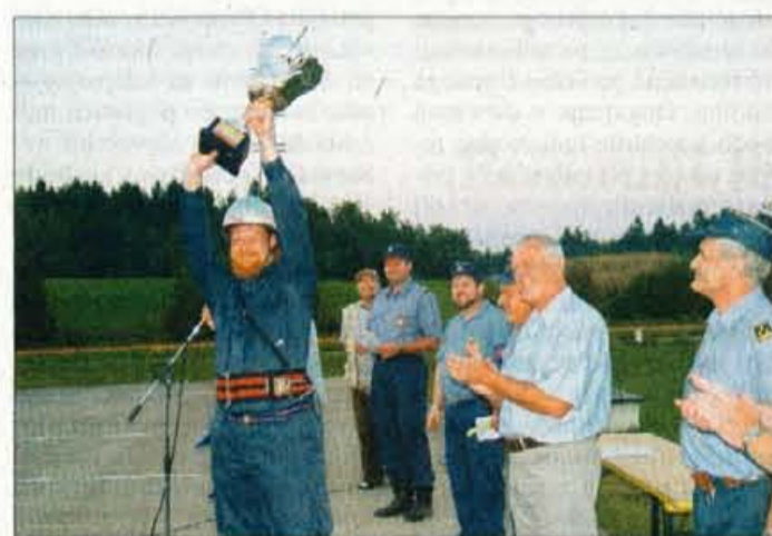
Prehodni pokal so v trajno last osvojili gasilci Šinkovega Turna.

Pirniče - Na igrišču osnovne šole Pirniče pa je bilo tradicionalno tekmovanje ekip iz Gasilskih zvez Medvode in Vodice. Iz GZ Medvode se je