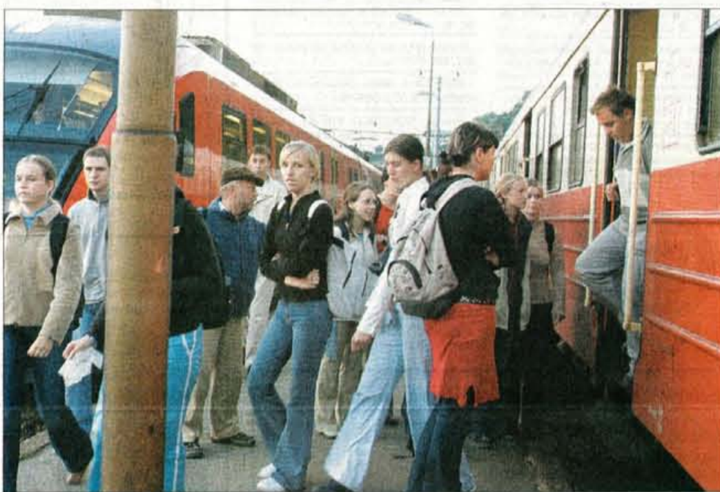
Gneča pred jutranjim "šolskim" vlakom.

odložijo na postaji, vožnja z vlakom do Ljubljane pa traja vsega 32 minut. Tako hitro se po cesti ne pride. Pa še družba se najde na vlak ali čas za zadnje ponavljanje učne snovi. Ali za branje jutranje izdaje časopise, kar