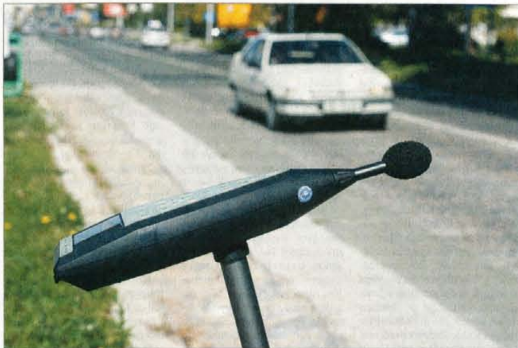
Včerajšnje meritve prometnega hrupa.

Svet za preventivo in vzgojo v cestnem prometu mestne občine Kranj je zato ob evropskem tednu mobilnosti v program ak-