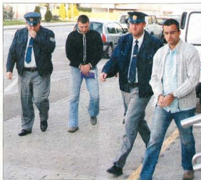
Trije obtoženci prihajajo na sodišče iz pripora.