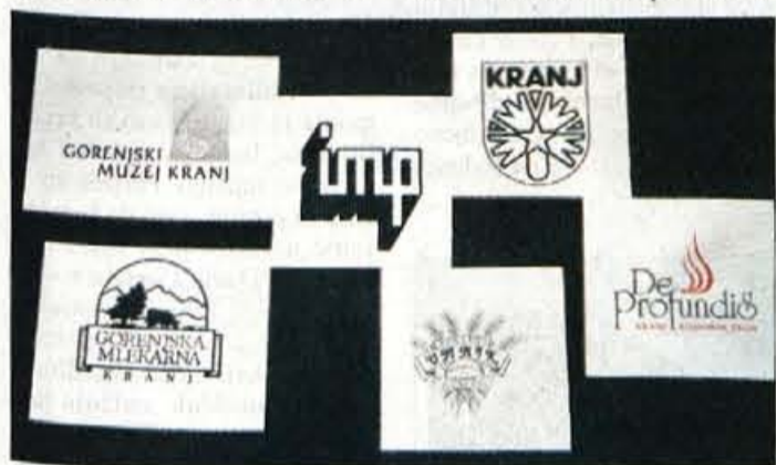
Mnogi znani znaki iz našega vsakdanjika.