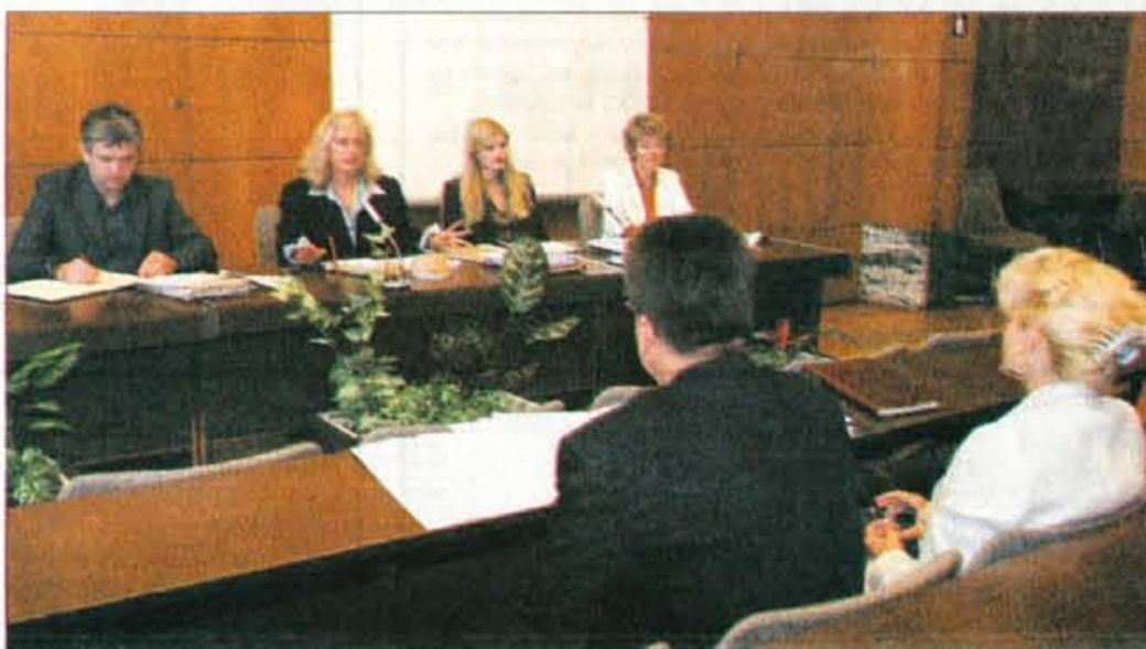
Zainteresirani za nakup občinskega zemljišča v Valdoltri.