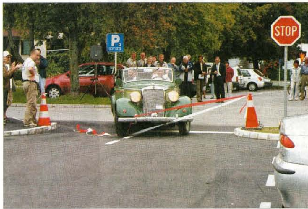
Novi parkirišči na Gradnikovi je s simbolično vožnjo odprl mercedesov starodobnik.