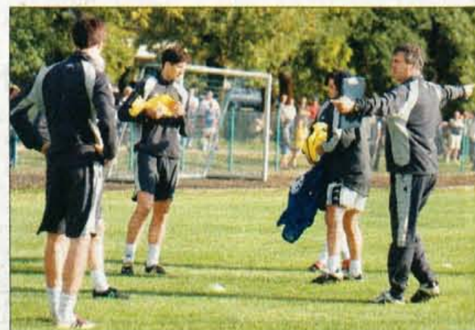
Nogometaše je na treningih na Bledu spodbujalo tudi veliko navijačev.

točkami, Izrael pa ima na tretjem mestu dve točki manj. Na vrhu skupine so s kar 15 točkami Francozi, četrta je s sedmimi točkami ekipa Cipra, zadnja pa brez točke Malta. Neposredno se na EVRO 2004 uvrsti le zmagovalec skupine, kar naj bi bila ob najbolj verjetnem scenariju reprezentanca Francije. Naši seveda računajo na končno drugo mesto v skupini, ki pa še malo ni lahko dosegljivo. Veliko, praktično že zadosti, bi pripomogla že jutrišnja zmaga za Bežigradom, že remi pa bi bil lahko usoden. Teža se zavedajo tudi nogometaši Izraela, ki so