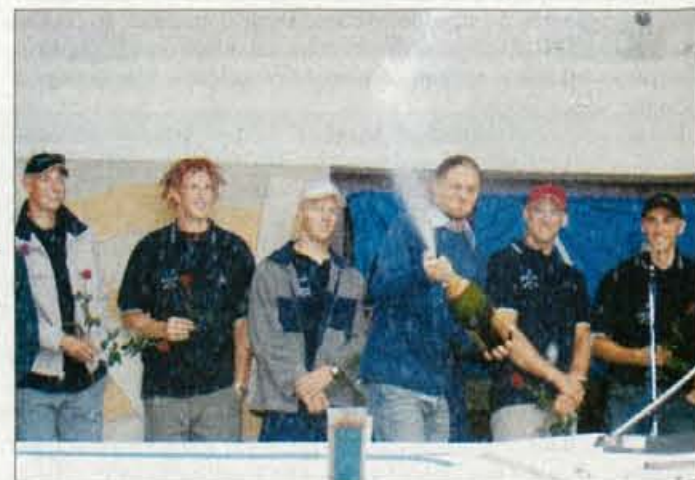
Veslači so proslavili vrsto letošnjih dobrih rezultatov.

Odprti hitropotezni turnirji v Lescah - V domu KS v Lescah bodo do novega leta potekali odprti hitropotezni šahovski turnirji. Termin so 7. september, 5. oktober, 23. november in 21. december. Vsakič se bo turnir začel ob 9.30 uri. V.S.