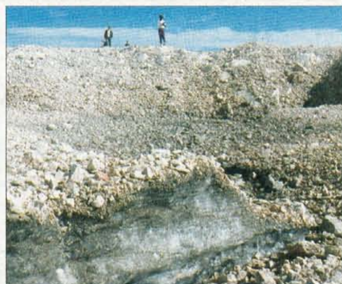
Robni del ledenika prekriva grušč, pod njim pa nastaja fosilni led.

je tudi vse ledeniške poteze. V zadnjih desetih letih je izgubil 100 tisoč kubičnih metrov ledu; po sestavi gre za vodni led. Robne dele je že zasul grušč, zato tam nastaja fosilni led. Prvič smo našli tudi sledove življenja, tanko belo glisto, ki jo proučujejo v inštitutu za biologijo. Če se bodo nadaljevale zime z malo padavinami in vroča poletja, se lahko zgodi, da Triglavskega ledenika v dveh letih ne bo več. Ledenik pod