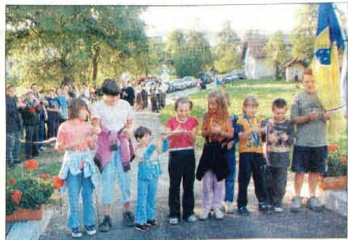
Most v Vesci so odprli najmlajši občani.

Prireditve se bodo nadaljevale tudi ta konec tedna. Tako bo že drevi (petek) župan sprejel delavce šole in vrta ob začetku šolskega leta, jutri bodo na pro-