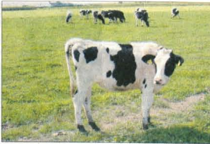
Na Gorenjskem je suša najbolj prizadela govedorejo.

sameznimi območji velike razlike. Ponekod je bila, na primer, silažna koruza takšna, kot da ni bilo nobene suše, le par kilometrov proč pa je bila zelo prizadeta. To je bilo odvisno predvsem od vrste tal, pri silažni koruzi pa tudi od časa setve. Najbolje jo je odnesla koruza, ki so jo kmetje posadili okrog 1. maja ali še malo prej in je imela še dovolj vlage za rast, najslabše pa se je