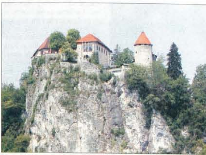
Država si poleg lastništva gradu želi tudi njegovo upravljanje.

Število obiskovalcev Blejskega gradu se zadnja leta povečuje, letos naj bi jih bilo okoli 180.000, kar pomeni, da bodo z vstopnino zaslužili dobrih 100 milijonov tolarjev. Občina porabi denar za čiščenje in vzdrževanje gradu in okolice, za kulturne prireditve in za ostalo blejsko turistično infrastrukturo. "Denar je doslej ostal na Bledu, občina pa je določila prednosti njegove porabe. Ne bežimo od sodelovanja z državo in Muzej Slovenije, saj bomo skupaj morali poskrbeti za posodobitev