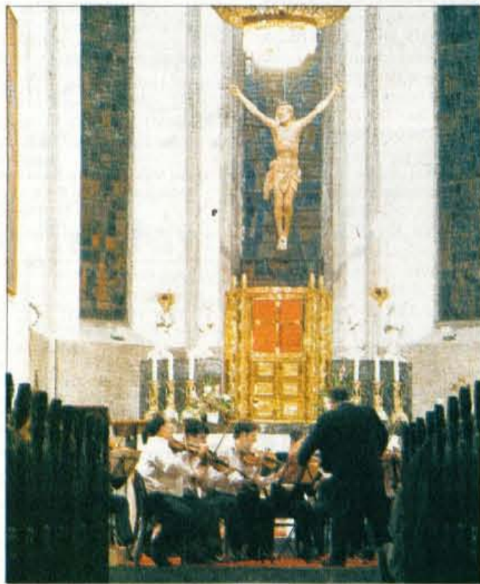
Imago - komorni godalni orkester, sestavljen iz solistov berlinske filharmonije, je cerkev Sv. Kancijana in tovarišev napolnil z zvoki Mendelssohna, Vivaldija in Mozarta.