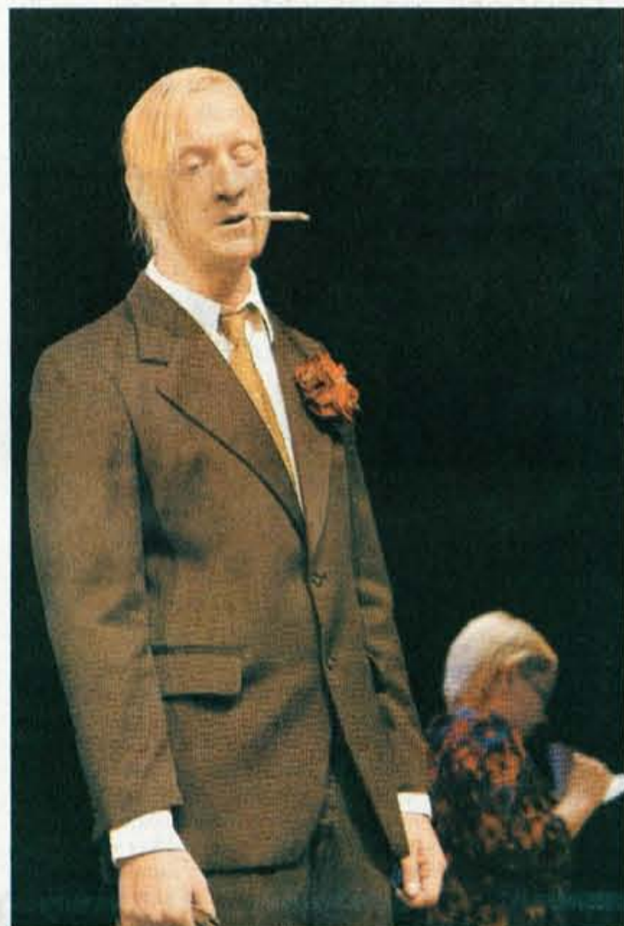
Molierov Skopuh v izvedbi Prešernovega gledališča Kranj

Le umetniki in otroci vidijo življenje, kakršno je.