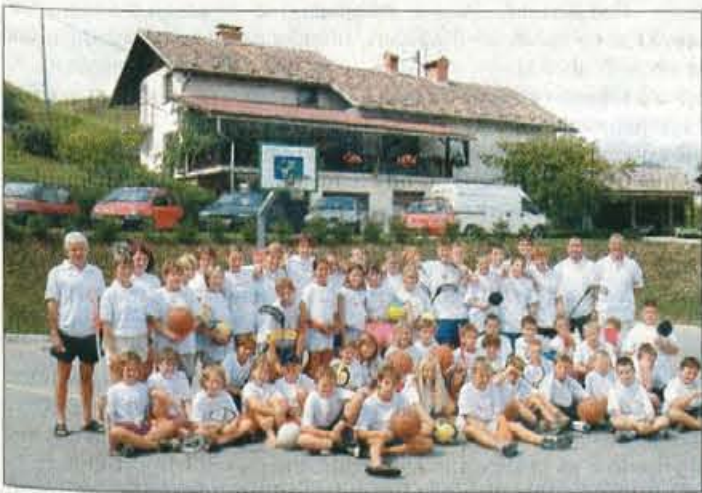
Gasilska slika vseh 52 udeležencev tabora in trenerjev.

Gorenja vas - Letošnji športni tabor so prvič obiskovali tudi učenci iz podružničnih šol na Sovodnju in v Lučinah ter tudi učenec OS Poljane.