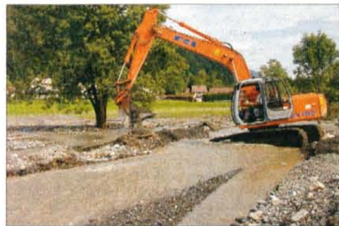
Trebiža je poplavila že leta 1891, ko je bila enaka povodenj tudi v Kanalski dolini. Tedaj je država pomagala, leta 2003 pa slovenski državni hudourniki niso več mar.

pomeni 130-letno povratno dobo eno in pol urnih padavin. Ministrstvo še piše, da posledice hudournikov na objektih niso katastrofalne, saj je bilo poplavljenih manj kot 20 kleti, stavbe pa so ogrožali trije manjši potoki Trebiža, Tofov graben in potok s Srednjega vrha ter 4 hudourniki. Malo glede na hidrološki pojav in poseljenost doline," je zaključilo državno ministrstvo. Darinka Sedej