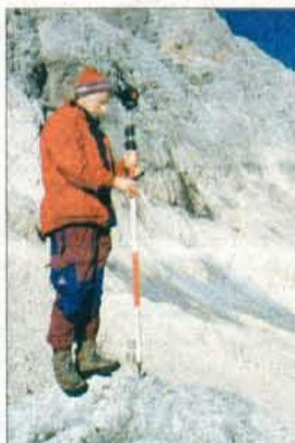
Tudi letos so strokovnjaki opravili natančne meritve Triglavskega ledenika.

še za vzorec. Od 25. do 27. avgusta 2003 so namreč potekale redne meritve, pri katerih je sodelovalo sedem naših raziskovalcev, član Geodetskega inštituta in alpinist. Trenutno še poteka obdelava zračnih podatkov, vendar smo že ugotovili, da sta površina in debelina ledenika manjša. Sedaj ga je približno hektar ali malo manj, izgubil pa