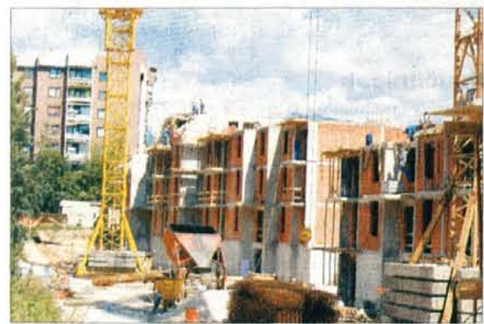
Domplanova stanovanja na Planini bodo vseljiva konec maja prihodnje leto.

Kranj - Medtem ko Gradbinec GIP v Drulovki gradi 66 stanovanj za trg, ki jih bo kupcem predal konec prihodnjega avgusta ali v začetku septembra, pa na Planini, v ulici Rudija Papeža, tik ob osnovni šoli Matije Čopa, škofjeloški Tehnik za investitorja Domplan gradi 75 stanovanj, ki bodo nared za vselitev konec maja prihodnje leto, torej v času, ko se izteče prvo varčevanje po nacionalni stanovanjski shemi.