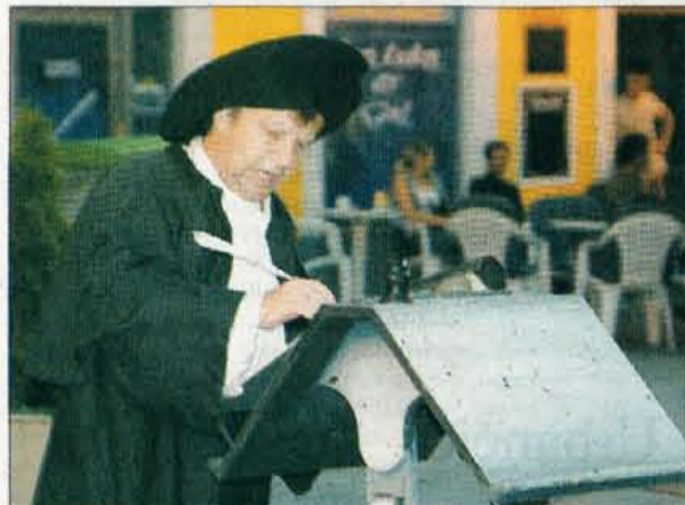
Ulična predstava 'Hlebček guspe Lize' Šentjakobskega gledališča Ljubljana.