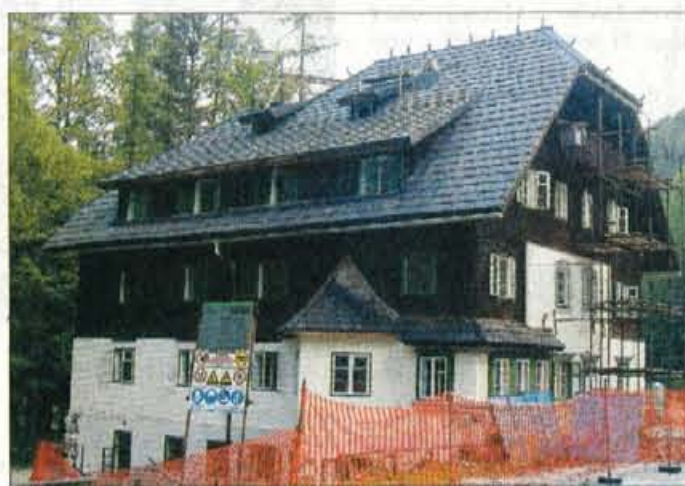
Zavod za varstvo kulturne dediščine Kranj zahteva, da se depandansa ohrani taka, kot je bila leta 1930, investitorji pa ne želijo graditi muzeja...

Na občini pravijo, da niso sprejeli nobenega odloka o zaščiti depandanse, brez občin-