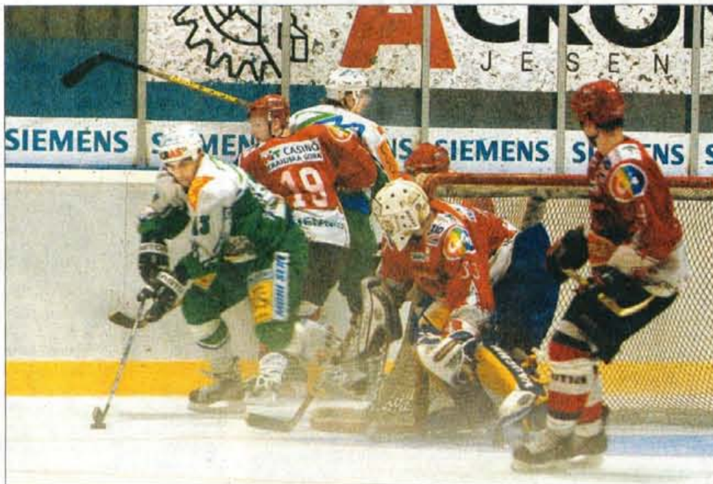
Na sobotni tekmi proti ZM Olimpiji so Jeseničani slavili prvo letošnje zmago.

Po blejskem turnirju, ki se je zaradi nenastopanja Jeseničanov iz turnirja spremenil zgolj v prijateljske tekme naših državnih prvakov, ZM Olimpije, mlade slovenske reprezentance do 20 let in ekipe celovškega KAC-ja, je bil to tudi prvi uradni mednarodni turnir ob začetku letošnje hokejske sezone. Morda je bil na sporedu malce prekmalu, saj sta zlasti domači moštvi šele začeli s treningi na ledu, vsekakor pa je bil dober uvod v dolgo hokejsko sezono, ki se bo že ta konec tedna nadaljevala z nastopi reprezentance na turnirju v Italiji, 9. septembra pa se bo na Jesenicah začelo tudi tekmovanje za karavanski pokal, na katerem bodo nastopala moštva VSV iz Beljaka, KAC-ja iz Celovca, ZM Olimpije iz Ljubljane in domača ekipa Acroni Jesenice. Prvi dan turnirja za pokal mesta Jesenice