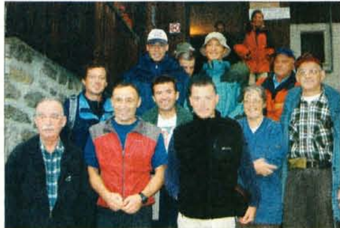
1. junija do 30. septembra, izven sezone pa ob koncu tedna in praznikov. V njem vsako leto naštejejo okrog 15 tisoč obiskovalcev in blizu 500 nočitev.