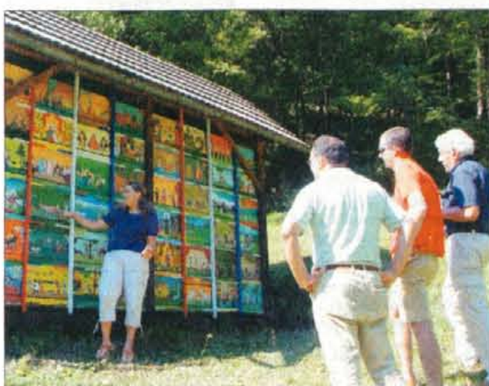
Na Golem brdu je že 69 let vzrejalšče matic.

"Bilo je veliko dela, da smo pripravili razstavo, vendar z obiski z vsega sveta je bil trud poplačan." V Cerkljah so na razstavi, kjer ima društvo 68