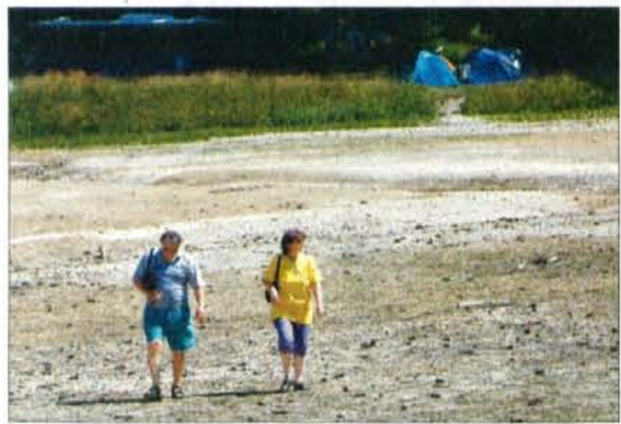
Planšarsko jezero na Jezerskem je presahnilo: ribe so poginile ali se umaknile, "prišli" so sprehajalci.