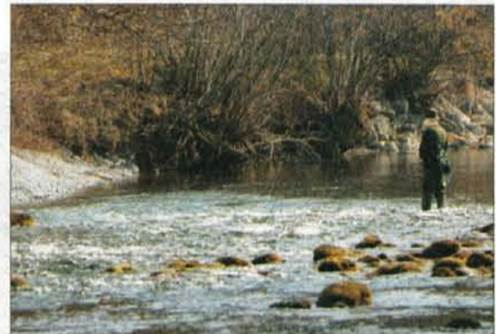
Ribe v pretopli vodi slabo prijemljejo.

"Naša čuvajska služba je odkrila letos precej več primerov nedovoljenega ribolova kot v običajnih letih. Ob rekah in jezernih je bilo več kopalcev, ki so izkoriščali nizek vodostaj tudi za lovljenje rib. Poleg krivolova so bili še drugi problemi. Nekateri so v potokih in rekah čistili avtomobile, s cisternami odvažali vodo za zalivanje ali celo menjali olje v avtomobilu."