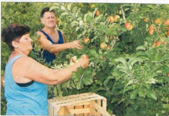
V Resju že obirajo zgodnje sadje.

"Za vroča poletja je značilno, da se pogosteje pojavljata pršica