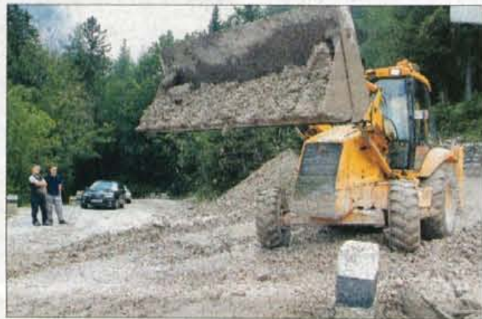
Vršička cesta je bila na več krajih zasuta s kamenjem z bližnjih gora...

Narasli hudourniki, ki po naseljih Zgornjesavske doline grozijo hišam, so posledica tega, da je država Podjetju za urejanje hudournikov odvzela koncesijo. Hudournike naj bi že dve leti vzdrževala kar sama. Pa jih ne. Posledice so tu. Katastrofalne. Darinka Sedej, foto: Gorazd Kavčič