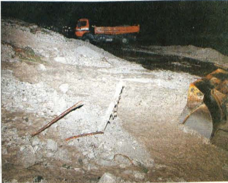
Z gora so na vršiško cesto dva dni grmeli plazovi in jo z večmetrskimi nanosi zasuli na več krajih, vse od Erike do Erjavčeve koče.