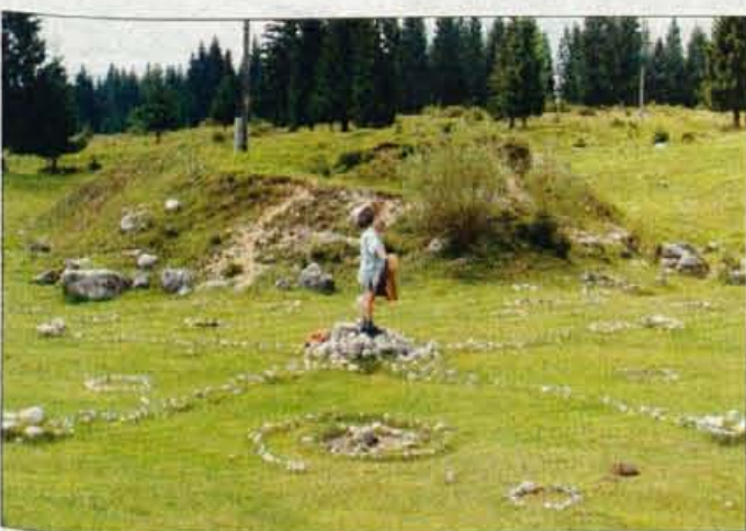
Točke na Praprotnici privabljajo številne radovedneže in ljudi, ki verjamejo v zdravilno moč blagodejnih zemeljskih sevanj.