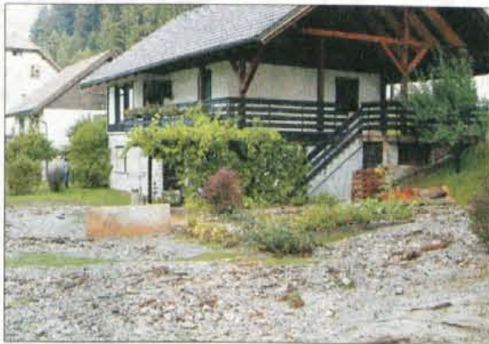
Rateče so bile najhujše prizadete, tudi Makovecova hiša, kamor je pridrvel hudournik, ki je z vrta odnesel vse...

V soboto dopoldne so si ogledovali škodo, ki je velika, a še ni ocenjena. Voda je poplavlila 20 hiš in gospodarskih poslopij, tudi kranjskogorsko šolo in hotel Špik, v Ratečah so vsi hudourniki do vrha polni materiala, v Podkorenu je odneslo del kolesarske steze, v Tamarju so grmeli plazovi, odneslo je rateš-