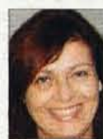
Piše Eva Senčar