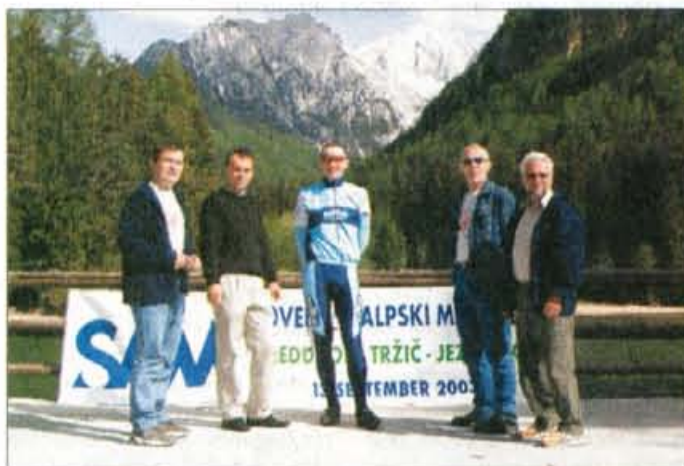
Predstavniki Kluba trmasti Preddvor na tekovanjih in pri organizaciji tovrstnih tekovanj pokazujejo železno voljo.

Iztok pravi, da je s pripravi in organizacijo tovrstne prireditve veliko dela. "Seveda