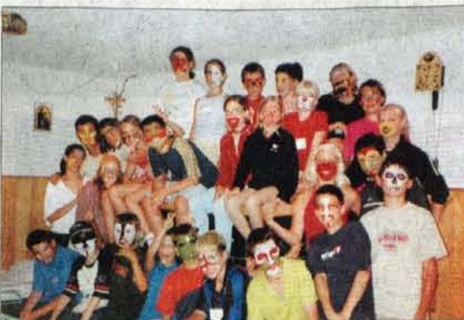
Na taboru je poleg učenja dovolj časa tudi za igro in veselo zabavo.

Ljubljana - Konec julija se je končal prvi od štirih poletnih taborov Berlitzove jezikovne