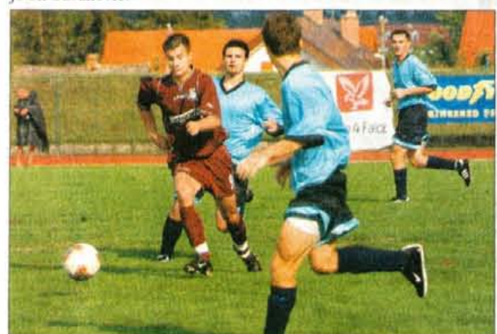
Kranjski nogometaši so v nedeljo doma premagali ekipo Svobode.