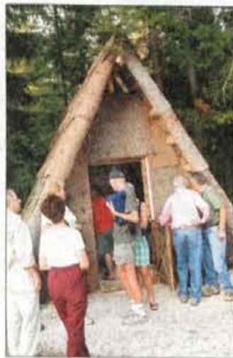
Ob kopi je še kožarica, značilno bivališče oglarjev.