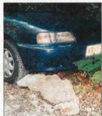
polomljeni slovenščini, lepše pa: "Popolna, stoodstotna varnost!"