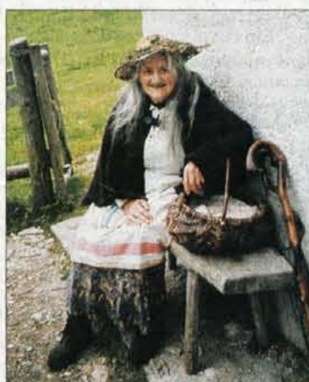
Kranjskogorska Pehta, v Lavtizarjevem času še živa v ljudski domišljiji

ne knjige, vsi pa so čitali iz žive knjige narave. Priroda jim je nudila toliko različnih snovi, da so jih s svojimi rokami preoblikovali v čutni izraz: mizarju les, tkalcu volno, predici lan ... Niso hodili po prodajalnicah, da bi kupovali stvari, ki so jih sami izdelovali. Zato so pa nosili obleko iz domačega blaga, lično in trpežno. Hiše, večinoma še lesene, so imele prijazen vnanost, družine so bile z malim zadovoljne. Slavnostna čustva so prevladovala ob nedeljah in praznikih, ko je naše pradede vabil farni zvon k božji službi. Vsak prihod domov in odhod z doma je bil slovesen trenutek, ker so takrat ljudje le malo potovali. V današnjem modernem človeku je umrla smisel za domače delo. Kriva sta temu stroj in tovarna, ki izdelujeta to, kar so poprej izdelovali doma. Sedanji človek nima druge skrbi, kakor da zasluži denar in ga zapravi v uživanju. Z drugimi