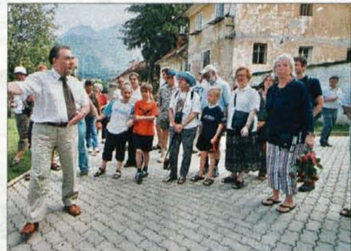
V tolikšnem številu in v Preddvoru so se letos zbrali prvič, čeprav je bilo podobno srečanje organizirano že enkrat prej.

ske, kasneje Jugoslovanske ljudske armade, ob koncu istega leta pa je grad začel dobivati vlogo, ki jo ima še danes: postal je prebivališče starostnikov. Danes se grad Turn imenuje Dom oskrbovancev Albina Drolca.