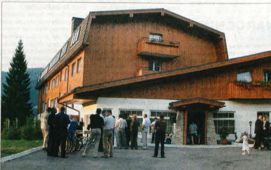
V novem hotelu Bohinj so v prvih petih dneh zabeležili 350 nočitev, dobra zasedenost se obeta tudi jeseni.

ba Alpinum je hotel obnovila v rekordnem času, saj so ga od Kompara kupili maja. Kljub temu, da ga niso tržili, je bil že v prvih dneh zaseden več kot 40-odstotno, v petih dneh so zabeležili 350 nočitev, septembra pa pričakujejo dober obisk nemških in izraelskih gostov. Z eno od tujih agencij so podpisali tudi pogodbo za prihodnje leto; v petnajstih sobah bodo od maja