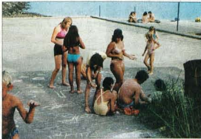
Udeleženci letošnjega poletnega tabora v Ankaranu so uživali tudi v različnih delavnicah, med drugim so risali na asfalt.

Otroci so se zabavali v različnih delavnicah, nabirali plavalne izkušnje, si ogledali mesto, zadnji večer pa so izbrali tudi mistra in miss tabora. Poleg tabora bodo študentje letos poskrbeli tudi za mlade študentske družine, ki bodo oktobra prejele denarno pomoč, za slednjo je predvidenih 1,5 milijona tolarjev. Lani je vsaka od dvanajstih družin prejela vrednostni bon za 40.000 tolarjev. Radovljiški klub študentov, ki deluje od leta