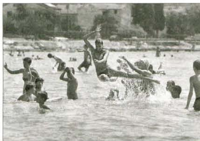
V času letovanja otrokom ni dolgčas.

Pri Zvezi prijateljev mladine Slovenije se zavedajo, da je kakovostno preživljanje prostega časa najboljša naložba za zdrav razvoj otrok, ki bodo nekoč odrasli in se kot taki vključevali v različna področja življenja in dela. Tega se zavedajo tudi pri Leku, saj so se v program Zveze prijateljev