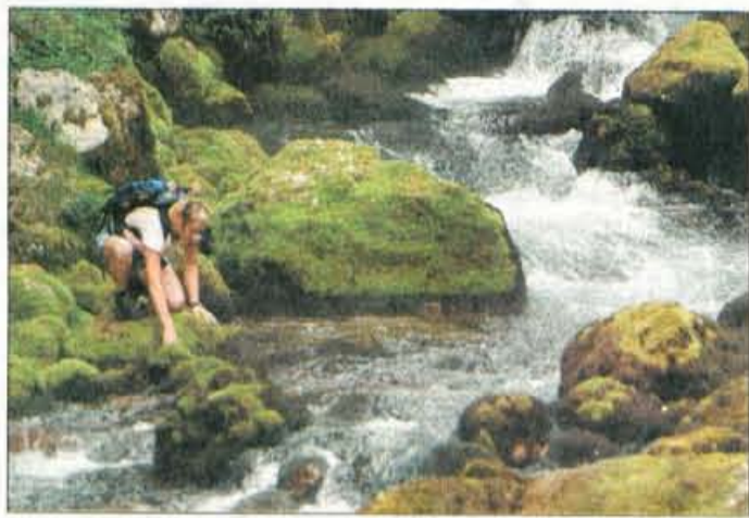
Izvir Gljune ima temperaturo 5,5 stopinj.

Izhodišna točka je bila tako za kolesarje kot pohodnike spodnja postaja kabinske žičnice na Kanin. Kolesarjem je vso opremo dostavil produktivni vodja Elana Gorazd Stražičar, ki je tudi sam navdušen nad gorskimi kolesarskimi spusti in vzponi. Novinarskim kolegom je raz-