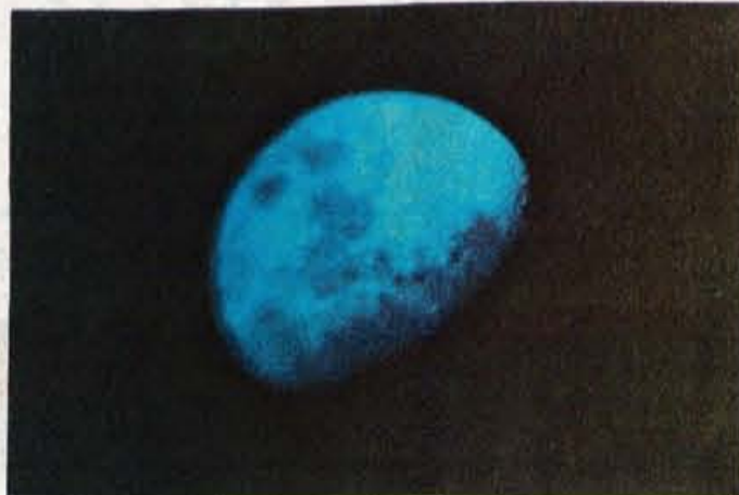
Luna je energetsko najbolj vplivna v času, ko se debeli ali ko se tanjša.

Skoraj vsi prav dobro vemo, da se ob polni luni ljudje obnašamo nekoliko drugače, kar pa ni nič nenavadnega, saj če luna vpliva na dvig ogromnih gmot, kakor so oceani, kako ne bo v neki meri vplivala tudi na nas. Redki so primeri ljudi, ko jo v času polne ali prazne lune "dobro odnesejo". Naše obnašanje je v povprečju bolj zmedeno, v zavest se nam dvignejo stvari iz podzavesti, pozornost je manjša. To se v javnosti kaže predvsem v prometu in znano je dejstvo, da je v času prazne in polne lune veliko prometnih nesreč in nezgod. Vendar pa vplivi obeh lun niso le destruktivni, ampak tudi konstruktivni. Kadar je polna luna, je v zraku zelo veliko energije, ki pomaga pri učenju in študiranju, zato za šolarje morda ne bi bilo slabo, ko bi vedeli, da se v dneh, preden luna postane polna, nahaja v ozračju veliko energije, ki pomaga pri učenju in študiju. Če jim uspe ohraniti zbranost in mirnost, se lahko v zelo kratkem času veliko naučijo, predvsem pa si snov zapomnijo veliko lažje.