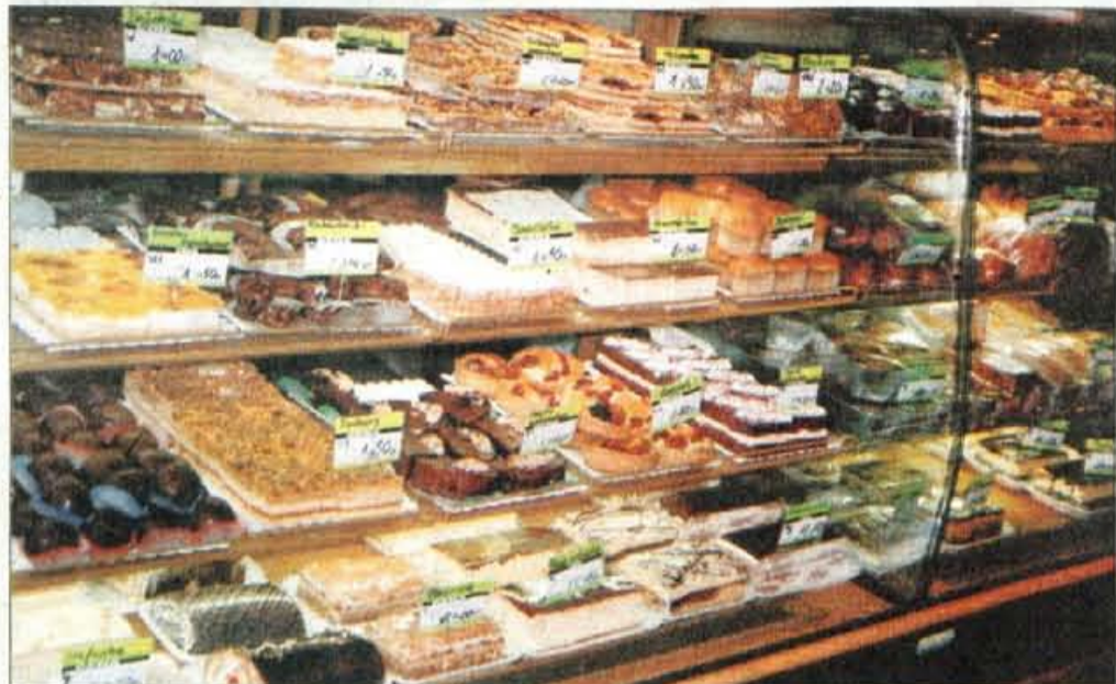
Poljaki obožujejo slaščice in imajo na vsakem vogalu majhno slaščičarnico.

Pred večerno zabavo pa smo si privoščile majhen kulinarčni izlet. Krakovski poulični