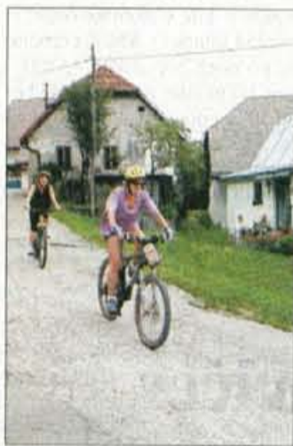
Kolesarji v Bovcu lahko vsak dan doživijo in podoživljajo nove kolesarske poti.

Dan je minil prijetno. Popoldne je deževalo, vendar je bilo v jutranjih urah vreme ravno pravšnje tako za kolesarjenje kot pohodništvo. Projekt razvoja adrenalinskih kolesarskih poti je sicer zastavljen v nekih določenih okvirih, vendar tako, da ga lahko prilagajajo glede na adrenalina željne, z njim popestrijo turistično ponudbo ali pa ga ponudijo kot posebno, samostojen del programa. Alenka Brun