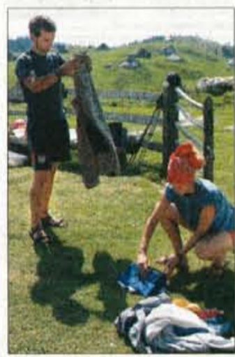
Mladi iz različnih delov Evrope so na Veliki planini uživali. Radi so pomagali pastirjem, se družili in poslušali zanimivosti o pastirjih in življenju na planini.