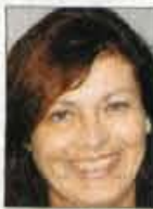
Piše Eva Senčar

Dela je ocenjevala umetnostna zgodovinarica Anamarija Stibilj - Šajn : "Kolonija je bila na