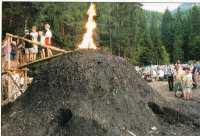
Oglarska kopa na kopišču v Gozd Martuljku.

V preteklosti je bilo prav oglarjenje najpogostejša oblika izkoriščanja gozdov na Gorenjskem. Fužinske peči in talilnice, koksarne in kovačije so za svoje delo potrebovale velike količine oglja. V zlati dobi fužinarstva,