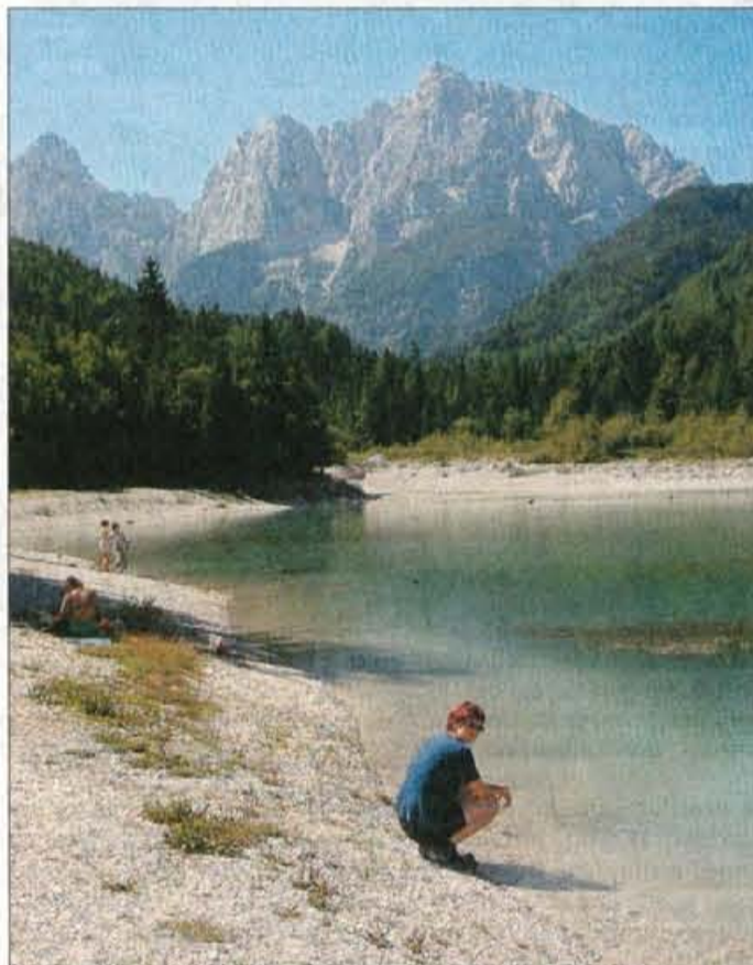
Ledeniki izginjajo, alpska jezera se sušijo kot Jasna v Kranjski Gori, kamor so v izušeno jezercer morali speljati vodo iz hudournika Pišnica, da je spet tako kot nekoč...

Ali bomo doživeli, da bo imela Ljubljana temperature Portoroža?