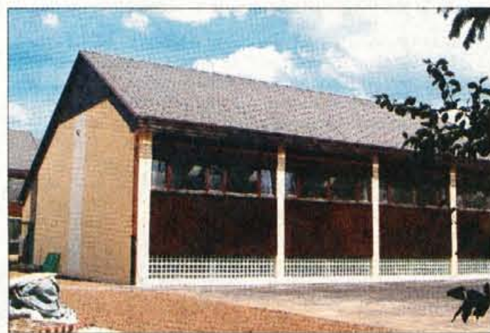
Učence Osnovne šole Antona Janše bo jeseni pričakala nova telovadnica, ki jo bodo uradno odprli danes popoldne.

"Vzporedno z investicijami potekajo tudi aktivnosti za oži-