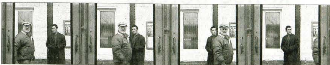
Vstopiti ali ne, povečana človeška neodločnost