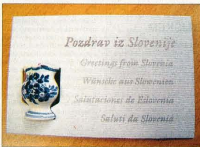
Majolika z vizitko, prva nagrada slovenski spominek 2003

tudi s pospeševalnim centrom za malo gospodarstvo in da so uspešni v grozdu s še nekaterimi firmami. Vse pomembnejša pa postaja tudi tako imenovana tehnična keramika, ki jo izdelujejo v Eti Svit v Kamniku.