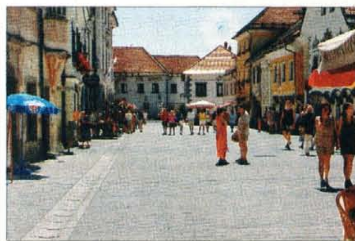
Občina je letos prenovila Linhartov trg, na katerem bo drevi osrednja slovesnost ob občinskem prazniku, prihodnjo nedeljo pa bo prizorišče letošnjega radovljiškega festivala.

PARADA PO RADOVLJIŠKIH ULICAH ŠOTOR PRED HOTELOM GRAJSKI DVOR V RADOVLJICI NASTOP PIHALNIH ORKESTROV, TRADICIONALNA PRIREDITEV "DRUŠTVA VEČNO MLADIH".