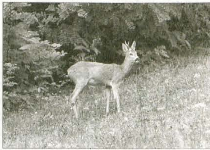
Še večjo škodo kot srnjad povzročajo jelene.

tolikšno, da bi jim vrnilo vero v kmetovanje na gorskih kmetijah, smo slišali od kmetov v Kokri, ki imajo travnike ograjene z električnim pastirjem kot Dachau, a še to bolj malo pomaga. Ko ostanejo brez košnje, jim škoda povrnejo v senu, ki ga pripeljejo iz doline, pa tudi če jo povrnejo v denarju, to ne odtehta truda na gorskih kmetijah, ki ga vsako leto znova izniči divjad. Kako ravnati z divjadjo, da bo v prid naravnega ravnovesja in da ne bo škodilo kmetom, ki gospodarijo v teh krajih? Kmetje niso za poboj divjadi, radi pa bi realen odstrel, ki bi zmanjšal