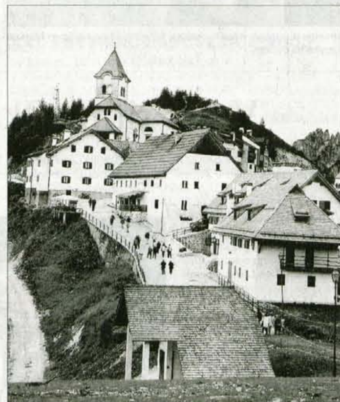
Višarje v Kanalski dolini so priljubljena božja pot.