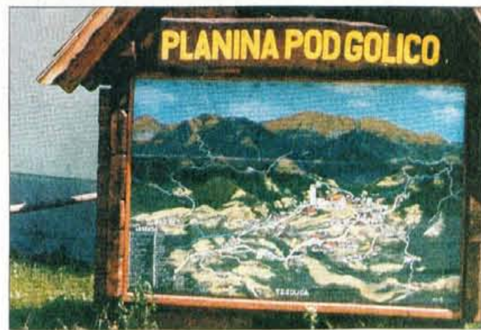
Nova informacijska tabla v Planini pod Golico

Planina pod Golico - Člani Turističnega društva Golica se po nekajletnem zatišju spet tvorno vključujejo v vsa pomembna dogajanja v kraju in okolici. V maju so z več odmevnimi prireditvami polepšali obiske več kot 12 tisoč ljubiteljem narave, ki so občudovali bele poljane narcis oziroma ključavnic ter se vzpenjali na priljubljeno Golico. Postavili so novo informacijsko tablo in lično urejene kažipote, ki popotnike vodijo do vseh znamenitosti v kraju in Karavankah. V Štefelinovi hiši, kjer je informacijska pisarna, so pripravili razstavo o Kadilnikovi koči. Na vrhu Golice, kjer je pred požigom stala ta koča, so namestili klopi, da se obiskovalci ob vzponu na vrh lahko odpočijejo.