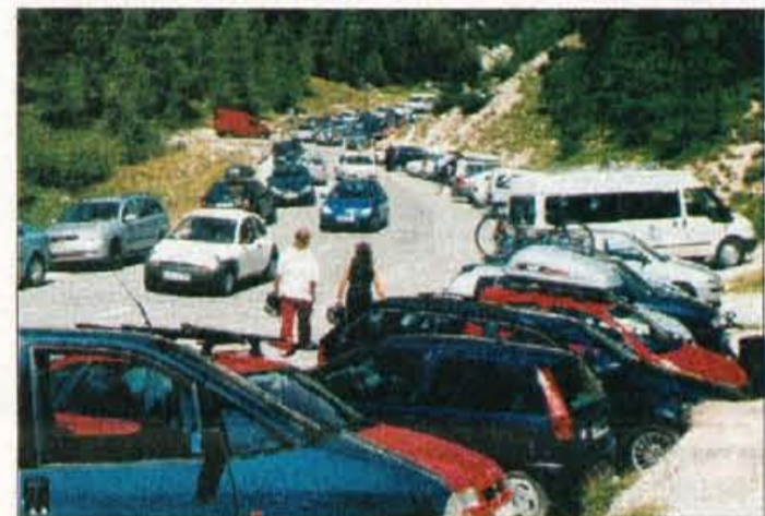
Poletni pogled na kup pločevine na Vršiču

Vršič - V Gornjesavski dolini z avgustom doživljajo vrhunec letošnje poletne turistične in planinske sezone. Zagotovo najbolj oblegan je naš najvišji prelaz Vršič, ki bo letos potolkel marsikateri rekord, predvsem po množičnem prometu. Predvsem ob vikendih se iz Kranjske Gore preko Vršiča do Bovca in nazaj valijo kolone osebnih vozil, kombijev, sem in tja se pojavi še kakšen avtobus, da o motoristih in kolesarjih sploh ne izglablamo besed. To so seveda premikajoče se kolone, potem pa je še na vsakem prostem mestu ob cesti, na travi, pod smrekami na kupe pločevine. Včasih se v ostrih ovinkih vsi prav čudežno srečujejo in potrebna je zares skrajna previdnost. Zgodba zase je vrh Vršiča, kjer je včasih prava prometna zmešnjava. Celo pobiralci parkirnine so ob konicah nemočni, saj