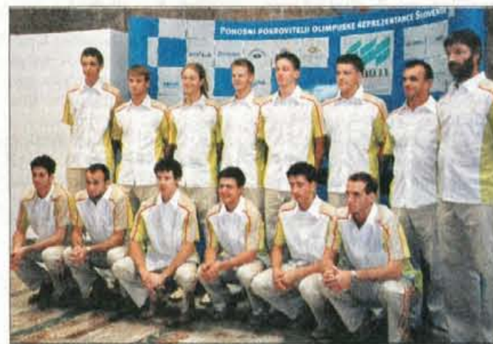
Mladi odbojkarji so v Parizu dokazali, da ima slovenska odbojka lepo bodočnost.

Minulo soboto so se z olimpijskega festivala vrnili naši mladi športniki, ki so v Parizu osvojili tudi štiri olimpijska odličja.