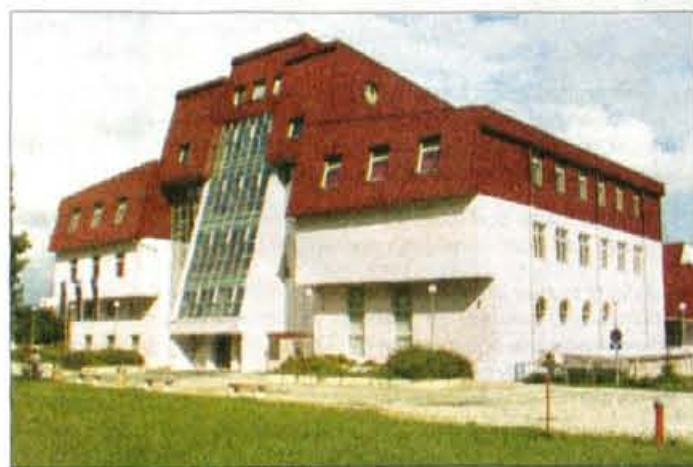
"Okolica Fakultete za organizacijske vede že dobiva pravo podobo visokošolskega središča"

najodmevnejših dosežkov je nedvomno že tretje leto zapored organizacija Kranjske noči, ki pa je letos nastopila v podobi pravega mednarodnega in kulturnega festivala. V tem času je mesto Kranj povsem oživelo, saj takšne prireditve nudijo idealno priložnost za vzpostavitev pozitivnega odnosa med univerzitetno in lokalno skupnostjo, kjer se na enem mestu srečajo občani, kulturniki, študentje in profesorji. Peter Wolf ml.