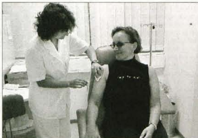
Pred potovanjem v tuje dežele poskrbimo za cepjenje, ki nas bo zaščitilo pred neprijetnimi in pogosto hudimi boleznimi.

Več kot 50 odstotkov potnikov ima na potovanju težave s potovalno drisko. "V teh primerih morajo ljudje piti dovolj tekočine in poskrbeti za zadostne količine soli in elektrolitov. Če slednjih nimamo pri roki, si lahko pomagamo z naslednjo pijačo: litru prekuhane vode dodamo 1 čajno žličko soli, 5 čajnih žličk sladkorja ter sok 1 limone in 1 pomaranče. Priporočljivo je tudi pitje juh in sadnih sokov. Če med blatom opazimo kri, gnoj ali sluz in se težave po treh dneh ne umirijo, moramo nujno poiskati zdravniško pomoč. Zelo koristno je, če imate s seboj antibiotike, oglje pa priporočamo pri zastrupitvah, saj veže strupe. Proti koleri cepiva v Sloveniji ni oziroma se je