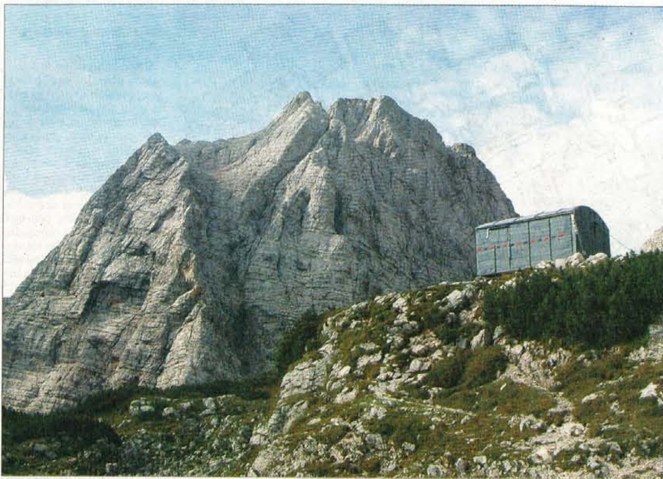
Biviak na Rušju je na obljudeni poti na Škrlatico in Stenar in zato redna "tarča" objestnežev.