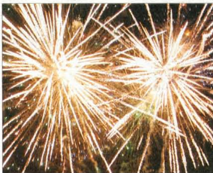
Veličasten ognjemet je za več kot deset minut razsvetlil nebo nad Kranjem.