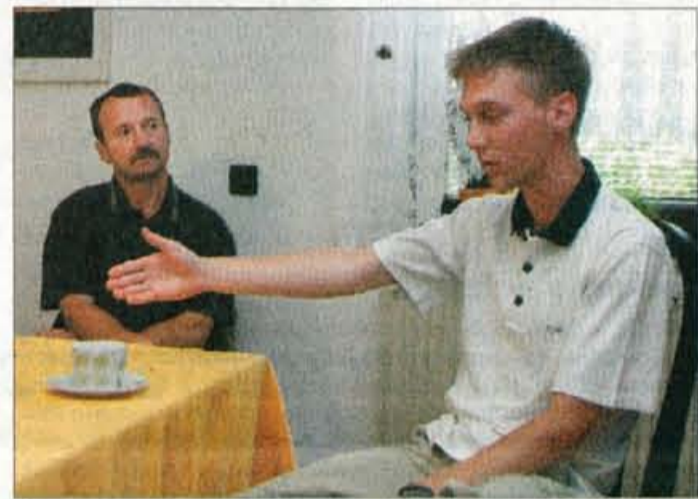
Oče in sin med pogovorom seveda ne moreta brez skokov.