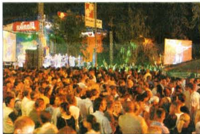
V soboto zvečer se je na Slovenskem trgu zabavalo staro in mlado, kot že dolgo ne.