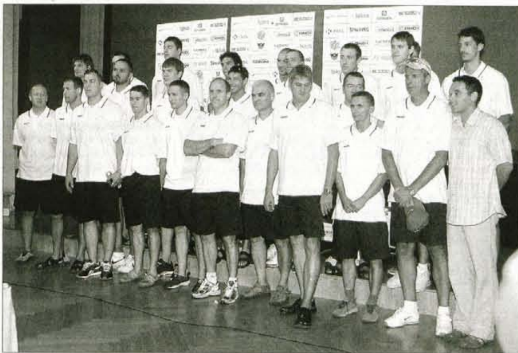
Reprezentanti, ki odhajajo na enomesečne priprave pred evropskim prvenstvom