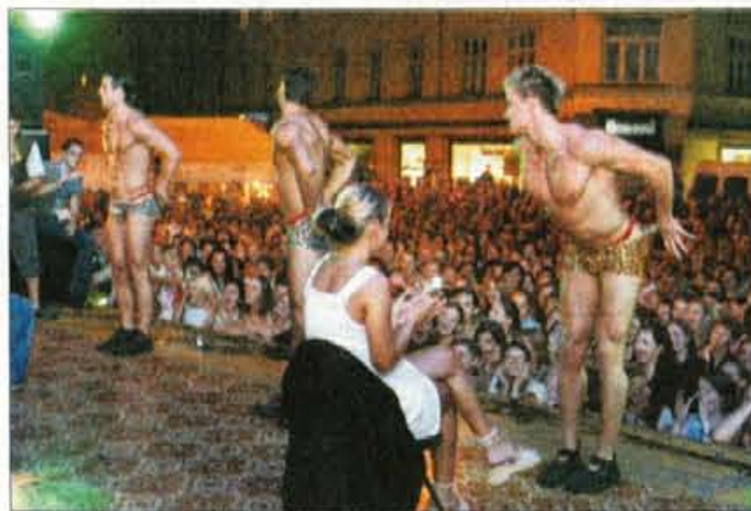
Moški striptiz: "Prava atrakcija za obiskovalke KranFesta je bila nedvomno sredina predstava moškega striptiza".