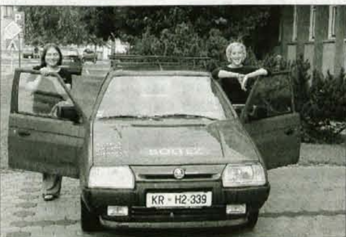
Deset let stara škoda, s katero bosta dekleti obvozili del črne celine.