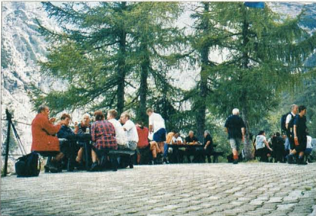
Udeležba planincev je bila manjša od pričakovane.