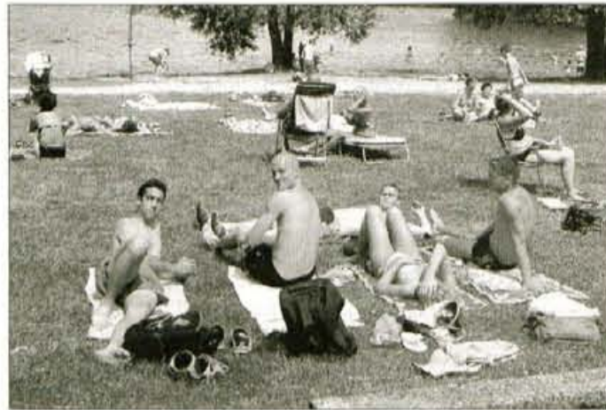
Čas, ki ga namenimo sončenju, merimo v minutah, ne v urah, izogibajmo se najhujši vročini in uporabljajmo kakovostne zaščitne kreme.

opekline, prezgodnje staranje kože, kronično vnetje kože in kožnega raka. Tudi uživanje nekaterih vrst antibiotikov lahko ob izpostavljanju sončnim žarkom povzroči vnetja kože. Zlasti v času dermatovenerologije opažajo porast fotoalergij, ki se kažejo tudi kot koprivnica. Pretirano izpostavljanje sončnim žarkom povzroči opekline, pri hujših oblikah se lahko pojavijo mehurji. Pri blagih opeklinah si lahko pomagamo sami z obkladki s fiziološko raztopino in losioni s pantenolom, odrasli lahko vzamejo tudi sredstva za lajšanje bolečin, na primer aspirin, pri hujših opeklinah pa moramo poiskati zdravniško pomoč. Opekline lahko spremljajo glavobol, utrujenost, slabost, zvišana temperatura in dehidracija. "Zaskrbljujoče je, da se pove-