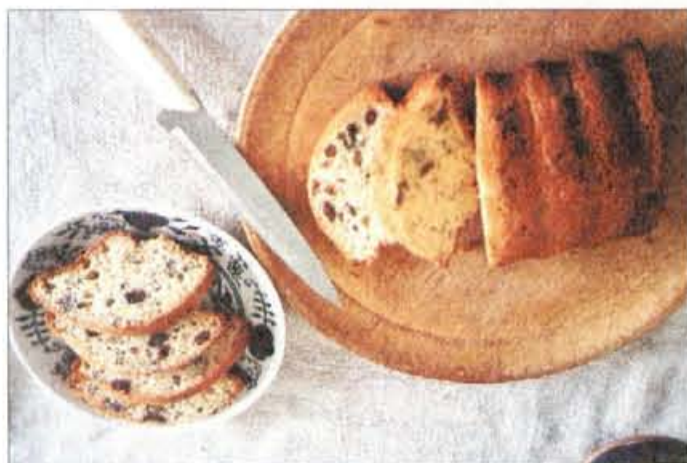
Pehtranovo pecivo je zelo enostavno za pripravo ter zelo okusno.

Ne izpostavljajte se mu preveč. Tudi sonce ni več takšno, kot je bilo nekoč. Najbolje je takšno poletje preživeti v debeli senci,