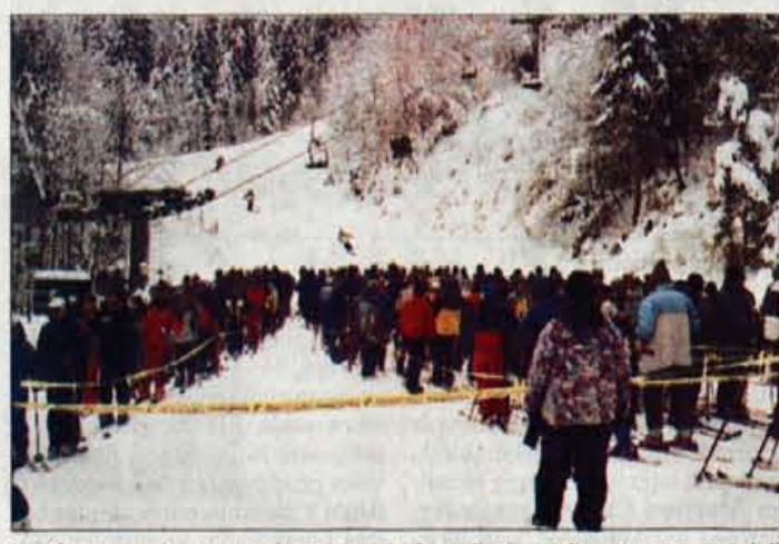
Na Starem vrhu je v soboto smučarje najbolj motila vrsta na spodnji postaji dvosedežnice, ki je - kljub prenovi - še vedno (pre)počasna.