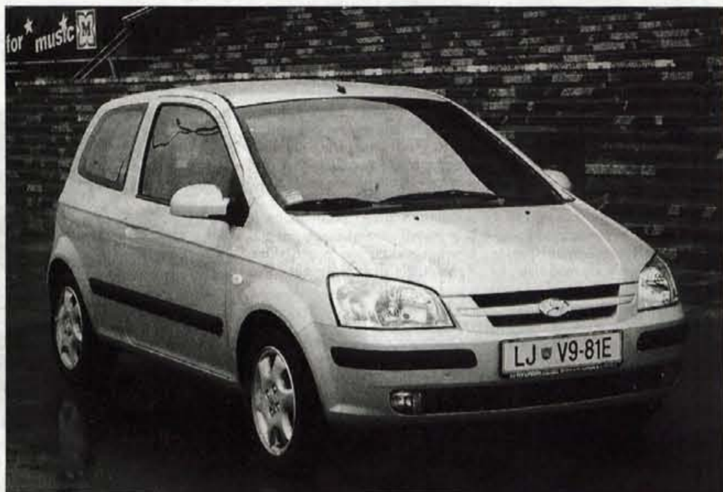
Hyundai prvič vstopa v razred kompaktnih malčkov, kjer na getza prežijo številni močni in uveljavljeni tekmeči, toda posevnooki možje so temeljito opravili delo.

presenetljivo prostorna. Pri trivratni različici se zlasti na prednjih sedežih poraja občutek sedenja v večjem avtomobilu, a tudi potniki, ki jim je namenjeno sedenje na zadnji klopi, se nimajo kaj pritoževati. Dostop je zaradi izdatno pomičnega desnega sedeža sorazmerno lahek. Prtljažnik je na ravni razrednega povprečja, vendar na žalost nič več kot to, medtem ko njegova prostorska prilagodljivost sodi med boljše, saj ima zadnja klop tudi nastavljiv