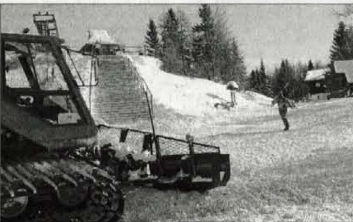
Dva teptalna stroja skrbita za urejanje prog ponoči.