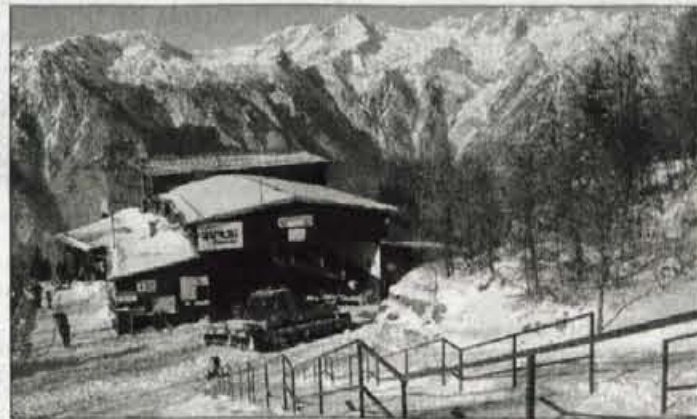
V nedeljo se je Velika planina kopala v soncu.

prireditev, kot so na primer srečanja harmonikarjev, obisk Marije Snežne in velikošmarske prireditve v avgustu. Vse to in vedno večji obisk izletnikov in planincev iz cele Evrope pa bo le obliž za te-