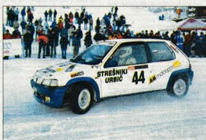
Avtomobilisti so se pod Vitrancem pomerili v pravih zimskih razmerah.

"Računov za lansko prireditev v Planici res še nismo plačali, vendar pa ne po svoji krivdi. Najprej so nas planiški organizatorji razočarali, ker so tik pred tekmovanjem odstopili od soorganizacije, od nas pa zahtevali dodaten denar. Mi smo naša plačila zavarovali z menicami in tako bi oni te menice lahko izkoristili in dobili plačano. Račune so nam nato poslali prepozno, zaradi birokratskih zadev pa smo jih zavrnili, vendar pa smo se bili pripravljeno dogovarjati in račun tudi plačati, če bi se dogovorili za novo letošnjo prireditev v Planici. Ker do dogovora ni prišlo, čeprav smo ga predlagali na nekaj sestankih in poslali vrsto dopisov, se za novo prireditev v Planici nismo mogli dogovoriti. Zavedamo se pač, da obveznosti