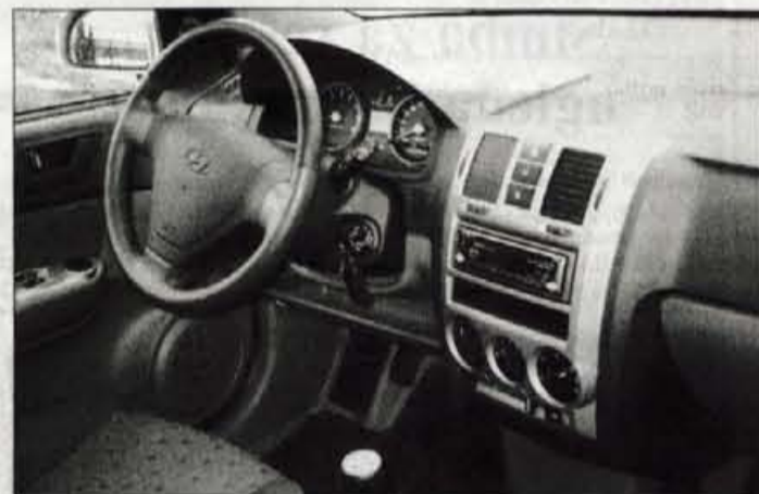
Temeljita izdelava in želja po ugajanju evropskemu okusu sta dobro vidna v prostorni potniški kabini.

pomoč dobro odmerjen občutek čvrstosti, ki ga zagotavlja volanski servoojačevalnik. Zavore, obogatene s protiblokirno elektrono, delujejo brez obotavljanja, kompromis med čvrstostjo vzmetenja in mehko blaženja je takšen, da potnikom nudi zadovoljivo udobje.