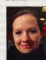
Petra iz Škofje Loke

čevlje in palice. Se je splačalo. Bila sem sicer tudi že v Ljubljani, vendar je tu bolj ugodna izbira zaradi števil. Parkirati ni bilo težko, saj sem prišla kar z avtobusom."