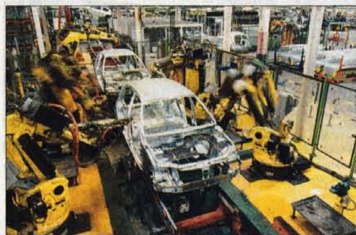
Montažna linija za novo generacijo clia je zaradi posodobitve proizvodnih postopkov in uvedbe večjega števila robotov 19 metrov krajša od prejšnje.

Audi v Detroitu s konceptnim Pikes Peak Quattro