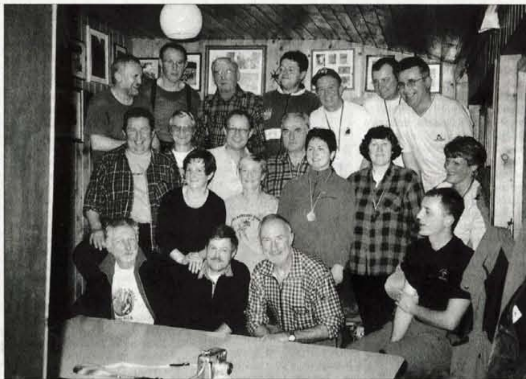
Ljubiteljev Taleža je iz leta v leto več.