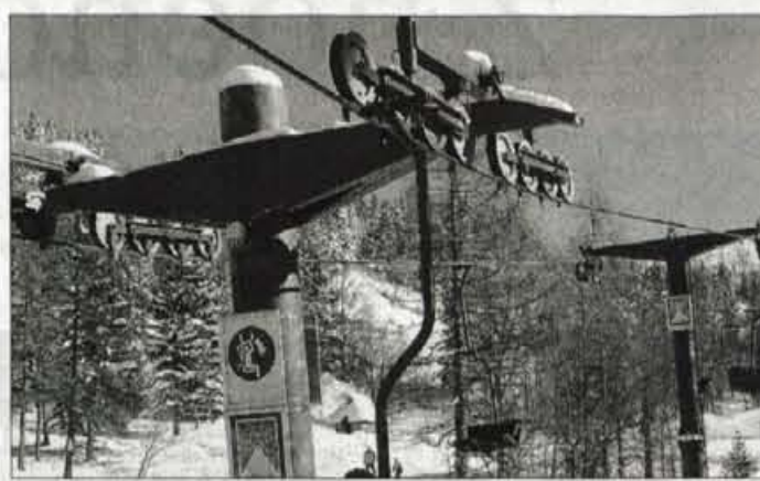
Dvosedežnica je bila nova oziroma obnovljena pred dvema letoma.

Celodnevna karta stane 2.800 tolarjev, otroška pa 1.900 tolarjev. Snega je na smučiščih dovolj in smučišča ponoči urejajo in vzdržujejo. Skrbi pa jih veter. Trenutno je sneg suh in veter ga lahko kaj hitro odpihne. Malo odjuge, da bodo smučarske proge utrdili, bi jim na Veliki planini ob sedanjem snegu smučarsko sezono zagotovilo tja do konca. Vode, s katero bi si zagotovili na smučiščih dovolj trdnega snega, pa Velika planina nima. O njej ob sedanjih veliko nujnejših investicijah lahko le sanjajo.