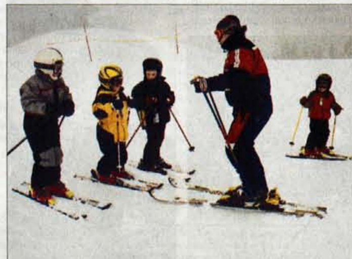
Za učenje smučanja je najprimernejša proga na Grebljici.