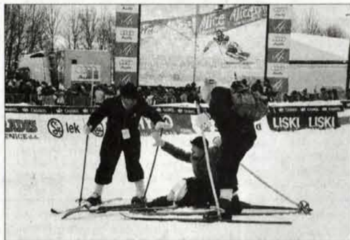
Na Pokalu Vitranc v Kranjski Gori so se s smučanjem po starem predstavili tudi Rovtarji.