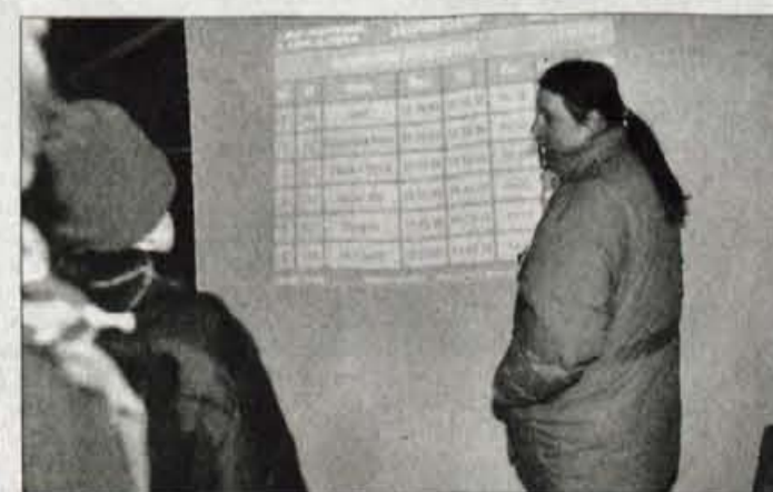
Pri tabornikih je bila prvič prisotna tudi računalniška obdelava podatkov.