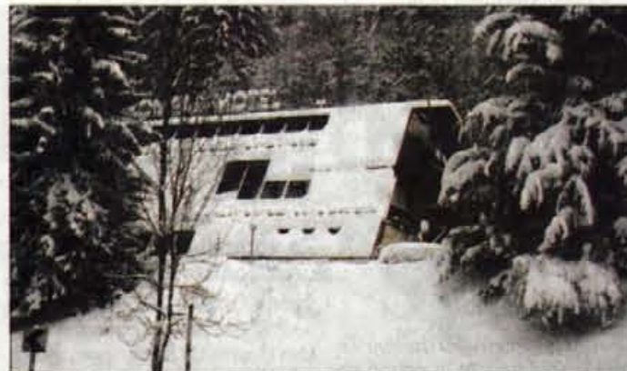
Motel Medno še vedno čaka na novega lastnika.

Motel Medno je zaprt že peti mesec in če je njegov lastnik še nekaj časa premišljeval o prenovi in vnovičnem odprtju, je zdaj ta zamisel že preteklost. Grand Hotel Union se je namreč usmeril v drugačni turizem. "Odločili smo se za mestni in poslovni turizem ter se dokončno odpovedali obnovi Motela Medno. Slednji je še vedno naprodaj. Do sedaj se nam je oglasilo že več potencialnih kupcev, gre za slovenske kupce,