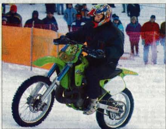
Motokrosisti so uživali v vzponih po zasneženih strmih.