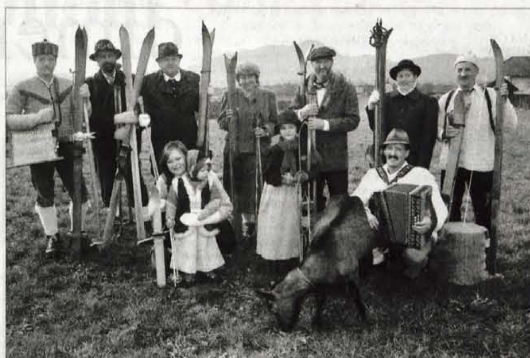
Člani škofjeloškega društva Rovtarji so tudi otroci, posebno mesto pa ima maskota društva, koza Meko.