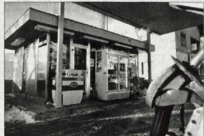
Petrolov bencinski servis v Gorenji vasi.