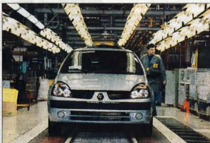
Lani je z Revozovih montažnih trakov pripeljalo rekordnih 126.661 cliov, prejšnji proizvodni rekord je bil iz leta 1998.

dosegajo najvišjo raven kakovosti, rekordno proizvodnjo pripisujejo predvsem prilagodljivosti potrebam na trgu. Tako so v prvi polovici lanskega leta večkrat podaljšali delavniki in delali tudi ob sobotah, v drugi polovici pa je bilo zaradi zmanjšane povpraševanja tudi nekaj prostih dni. Renault clia sicer proizvaja v treh