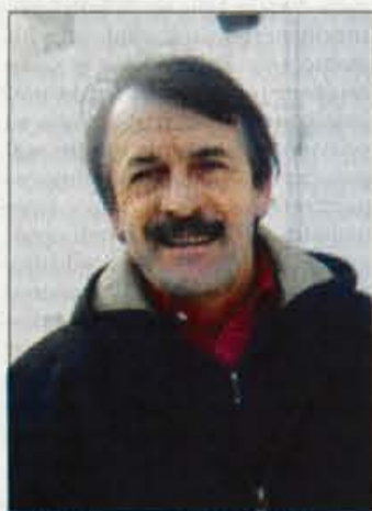
odstopil z direktorskega mesta in zdaj ste na direktorsko mesto prišli vi. Kako to, da ste sprejeli imenovanje?