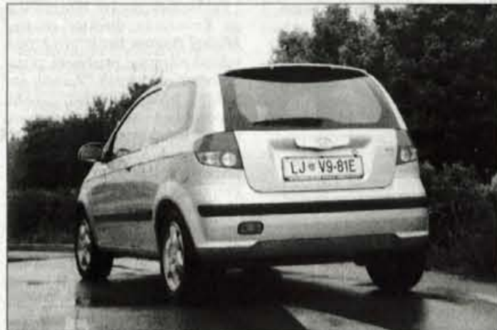
Zadek z nagajivimi lučmi in vpadljivim prostorom za registrsko tablico navdušuje bolj kot nekoliko zadržan nos.

****Zunanost: Getz morda ni osvajač na prvi pogled, zato je potrebno pogledati dvakrat in šele potem je mogoče ugotoviti, da sta oblikovno ne preveč izvorna žarmeta skupaj z nevzemirljivo masko hladilnika razprostrta v zagoreneti nasmeh. Videz nagajivosti imajo tudi zadnje luči, ki so namočene tako, da poudarjajo višino zadka in celega avtomobila, z višinskimi centimetri pa getz nadomešča nekaj primanjkljaja pri dolžini. Sicer je zunanost dokaj