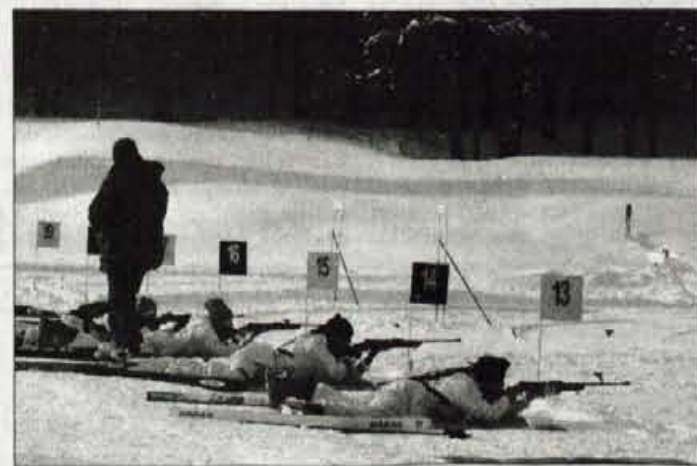
Preizkus v streljanju.