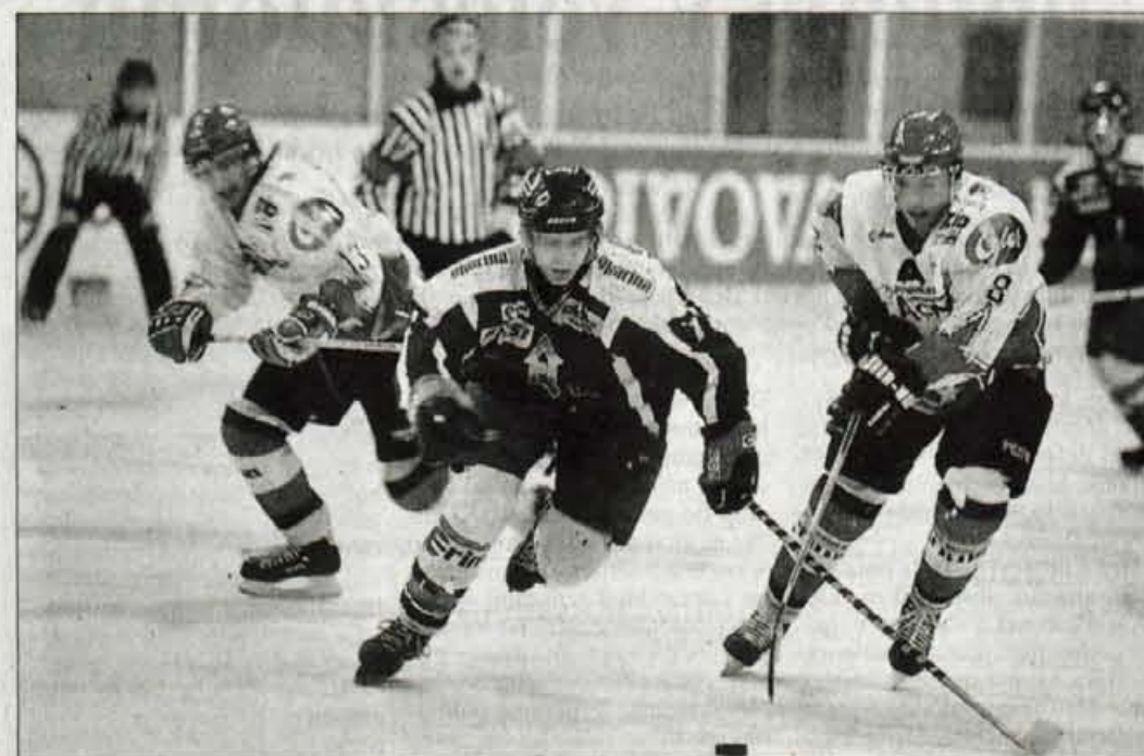
V gorenjskem derbiju na Bledu so bili v petek znova boljši Jeseničani.