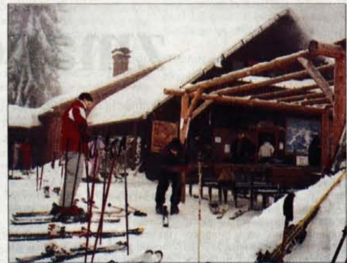
Koča na Starem vrhu je vendarle naša prvega lastnika, ki dobro poskrbi za žejne, lačne in premražene.

"Nočna proga je dolga dva kilometra, letos smo jo izboljšali in še dodatno osvetlili. Glede na zanimanje mislim, da bo "vlečni konj" Starega vrha, saj - če sklepam samo po telefonskih klicih - štirje od petih sprašujejo za možnost nočne smuke. To jim ponujamo vsak dan, razen nedelje in ponedeljka, med 18. in 21. uro. Tudi cena je ugodna, prav tako pa še posebno ugodne cene ponujamo