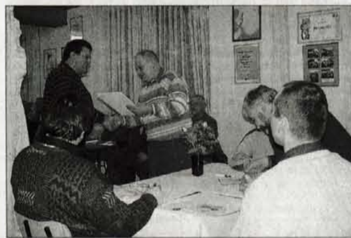
Na občnem zboru PGD Repnje-Dobruša so podelili tudi priznanja.