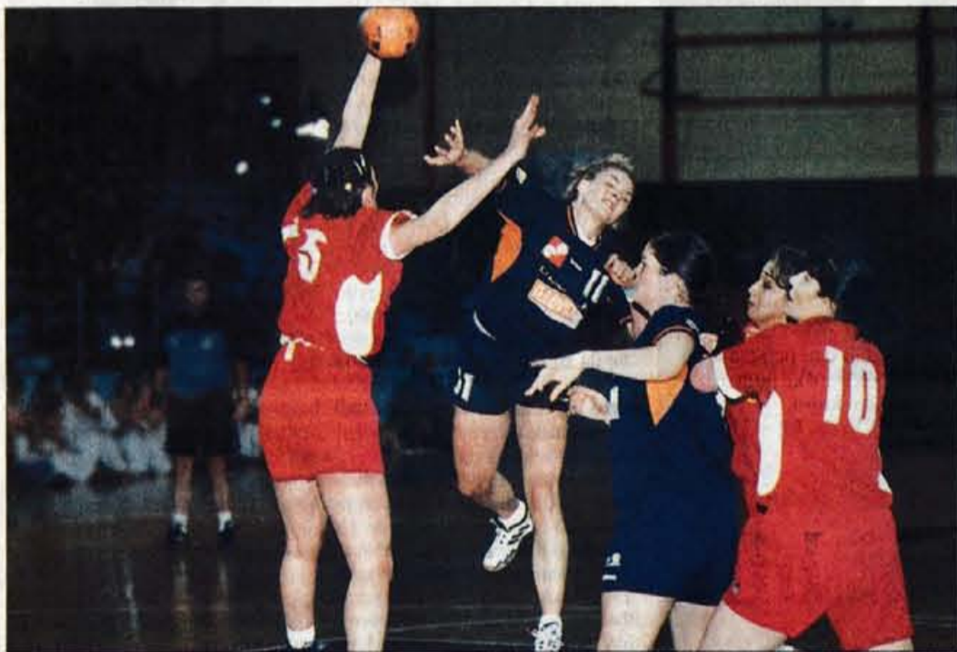
Rokometašice Loka kave Jelovice so tekmo v dvorani Poden sicer dobile, a so bile v Železnikih boljše Azerbajdzanke, ki so se uvrstile v nadaljevanje evropskega pokala pokalnih zmagovalk.