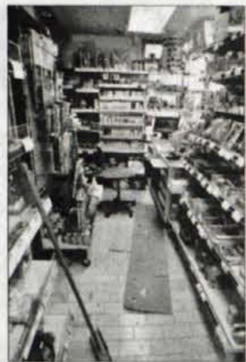
Roparja sta odnesla dobrih 700 tisočakov sobotnega izkupička.

Policisti so posredovali skop opis obeh roparjev. Prvi naj bi bil visok od 180 do 185 centimetrov, močnejše postave, oblečen je bil v temno modro bundo, modre kavbojke, na glavi je imel kapo sive barve z izrezom za oči. Drugi naj bi bil visok okrog 190 centimetrov, srednje postave, oblečen v temno modro - črno bundo z belo prečno črto na hrbtu. Na glavi je imel kapo črne barve z izrezom za oči. Helena Jelovčan