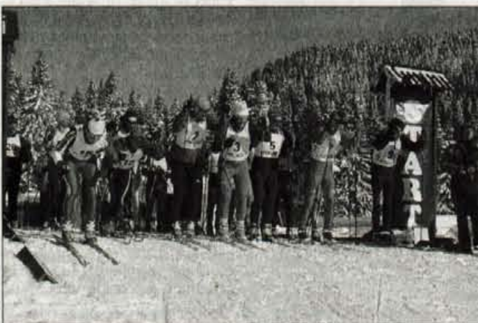
Start veteranov vojne za Slovenijo.