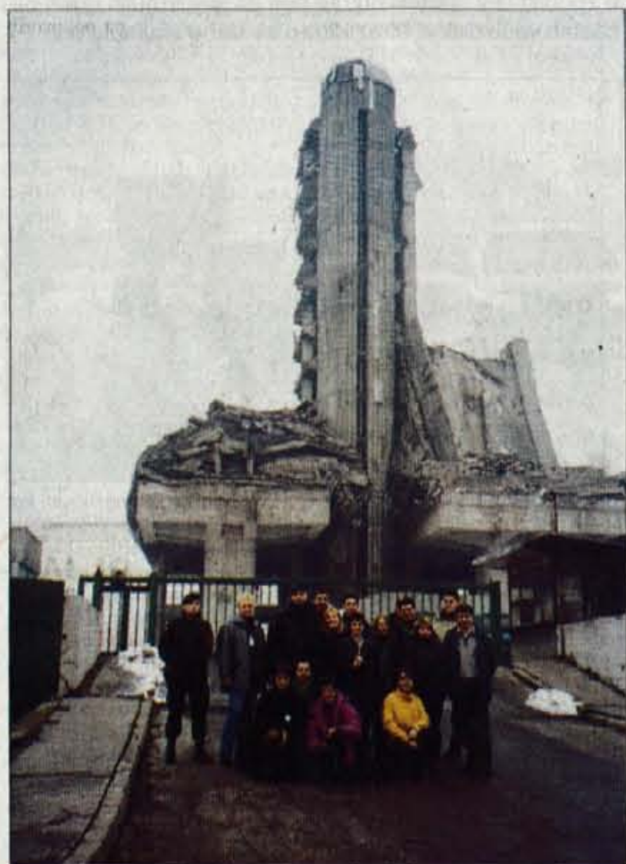
Skupinska fotografija pred neprostopoljnim spomenikom vojni. Tu je bila včasih stavba bošnjaškega časopisa Oslobođenje.

Folklorna skupina Škofja Loka deluje 25 let, v svojem repertoarju pa zajemajo plesne vse slovenskih pokrajin. Skozi vse leto nastopajo na raznih prireditvah po vsej Sloveniji, najbolj pa so ponosni na nastope v domačih krajih. Takšen je bil tudi na lanskih Čipkarskih dnevih v Železnikih. Lani oktobra so nastopali tudi v Belgiji, kamor jih je povabilo slovensko društvo Anton Martin Slomšek. Folkloristi trenirajo trikrat tedensko v prostorih Krajevne skupnosti Stara Loka - Podlubnik, in sicer v treh skupinah: dve mlajši skupini in odrasli. Udeležujejo se območnih in medobmočnih srečanj folklornih skupin, na podlagi uvrstitev pa dobijo tudi denar. Ta gre večinoma za narodne noše. Danes je v Folklorni skupini 40 članov, starih od 15 do 45 let.