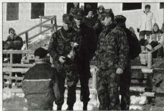
Zmagovalci iz kranjske logistične baze.