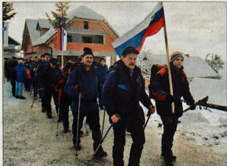
Pohodniki iz Železnikov in Ratitovca prihajajo v Dražgoše.

Gorenjski glas je poltednik, izhaja ob torkih in petkih, v nakladi 22 tisoč izvodov. Redna priloga naročniških izvodov za dnevni terek v mesecu je Gregor . Ustanovitelj in izdajatelj Gorenjski glas, d.o.o. , Kranj / Direktorica: Marija Volčjak / Priprava za tisk: Media Art, Kranj / Tisk: SET, d.d. , Ljubljana / Uredništvo, naročnine, oglasno trženje: Zoisova 1, Kranj , telefon: 04/201-42-00 , telefax: 04/201-42-13 / E-mail: info@g-glas.si / Mali oglasi: telefon: 04/201-42-47 sprejemamo neprekinjeno 24 ur dnevno na avtomatskem odzivniku; uradne ure: vsak dan od 7. do 17. ure. Naročnine : trimesečni obračun - individualni naročniki (fizične osebe - občani) imajo 20 % popusta. Naročnina se upošteva od tekoče številke časopisa do PISNEGA preklica; odpovedi veljajo od začetka naslednjega obračunskega obdobja. Za tujino: letna naročnina 80 evrov. Oglasne storitve: po ceni. DDV po stopnji 8.5 % v ceni časopisa / CENA IZVODA : 180 SIT (14 HRK za prodajo na Hrvaškem).