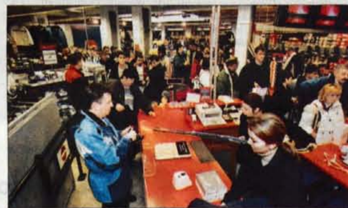
Gneča pred blagajnami

deti prav borne. Vse blago na razprodaji mora biti označeno s prejšnjo in z novo, znižano ceno, v primeru, da je popust objavljen v razponu, pa mora najvišji odstotek znižanja zajeti najmanj četrtino vrednosti blaga na razprodaji. Izdelki, znižani tudi do 50 odstotkov, pa vlečejo kot magnet... V Kranju se je evforično obleganje v znamenju bojazni, da bo