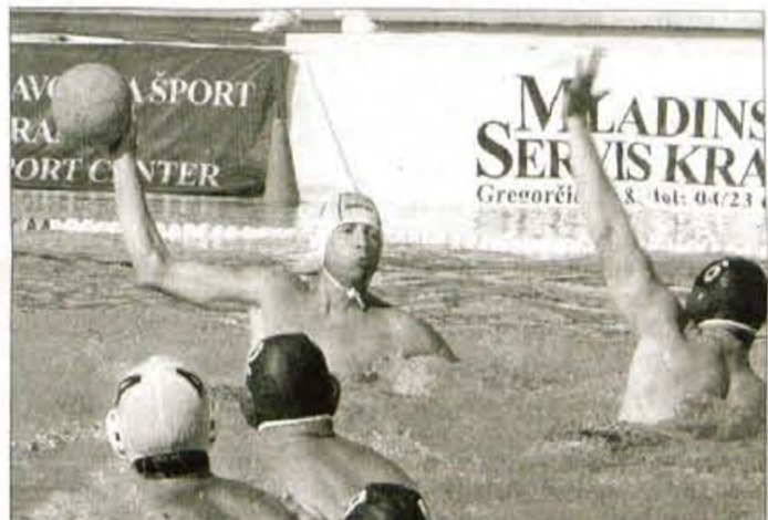
V kategoriji 30+ so slavili vaterpolisti iz ekipe PSV Eindoverja.

Kranj - Na letnem in v pokitem olimpijskem bazenu v Kranju se je v nedeljo zvečer končalo še evropsko vaterpolsko prvenstvo za veterane. V šestih dneh so odigrali prek devetdeset tekem, dobili pa smo pet novih evropskih prvakov. V kategoriji 30+ je zmagala ekipa nizozemskega Eidhoverja, v kategoriji 35+ je bilo najboljšo moštvo Imperial Sporta iz Moldavije, v kategoriji 40+ so naslov prvakov osvojili vaterpolisti Masters WP Cluba iz Romunije, v kategoriji 45+ Senior Zuglo 2000 iz Madžarske, v kategoriji 50+ pa ekipa Seniorjev iz Budimpešte. Žal je slabo nastopila edina slovenska ekipa, veterani Triglava iz Kranja, ki je v prvi tekmi izgubila z ekipo Stare Save, oziroma zdajšnje Mladosti iz Zagreba, nato je bila slabša še