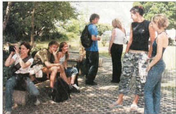
Dijaki kranjske gimnazije so nam zatrčili, da dva meseca niti pomislili ne bodo na šolo.

razredov so se lahko nasmejali pripetijam neke družine v komediji, ki so jo naslovili Golaž. Sicer je bila večina učencev pre-