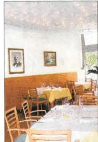
Restavracija Rikli v hotelu Park.

in pijače s 45 sedeži, sosednji del lokala s 30 sedeži pa so namenili ponudbi pic, testenin in osvežilnim solatam. Lokala sta sicer ločena, saj je njuna namembnost različna, imajo pa skupno kuhinjo, sodobno opremljeno in izpolnjuje zahtevo standarda HACCP. Uredili so