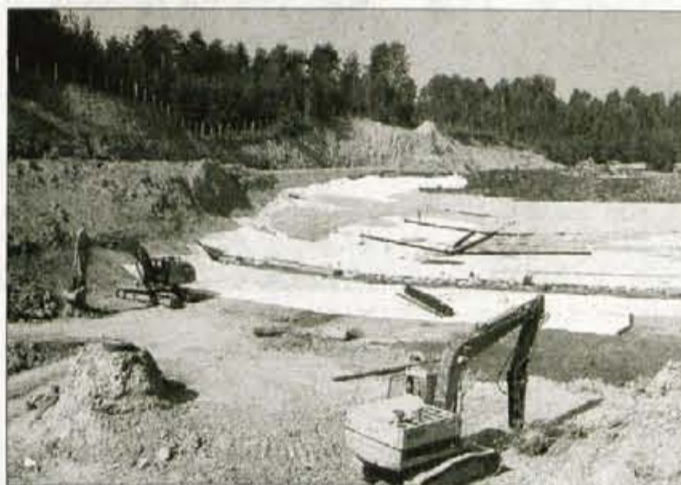
Širitev odlagališča: polaganje tesnilne folije, drenažnih cevi in prane peska.

prostora za 270.000 kubičnih metrov odpadkov. S tem se bo ob sedanji dinamiki odlaganja