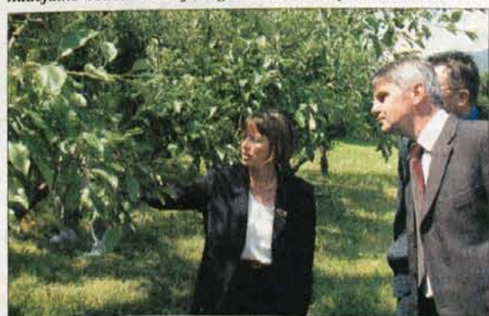
Ob izbruhu ognjevke je Škofjo Loko obiskal minister Franc But.

Rak rana je tudi odsek Podlubnik - Klančar. Kdaj se lahko nadejamo rekonstrukcije tega