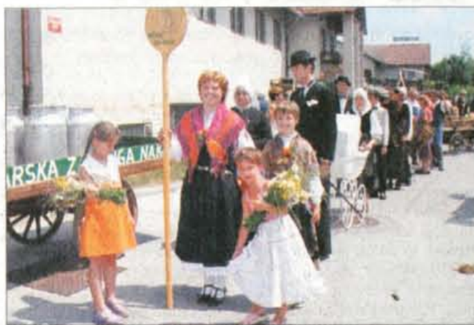
Kmetje na paradi v svečanih oblačilih z začetka 20. stoletja.