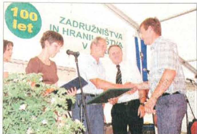
Tudi Halovčeva kmetija se ponaša s stoletnim članstvom v zadrugi.