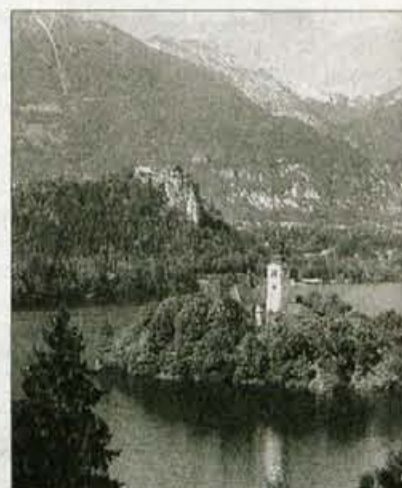
Bog ve, kakšen je bil Bled leta 1004?

Oton II. je umrl že 983, bilo mu je komaj 28 let. Zapustil je dve leti starega sina prestolonasledni-