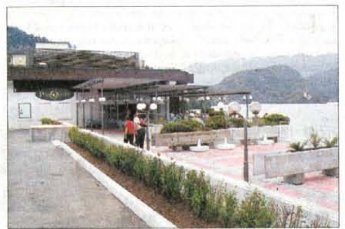
Panorama, prenovljena terasa ob hotelu Toplice.

tudi teraso pred hotelom s 60 sedeži in ulica z nekaterimi ureditvami dobiva boljšo podobo. Investicija prenove restavracije Rikli je znašala 60 milijonov SIT in jo je družba G&P Hoteli Bled v celoti financirala iz lastnih sredstev.