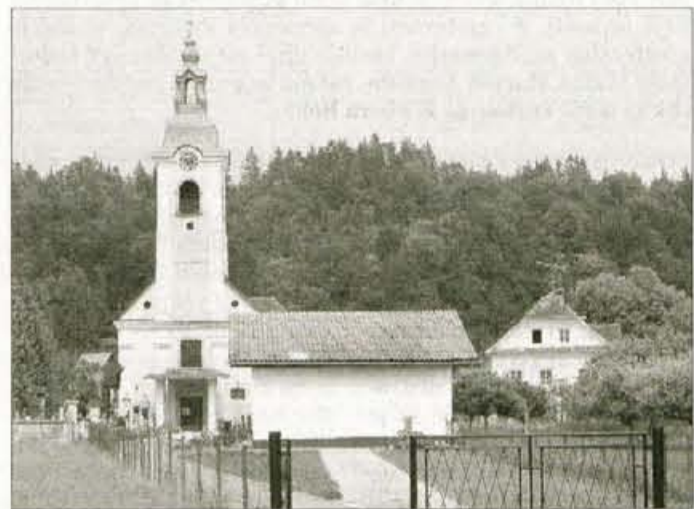
Farna cerkev v Spodnjih Dupljah je ena od 38 farnih cerkva, posvečenih sv. Vidu.

V nedeljo, 15. junija, bo najbolj slavni godovnik mučenec