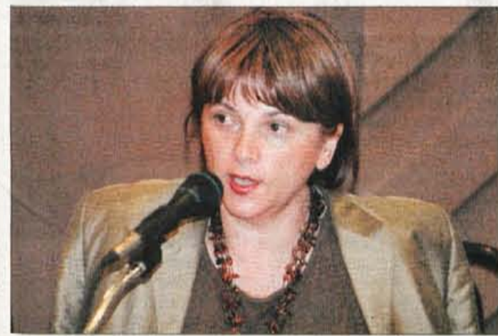
Ministrica za kulturo Andreja Rihter

Andreja Rihter: "Vesela sem, da nocoj govorimo tudi o tem, kako bo Bled prihodnje leto praznoval svojo tisočletnico.