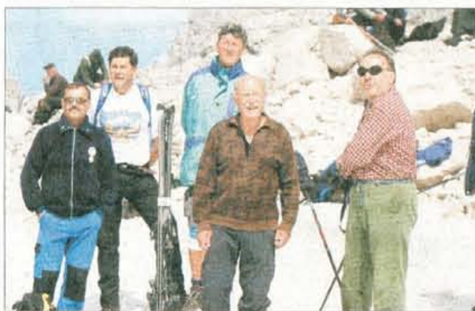
Na majhni krpi pod Jezerskim vrhom se je zbrala lovška množica ljubiteljev smučanja. Dr. Franc Bučar je na veleslalomu za Kristalnega gamsa nastopil ko predtekmovalce.