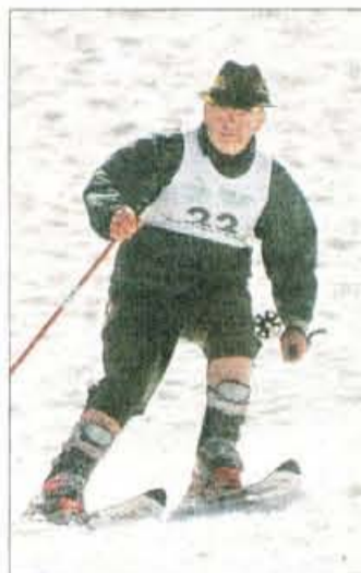
Lovci se niso ustrašili strmine.

Ledine - Ker imam z Ledinami "krasne" izkušnje, sem se tokrat odločila za Lovsko pot. Mislila sem, da je morda kaj manj zapletena, kot tista čez Žrelo na Češko koč. Morda ni zapletena za mladeniče, ki tečejo v hrib in nazaj, ostalim pa vsem ob spustu "stokajo" kolena.