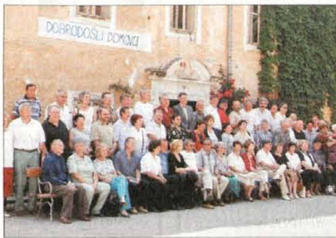
V spomin na srečanje ob 50-letnici bivanja v preddvorskem domu.