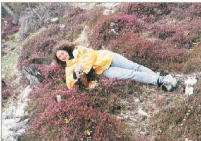
Zelo hitro se prizemljimo, če se za kratek čas uležemo na zemljo.

Najbolje je, da se nam zaradi izvajanja duhovnih praks življenjski ritem ne poruši, če se pa to zgodi, ga je potrebno sestaviti na novo, vanj vključiti novo duhovno prakso, delo, študij in ostale vsakdanje obveznosti ter jih tudi izvajati. Če se zalotite, da ste "odsotni" se zberite in delajte naprej. Potrebno je biti tukaj in sedaj, poizkusiti živeti trenutek. Zelo preproste in vsakdanje tehnike za prizemljenost so hoja z bosimi nogami po jutranji rosi, hoja v naravi, hoja v hrib, delo na vrtu, polju, objemanje dreves, izvajanje različ-