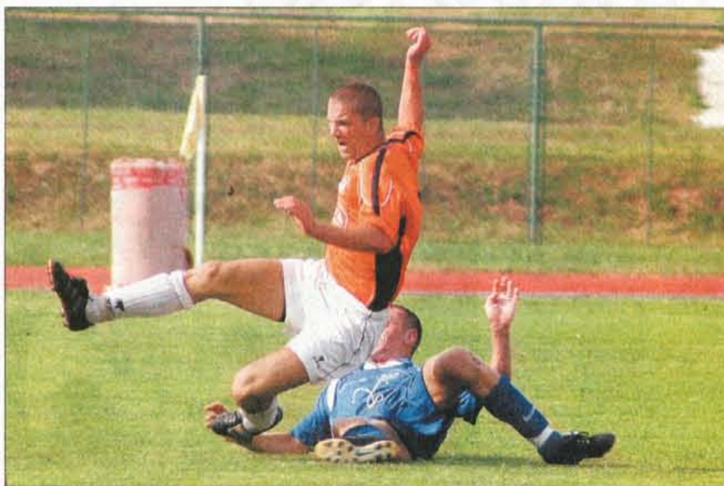
Nogometaši Triglava so se v nedeljo proti Železničarju slavili 3:0.

V 3. SNL - center je v zadnjem kolu ekipa Slaščičarne