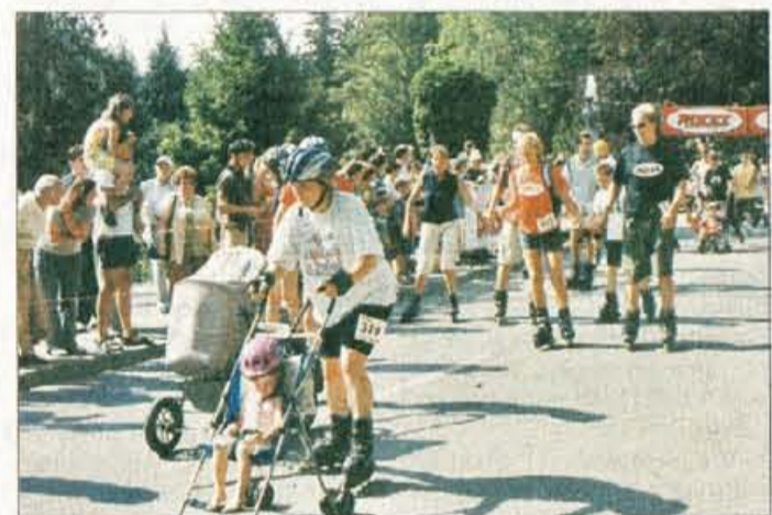
Na Bledu so rolali stari in mladi, proge pa se niso ustrašile niti mamice in očki z otroškimi vozički.

ZANIMIVI • REKREATIVNI • ŠPORTNI • EKSTREMNI