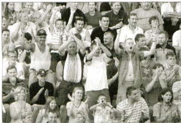
Naše vaterpoliste je v nedeljo glasno spodbujalo dva tisoč gledalcev.