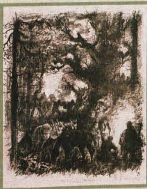
Partizansko taborišče, 1945/46, litografija, 55 x 45 cm

Prešernove nagrade je prejel leta 1949 za deli Kolona v snegu in Vaška ječa, leta 1955 za grafični opus in leta 1965 za umetniško dovršeno idejno zasnovo figurativnega in scenjskega inventarja, namenjenega lutkovni uprizoritvi Maeterlinckove Sinje ptice.