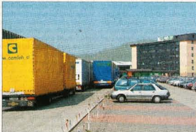
Kar 70 tovornjakov dnevno, ki ne pridejo "just in time", je precejšen prometni problem Terma in okolja.

stane v razviti Evropi (Avstriji in Nemčiji) delovno mesto letno 40 tisoč evrov, v Sloveniji približno 11 tisoč, na Hrvaškem okoli 7 tisoč, na Slovaškem okoli 5 tisoč evrov, smo v povprečju vseh pod 10 tisoč evri. Hkrati imamo sposobne ljudi, ki znajo pripravljati proizvodnjo materialov, ki jih sprejme zahodni trg, je to seveda precejšnja prednost. Kupna moč na Zahodu je močna, na Vzhodu pa šibka, so pa tam cenene surovine in transport, vendar se kljub temu v povprečju odpira ogromen trg. To nenazadnje ni le naše spoznanje, pač pa ekonomsko bistvo širitve Evropske unije. Naš namen je oblikovanje koncerna, v katerem bi sodelovale tovarne Terma, vključno s Hrvati in Slovaki, poleg tega še Švedi, Finci, Poljaki in Latvijci, in ki bo imel dovolj veliko kritično maso za evropski trg. Če ima Termo danes okoli 120 milijonov evrov prometa, bi koncern začel s 600 do 700 milijoni in v nekaj letih presegel milijardo."