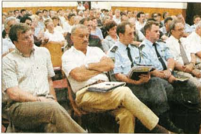
"Dovolj nam je ignoranca države, zahtevamo takojšnje ukrepanje," je menilo več kot 160 krajanov protestnega shoda.

Del lipniške ceste je bil rekonstruiran pred osmimi leti, za preostalo pa se radovljiska občina dogovarja z Direkcijo RS za ceste že od leta 1988. "Sodu sta izbila dno sedanja preobreme-