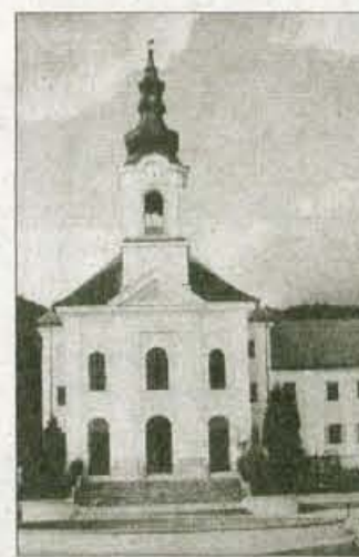
Baročni samostan v Velesovem.