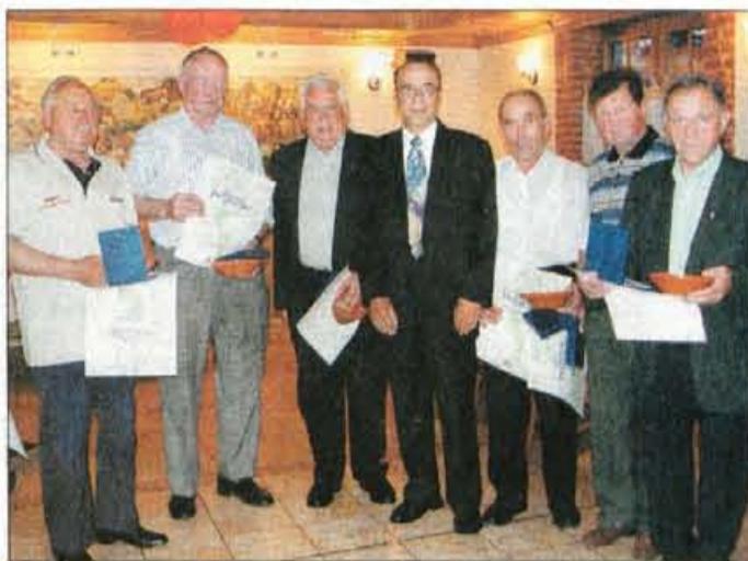
Predsednik AMD Cerklje (v sredini) z navzočimi dobitniki najvišjih priznanj.