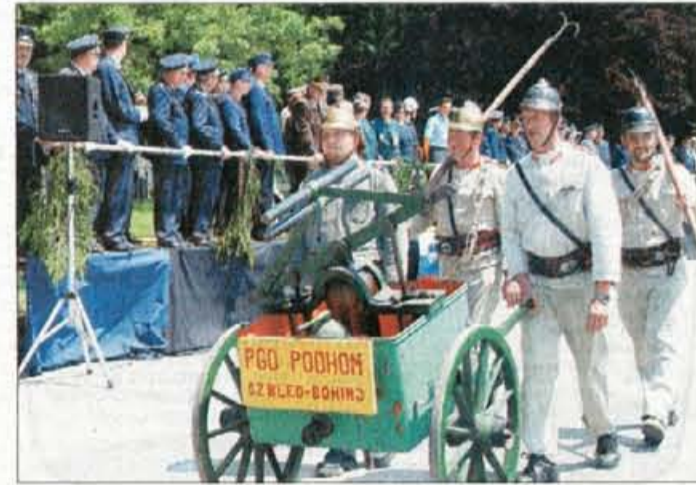
Posebna paša za oči so bila stara gasilska vozila in tehnika.