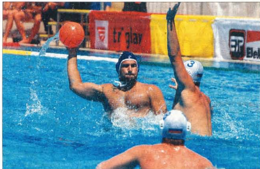
Vaterpolisti reprezentance Srbije in Črne gore so na turnirju Tristar dokazali, da bodo tudi na bližnjem evropskem prvenstvu med favoriti.

"Bazen v Kranju je sicer dokončan, vendar bo v naslednjih dneh potrebno poskrbeti še za zunanjo ureditev, prav tako pa tudi za povezavo med otroškima bazenom, ki sta še v gradnji ter pokritim in zunanjim bazenom. Sicer pa je bil Tristar turnir preizkus za usklajenost vseh, ki bodo sodelovali pri izvedbi evropskega prvenstva, te dni pa bomo imeli še zadnje dogovore s prostovoljci in pričakovati je, da glede organizaciji prvenstva