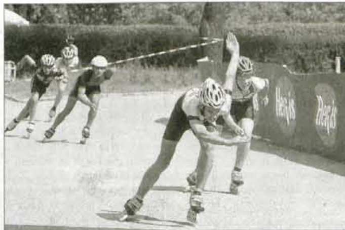
Na tekmi slovenskega pokala so nastopili tekmovalci sedmih klubov.

Pomembnejši je bil popoldanski del prireditve, saj je bila udeležba na 2. tekmovalcu za