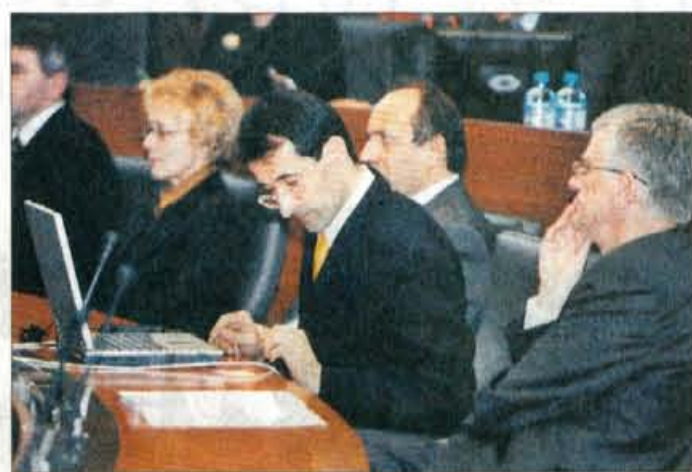
Če bomo Slovenci na referendumu proti obratovalnemu času v nedeljah, bo morala vlada (na sliki) popraviti zakon o trgovini.

vrševanju proračuna Republike Slovenije za leto 2003 in 2004. Zakon, ki ga bo po nujnem postopku sprejel državni zbor, uvaja varčevanje v vseh ministrstvih in gospodarnjšo porabo proračunskega denarja, ukrepe za zniževanje inflacije in večjo prožnost pri razporejanju denarja iz državnega proračuna. Minister za finance dr. Dušan Mramor , ki je avtor zakona oziroma rebalansa proračuna, je povečanje izdatkov državnega proračuna postavil na rast inflacije in življenjskih stroškov v državah Evropske unije in ne doma. Takšno izhodišče je povzročilo v vladajoči koaliciji burne odzive, še posebej v Združenih listih socialnih demokratov in v ministrstvu za delo,