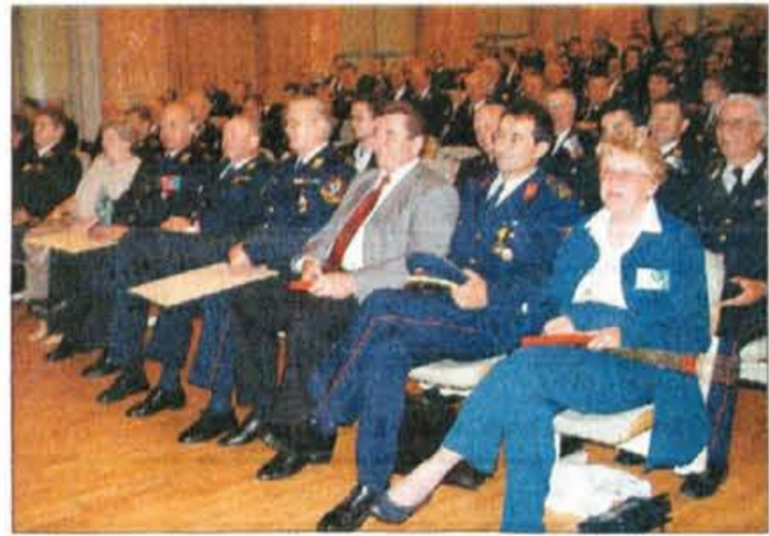
Tudi minister Janez Kopač je za kongres oblekel gasilsko uniformo.

rani so pripravili razstavo Gasilci skozi čas. V nedeljo so na parkirišču hotela Krim razstavili gasilsko tehniko. Največja paša za oči je bila nedeljska parada, med katero je po ulicah Bleda korakalo 23 ešalonov s prostovoljnimi in poklicnimi ga-