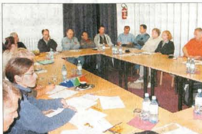
Udeleženci okrogle mize so menili, da zakon odpira pot novi pozidavi.

Bled - Predlagane spremembe zakona o Triglavskem narodnem parku (TNP) so na torkovi okrogli mizi, ki jo je na Bledu pripravilo Gorenjsko ekološko združenje, dobile zelo slabo oceno. Predlog zakona štirih poslancev je bil deležen številnih kritik, predstavniki iniciativnega odbora in različnih društev pa so predlagateljem očitali, da so jih pri pripravi predloga zakona povsem obšli.