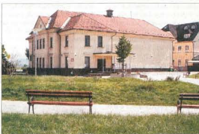
Šmartinski dom v Stražišču.

je torej treba še poldruhi milijon tolarjev za ogrevanje. "Ko sem leta 1996 mesto predsednika sveta krajevne skupnosti Stražišče prepustil drugemu, je v blagajni ostalo 21 milijonov tolarjev. Letos sem podedoval dolgove, ki jih bo nekako treba poravnati. Ničesar novega ne bomo mogli narediti za kraj, ker nimamo denarja za lastno udeležbo, s katerim bi sploh lahko kandidirali na občinskih natečajih. Poklicno tajnico, ki jo je