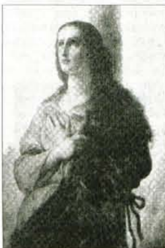
Ivana Orleanska je bila sežgana na grmadi kot čarovnica.

oznanjat vero. Avguštin je bil pri tem zelo uspešen. Krstitise je dal tudi kralj Ethelbert. Avguštin je izbral za sedež Canterbury in poganskih templjev ni podiral, ampak jih je blagoslavljal in spreminjal v krščanska svetišča. Avguštin je ohranjal stare običaje, kar so domačini dobro sprejeli. Avguštin je postavil temelje krščanstva na otoku. Jutri, 28. maja, so na koledarjih kot svetniki ali blaženi zapisani škofje German Pariški , Bernard Menthonski in Just Španski , menih Viljem Akvitski in devica Marija Ana iz Paredesa . V četrtek, 29. maja, pa se katoliška cerkev spominja gospodovega vnebovoda , škofov Maksima Emonskega in Maksima Trierskega ter mučenke Teodozije . Maksim Emonski je bil do leta 1961 za Mohorjem in Fortunatom drugi zavetnik ljubljanske nadškofije, sedaj pa sta prva zavetnika sveta Ciril in Metod, druga pa sveta Mohor in Fortunat. Maksim pa ima v ljubljanski stolnici svoj kip.