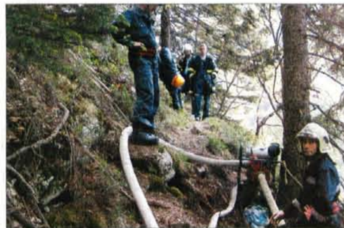
Požar Pod brano nad Kamniško Bistrico.

Vendar se je dva dni za tem požar ponovno razplamnel in helikopter je spet moral v akcijo. Dvanajstkrat je pri Jurju v Kamniški Bistrici zajel po 600 do 700 litrov vode in jo odvrnil nad požariščem. Akcijo pa so zaradi vetra morali prekiniti. Sestal se je štab Civilne zaščite. Ugotovili so, da se požar z območja Pod brano nevarno širi proti Kaplanskemu plazu in da je že zajel šest do sedem hektarov.