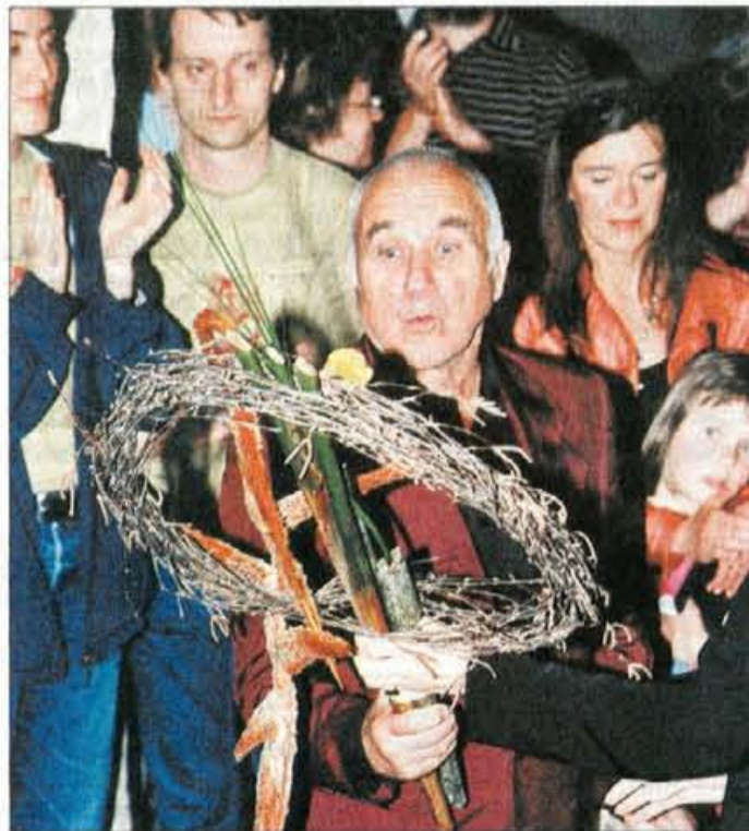
Z abstraktnim šopkom, njegovim še svežim motivom.