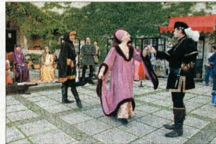
Zanimiv srednjeveški večer je na Blejski grad privabil več kot 200 obiskovalcev.

običaje, piko na i pa so k srednjeveškemu vzdušju prispevala tudi izbrana oblačila. Srednjeveškega večera na Blejskem gradu so se udeležili tudi gostje iz Kamnika, Škofje Loke in Postojne, kjer prirejajo srednjeveške prireditve, namenjen pa je bil tudi turističnim delavcem, da bi z njim popestrili poletno dogajanje v ostalih slovenskih krajih, obenem pa je naznanil začetek letošnje turistične sezone na Bledu. "Na grad, vstopnine ni bilo, je prišlo veliko obiskovalcev in prav odličen obisk daje misliti, da je grajsko dvorišče v takih primerih premajhno, zato bi bilo morda v prihodnje prizorišče treba razširiti tudi pod in ob grad. Poudarek je bil na igra-