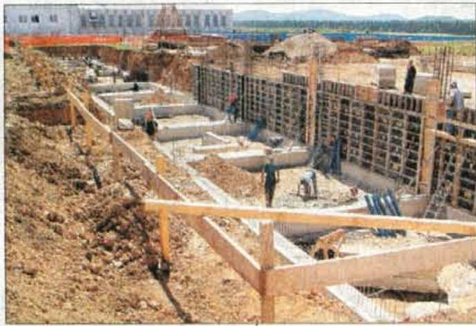
Temelji za brniški hangar.