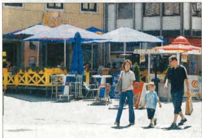
Podest pred Maistrom dovoljen, vendar je prevelik.

Kranj - Nekaj let nazaj je med meščani Kranja dvignil precej prahu novi, nadomestni kiosk okrepčevalnice Pinki v Poštni ulici, pri pokrškem mostu, ki je opazno presegel dimenzije starega, povsem drugačen pa je tudi po načinu gradnje in izgledu. No, kiosk, sicer zaprt, še vedno stoji, v upravi mestne občine Kranj pa pojasnjujejo, da odstranitev vendarle ni tako preprosta zadeva, kot bi si predstavljali neuk človek. Potrjujejo, da je bil kiosk na občinskem zemljišču postavljen brez gradbenega dovoljenja in da je republiška inšpekcija za okolje in prostor izdala odločbo za njegovo odstranitev.