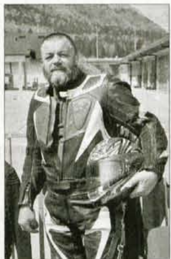
Za varno vožnjo je pomembna tudi kakovostna motoristična oprema.