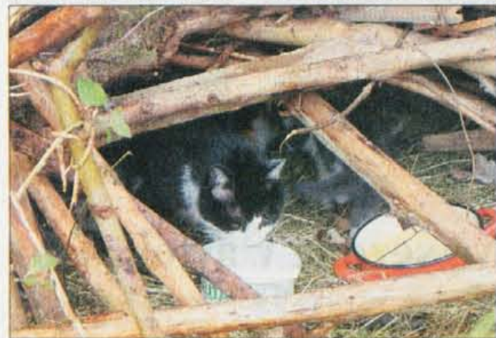
Hrana ljubke živalce v zadnjih dneh že privabi izpod dobrega skrivališča pod vejami.

žal "nezaželenih" živali. Srce mu ni dalo, da bi mačke prepustil iznajdljivosti njihove mame, zato jim je takoj uredil prebivališče. Prinesel je leseni zaboj, ga obdal s slamo in poleg položil skodelo z mlekom.