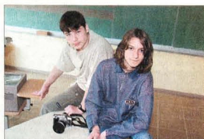
Za fotografije v šolskem časopisu si morajo "sposojati" fante iz fotografskega krožka.

Na svoje glasilo so na šoli zelo ponosni, saj ima že skoraj dvajsetletno tradicijo, zanj so prejeli tudi številne nagrade. "Ker smo na celjskem sejmu Vse za otroka osvojili prvo mesto, smo za nagrado dobili barvni tiskalnik, zato imamo lahko v časopisu