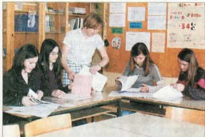
Pri nastajanju časopisa se včasih mnenja močno krešejo.

Škofja Loka - Ime šolskega časopisa so si na osnovni šoli Ivana Groharja izposodili kar pri slikarju, po katerem se imenuje šola, oziroma pri eni od njegovih slik. Tako so nastali Macesni , v katerih tri- do štirikrat na leto povzamejo utrip njihove šole, lotijo pa se tudi takih tem, kot je na primer uvajanje devetletke. Letos pri nastajanju glasila sodeluje osem deklet iz sedmega razreda, fante, pravi njihova mentorica, pa si morajo malo sposojati. Prav zdaj pripravljajo tretjo številko, v kateri se bodo posvetili predvsem učencem in njihovim mentorjem, ki so dosegli vidne uspehe na šolskih tekmovanjih.