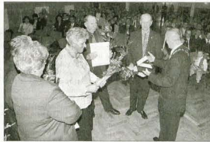
Med dvanajsterico občinskih nagajencev tudi glasbena družina Mateževih iz Trboj.

Danica Zavrl Žlebir, foto: Gorazd Kavčič