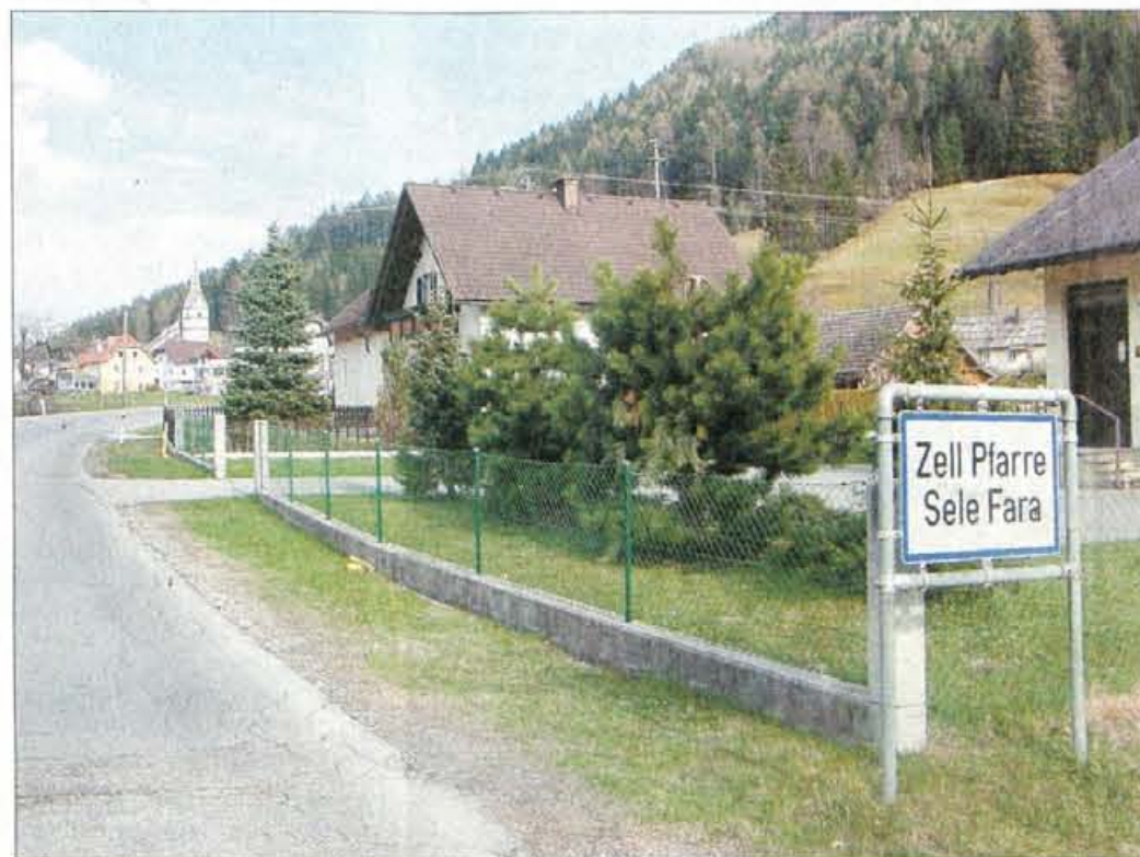
Sele na Koroškem