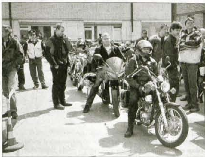
Motoristi pred praktičnim delom sobotne šole varne vožnje.

Vožnja motornega kolesa sodi med zahtevnejša opravila v prometu, saj je motorno kolo zaradi svoje konstrukcije veliko manj stabilno kot druga vozila, razen tega pa od voznika zahteva posebna znanja in spretnosti. Število voznikov dovoljenj za motorna kolesa in kolesa z motorji v Sloveniji od leta 1996, še zlasti pa v zadnjih letih,