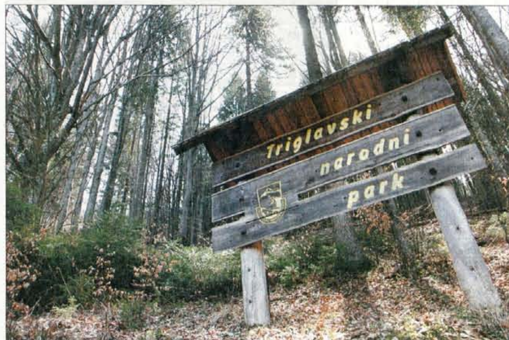
Ribčev Laz, Stara Fužina in Studor nič več v TNP?

Naklonjenosti večine svetnikov je bil deležen predlog svetnika Braneta Polajnarja, ki je dejal, da se vsa vprašanja in skrb vrtijo okrog Stare Fužine, Ribčevega Laza in Studorja, nihče pa se ne ukvarja z zaščito Pokljuke, ki poleti in pozimi doživlja invazijo avtomobilov, zato bi morali misliti tudi na to, da bi z zapornicami omejili promet in stihijsko parkiranje ter uredili parkirišče. Kritičen je bil tudi svetnik Dušan Jovič, ki je zakonu očital, da ne rešuje vprašanja gospodarjenja ljudi v krajih, ki so v TNP, ob tem pa je predla-