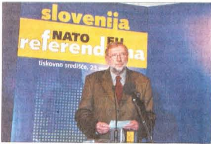
Dr. Dimitrij Rupel

za to, da bi mene kamorkoli prijavljali. Namesto da bi se ukvarjal s korupcijo, se ukvarja z akademskimi načrti". Dejtal je, da se je o teh nesramnostih že pogovarjal z nekaterimi kolegi v vladi.