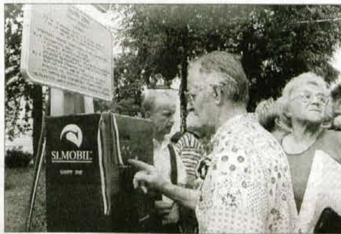
Novogoriški Impulz v Kranju ni zdržal niti tri leta.

z občinsko kartico še naprej brezplačno. Občinska parkirna kartica, ki jo bo občina vozni-