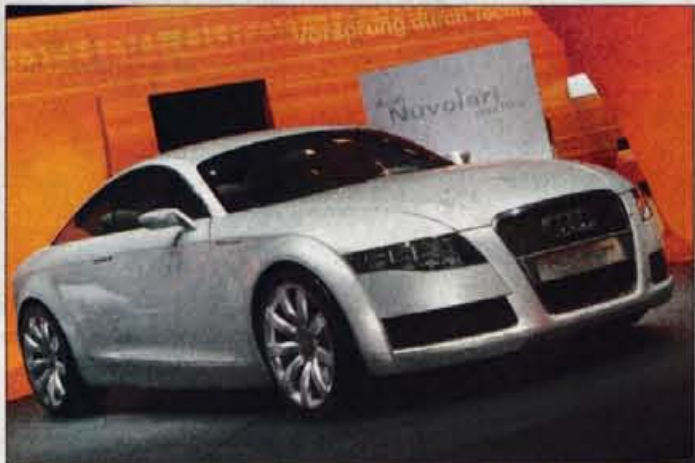
AUDI NUVOLARI QUATTRO

AUDI NUVOLARI QUATTRO - Študija, ki so si jo izmislili v Ingolstadt, je namenjena vrtniti znamke s štirimi krogi v razred tako imenovanih GT avtomobilov. Nuvolari quattro je dvovratni štirisežni kupe, ki je nastal pod tak-