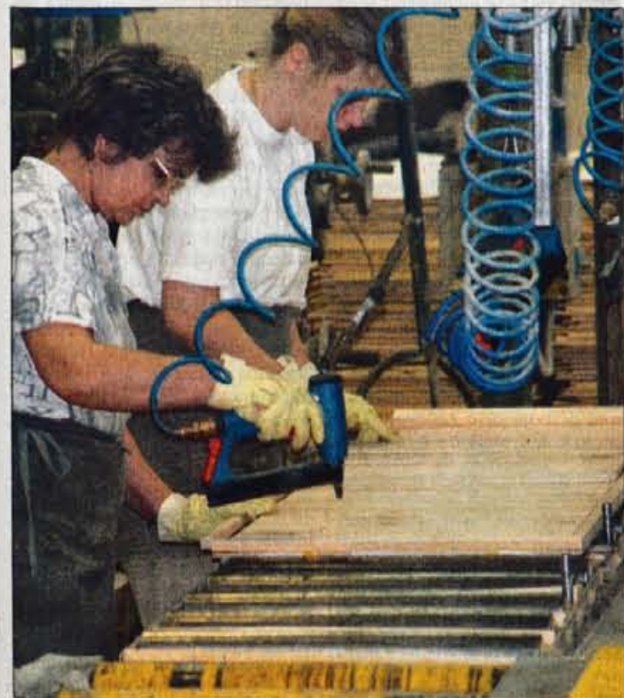
Proizvodnja opaznih plošč v obratu LIP Bled v Bohinjski Bistrici.

EOC d.o.o. PE LESCE, ROŽNA DOLINA 10. NAROČILA OD 7. DO 18. URE.