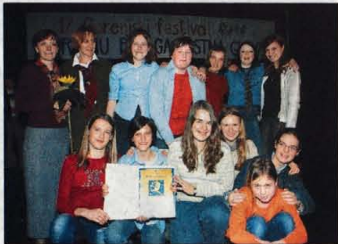
Ekipa Osnovne šole Ivana Groharja.