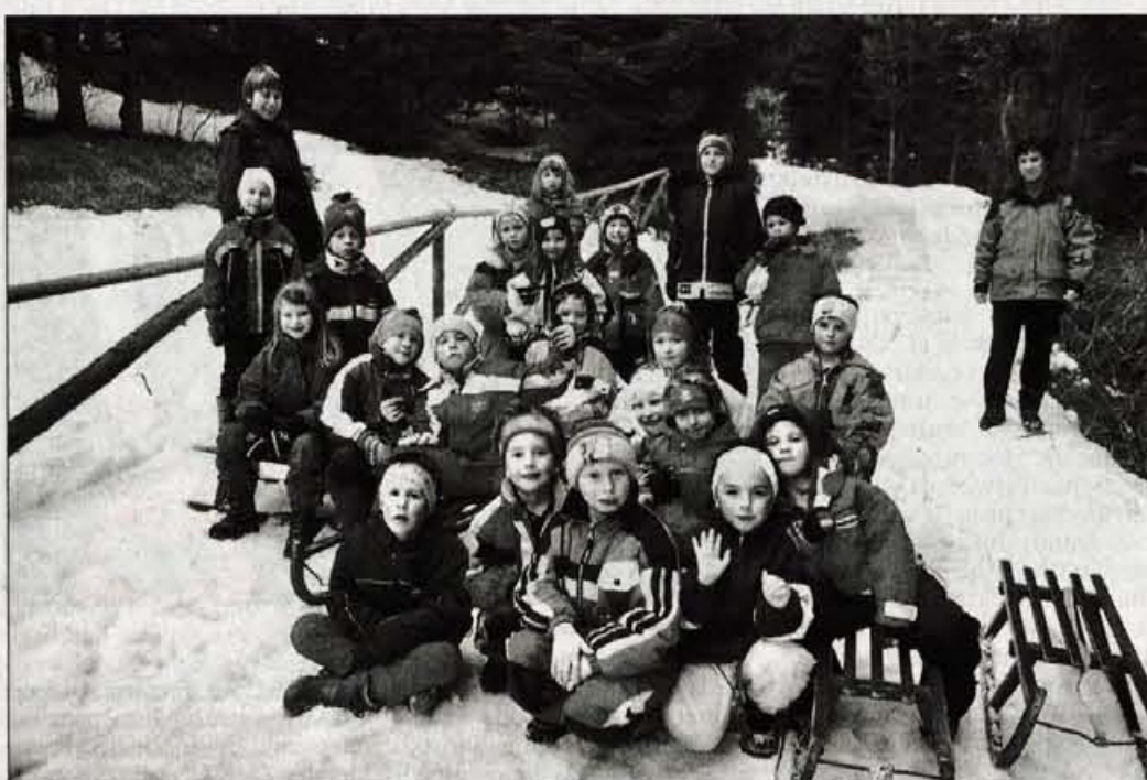
Na zimovanju tržiškimi vrčevskimi otroki ni bilo dolgčas.

Petletni otroci starejši lahko pogrešajo že po nekaj urah. Tržiški šest in sedem letniki se na zimovanju na Tromeji niso prav nič dolgočasili. Za njih so skrbele