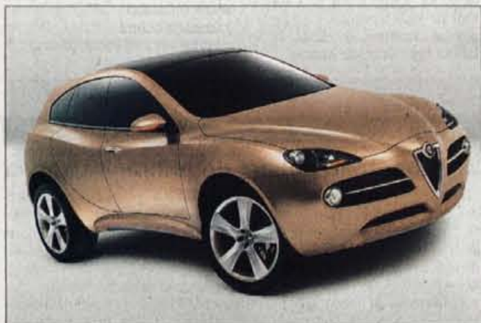
ALFA ROMEO CONCEPT X

tirko oblikovalskega šefa Walterja da Silve. Posebnost so žarometi in zadnje luči s svetlečimi diodami, pod motornim pokrovom je spravljen močan 5,0-litrski desetvaljnik z dvema turbinskima polnilnikoma, ki razvije 600 konjskih moči in navor 750 Nm: Dovolj za pospešek z mesta do 100 kilometrov na uro v 4,1 sekunde in najvišjo hitrost 250 kilometrov na uro. Ime avtomobila je posvečeno legendarnemu italijanskemu dirkaču Taziu Nuvolariju.