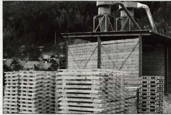
V lesnem obratu na Češnjici naj bi letos naredili četrtno več kot lani.

"Na začetku so bili stroški zelo visoki, 11 tolarjev od litra mleka, zdaj znašajo 5,5 tolarja, občasno pa nekaj prispeva tudi občina. Kmetje zaradi višjih stroškov dobijo za liter mleka od tri do štiri