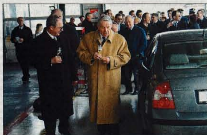
Otvoritev preizkuševalne steze za tehnične preglede vozil v Lescah so se udeležili tudi župani sosednjih občin. Na sliki župan občine Radovljica v družbi z županom Jesenic.