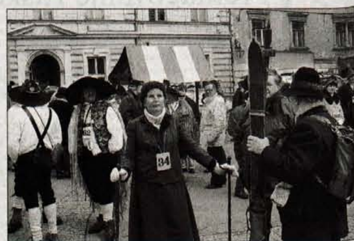
Na drugem srečanju starosvetnega smučanja se je zbralo blizu sto udeležencev iz vse Slovenije.

Po končani prireditvi so najboljšim podelili pokale in priznanja.