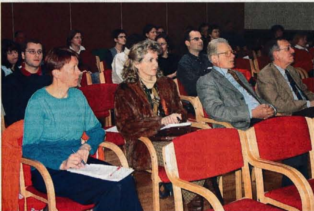
Na Ažmanovih dnevih so se zbrali številni slovenski zdravniki - reševalci.

V petek zvečer so imeli udeleženci srečanje Medcom IKAR skupen program s slovenskimi zdravniki, udeleženci tradicionalnih Ažmanovih dnevov, ki so redna strokovna srečanja, na katerih