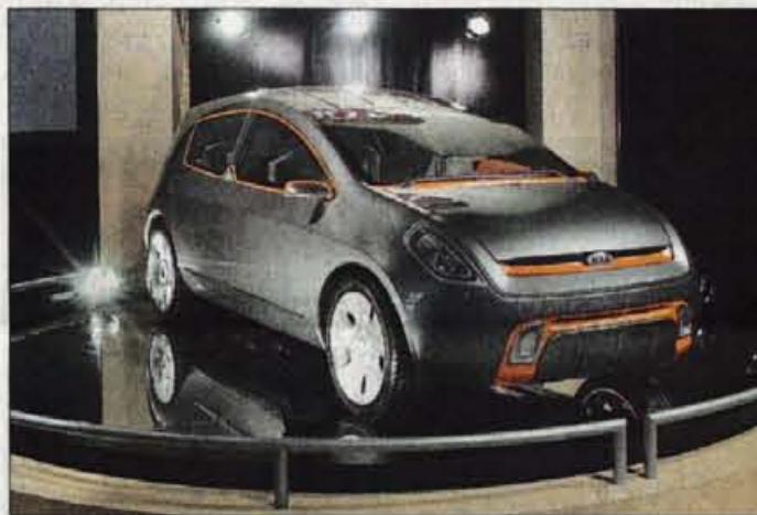
KIA KCD-1 SLICE

brezskrbne počitniške dni v najširšem pomenu besede. Za osnovo služi mehanika pravkar predstavljenega malčka gingo, ki se bo pojavil zgodaj jeseni, oblikovni duh pa si je marrakech spopodil pri legendarnem buggyju iz konca šestdesetih v prejšnjem stoletju. Zato je brez stranskih in zadnjega stekla ter brez bočnih vrat; Pri Fiatu pravijo, da bi bil kot na-