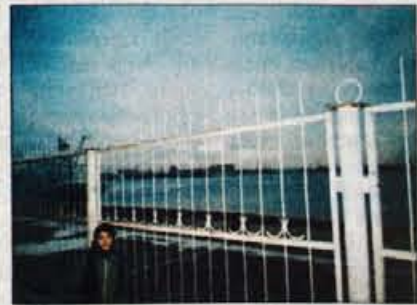
Zaledenelo morje in pogled na temni finski zaliv. Dnevi so kratki in sonca skoraj ni.

svojo "znakomo", kdaj so predstave. Povsod ima svoje znakome... Serjoženka je pač tak človek, da se te polasti in ti skuša takoj vse sprogramirati. Če mu povem, da imam do nedelje še počitnice, pomeni, da sem do nedelje "frej" in lahko postopam naokoli z njim. Aha, za prebrati imaš Efrasa? Ni problema, imam knjigo, ti bom pomagal, a veš, jaz sem ga poznal in sem hodil v gledališče na njegove vaje. In potem začne na dolgo in široko opisovati pripetljaje iz gledališkega življenja. Pozna pa ogromno dobrih igralcev in priznanih umetnikov in predvsem ogromno ve... No, po vseh planih sem po obedu ob sedmih zvečer