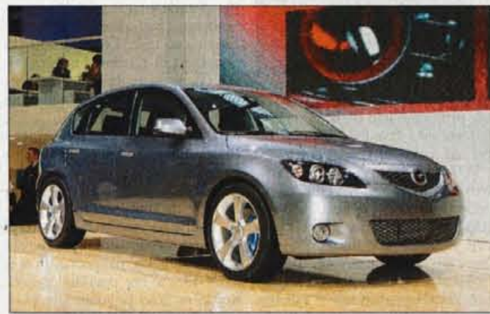
MAZDA MX SPORTIF

peljujeta na dejstvo, da je bilo oblikovalcem vse tisto, kar so pred njimi pokazali že drugi. Pogonu je namenjen 3,5-litrski bencinski šestvaljnik s 199 konjskimi močmi, za udobno in varno vožnjo pa veliko serijske opreme. Sprva naj bi izde-