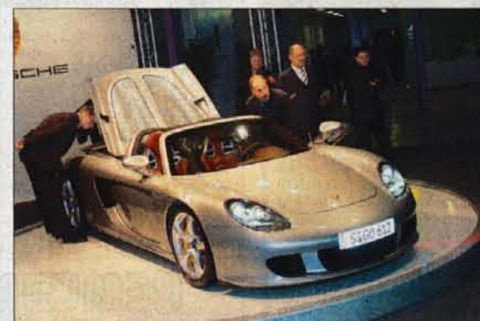
PORSCHE CARRERA GT