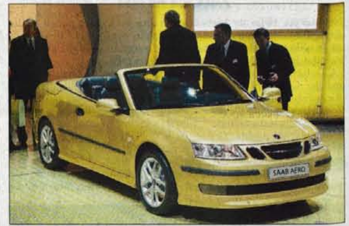
SAAB 9-3 CABRIO

lov znamke Rolls Royce dobil bavarski BMW, se je vedelo, da se bo nekaj zgodilo, in rezultat je 5,83-metrski phantom. Tradicionalistična