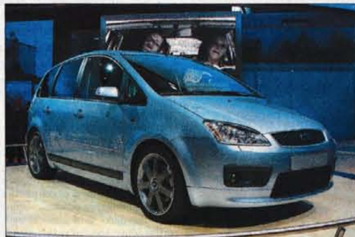
FORD FOCUS C MAX

in ponovnemu razprostiranju platenne strehe pomaga električni, ki delo opravi v 20 sekundah. Motorna ponudba obsega 2-litrski bencinski štirivaljnik z različnim pritiskom turbinskega polnilnika in temu primerno različnimi