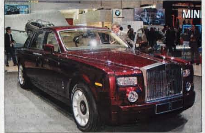
ROLLS ROYCE PHANTOM

ROLLS ROYCE PHANTOM - Odkar je pred dobrimi štirimi leti pravico do uporabe imena in simbo-