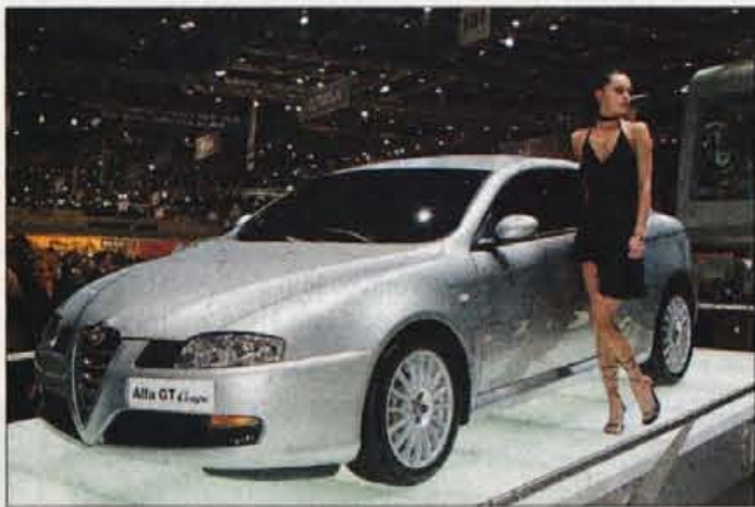
ALFA ROMEO GT COUPE

RENAULT SCENIC - Od skupaj sedmih predvidenih različnih novega megana, sta pripravljena za štart naslednji dve. Nikakor ne gre prezreti scenica, ki je bil pred sedmimi leti kompaktni enoprostorski pionir in se zdaj pojavlja v drugi generaciji. Renaultovi stilisti so poskrbeli za zunanost usklajeno s hišnimi smernicami, sicer pa je v novincu, ki je tudi večji od predhodnika več uporabnega prostora za potnike in prtljago.