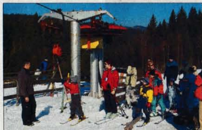
Počitniško dopoldne na otroškem smučišču.

Kranj - Minuli konec tedna je bil v znamenju prvih pustnih sprevodov in tudi kurenti so v različnih koncih Slovenije že odganjali zimo. Vrhunec pustnih prireditev in sprevodov bo konec tedna, nekaj se jih bo zvrstilo še na pustni torek, s pepelnico sredo pa bo pustnega rajanja konec. Za celotensko pustovanje bodo poskrbeli v Mozirju, kjer letos praznujejo 112 let pustovanj, kajti mozirski pustniki so znani že od leta 1891. Pred štirimi leti je bilo Mozirje zaradi avtohtonih in izvernih pustnih običajev sprejeto v združenje evropskih karnevalskih mest (FECC). Pustovanje se bo začelo na debeli četrtek; nastopil bo pustni ansambel Boj se ga, podelili bodo trške pravice, petek bo v znamenju koncerta za mladino, velika gala maškarada in izbor najbolj izvirnih mask bosta v soboto zvečer, v nedeljo pa bodo pustniki odšli na obhod pustnih mej. Na pustni torek bo karnevalska povorka, na pepelnico sredo pa bodo Pusta pospremili na Pekove Lave in ga zažgali na grmadi. Vse zabavne prireditve bodo v velikem šotoru na parkirišču pred mozirskim gajem. R.Š.