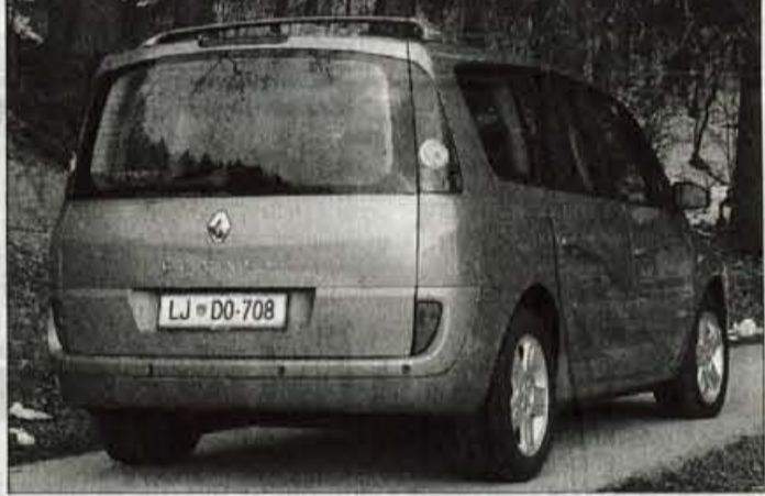
Kombijevsko ravno odrezan zadnji del: prtljažna vrata zarezana v odbijač in luči v strešnih stebričkih.

motor s pritiskom na gumb. Moderno, ne pa tudi prikladno. ★★★★★ Motor: Sodoben šestvaljni turbodizelski motor je s tem avtomobilom vrhunska kombinacija. Pogonski stroj je uglajen, zelo kultiviran, a hkrati tudi odločno zmogljiv. Posebej je omembe vredne visok navor pri zelo nizkih vrtljajih, ki dopuščata vznožico ležernost ali pa tudi precej nagle pospeške. Visoke potovalne hitrosti niso vprašljive in akustika, ki dopuščata znosen pogovor med potniki, tudi ne. Motorjev ritem nekoliko moti preveč obotavljiva samodejni menjalnik, ki očitno ne zna natančno presoditi, kdaj je pravi čas za pretikanje navzgor, a k sreči je vozniku omogočeno tudi sekvenčno ročno pretikanje. Tudi z izjemno ekonomičnostjo se ta motor ne more pohvaliti, toda zaradi dobrih zmogljivosti mu je to lahko oprosteno. ★★★★★ Vozne lastnosti: Čeprav je grand Espace dolg skoraj pet metrov in tudi karoserijska višina ni naklonjena ostremu rezanju zraka, avtomobil nima težav z vodljivostjo, lahko ga zmedejo le nagle spremembe smeri. Vzmene je naklonjeno mehko, panoramsko strehe) prijetno svetla. Za prijetno počutje skrbi klimatska naprava, ki je ločeno nastavljiva za vsako stran in še za potnike zadaj. Armaturna plošča je po zasnovi logično "potomstvo" prejš-