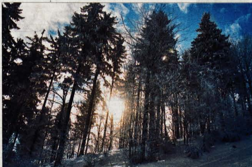
Zimska idila

NAJBOLJ POSLUŠANA RADIJSKA POSTAJA NA GORENJSKEM