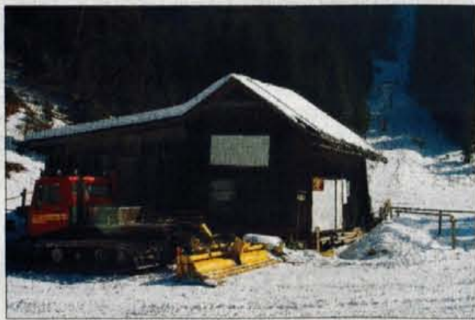
Vlečnico Hotunjski vrh naj bi zamenjala sedežnica.