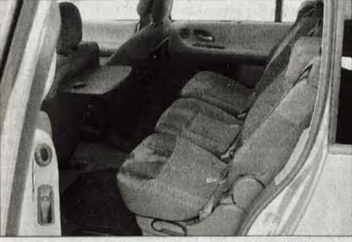
Letalsko udobje: vzdolžno pomični sedeži zadaj in zložljivi mizici. Sedenje v tretji vrsti je bolj zasiloni.

Espace je torej že postal skoraj pojem med večjimi enoprstorskimi avtomobili, pri Renaultu pa so se nove generacije spet lotili dovolj samozavestno in v skladu s pričakovanji tistih, ki se podajajo v ta avtomobilski razred. Novi Espace namreč ne skriva, da želi voznike limuzin, srednjega in višjega srednjega razreda premamiti za preskok v drugo prostorsko dimenzijo. In ker je želja in potreba velika, sta tudi tokrat hkrati na cesti dve različici, običajno dolgi Espace in grand Espace z 20 centimetri karoserijskega pribitka ter temu ustrezno povečano notranjostjo.