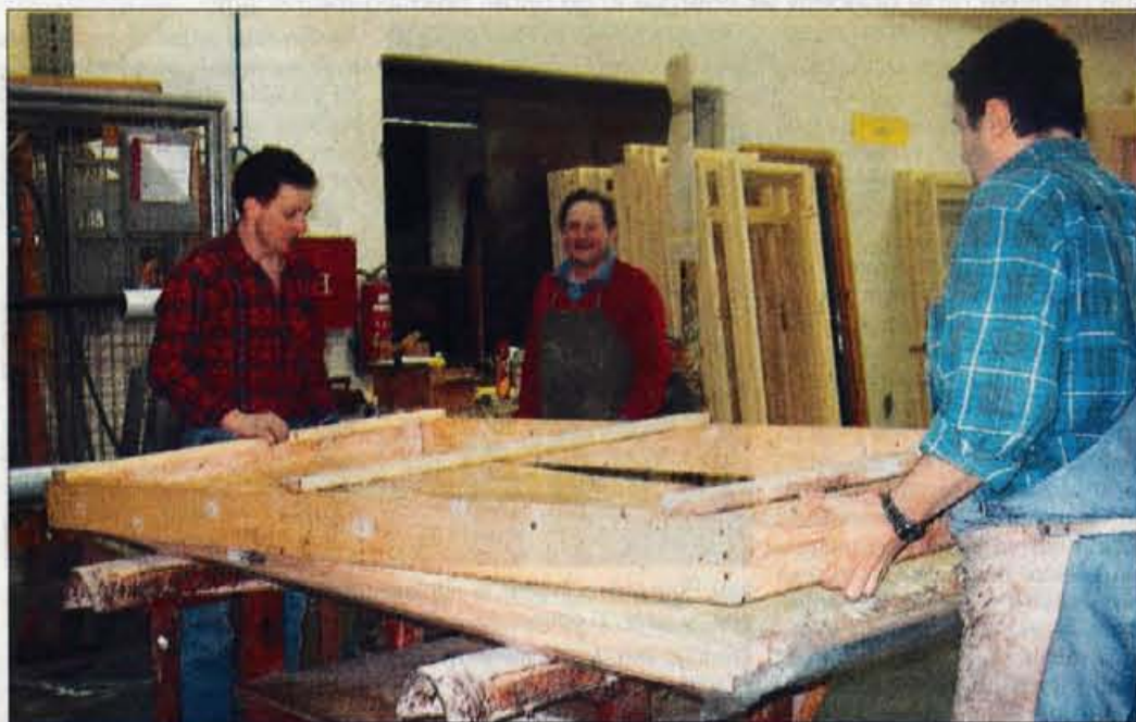
Obrat LIP-a v Mojstrani so vzeli v najem trije najemniki, prepričani, da lahko uspejo s prodajo masivnih vhodnih vrat na domačem in na tujem tržišču.

Mojstrana - Obrat vhodnih masivnih vrat v Mojstrani že nekaj časa za matično družbo LIP Bled ni bil več zanimiv, zato so se v LIP-u odločili med dvema možnostima: ali obrat zapreti, zaposlene pa preseliti na lokacijo na Rečico ali pa ga oddati v najem. Negotovitost je bila za več kot 50 zaposlenih kar precejšnja, dokler niso s 1. januarjem letos obrat vhodnih vrat v Mojstrani vzeli v desetletni