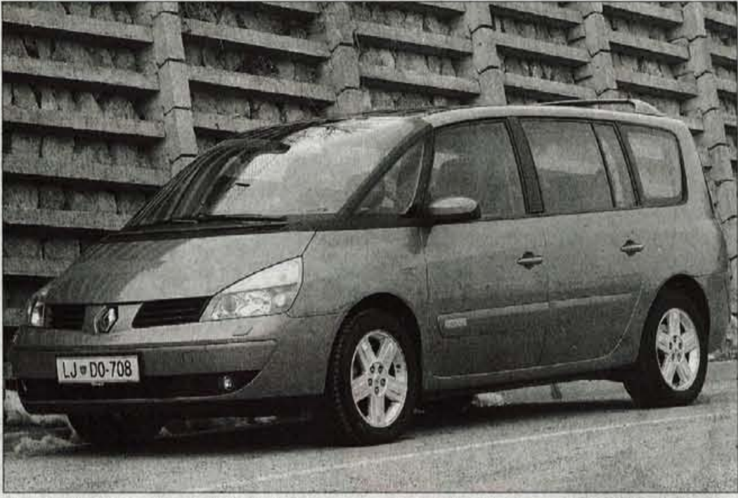
Renaultovi oblikovalci so podobo novega Espacea prilagodili hišni usmeritvi. Na prvi pogled je zelo podoben prejšnjemu, naslednji pogled razkriva številne razlike.