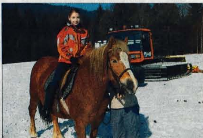
Smučarji si na otroškem smučišču lahko privoščijo tudi jahanje.

dve progi namenjeni boljšim smučarjem, ena pa smučarjem začetnikom. Dnevna vozovnica stane 2.000 tolarjev, otroška in popoldanska 1.600 tolarjev, smučišče obratuje vsak dan od 9. do 16. ure.