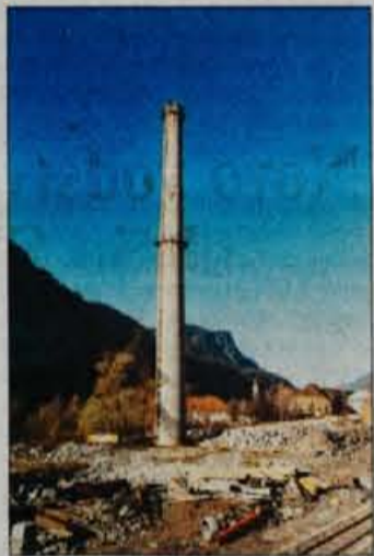
Ostanki vira onesnaževanja.

Res pa je, da je v 78. členu leta 1993 sprejete zakona o varstvu okolja navedeno, da mora povzročitelj razvrednotenja (degradacije) okolja plačati odškodnino ali zagotoviti drugačno nadomestilo za zmanjšano uporabno vrednost nepremičnine, zmanjšano kako-