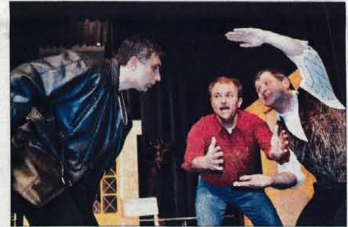
A je majhna in bolj čokata? Ne, moja je suha in visoka...

med šestimi ljubezni željnimi odraslimi osebami. Zakonski par, prijatelj, ljubica, kuharica, njen mož se po popolnem zapletu le nekako uspejo "odvozlati". Pred tem se v podeželski hiši, nedaleč od Pariza, seveda zgodi marsikaj zanimivega. Nekoliko prirejen tekst, z zabavnimi dialogi v pogovornem jeziku bo tudi tokrat predstavila izvrstna ekipa domače