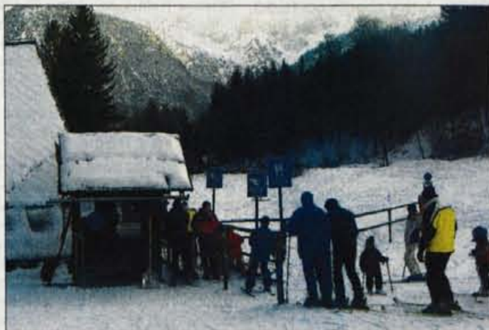
Vlečnica v Gozd Martuljku obratuje ob petkih, sobotah in nedeljah in smučišče je dobro obiskano.

malo cenejši kot v Kranjski Gori namesto dopoldanskih in popoldanskih kart. Za dnevno vozovnico je treba odšteti 3.500 tolarjev, za dopoldansko karto 2.350 in za popoldansko 2.550 tolarjev. Karte za otroke so cenejše: dnevna 2.500 tolarjev, dopoldanska 1.600 tolarjev in popoldanska 1.700 tolarjev. Otroške vozovnice veljajo za otroke od 6. leta naprej. Parkirnine, ki jo je treba plačati na toliko slovenskih parkiriščih, pa v