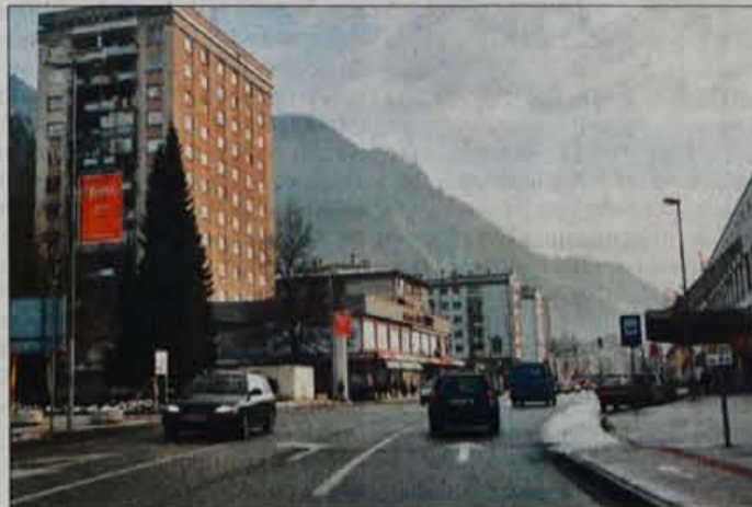
Po čem so nepremičnine na Jesenicah?

"Smolejev predlog pa se dotika posledic onesnaževanja v preteklosti. V tem primeru gre za zahteve občanov, da se jim zaradi industrije zmanjšuje vrednost premoženja. Moramo se sicer zavedati, da je na Jesenicah manj vredna zemlja kot v Kranjski Gori ali na Bledu, toda po drugi strani razumem občane, da zahtevajo del kupnine od prodaje železarskega premoženja, saj so prav oni s privalitvijo postavitev in delovanja te težke industrije na svojem območju omogočili njeno proizvodnjo. Ker občani niso "sitnari-