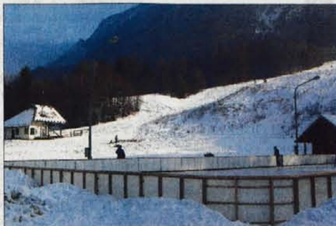
Drsališče in smučišče v Mojstrani kljub obilni snežni odeji samevata. Žičnice Kranjska Gora vlečnico prodajajo...

lepa in vabljiva smučarska tekaška steza, ki vodi od Martuljka pa vse do Kranjske Gore. Tako ob vikendih lahko vidimo družine, ki se pripeljejo na smučišče: nekateri člani družine tečejo, drugi smučajo, spet tretji vzamejo sanke in se ob robu smučišča sankajo. Okolica je prekrasna in če je lepo vreme, je v Gozd Martuljku prava zimska pravljica. Daleč od gneče kranjskogorskih smučišč, daleč