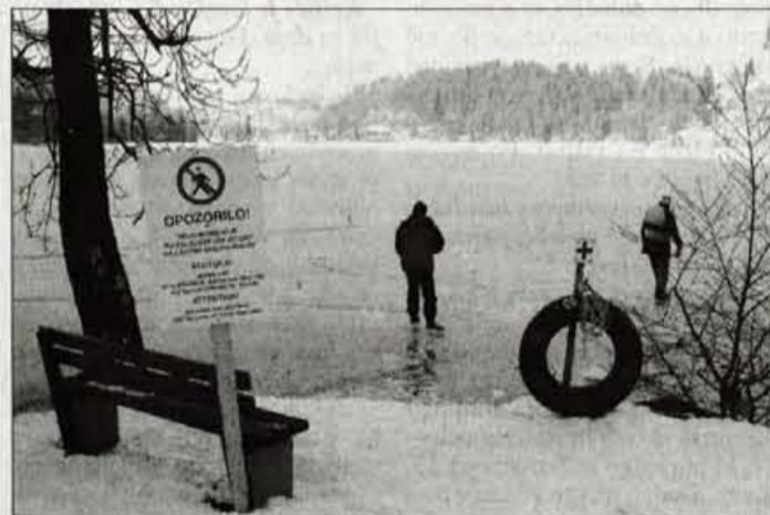
Kljub opozorilu in reševalni zračnici drsalc. Izzivajo nesrečo.