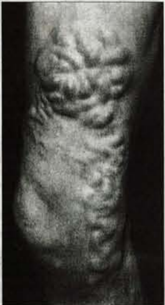
Primer zelo razširjenih krčnih žil.

dojenju izzveni, kar jih ostane, pa jih je treba zdraviti. Krčne žile spadajo med bolezni, pri katerih je med prirojenimi vzroki na pr-