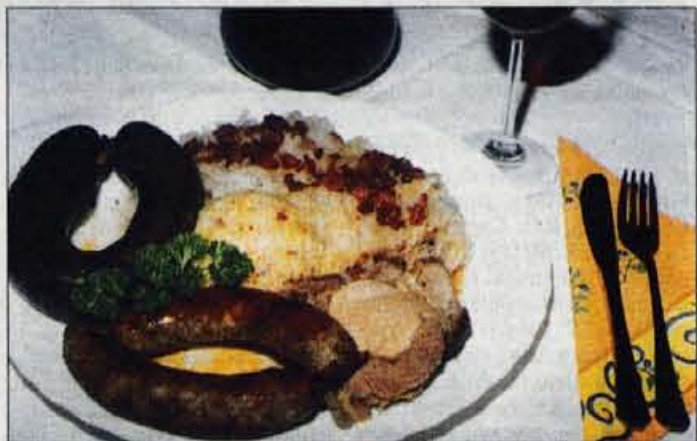
Laborška kmečka pojedina je sestavljena iz pečenice, krvavice, pečenke, dušenega zelja in repe, kupčka praženega krompirja in rezine kruhovega svaljka, vse priloge pa so posute še z domačimi ocvirkami...

Star bel kruh narežemo na kocke, ga prelijemo z mlačnim mlekom. Na maslu in olju prepražimo sesekljano čebulo, malo naribane-ga korenčka (za barvo!) in veliko