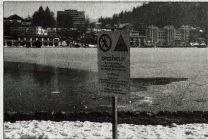
Hoja in drsanje po jezeru sta nevarna!

pa je pri reševanju iz zaledenega blejskega jezera sodeloval tudi helikopter. "Zadnja smrtna žrtev zaradi utopitve v zaledenem jezeru je bila pred petimi leti. Ljud-