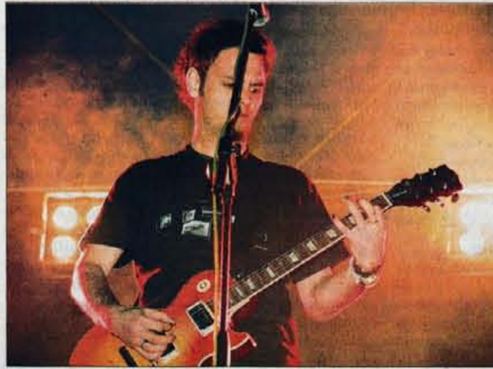
Zvezde večera so bili Siddharta.