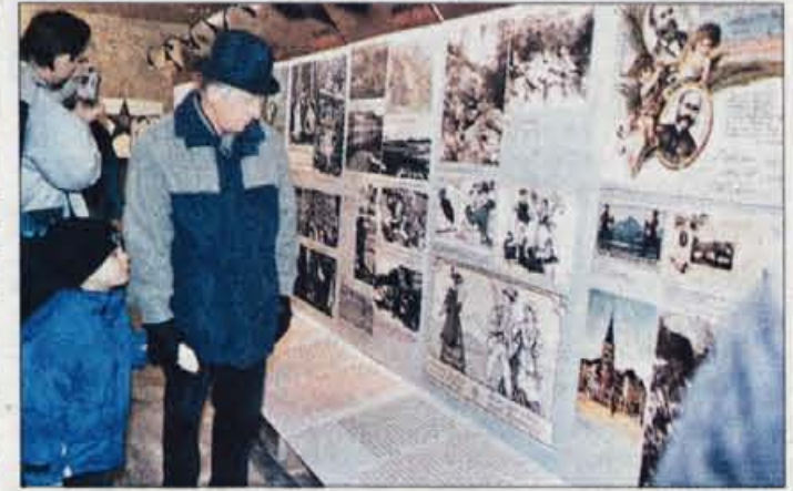
Dva različna pogleda?

razstava bo tudi na Gorenjskem doživela nemalo polemik, zagotovo tudi s strani Zveze združenj borcev. Nekaj mnenj je bilo soočeni že na okrogli mizi pred odprtjem razstave. Mnogi bodo kot provokacijo razumeli tudi znak, v katerem ob gledanju nanj iz različnih zornih kotov rdečo zvezdo prekrije kljukasti križ,