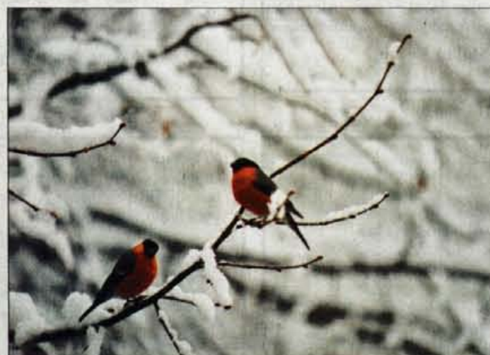
Lepa kalinčka. Pojeta tudi v mestih.

zapise, ki so nastali na Slovenskem, le pri taščini penici je uporabil posnetke s Hrvaškega. Gradivo je posnel z mikrofonom ter digitalnima kasetofonom, posnetki pa so bili obdelani s programom ProTools 5 na računalniku Macintosh G4. Pri tem bistveno ni posegal v posnetke, le pri