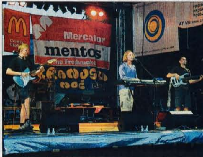
Skupina Hepa - zmagovalci Zlate deke 2002.