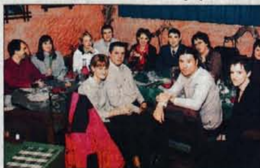
Nagrajenci na večerji v Gostilni Pr' Maticku