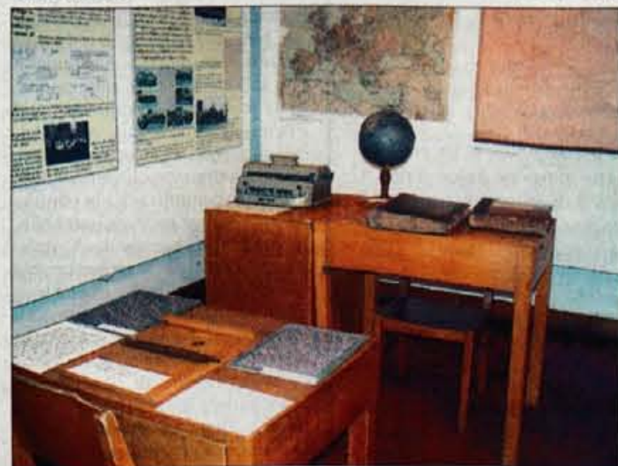
Učilnice so bile včasih skromne, ravno tako pripomočki.