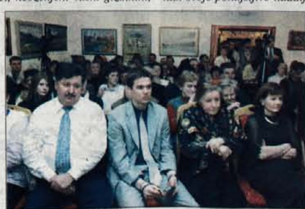
Glasove predice in predilci

po praznikih sv. treh kraljev k predicam ali, kakor se po kranjsko pravi, gre do na prejo. Pripelejo tudi godce s seboj in vsakdo se usede k svoji, ki mu tiči v obeh in srcu. Medtem pa, ko se ti gorenjski Alexes in Tityri /imena pastirjev v Vergilovih Eklogah/ svojim Amari-lam /ime Vergilove pastirice, pesniško ime za mlado kmeti-