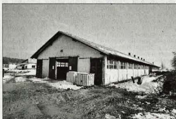
Tri desetletja in pol stari hlev bodo podri.

Zasnova objekta šole, ki jo je pripravil kranjski arhitekt Franci Nadižar, je v tlorisni obliki črke U z neenakimi krakoma. V njej bo prostora za 26 oddelkov oziroma za 650 dijakov in 70 zaposlenih. Obsegala bo klet, pritličje, 1. nadstropje, delno pa tudi 2. nadstropje. V njej bo na neto površini 5.500 kvadratnih metrov sedemnajst učilnic za teoretični pouk in štirinajst delavnic za praktični pouk, laboratoriji za živilstvo, kmetijstvo, kemijo, mikrobiologijo, večnamenski prostor z jedilnico, kuhinja, knjižnica, multimedijška učilnica, predavalnica ter spremljajoči in upravni prostori. Stroški gradnje in opre-