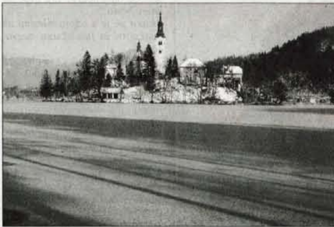
Varljiv videz - do otoka po ledu še ni varno.

Pri tovrstnem reševanju reševalni čoln zaradi varnosti vedno priveržejo na obrežje, včasih je treba led sproti razbijati, pred tremi leti