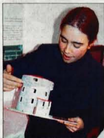
Preden so šli na izlet, so si najprej s prsti ogledali maketo stavb, ki so si jih nameravali ogledati.

Sodobni pripomočki so v glavnem narejeni iz plastike z vakuumsko vtisnjenimi reliefnimi stvarmi kot na primer različni atlasi, tipne slike, ki slepi in slabovidnim razložijo različne podobe sveta: na primer, kako črv leze po listu, kraško polje s ponikalnicami, kroženje planetov okrog zemlje, pristanišče, zemljevid sveta. Elektronska lupa povečuje