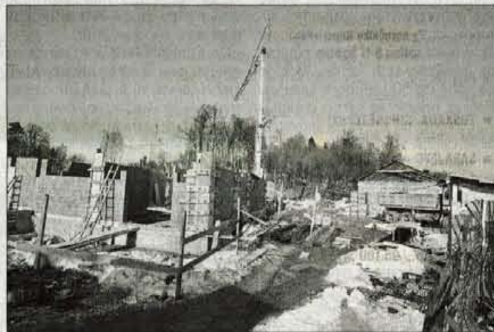
Obrisih novih gospodarskih poslopij so že vidni.