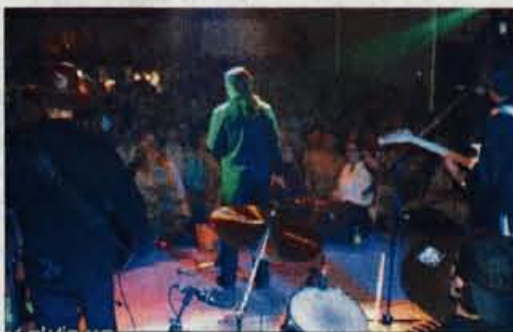
Romantični Goran Karan s svojo publiko.

Na dan zaljubljenih, v petek 14. februarja 2003, se je zgodil Megasrčkov valentinov ples, na katerem je nastopil dalmatinski romantik Goran Karan. Koncerta se je udeležilo mnogo zaljubljenecv vseh generacij, tako starih, kot mladih. Po koncertu pa so se trije srečni pari udeležili romantične večerje z Goranom Karanom v gostilni Pr' Maticku.