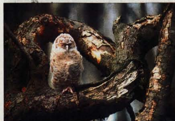
"Individualna" lesna sova.

Katja Dolenc